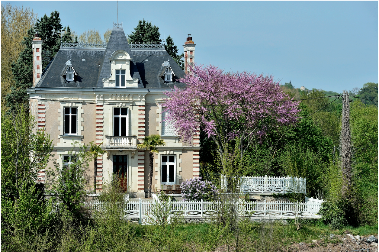
Vue depuis le sud.