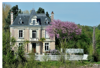
Vue depuis le sud. IVR52_20174901293NUCA