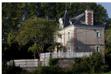
Vue depuis l'est. IVR52_20134901602NUCA