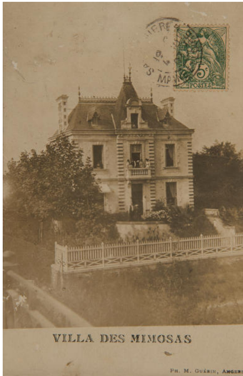
La villa Les Mimosas. Carte postale. 1er quart XXe siècle.