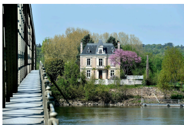
Vue depuis le pont des Lombardières.