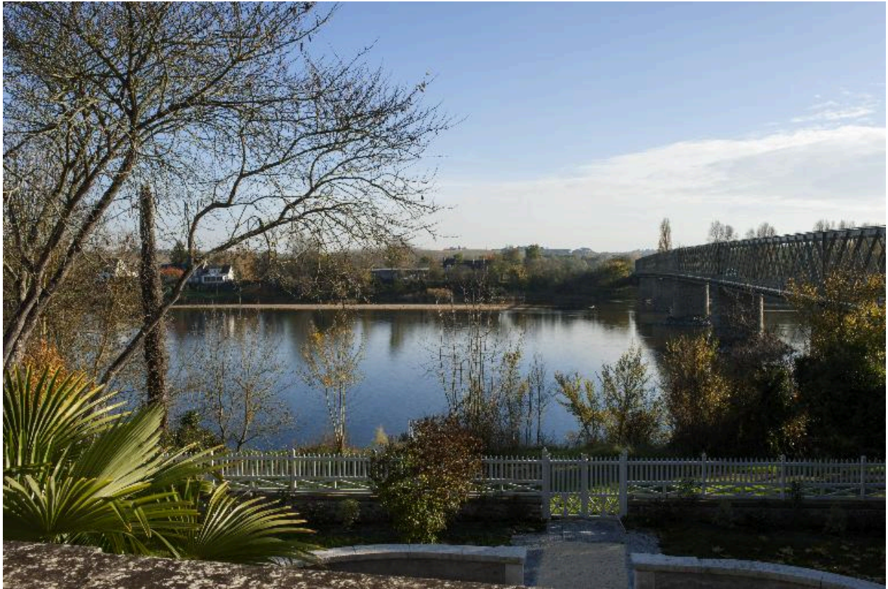
Vue sur la Loire depuis le balcon de l'étage.