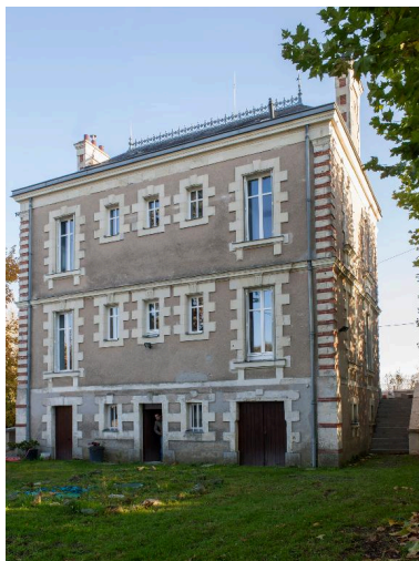
Vue de la façade arrière. IVR52_20174902085NUCA