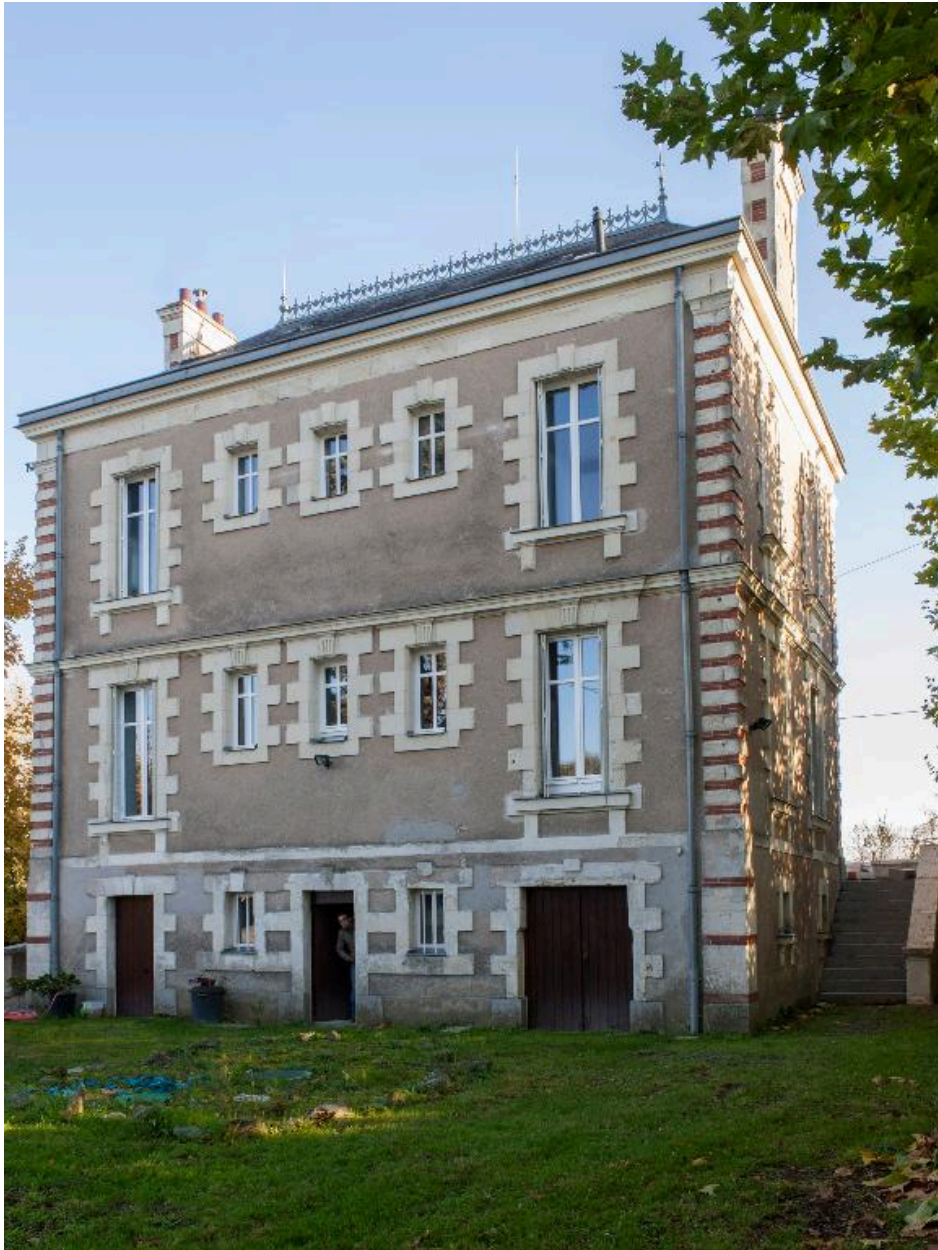
Vue de la façade arrière.