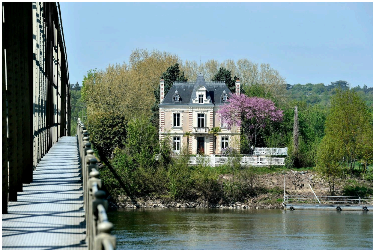
Vue depuis le pont des Lombardières.