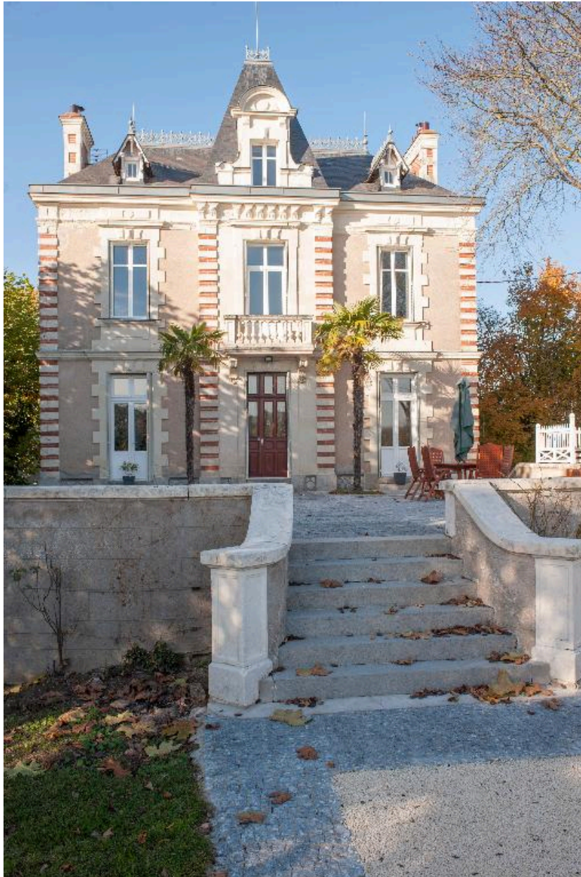
Vue d'ensemble de la façade sur Loire depuis le sud.