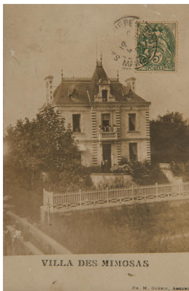
La villa Les Mimosas. Carte postale. 1er quart XXe siècle.