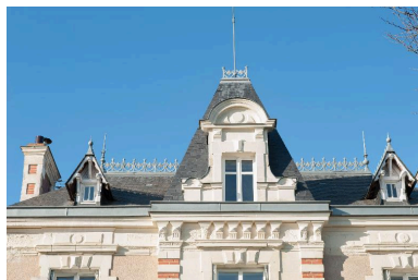
Détail de la lucarne, couverte d'un fronton en plein-cintre, et encadrée par deux lucarnes plus petites à fermes débordantes.