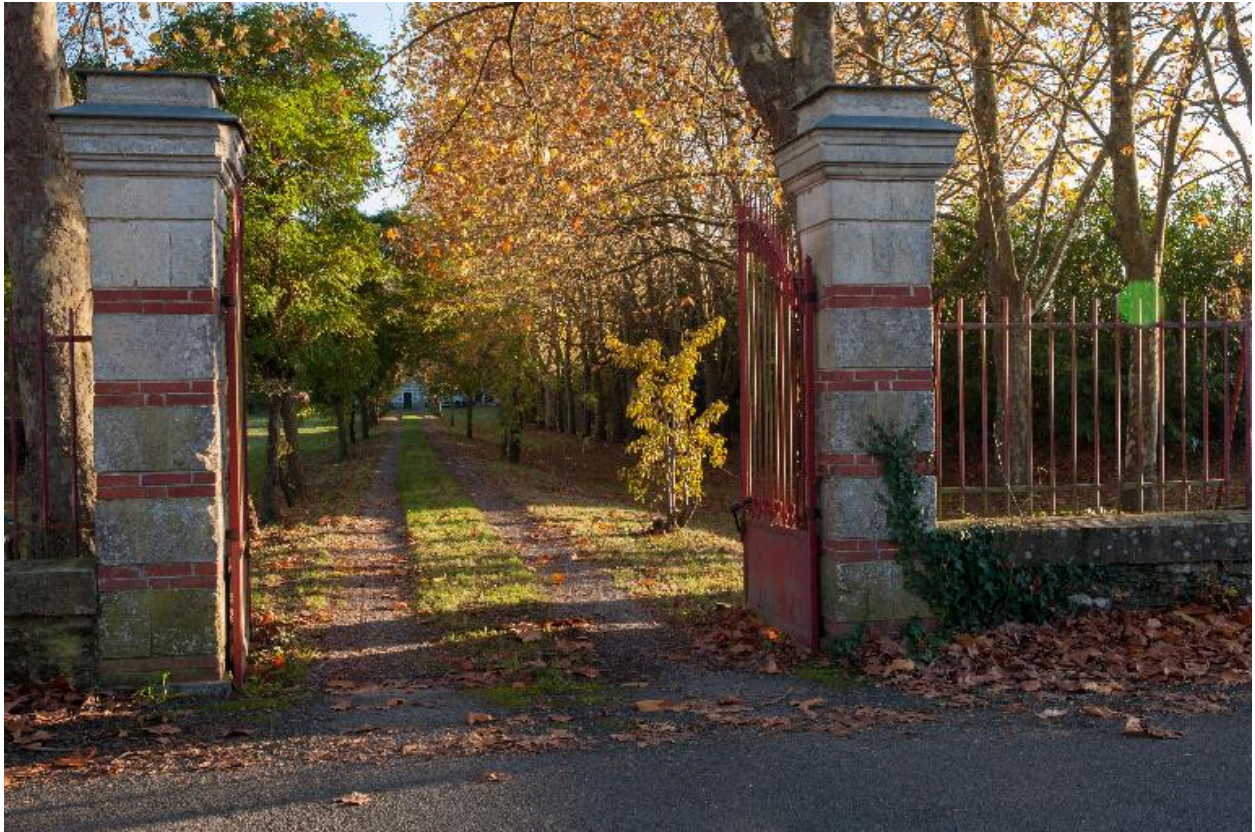
Vue du portail d'entrée et de l'allée (côté nord).