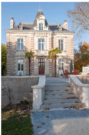
Vue d'ensemble de la façade sur Loire depuis le sud.