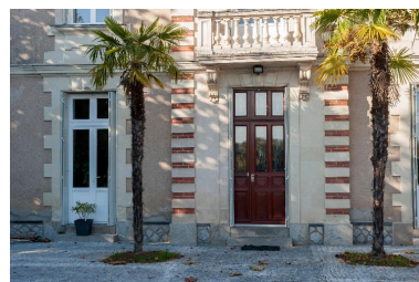
Détail de l'entrée principale.