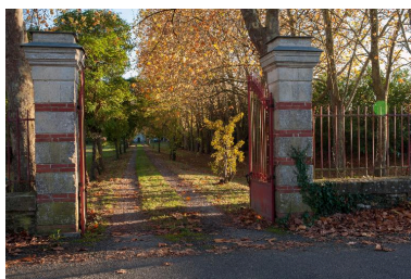
Vue du portail d'entrée et de l'allée (côté nord). IVR52_20174902086NUCA