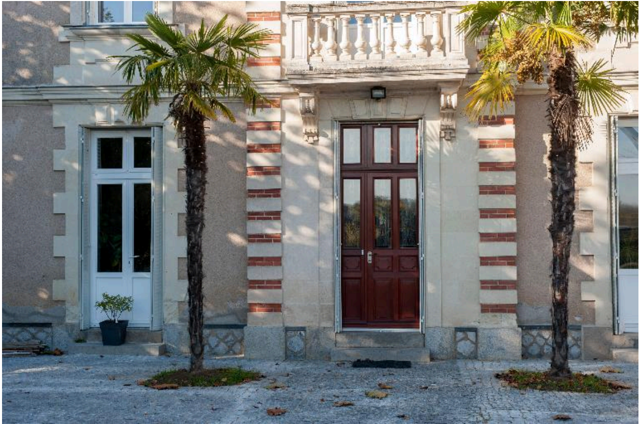
Détail de l'entrée principale.