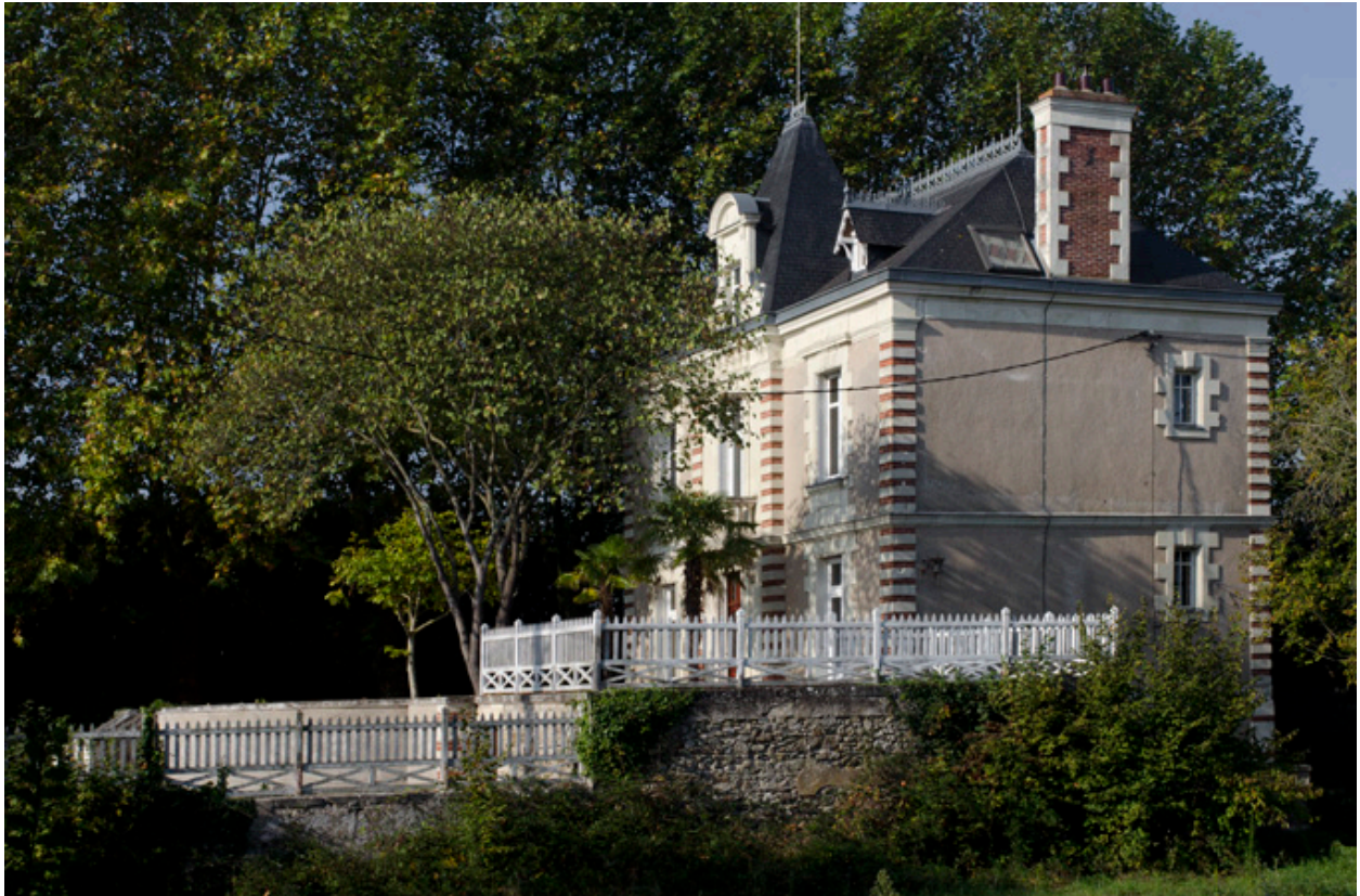
Vue depuis l'est.