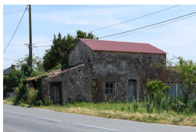
Le Dodineau. Vue d'ensemble de la ferme n° 2 depuis le nord-ouest.