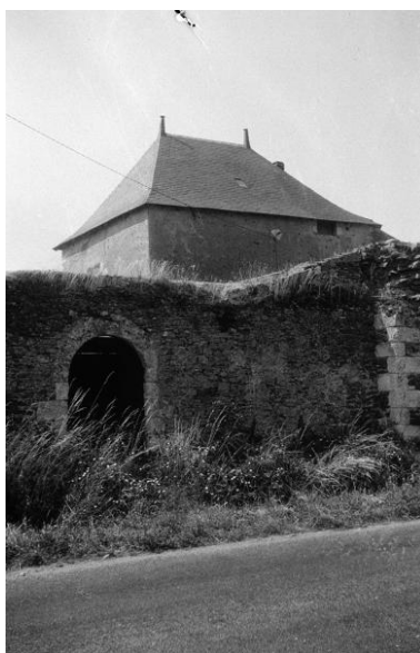
Le Dodineau. "Le Logis". Vue d'ensemble depuis la route en 1972.