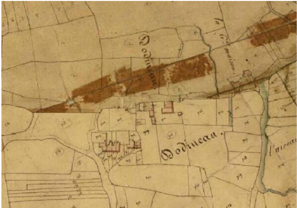
L'écart de Dodineau. Extrait du plan cadastral de 1827, assemblage des sections A1 et D (unique). (AD Maine-et-Loire ; 3 P 4 / 212 / 2 et 7).