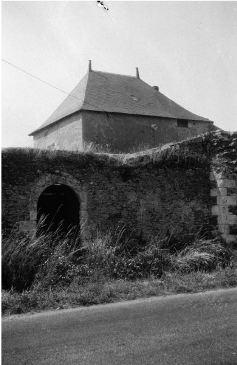
Le Dodineau. "Le Logis". Vue d'ensemble depuis la route en 1972.