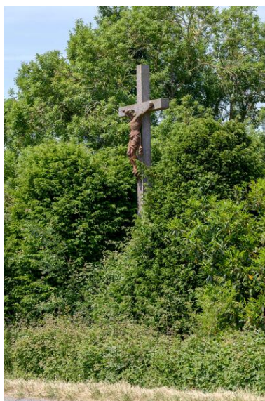
Vue de la croix de Dodineau.