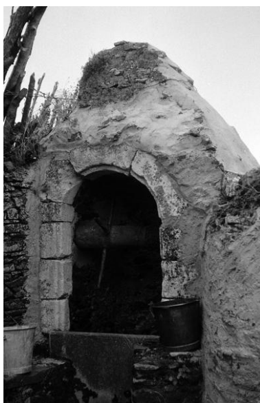
Le Dodineau. "Le Logis". Détail du puits en 1972. IVR52_19724900582Z