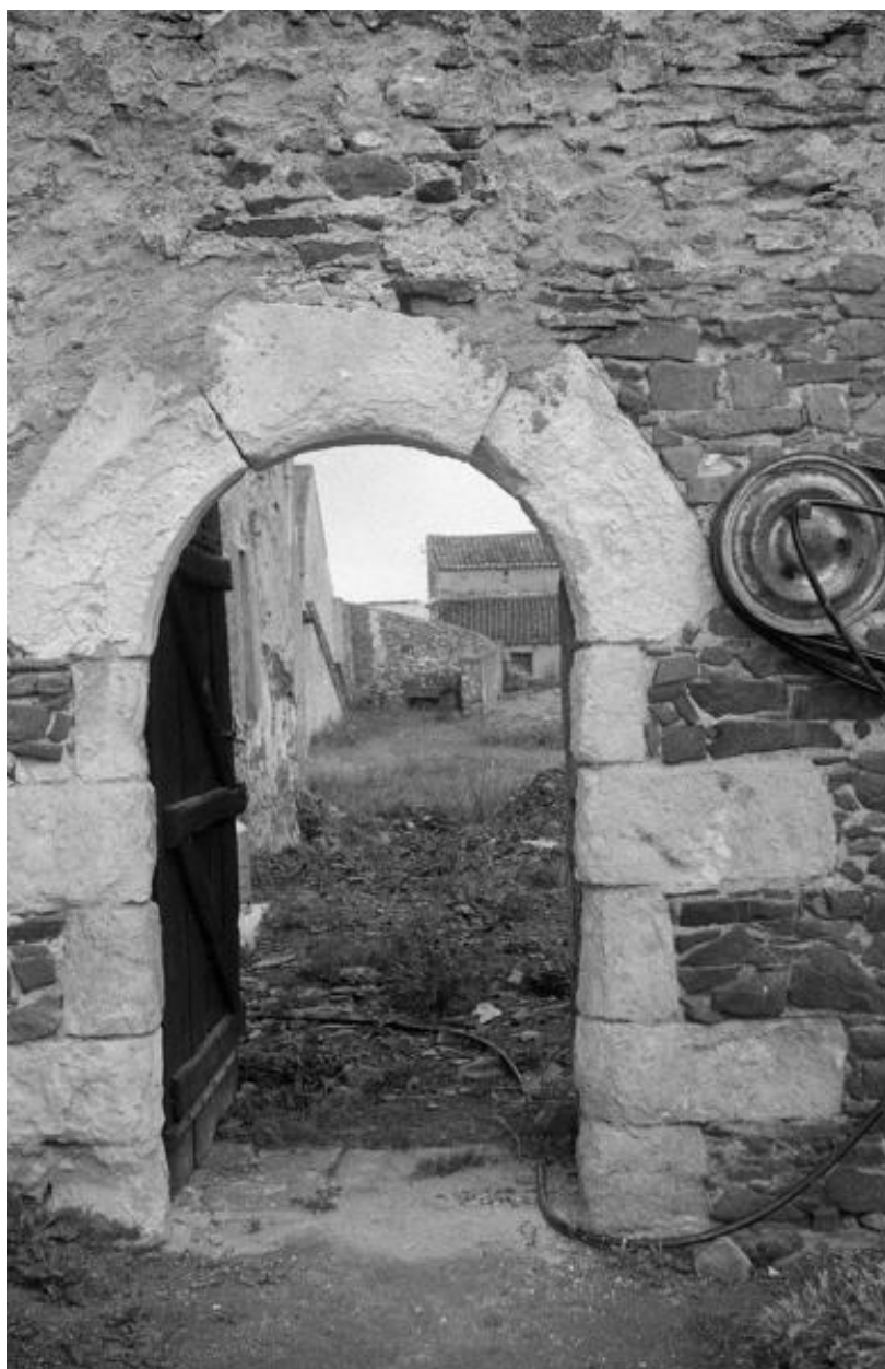
Le Dodineau. "Le Logis". Détail de la porte d'entrée en 1972.