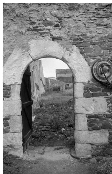
Le Dodineau. "Le Logis". Détail de la porte d'entrée en 1972. IVR52_19724900571Z