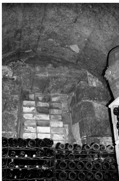
Le Dodineau. "Le Logis". Vue de l'intérieur de l'ancienne chapelle en 1972. IVR52_19724900572Z