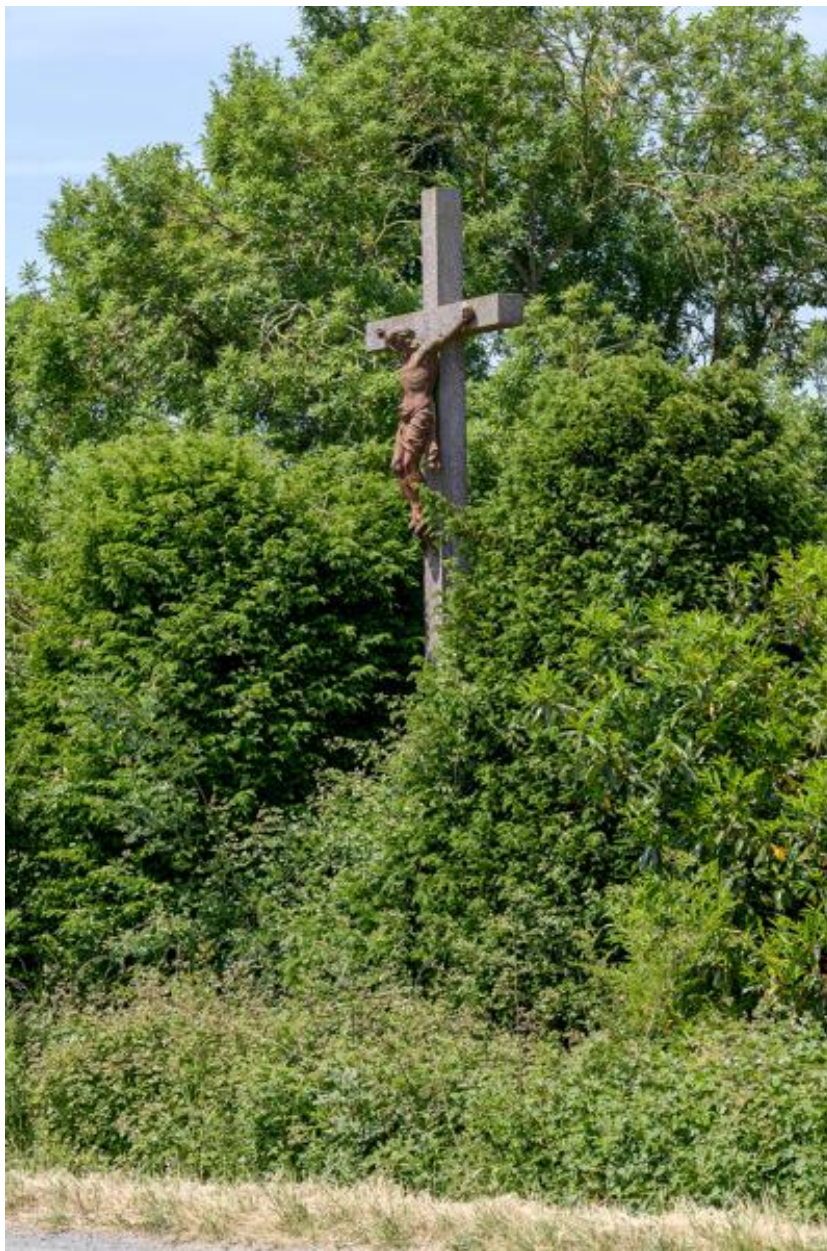
Vue de la croix de Dodineau.