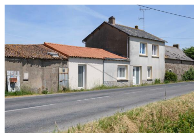
Le Dodineau. Vue d'ensemble de la ferme n° 1 depuis le sud-ouest.