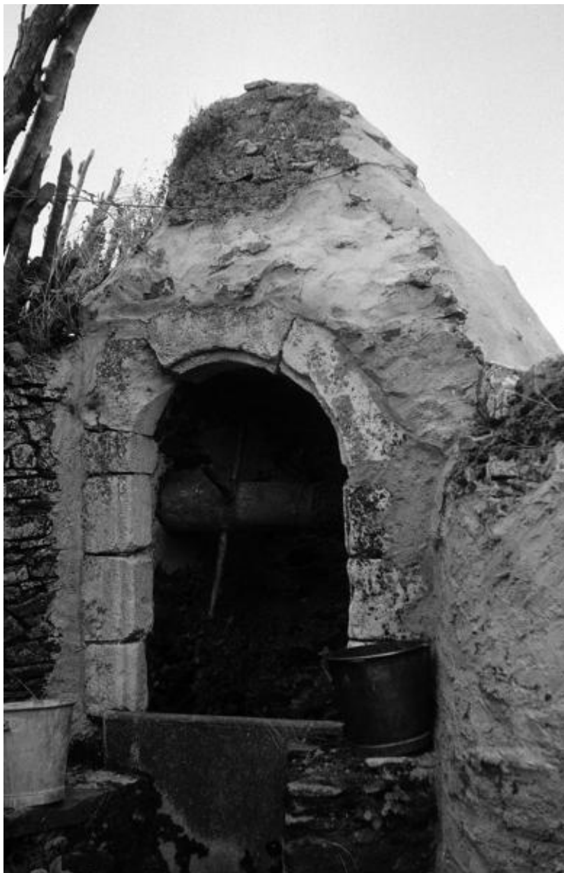
Le Dodineau. "Le Logis". Détail du puits en 1972.