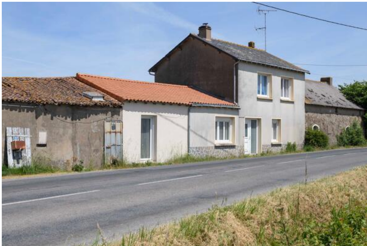
Le Dodineau. Vue d'ensemble de la ferme n° 1 depuis le sud-ouest.