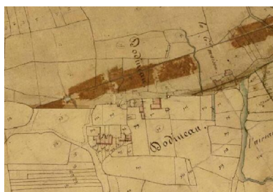
L'écart de Dodineau. Extrait du plan cadastral de 1827, assemblage des sections A1 et D (unique). IVR52_20254900785NUCA