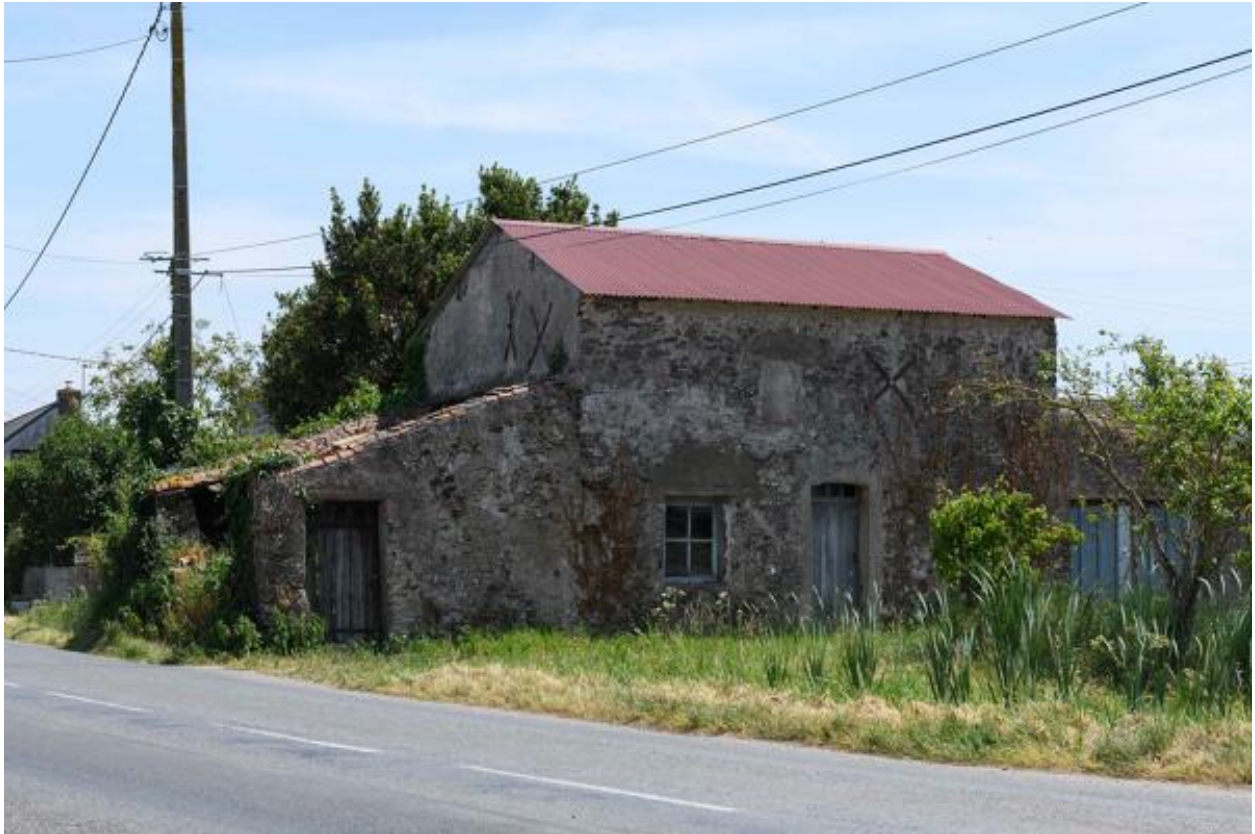
Le Dodineau. Vue d'ensemble de la ferme n° 2 depuis le nord-ouest.