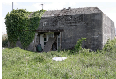
Vue de la casemate n° 4. IVR52_20104401054NUCA