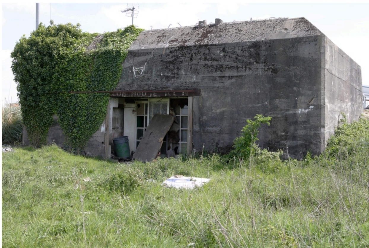
Vue de la casemate n° 4 .