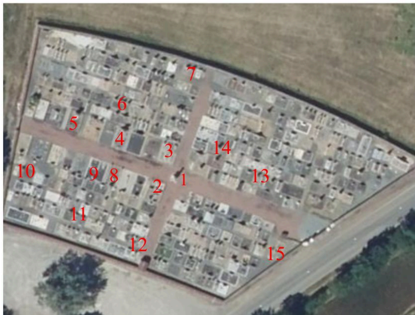
Schéma de répartition des tombeaux relevés dans le cimetière du Mazeau.