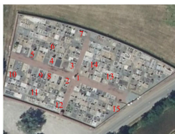
Schéma de répartition des tombeaux relevés dans le cimetière du Mazeau.