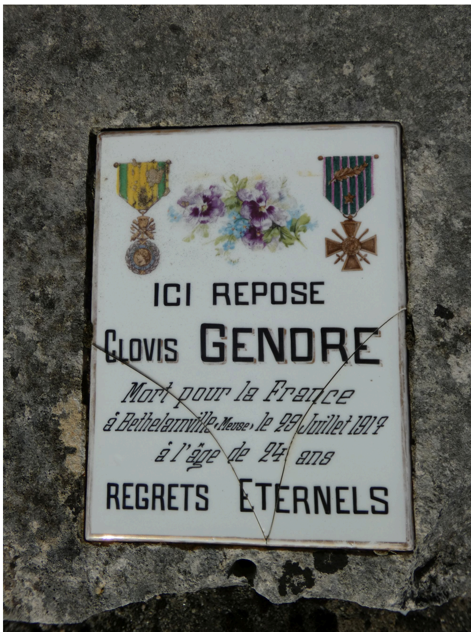
La plaque indiquant l'identité du défunt.