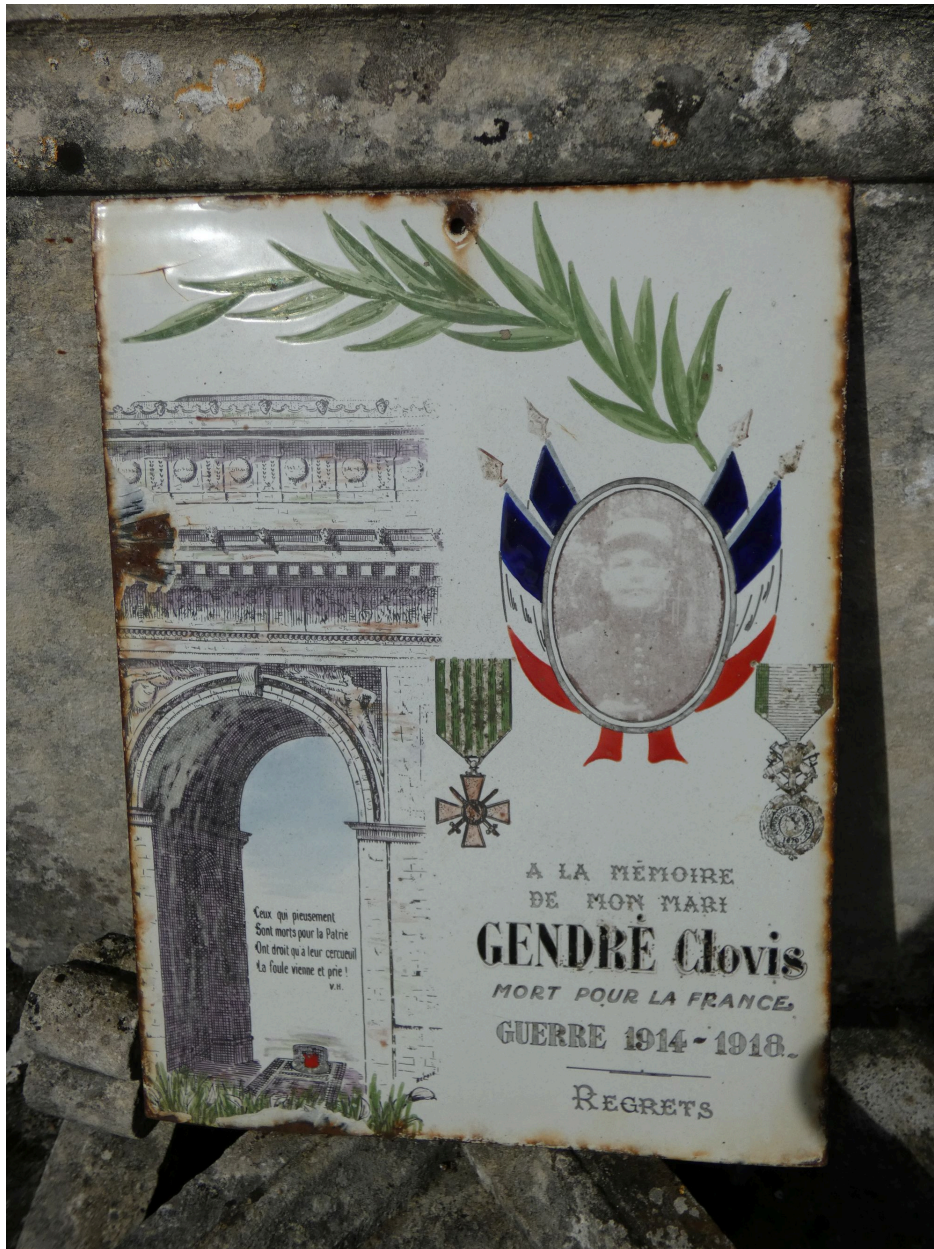
La plaque à la mémoire du soldat.