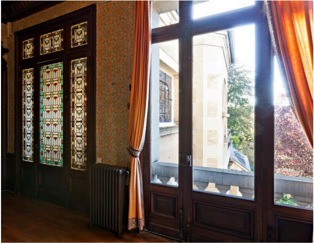
Vue partielle du palier du 1er étage et de l'aile de la maison, avec la verrière décorative de la porte du palier et la verrière de la femme aux roses et aux lys.