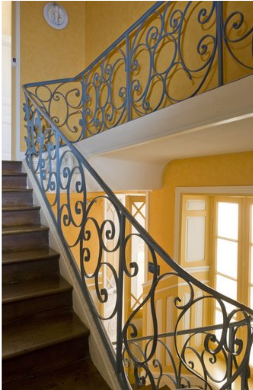
Vue de l'escalier.