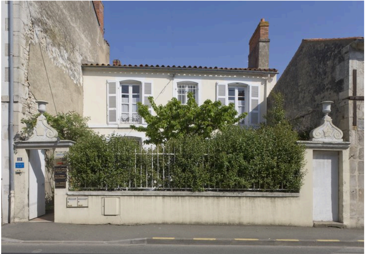
Façade sud, sur cour antérieure.