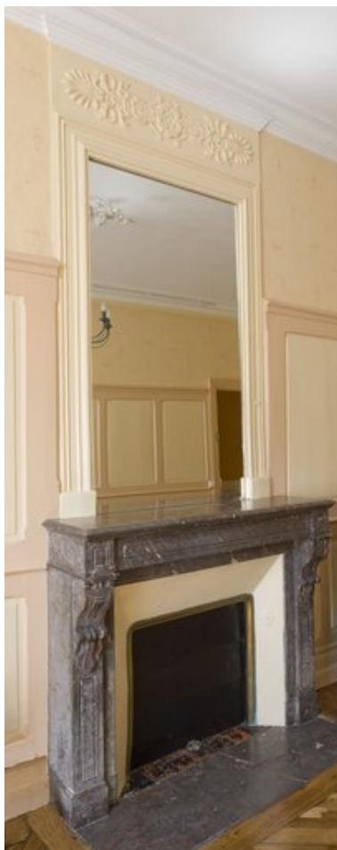
Cheminée de la première moitié du XIXe siècle, au rez-de-chaussée de la maison.