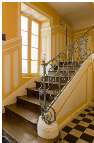
Départ de l'escalier en pierre, à rampe en fer forgé. Les marches, en pierre, ont été recouvertes en bois, du fait de l'usure de la pierre.