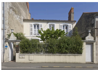
Façade sud, sur cour antérieure. IVR52_20098500198NUCA