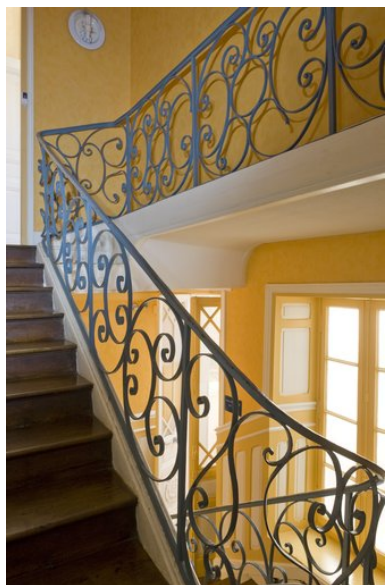
Vue de l'escalier.