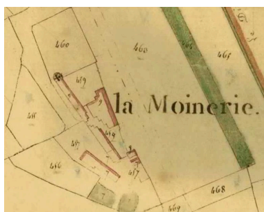
Extrait du plan cadastral de 1818. IVR52_20097202172NUCA