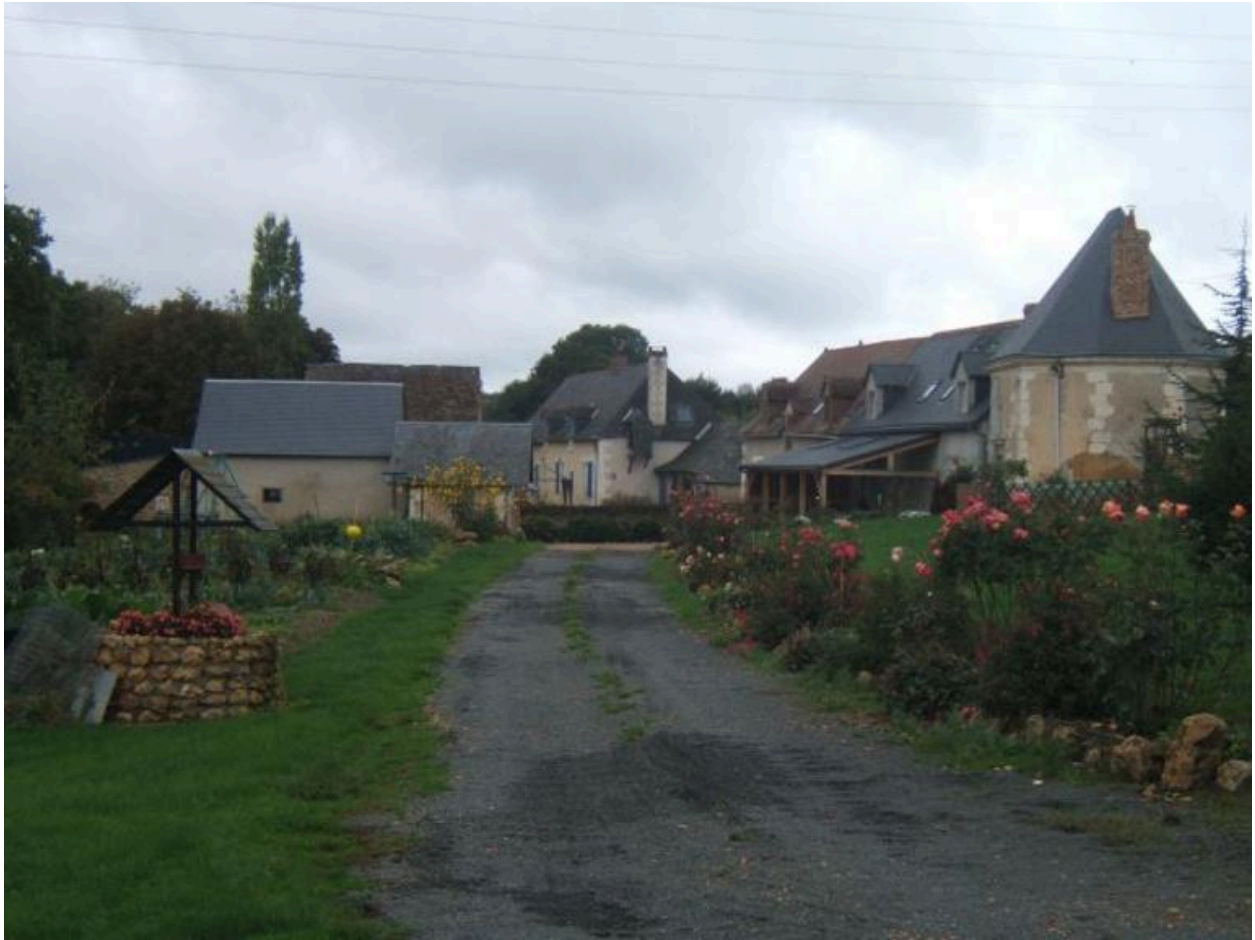
Vue d'ensemble prise depuis l'est.