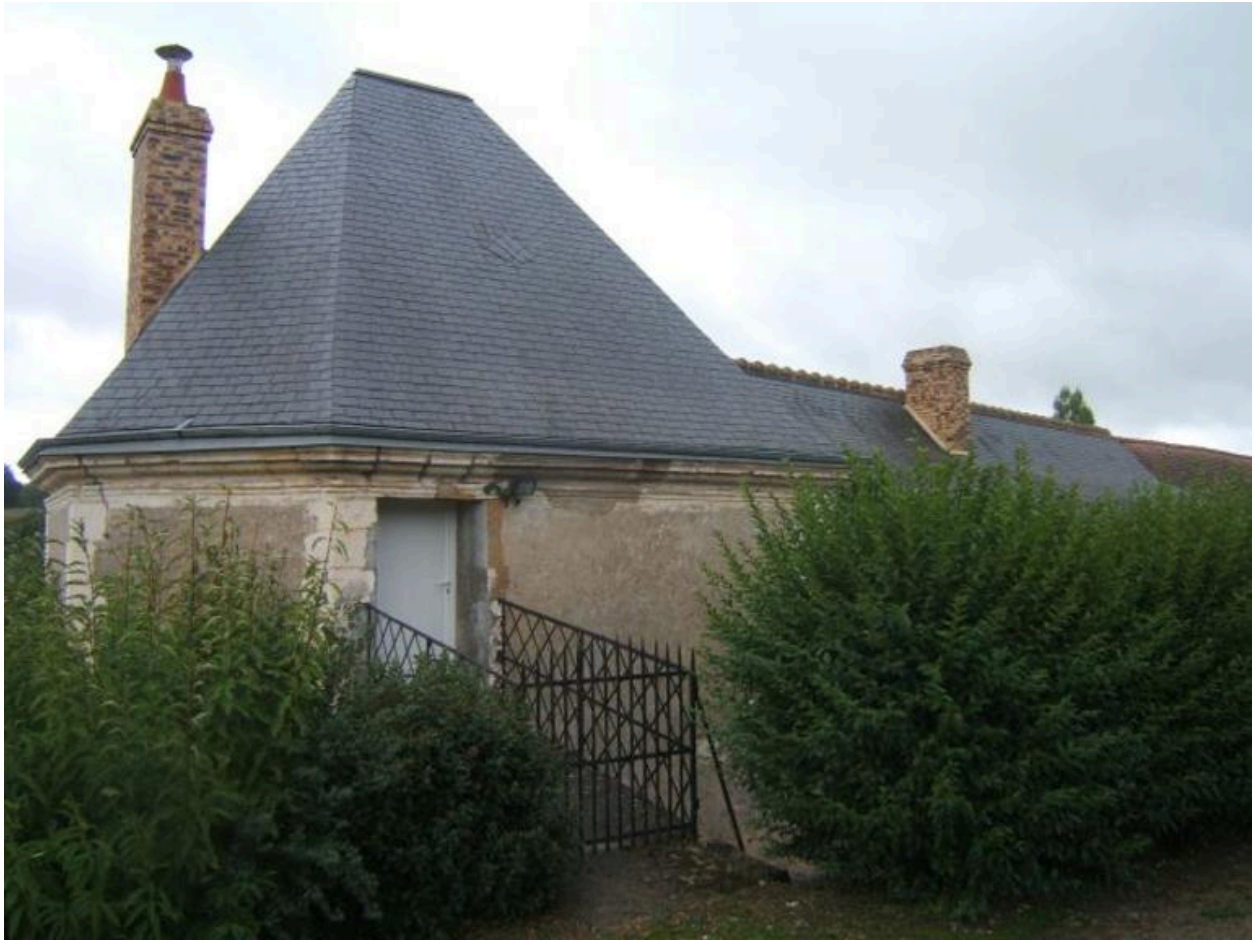
Vue de la chapelle, prise depuis le nord-est.