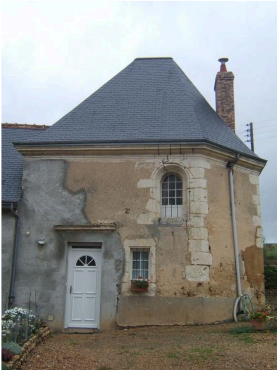
Vue de la chapelle, prise du sud.