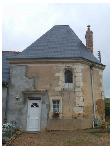
Vue de la chapelle, prise du sud. IVR52_20097202101NUCA