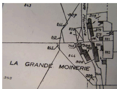
Extrait du plan cadastral de 1982. IVR52_20097202173NUCA