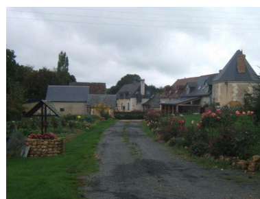
Vue d'ensemble prise depuis l'est. IVR52_20097202103NUCA