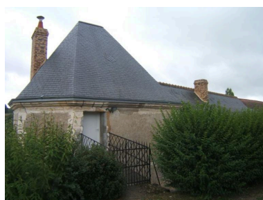
Vue de la chapelle, prise depuis le nord-est. IVR52_20097202102NUCA