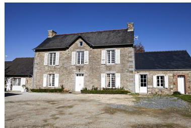
Presbytère de Thuboeuf IVR52_20215301813NUCA