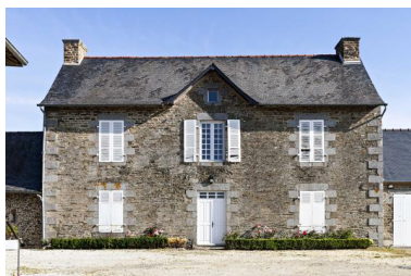
Presbytère de Thuboeuf IVR52_20215301560NUCA