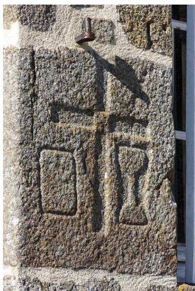
Calice et patène gravés dans une pierre du piédroit de la porte de la sacristie, cour du presbytère IVR52_20215301816NUCA