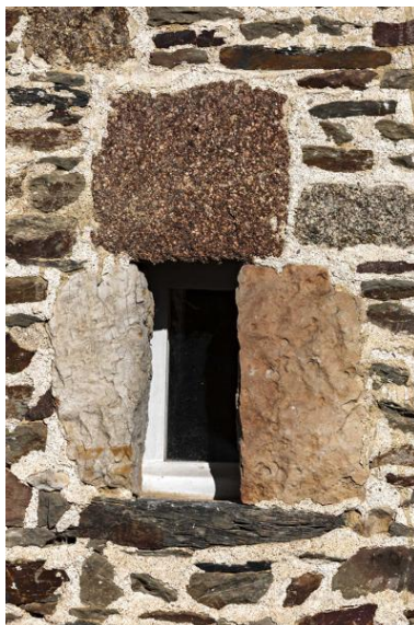
Presbytère de Thuboeuf, fenêtre du cellier IVR52_20215301819NUCA