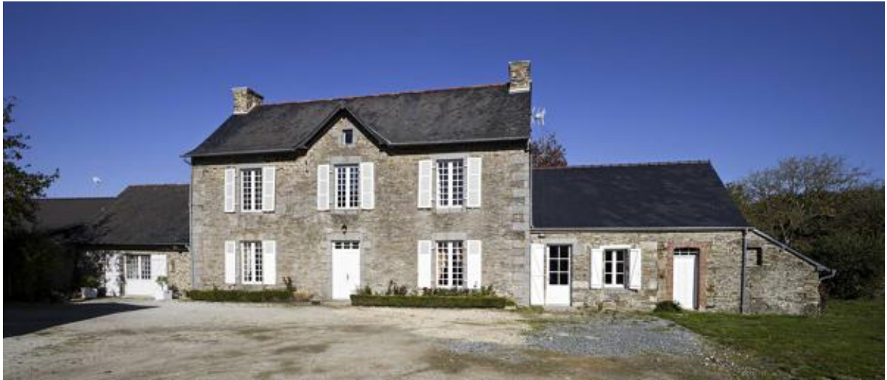
Presbytère de Thuboeuf