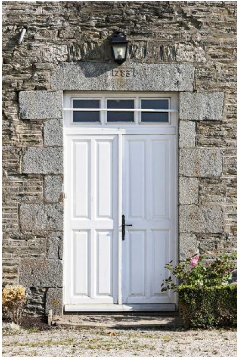
Presbytère de Thuboeuf, porte principale.