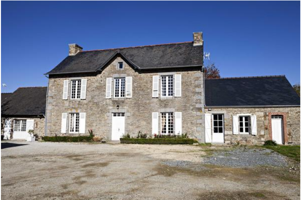
Presbytère de Thuboeuf