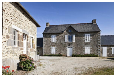
Presbytère de Thuboeuf et accès à la sacristie depuis la cour. IVR52_20215301558NUCA