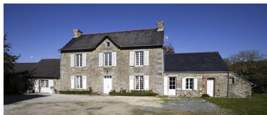
Presbytère de Thuboeuf IVR52_20215301814NUCA