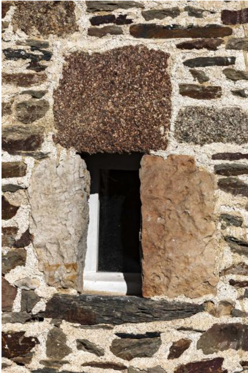
Presbytère de Thuboeuf, fenêtre du cellier