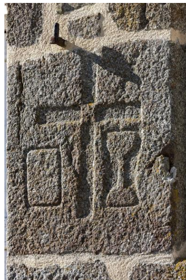
Calice et patène gravés dans une pierre du piédroit de la porte de la sacristie, cour du presbytère