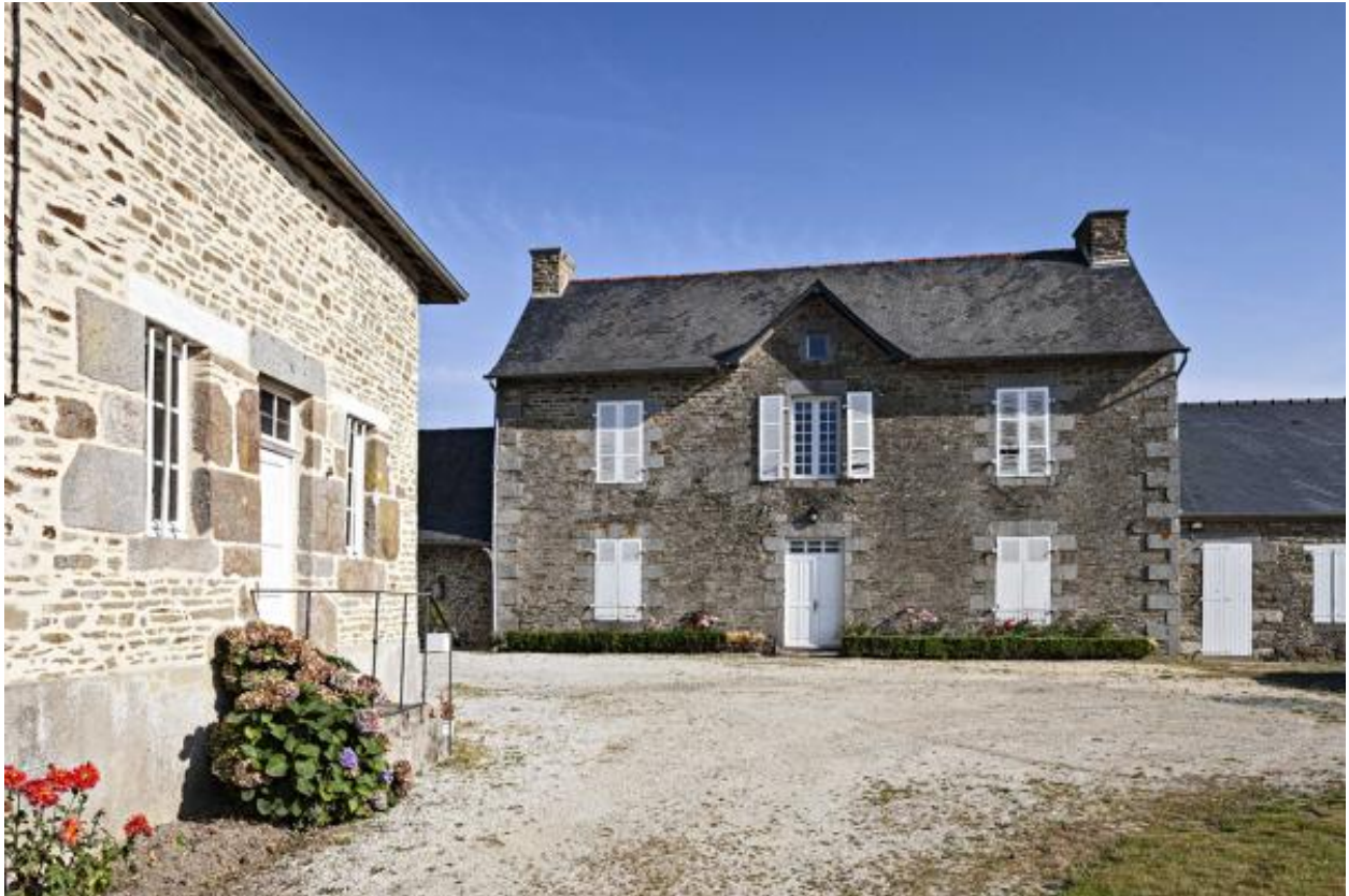
Presbytère de Thuboeuf et accès à la sacristie depuis la cour.