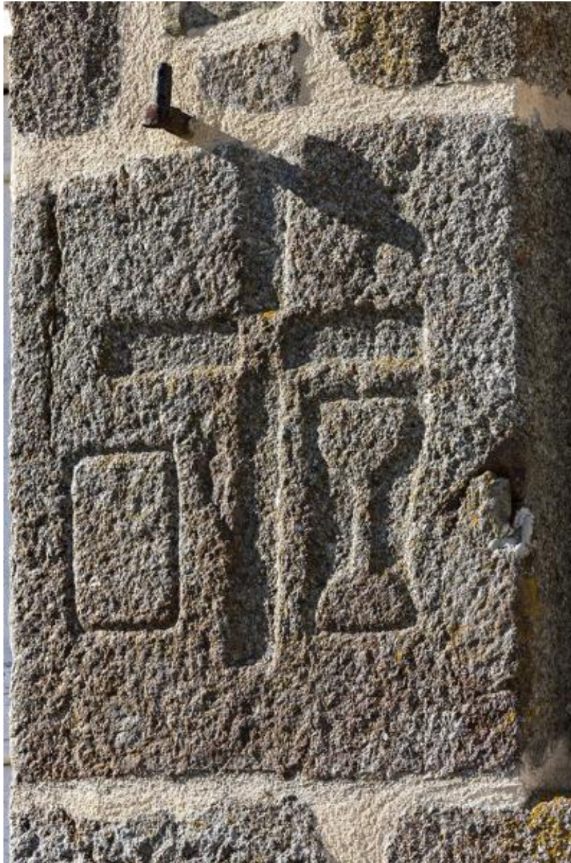
Calice et patène gravés dans une pierre du piédroit de la porte de la sacristie, cour du presbytère