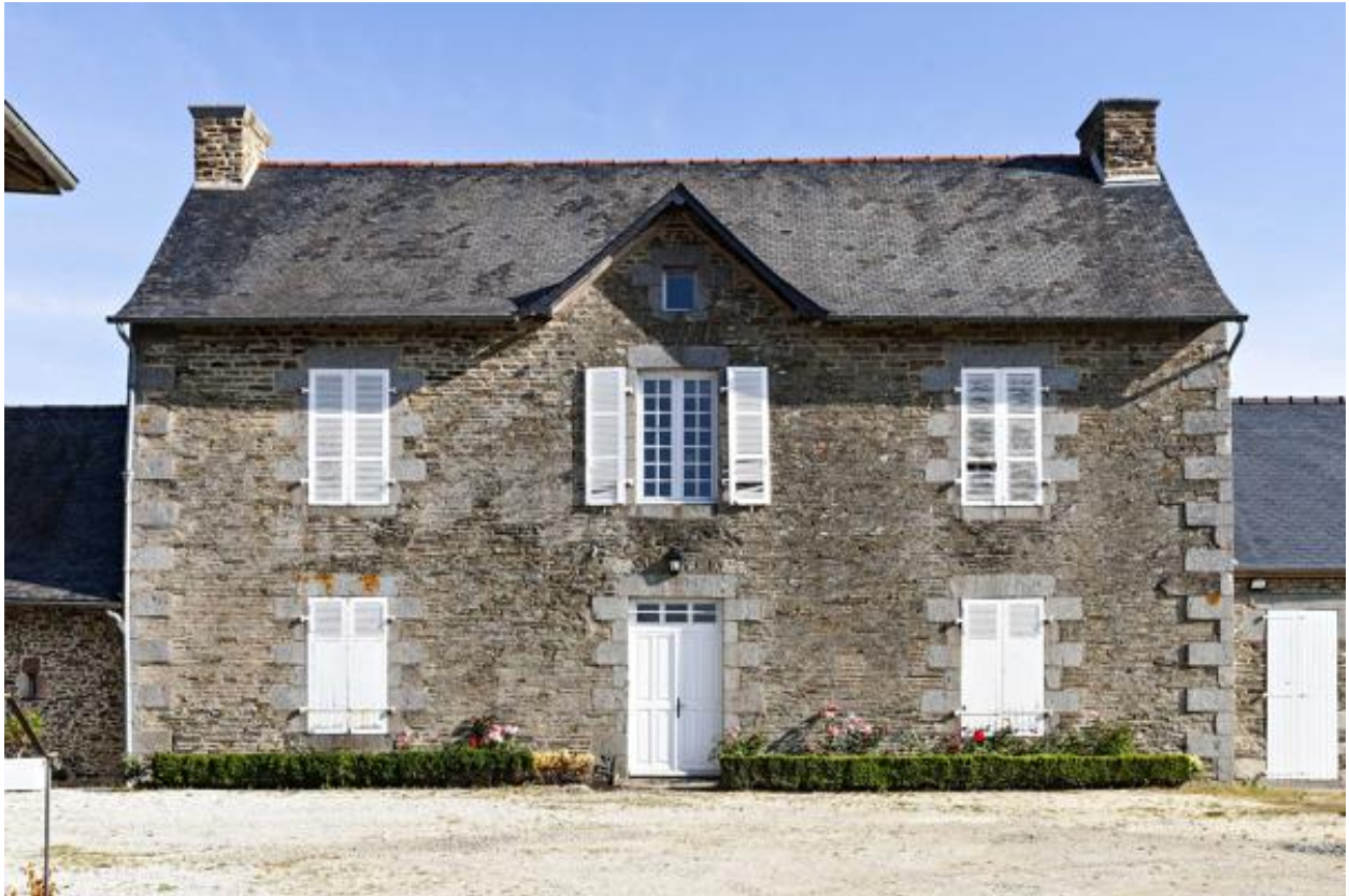
Presbytère de Thuboeuf