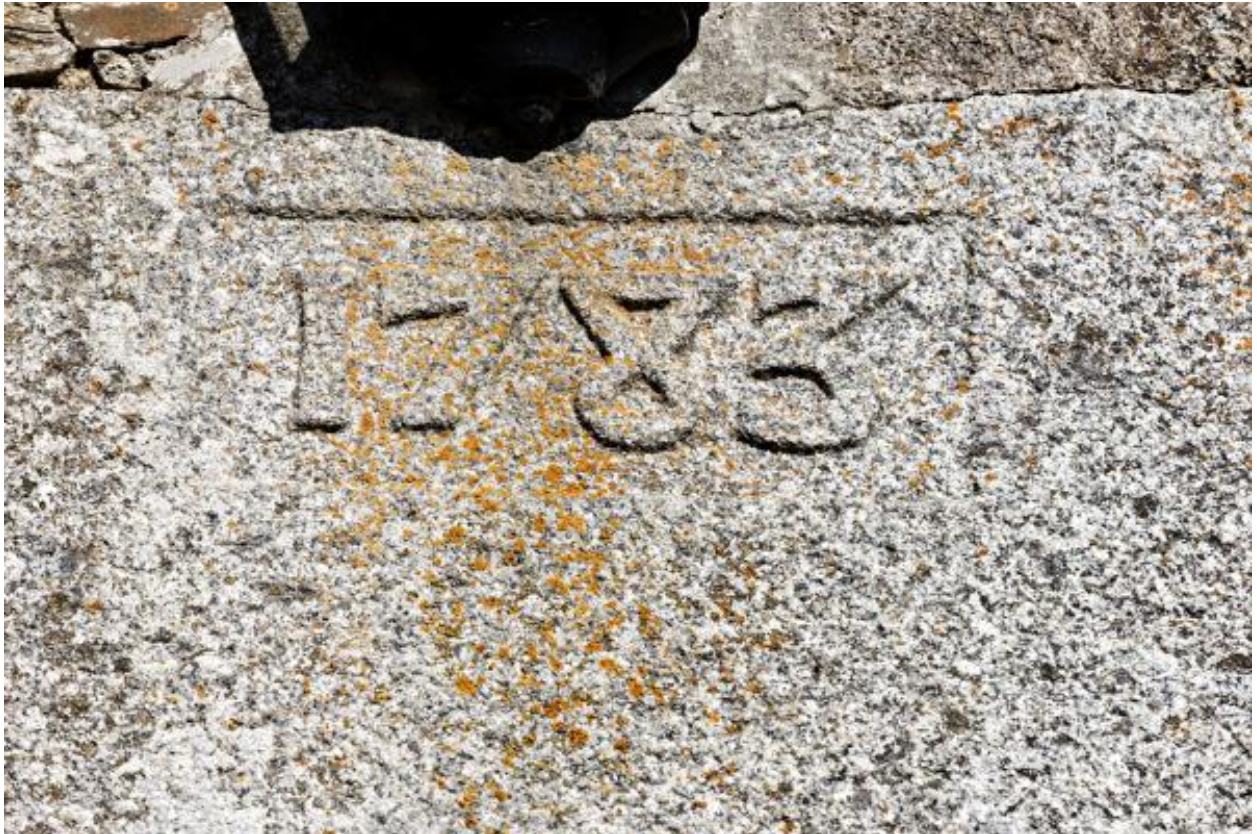
Presbytère de Thuboeuf, date portée sur le linteau de la porte principale