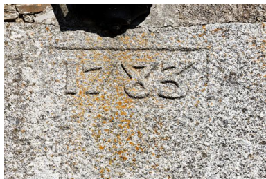
Presbytère de Thuboeuf, date portée sur le linteau de la porte principale IVR52_20215301818NUCA