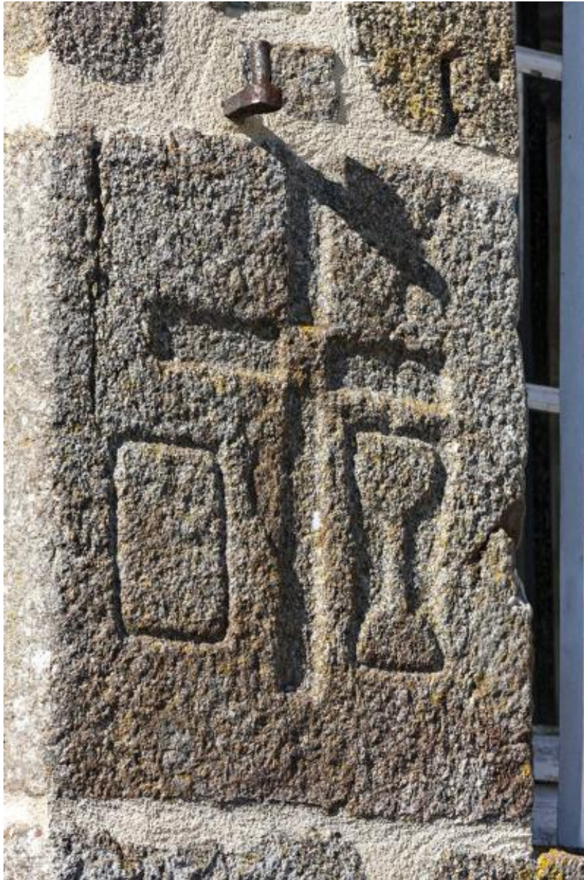
Calice et patène gravés dans une pierre du piédroit de la porte de la sacristie, cour du presbytère