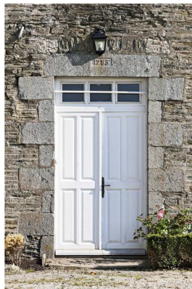
Presbytère de Thuboeuf, porte principale.