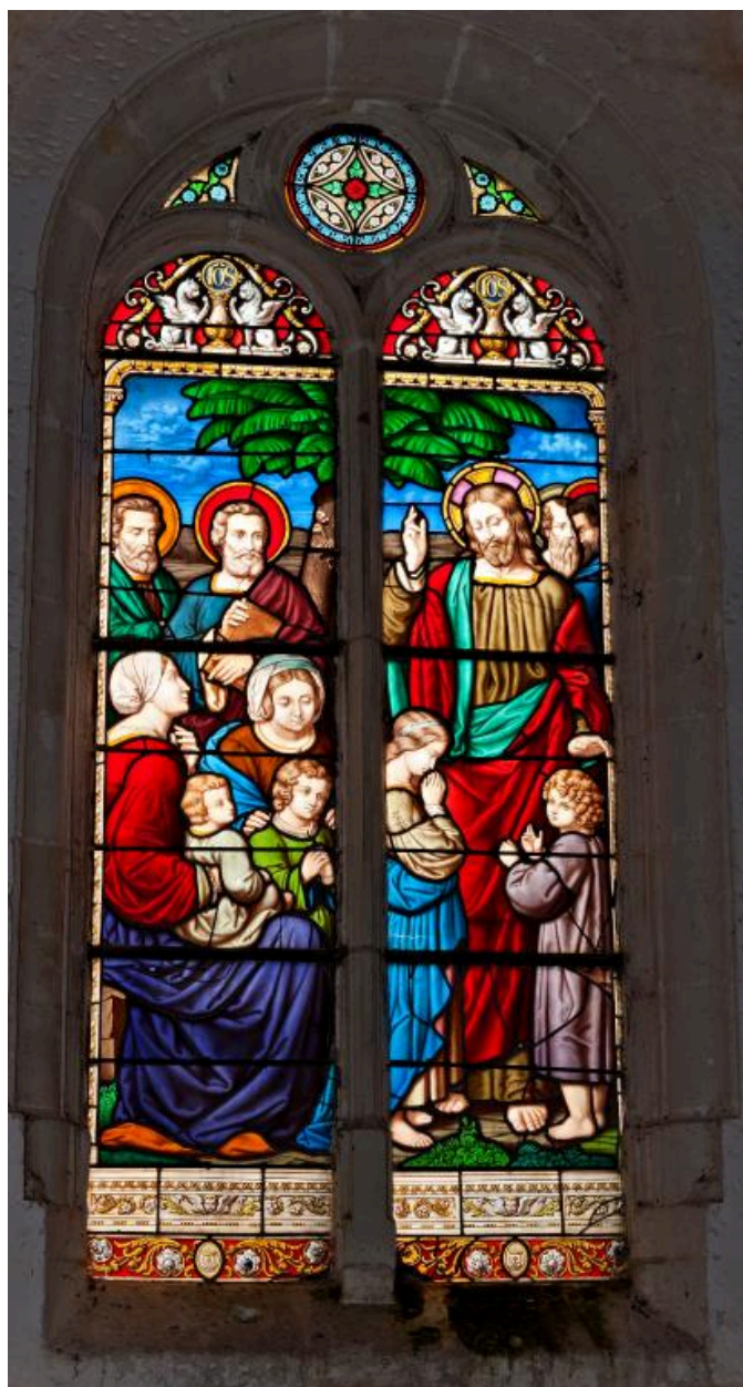
Baie 2 : le Christ laissant venir à lui les petits enfants.