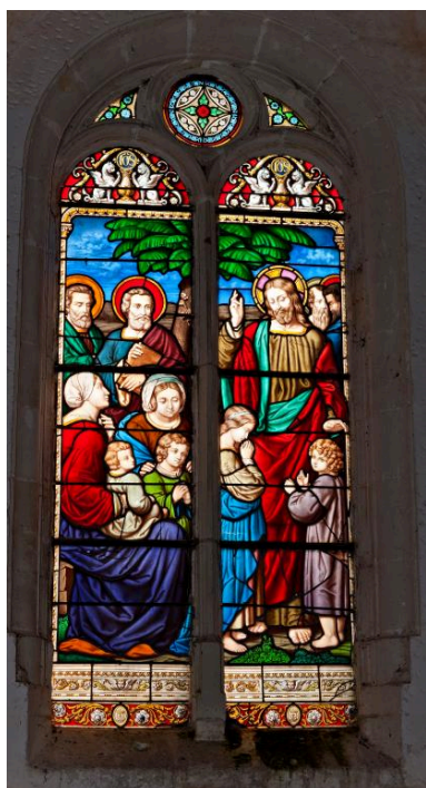
Baie 2 : le Christ laissant venir à lui les petits enfants.