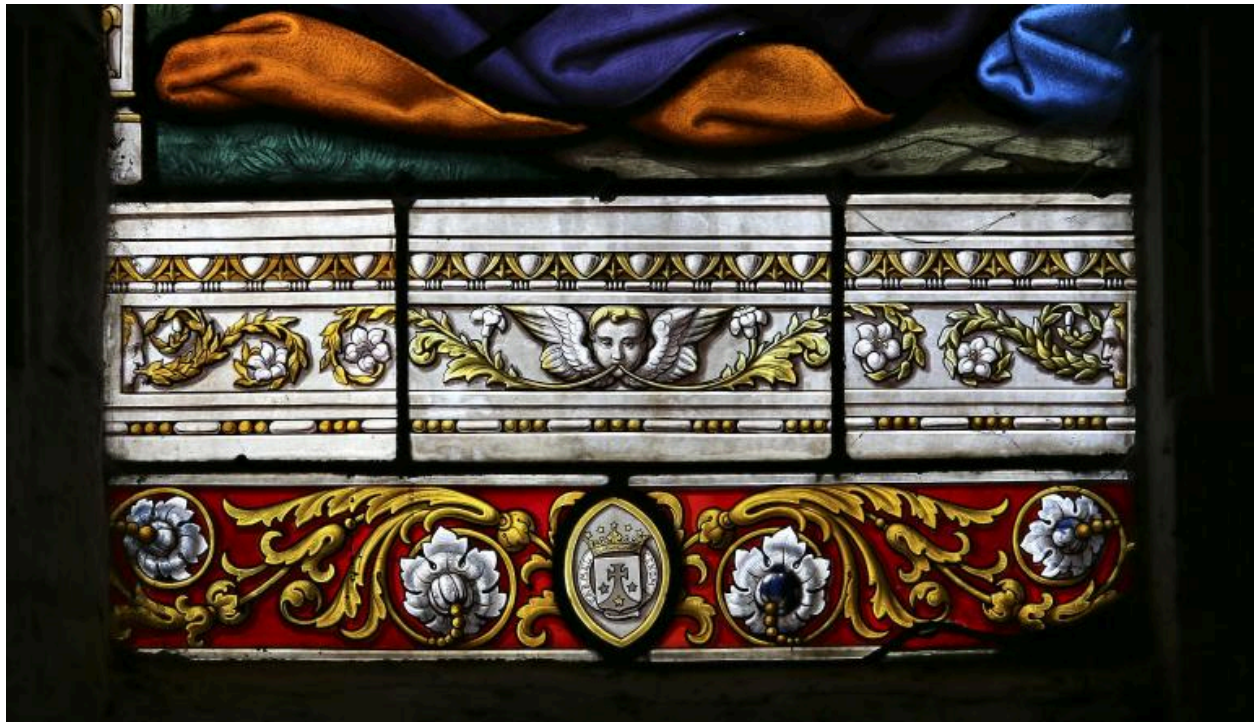
Au bas de la baie 2 : détail de la signature CARMEL CENOM.