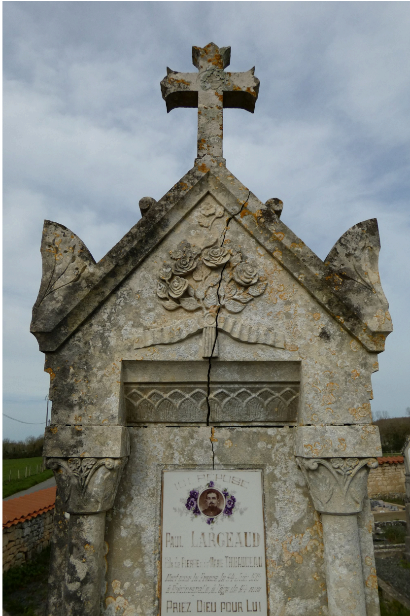
Détail du décor sculpté de la stèle.