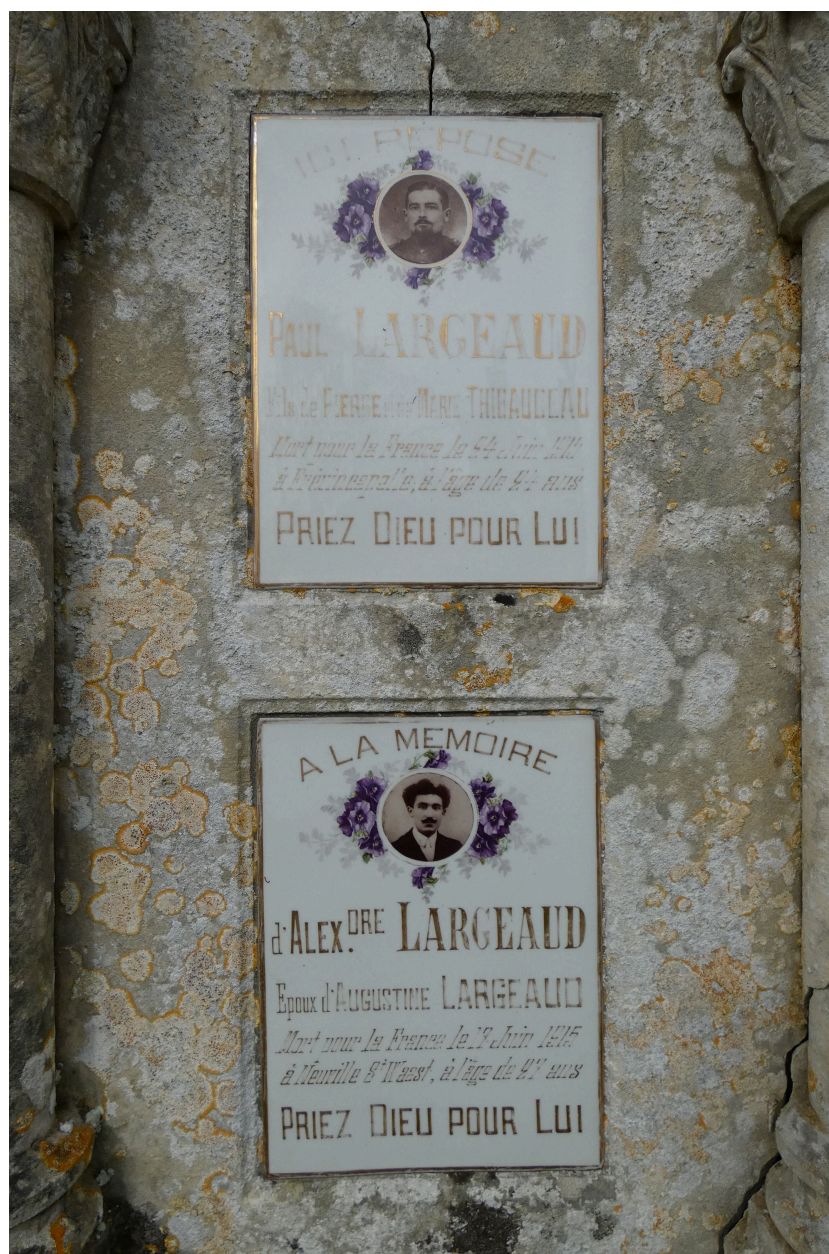
Les plaques portant l'identité des défunts.