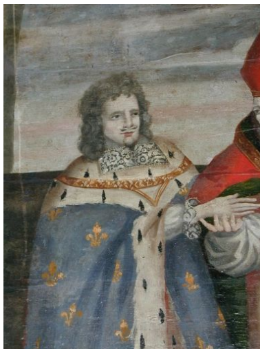
Détail, le duc Jean IV.