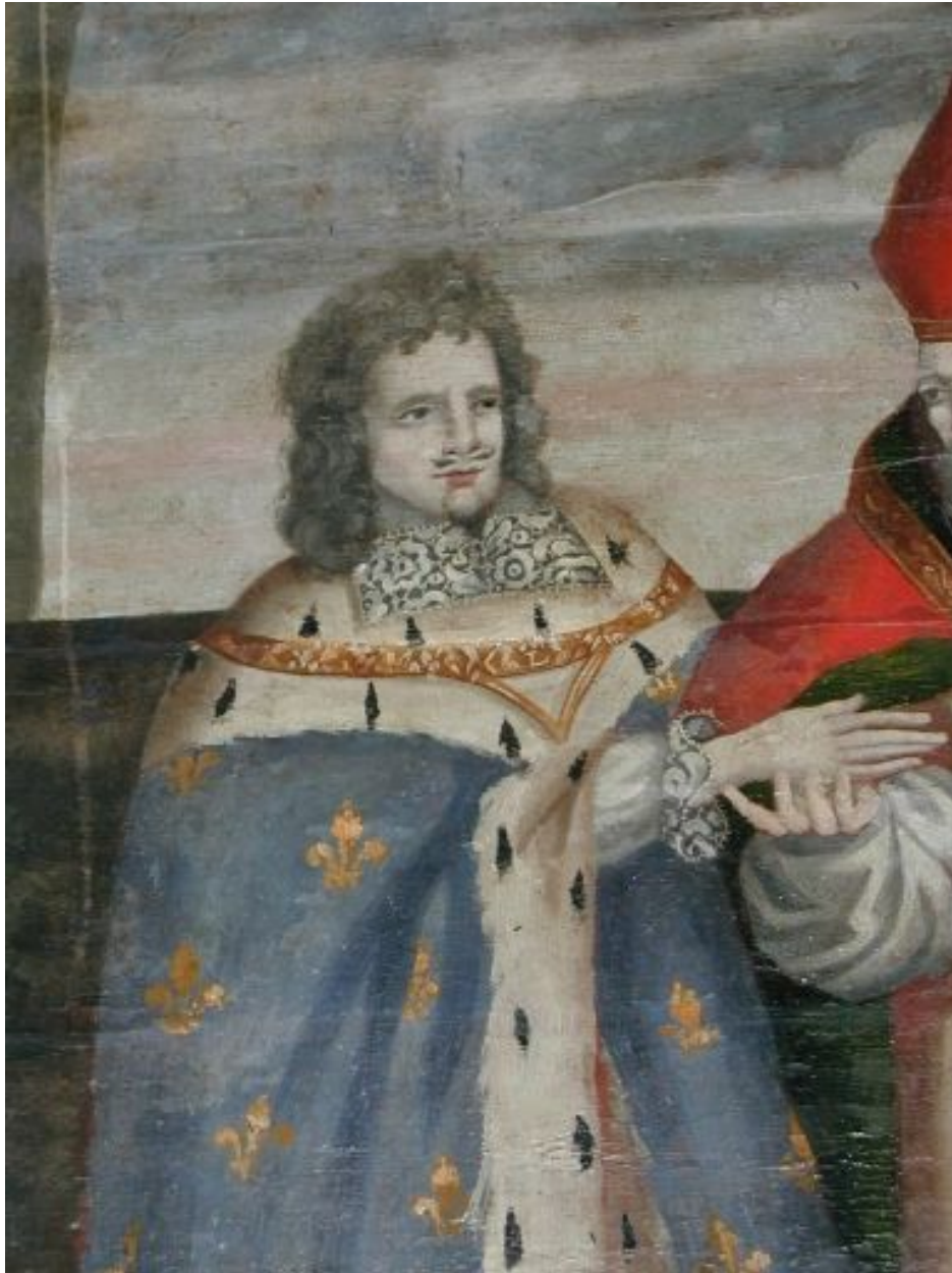
Détail, le duc Jean IV.