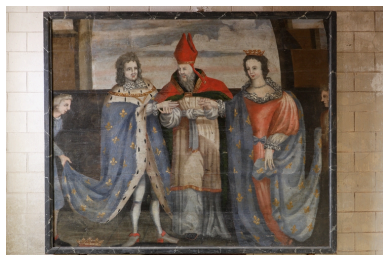
Vue générale. IVR52_20084400321NUCA