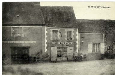
Carte postale, début du XXe siècle. La maison est à gauche.