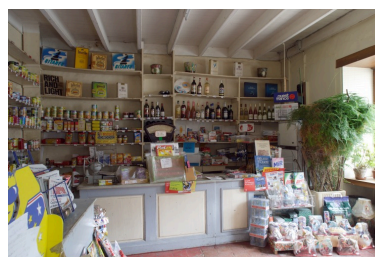
Rez-de-chaussée : la boutique vue depuis le sud. IVR52_20055302130NUCA