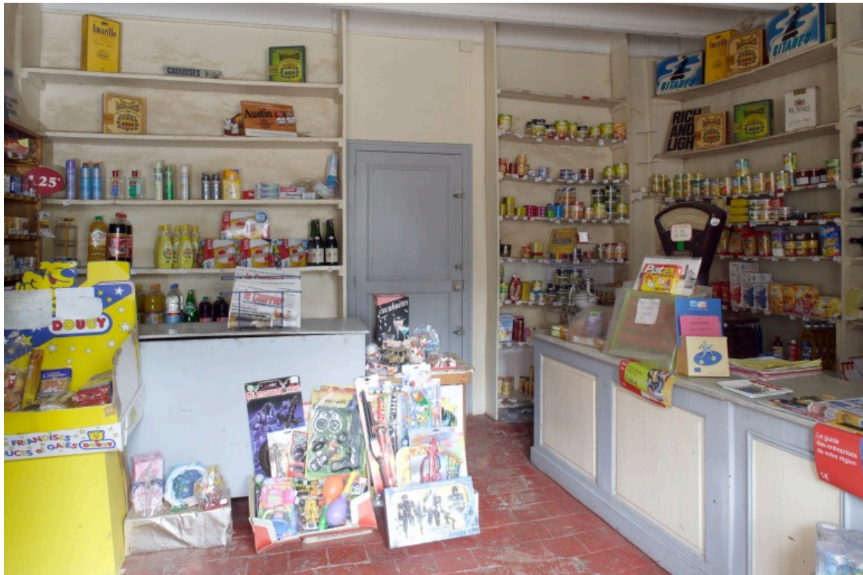
Rez-de-chaussée : la boutique vue depuis l'entrée à l'est.