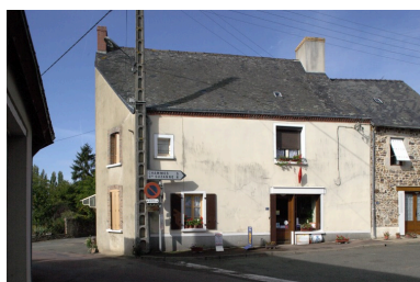
Vue depuis la place. IVR52_20055302033NUCA