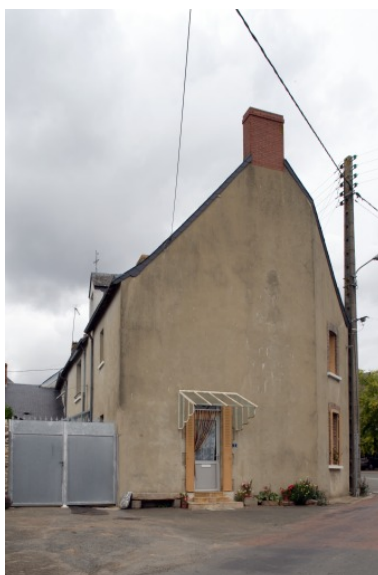
Vue depuis la route de Saint-Jean. IVR52_20055302128NUCA