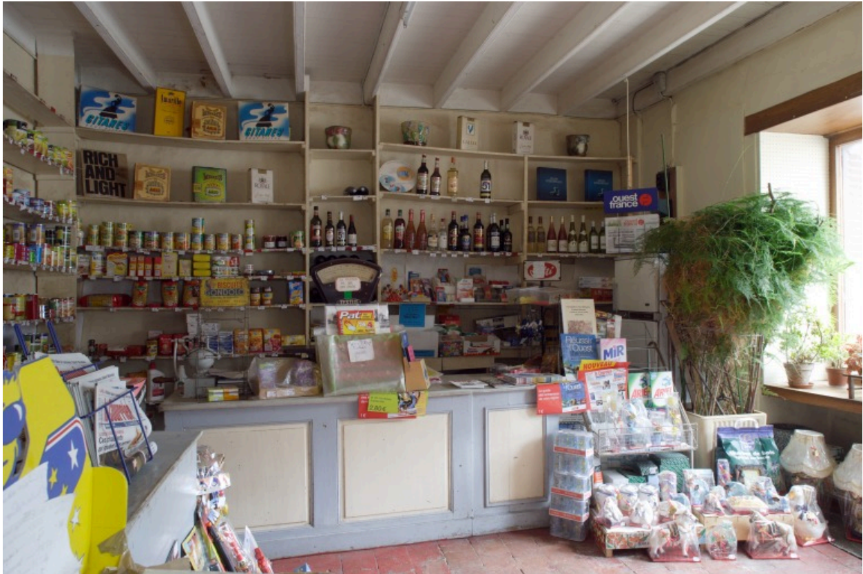
Rez-de-chaussée : la boutique vue depuis le sud.