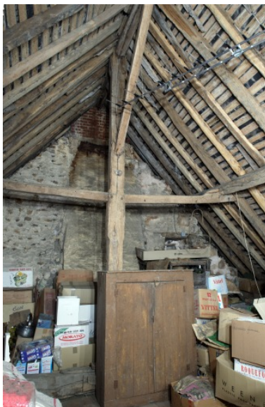
Comble : la ferme de charpente sud vue depuis le nord. IVR52_20055302129NUCA