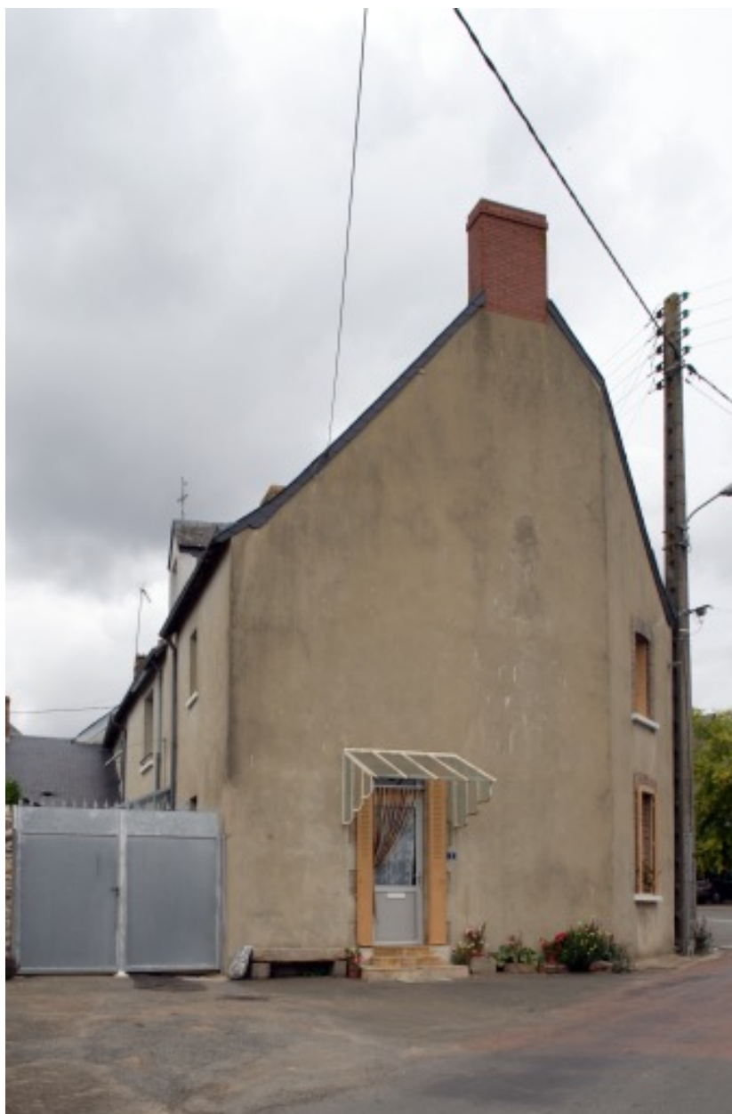
Vue depuis la route de Saint-Jean.