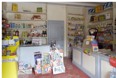
Rez-de-chaussée : la boutique vue depuis l'entrée à l'est.