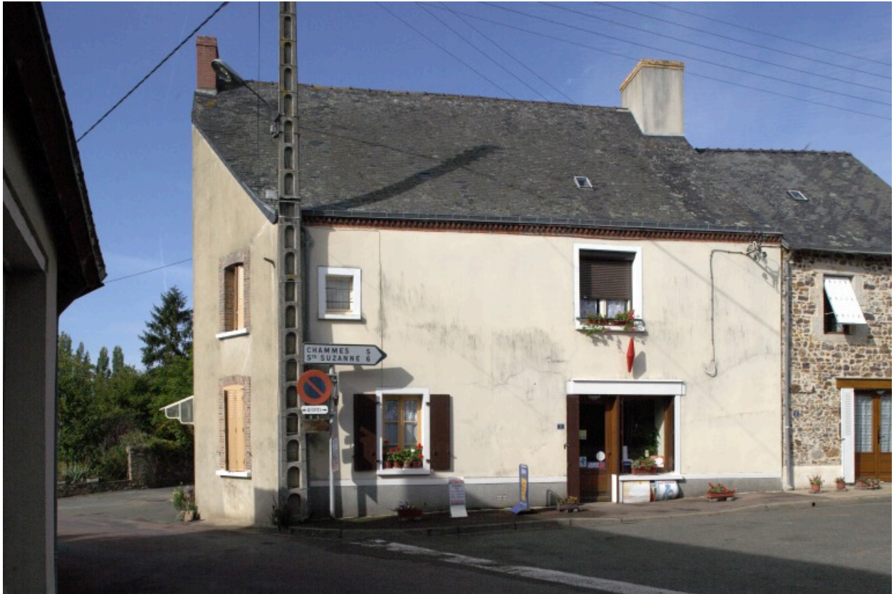
Vue depuis la place.