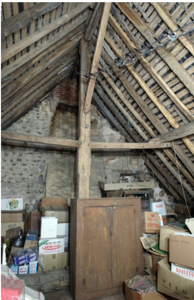
Comble : la ferme de charpente sud vue depuis le nord.