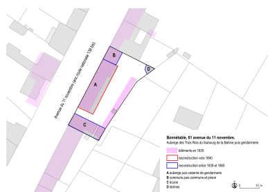
Plan chronologique. IVR52_20167200001NUDA