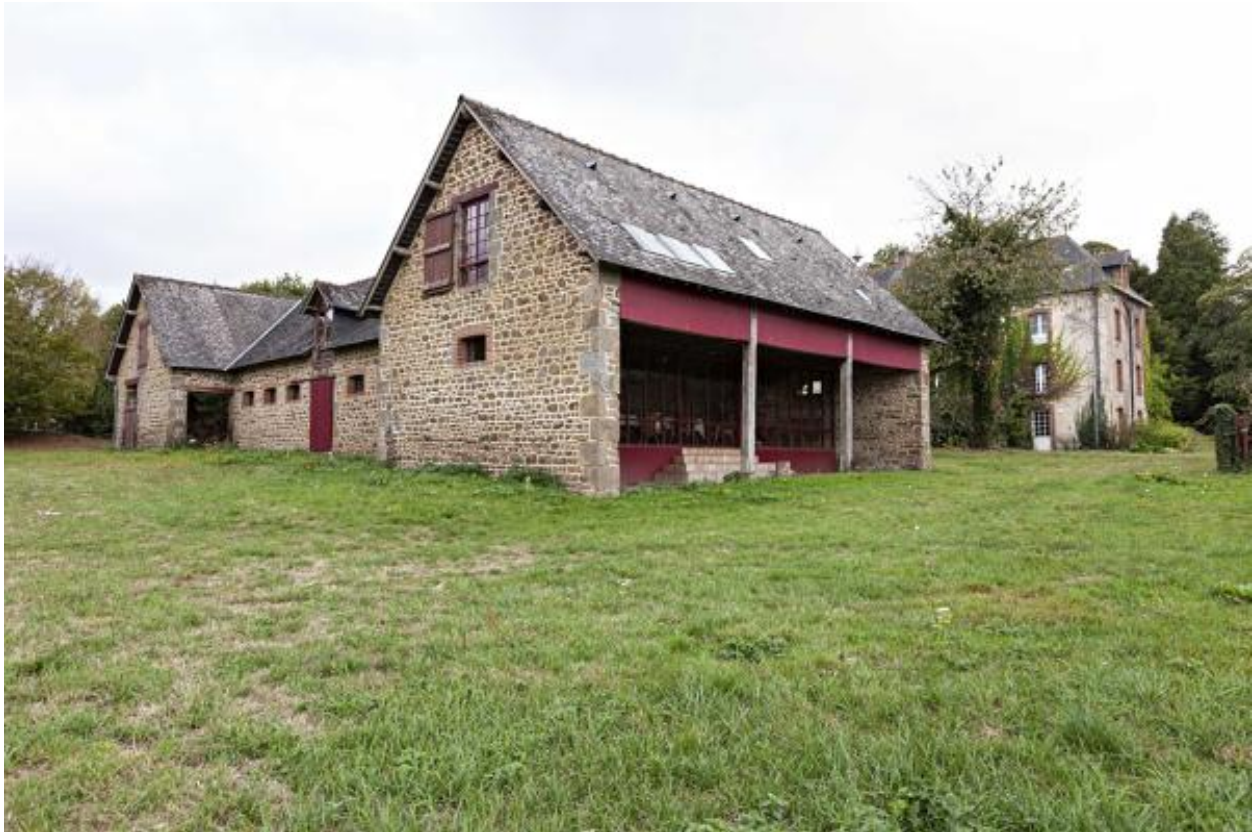
Ecurie nord de la Guette.