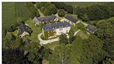
Vue aérienne depuis le sud-ouest.