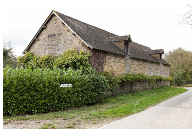
Grange et étable, nord-est, vue depuis l'est. IVR52_20205300301NUCA