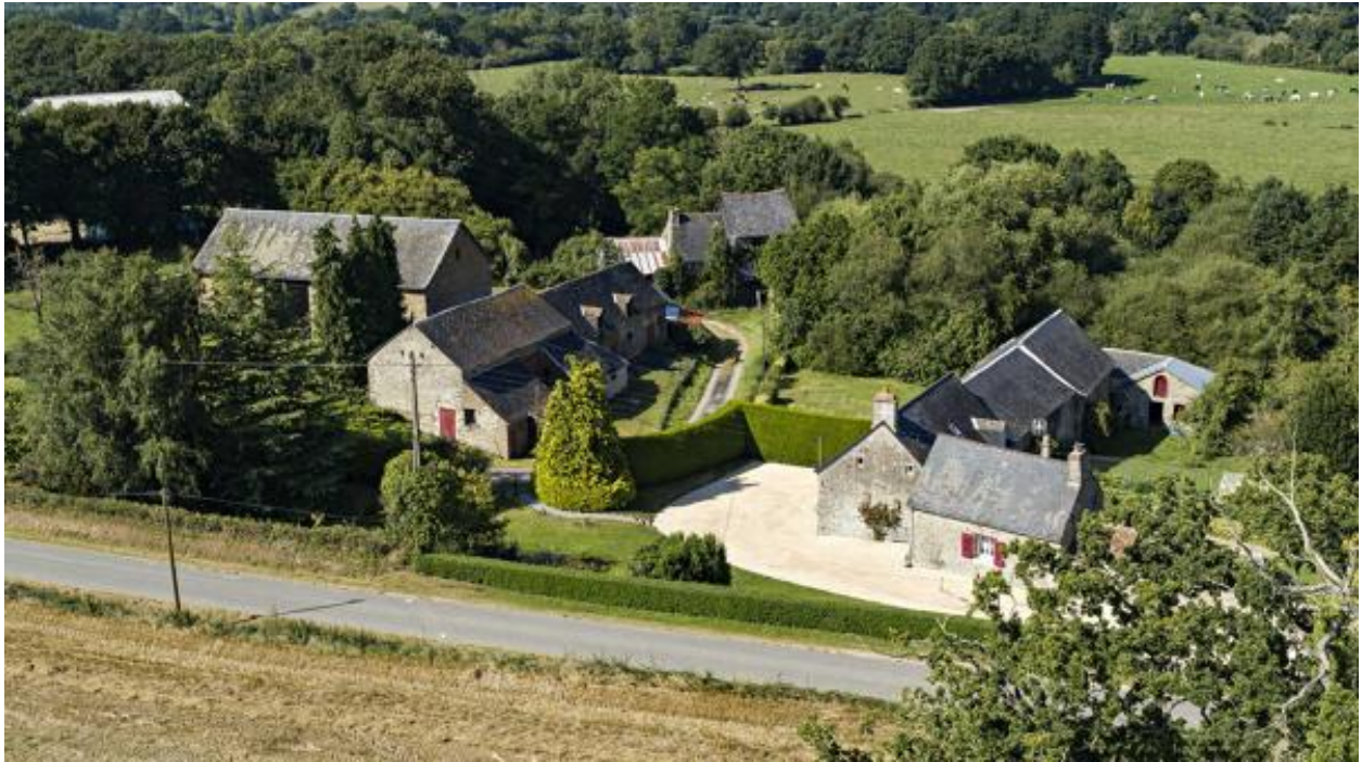
Vue aérienne depuis le nord-est