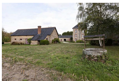
Fournil et étable, nord-ouest de la Guette. IVR52_20205300292NUCA