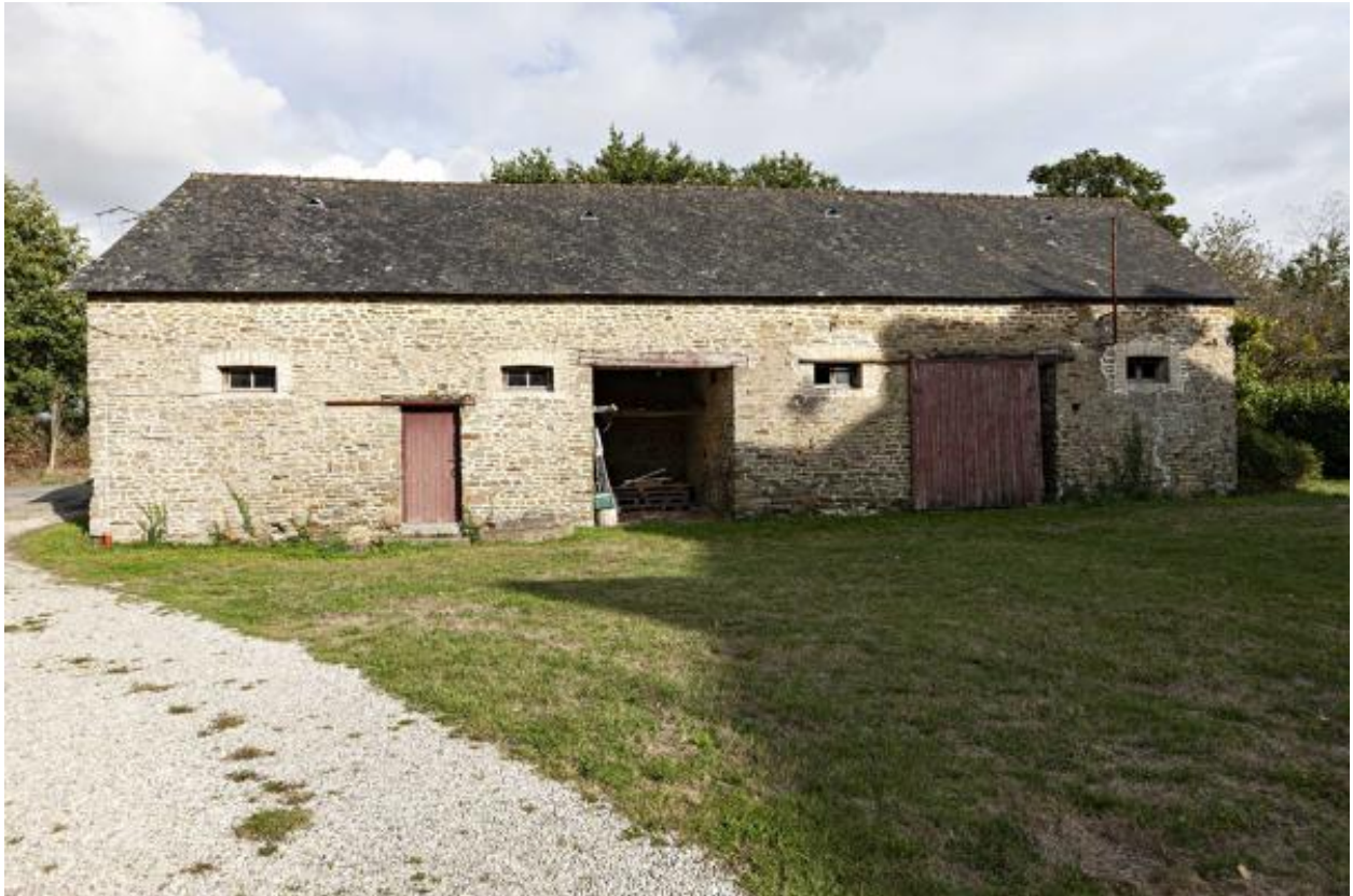
Grange et étable nord-est, façade ouest.