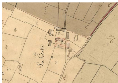
Superposition du cadastre actuel et ancien de la Guette.