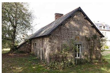
Maison et garage, sud-ouest de la Guette. IVR52_20205300287NUCA