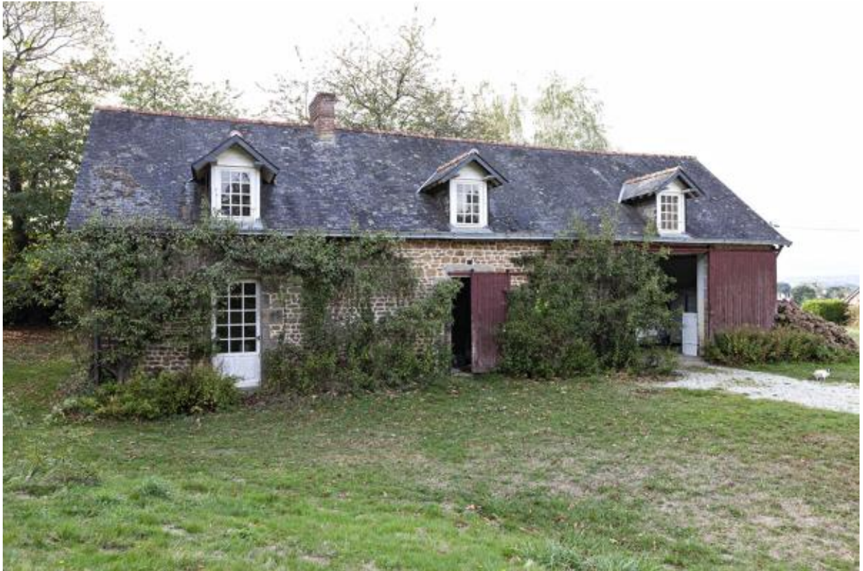
Maison et garage, sud-ouest de la Guette.