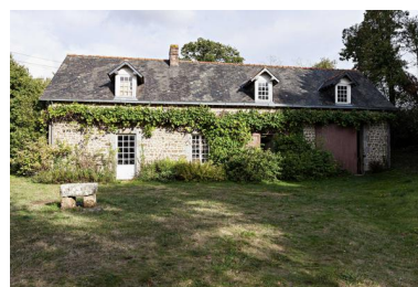
Maison et remise, sud-est de la maison principale. IVR52_20205300282NUCA