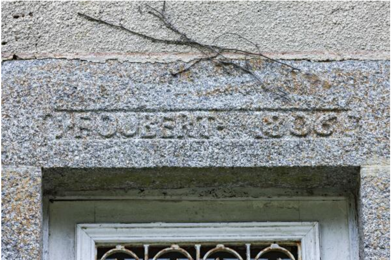
Linteau de porte de la maison, portant l'inscription "I. FOUBERT 1806"