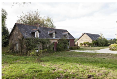
Maison et garage, sud-ouest de la Guette. IVR52_20205300290NUCA