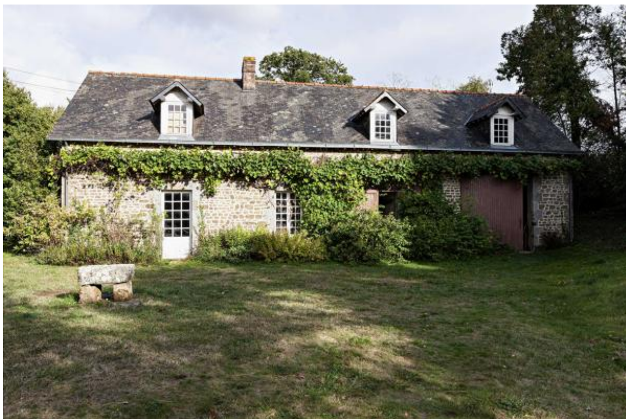
Maison et remise, sud-est de la maison principale.