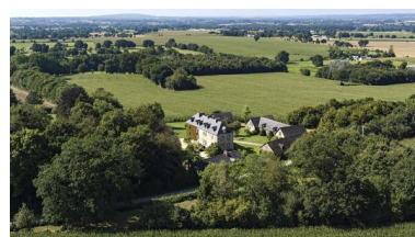
Vue aérienne de la Guette IVR52_20215301476NUCA