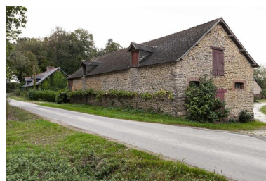
Grange et étable, nord-est de la Guette.