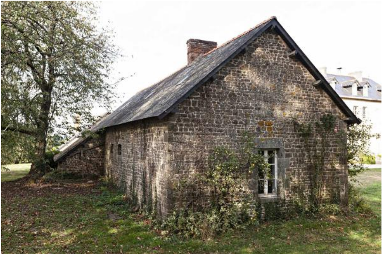
Maison et garage, sud-ouest de la Guette.