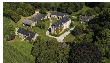
Vue aérienne.