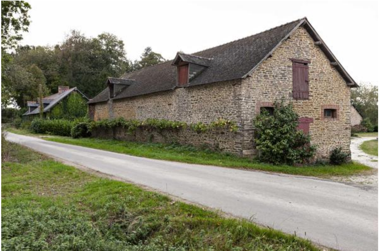
Grange et étable, nord-est de la Guette.