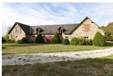
Ecurie. IVR52_20205300281NUCA