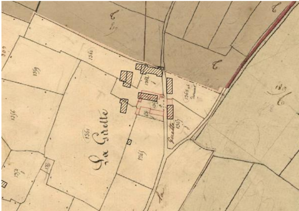
Superposition du cadastre actuel et ancien de la Guette.