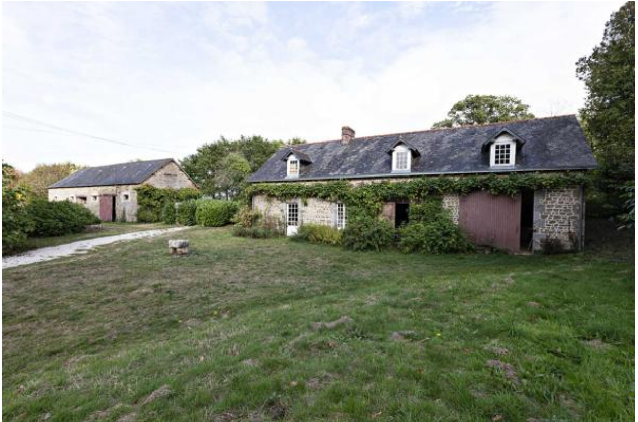
Maison et remise, sud-est.