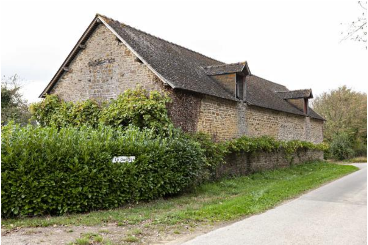
Grange et étable, nord-est, vue depuis l'est.