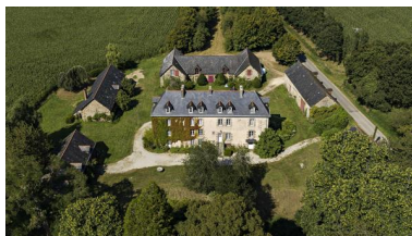
Vue aérienne depuis le sud. IVR52_20215301474NUCA