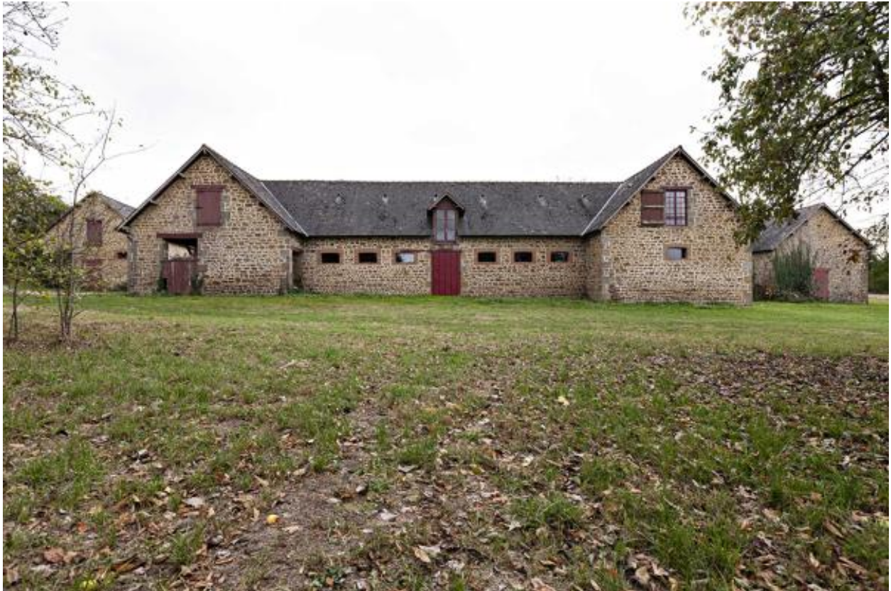
Ecurie nord de la Guette, face nord.