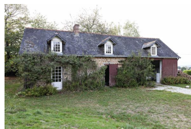
Maison et garage, sud-ouest de la Guette. IVR52_20205300286NUCA