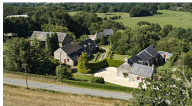
Vue aérienne depuis le nord-est IVR52_20215301477NUCA