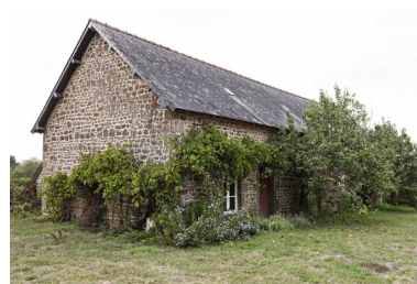
Fournil et étable, nord- ouest de la Guette. IVR52_20205300294NUCA