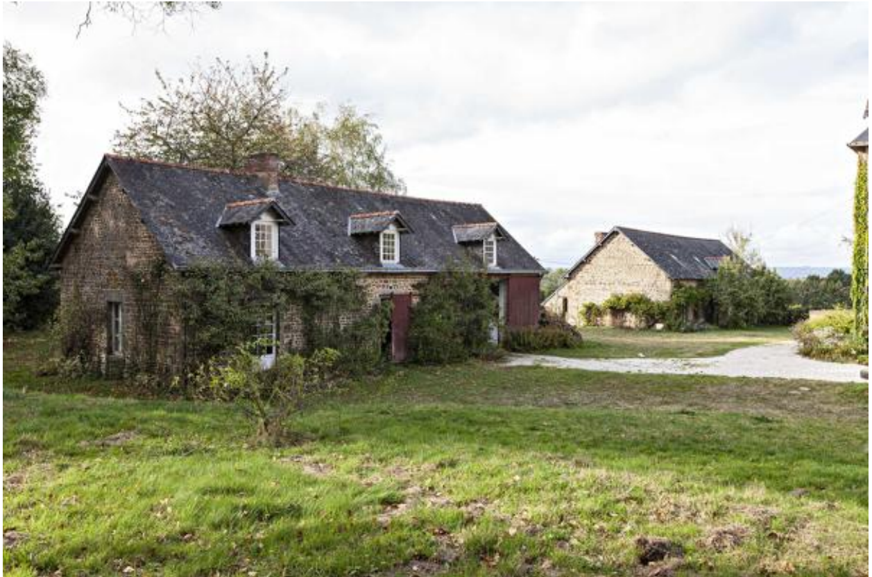
Maison et garage, sud-ouest de la Guette.