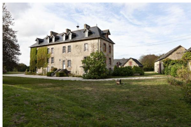
Maison de la Guette, depuis le sud-est.