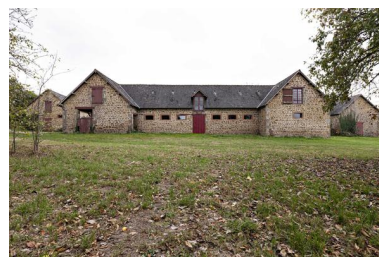
Ecurie nord de la Guette, face nord. IVR52_20205300297NUCA