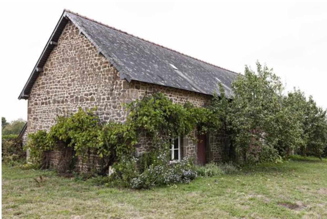
Fournil et étable, nord-ouest de la Guette.