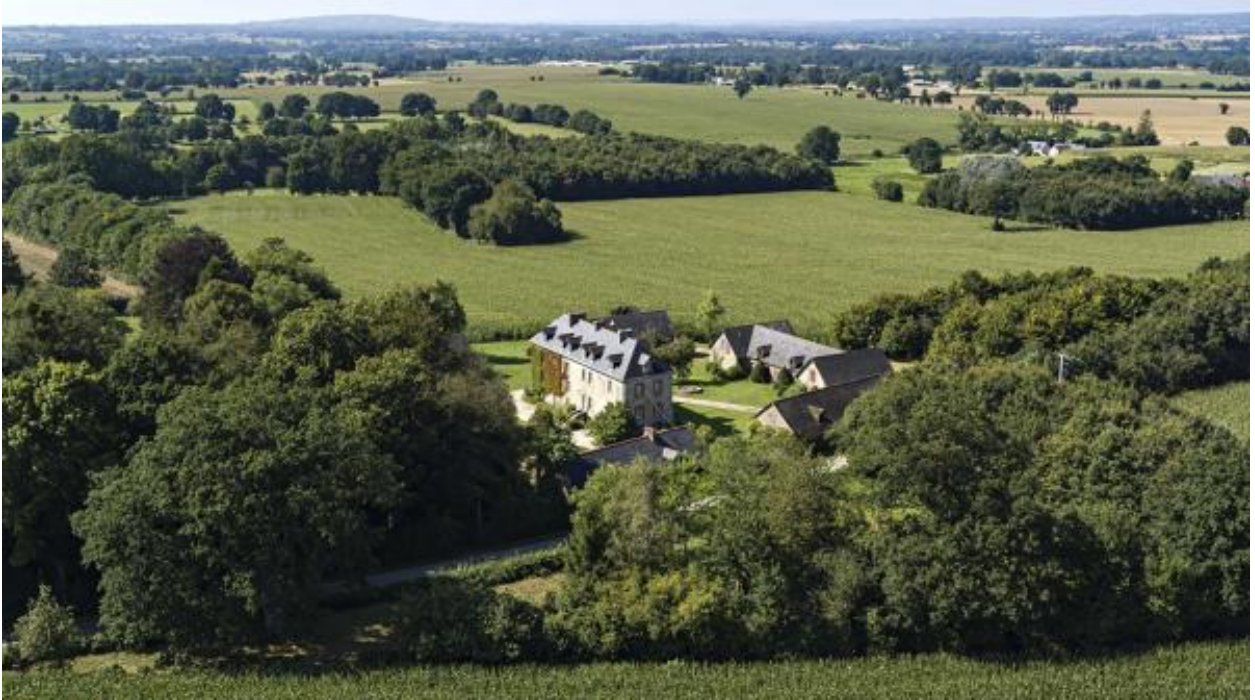
Vue aérienne de la Guette