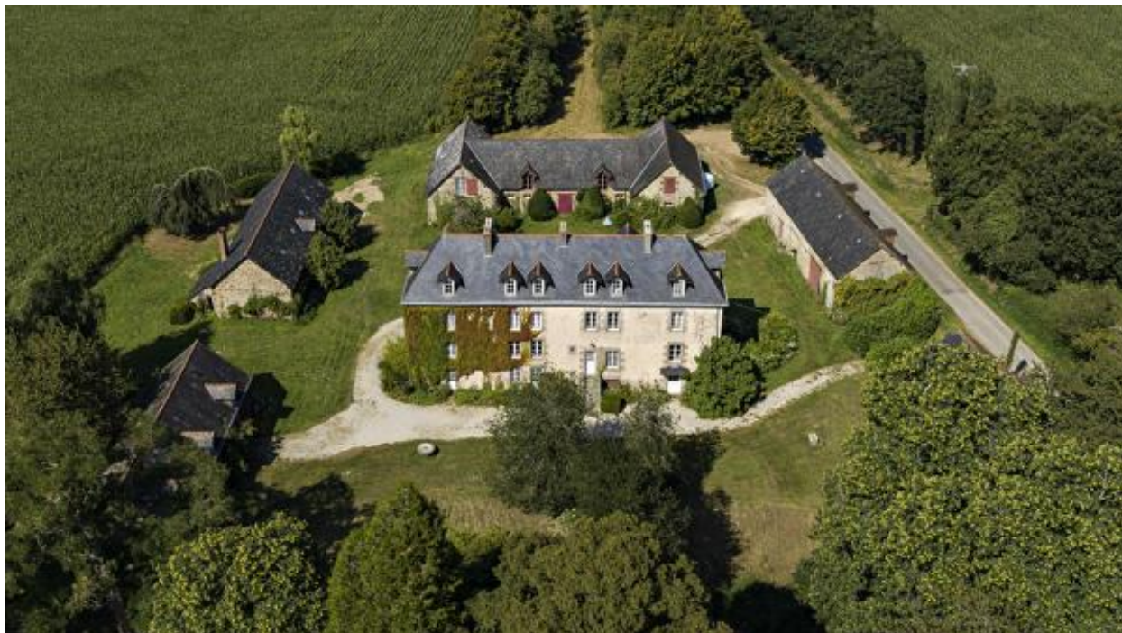
Vue aérienne depuis le sud.