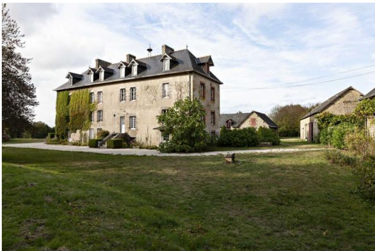
Maison de la Guette, depuis le sud-est.