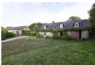
Maison et remise, sud-est.