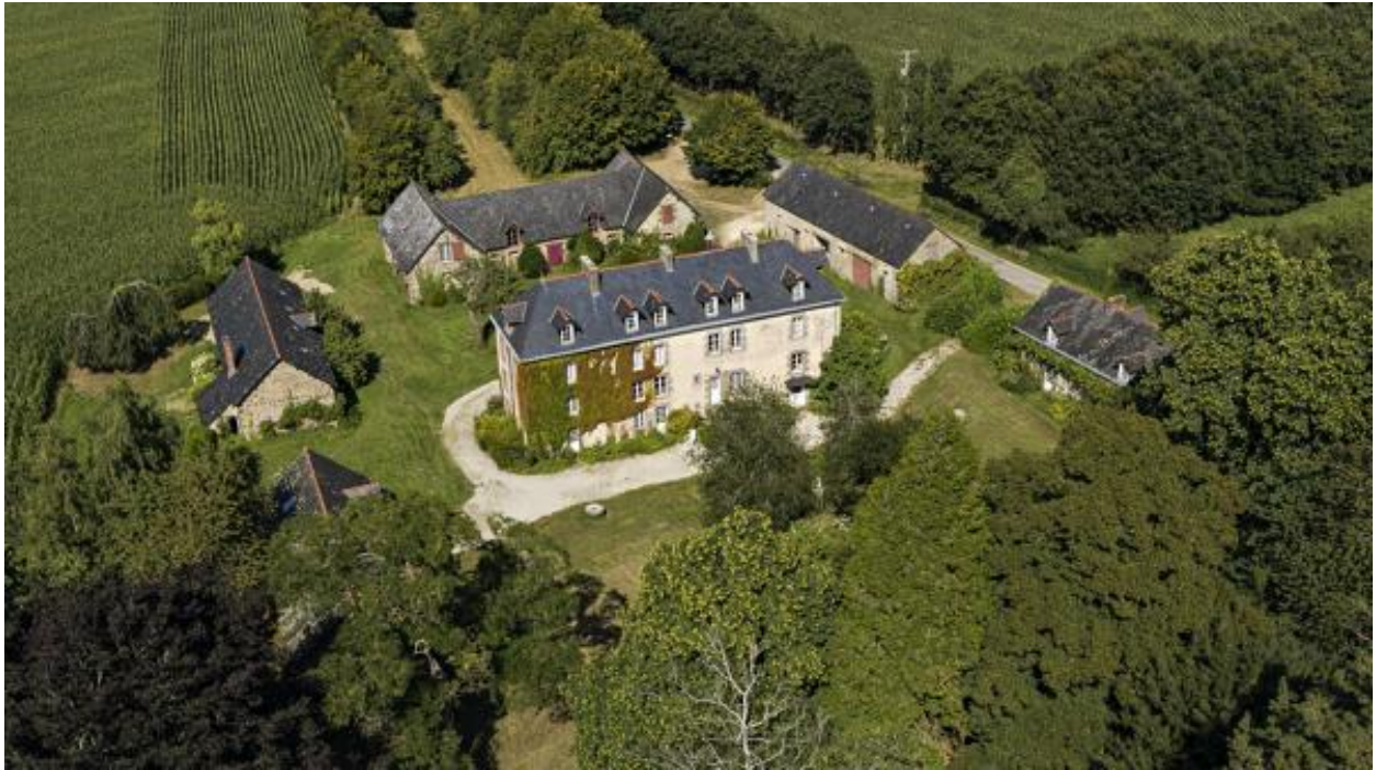
Vue aérienne depuis le sud-ouest.