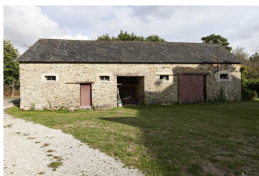
Grange et étable nord-est, façade ouest. IVR52_20205300280NUCA