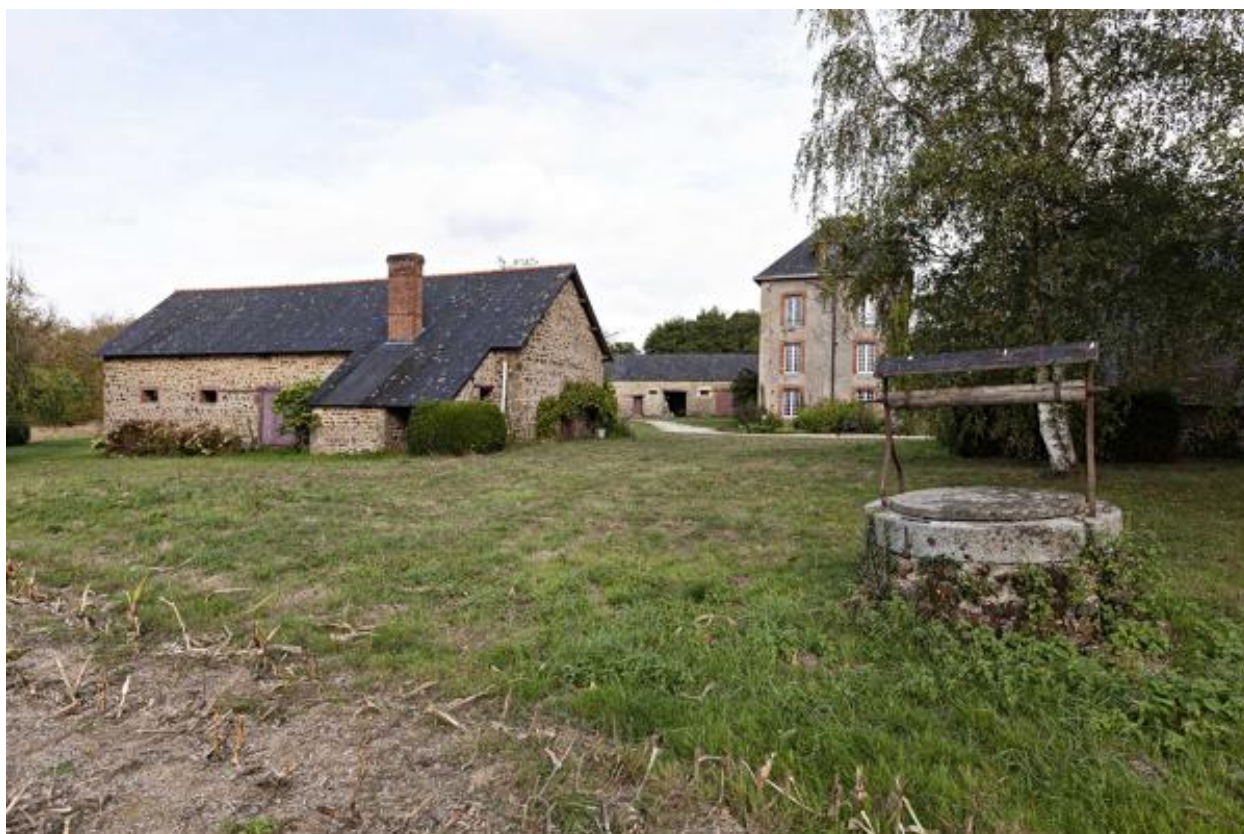
Fournil et étable, nord-ouest de la Guette.