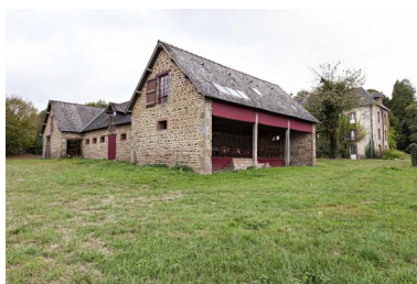
Ecurie nord de la Guette. IVR52_20205300296NUCA