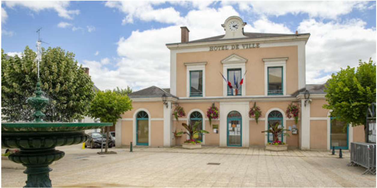
La mairie au centre de la place.