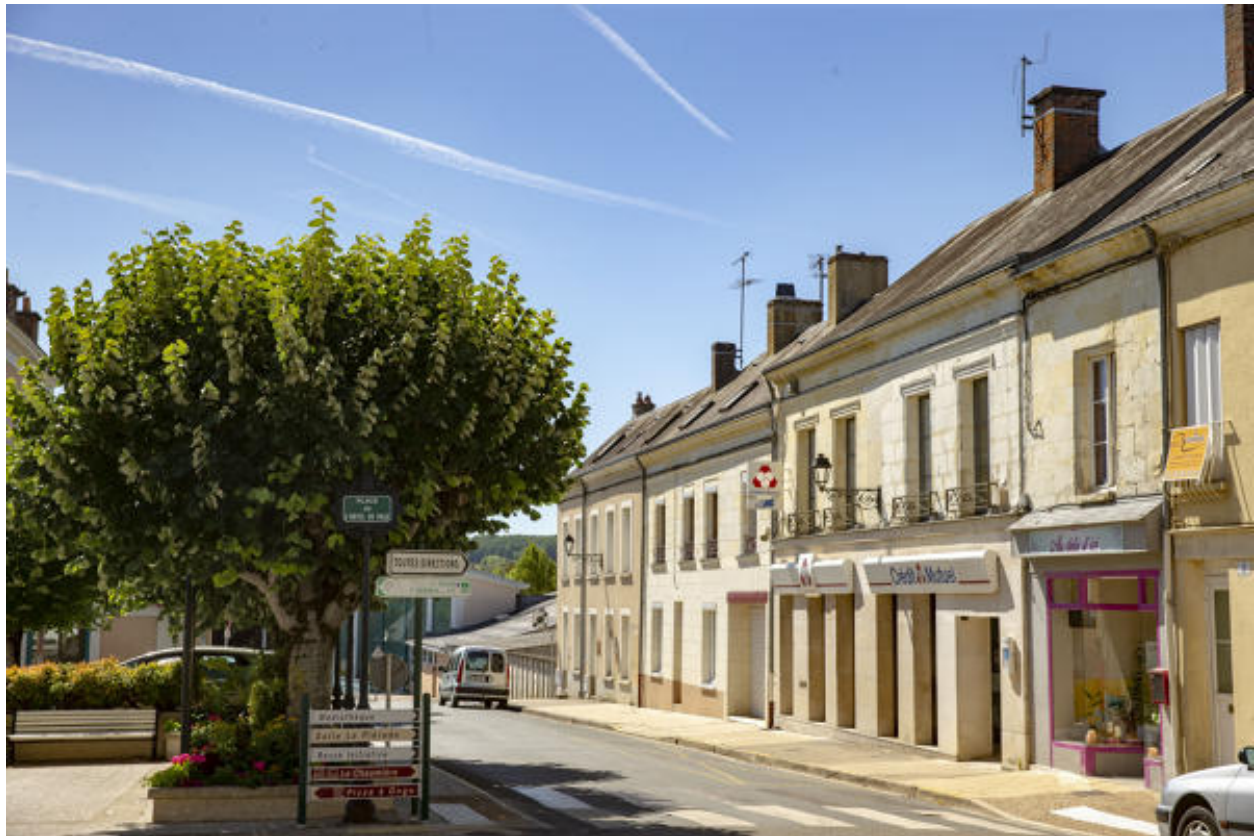
La place, maisons du côté sud-ouest.