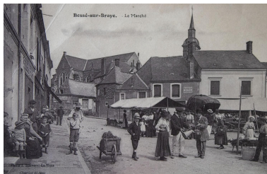
La place jour de marché, carte postale du début du XXe siècle.