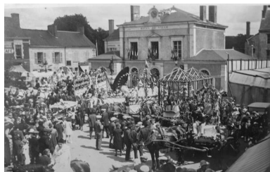
Une fête sur la place, photographie du début du XXe siècle. IVR52_20207200621NUCA