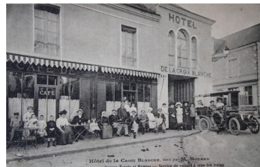
L'hôtel de la Croix Blanche, carte postale du début du XXe siècle.