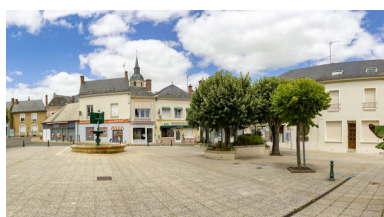
La place, côté nord.