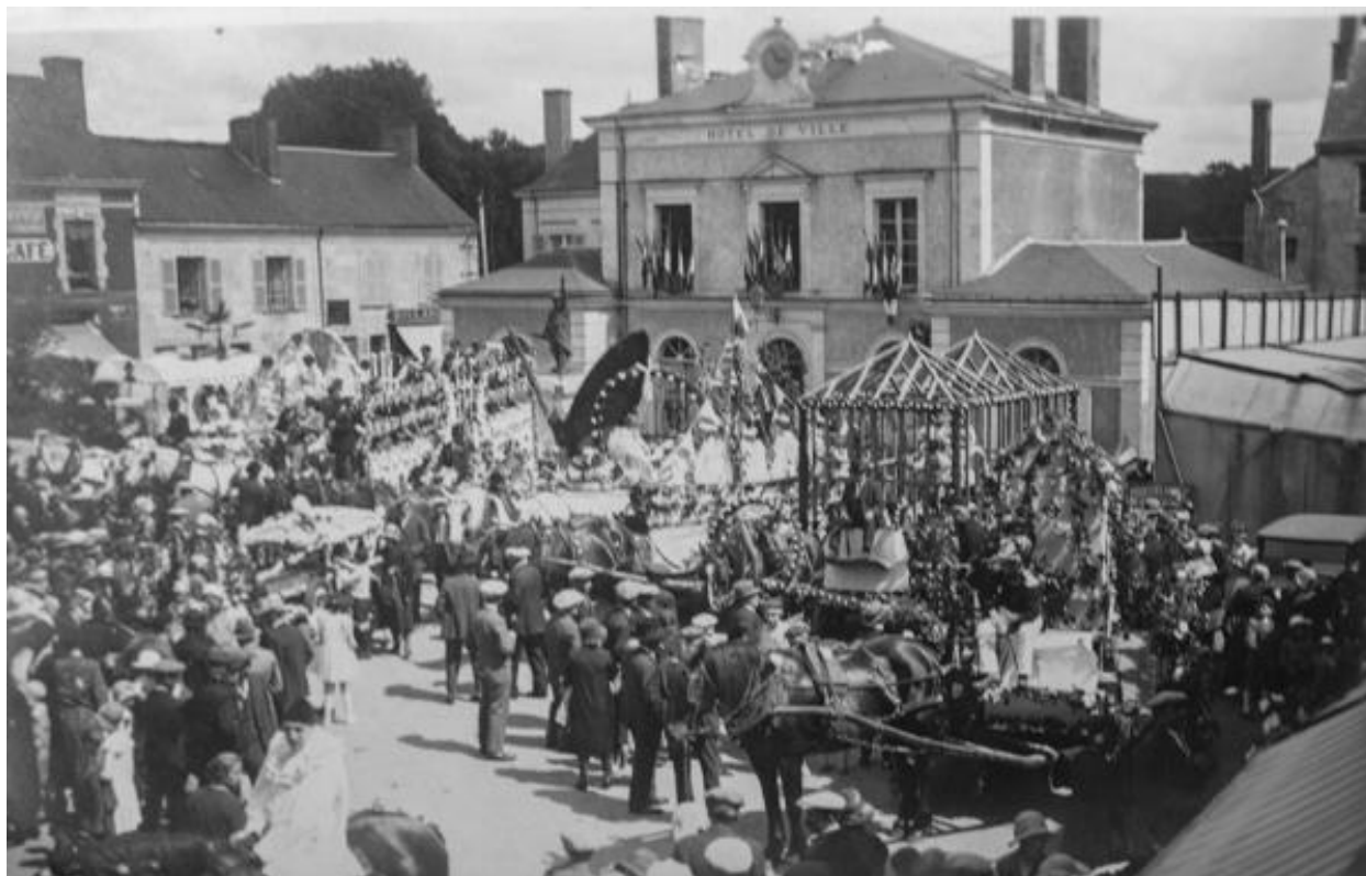
Une fête sur la place, photographie du début du XXe siècle.