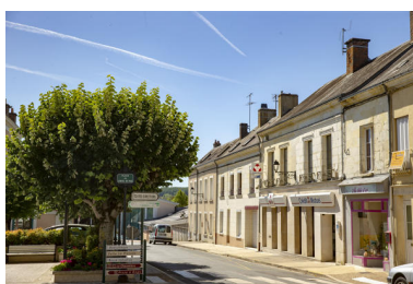
La place, maisons du côté sud-ouest. IVR52_20207200610NUCA