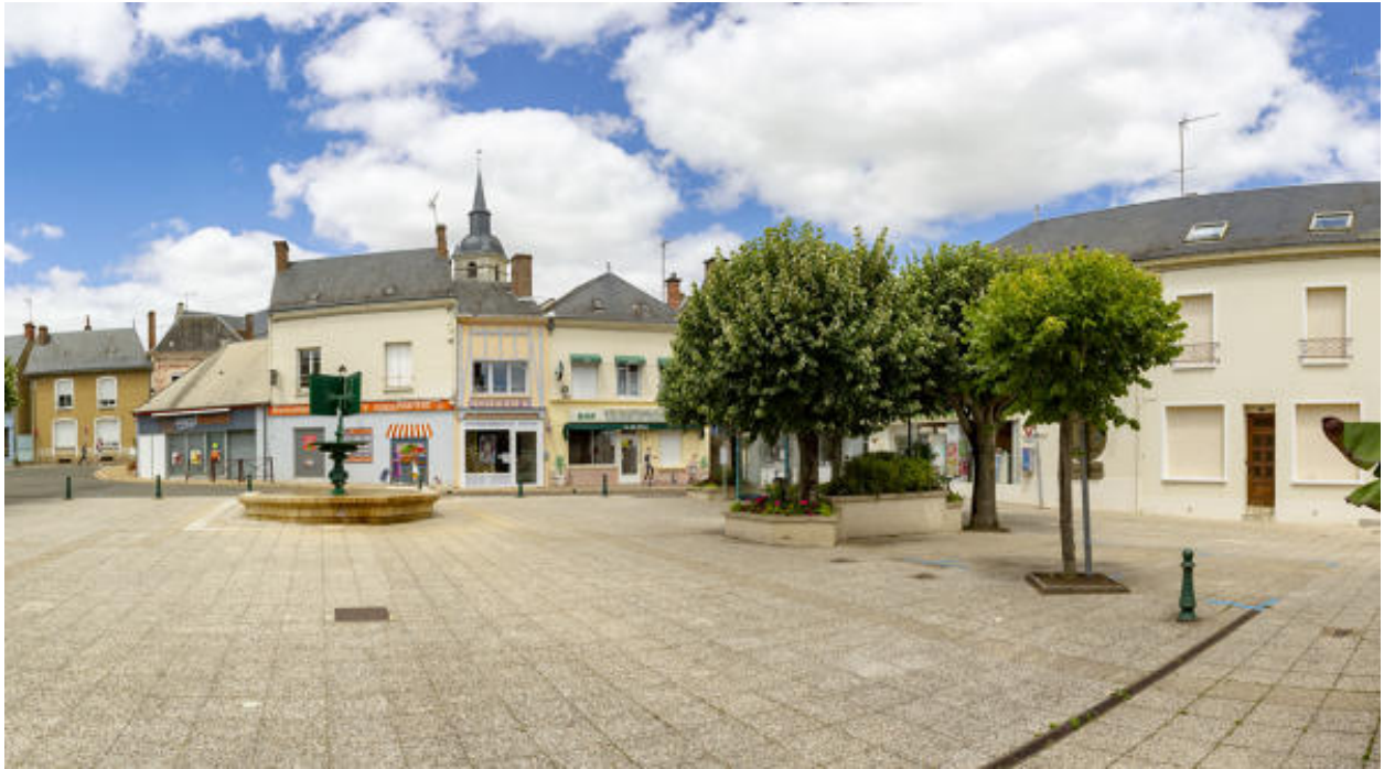
La place, côté nord.