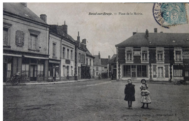
La place, carte postale du début du XXe siècle. IVR52_20207200829NUCA