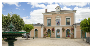
La mairie au centre de la place. IVR52_20207200482NUCA