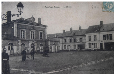
La place, carte postale du début du XXe siècle.