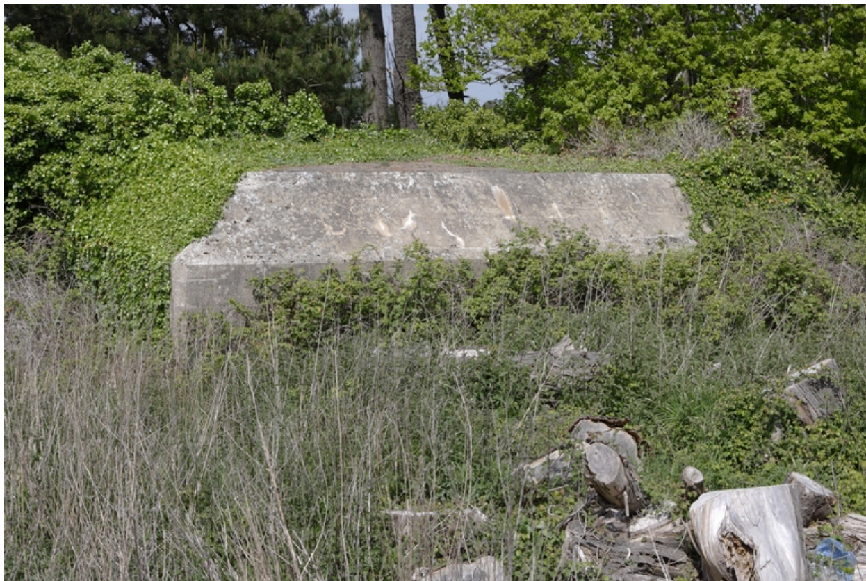
Vue de l'abri n° 2.