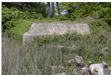
Vue de l'abri n° 2. IVR52_20104401055NUCA

Plan d'un blockhaus de type H 668. Abri pour 6 hommes (210 m 3). IVR52_20074401173NUCA