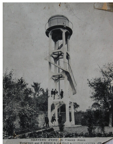
L'inauguration du château d'eau, 1912 ou 1913.