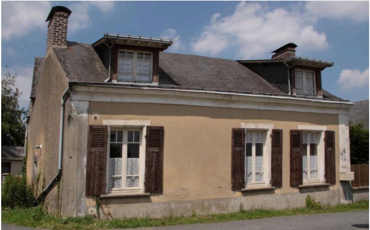
2, chemin de la mare : maison ayant logé la première école de filles.