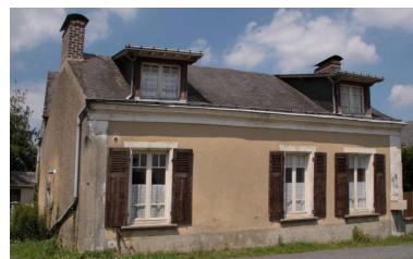
2, chemin de la mare : maison ayant logé la première école de filles.