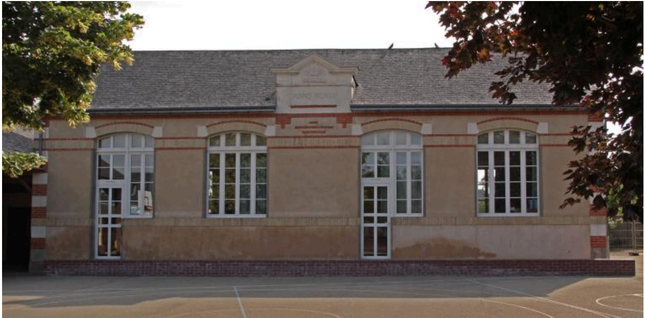
1, ruelle de l'École : école de filles, façade sur cour (1914).