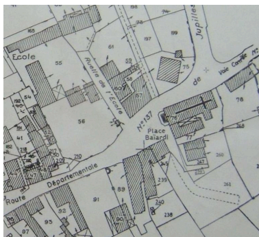
Extrait du plan cadastral de 2005. IVR52_20097202153NUCA