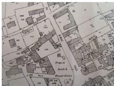
Extrait du plan cadastral de 2005. IVR52_20097202178NUCA