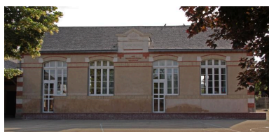
1, ruelle de l'École : école de filles, façade sur cour (1914). IVR52_20107201281NUCA