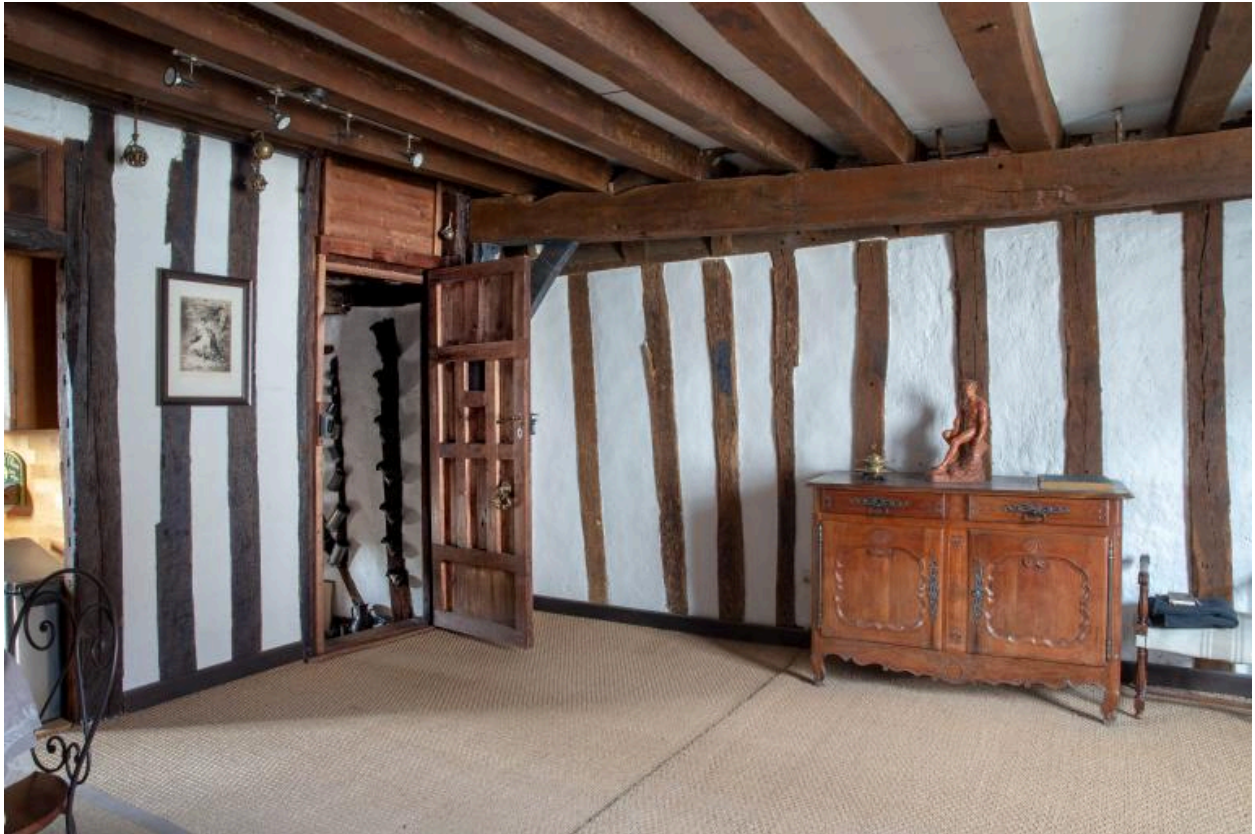
Une pièce de l'étage.