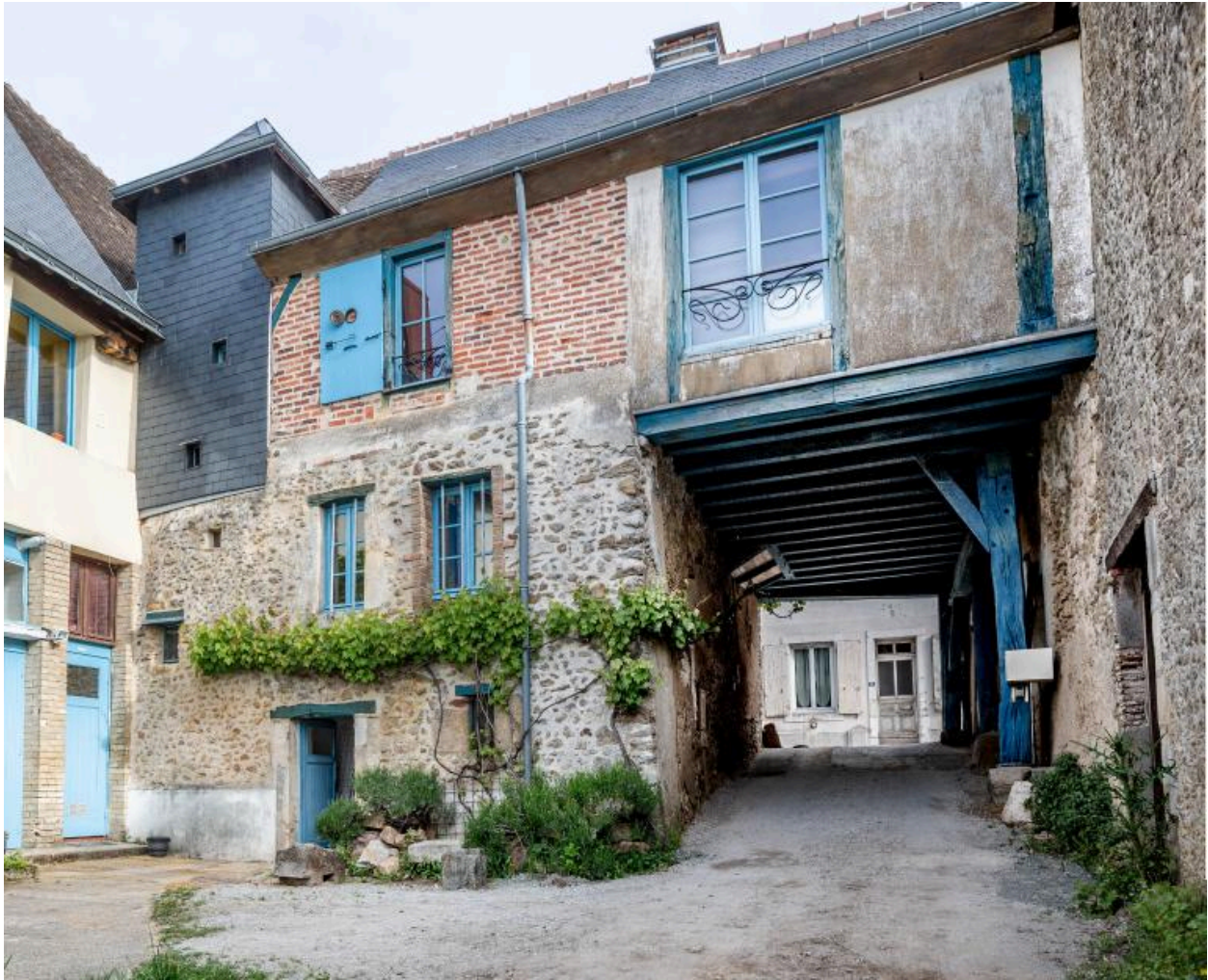
La maison côté cour.