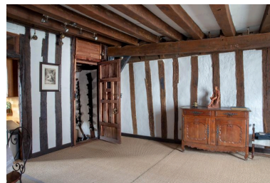
Une pièce de l'étage.