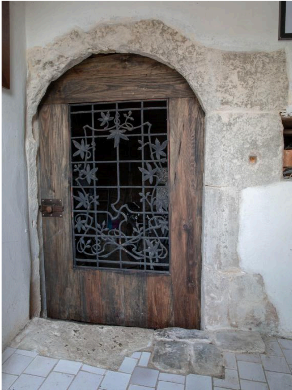
La porte de la cave.