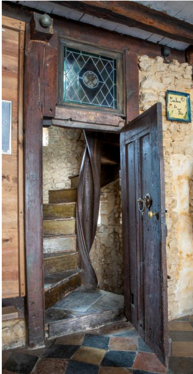
L'escalier au rez-de-chaussée.