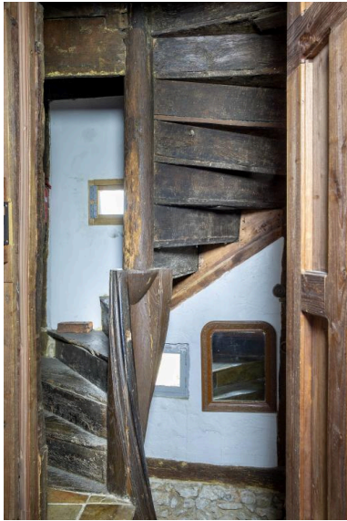
L'escalier au niveau de l'étage. IVR52_20197200865NUCA