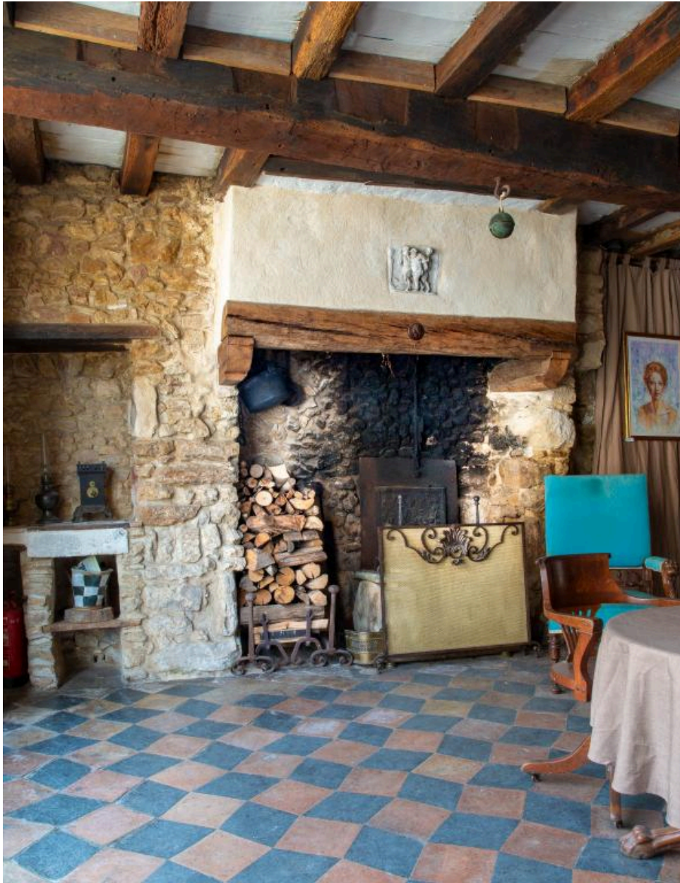
La pièce du rez-de-chaussée.