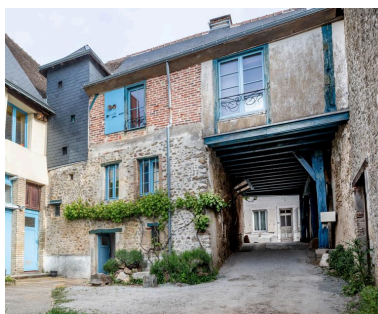
La maison côté cour. IVR52_20197200868NUCA