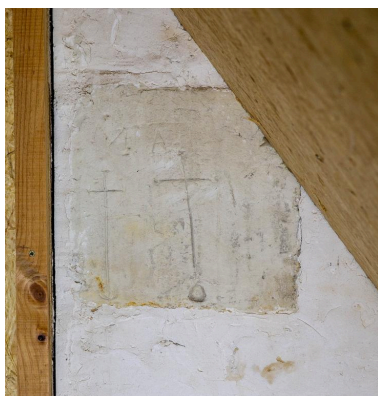
Les croix gravées au niveau du comble.