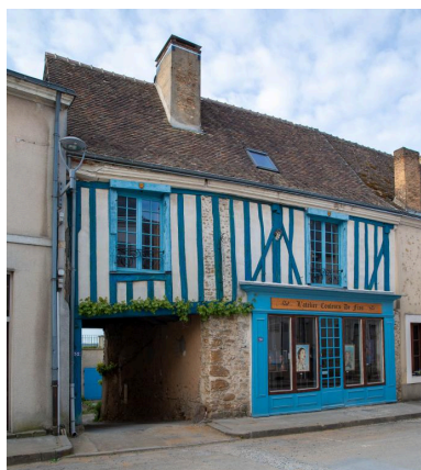
La maison côté rue.