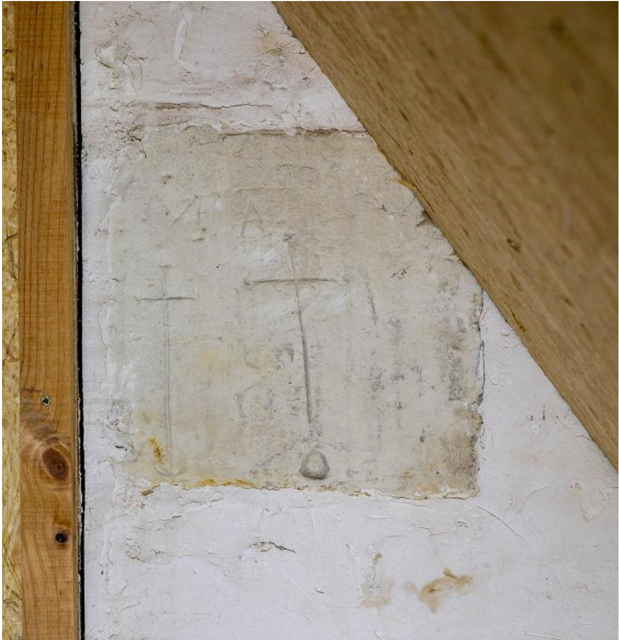
Les croix gravées au niveau du comble.