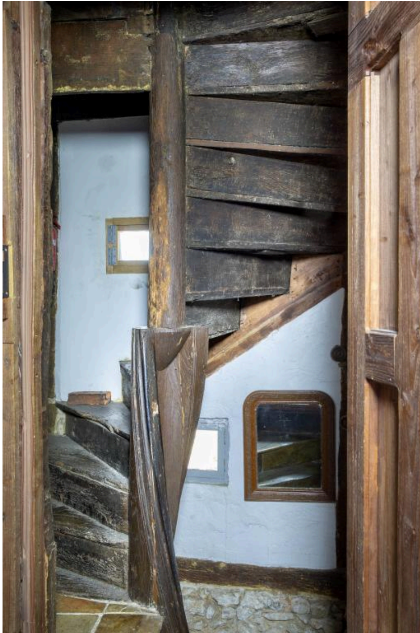
L'escalier au niveau de l'étage.