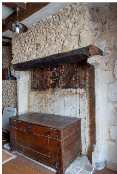
La cheminée de l'étage.