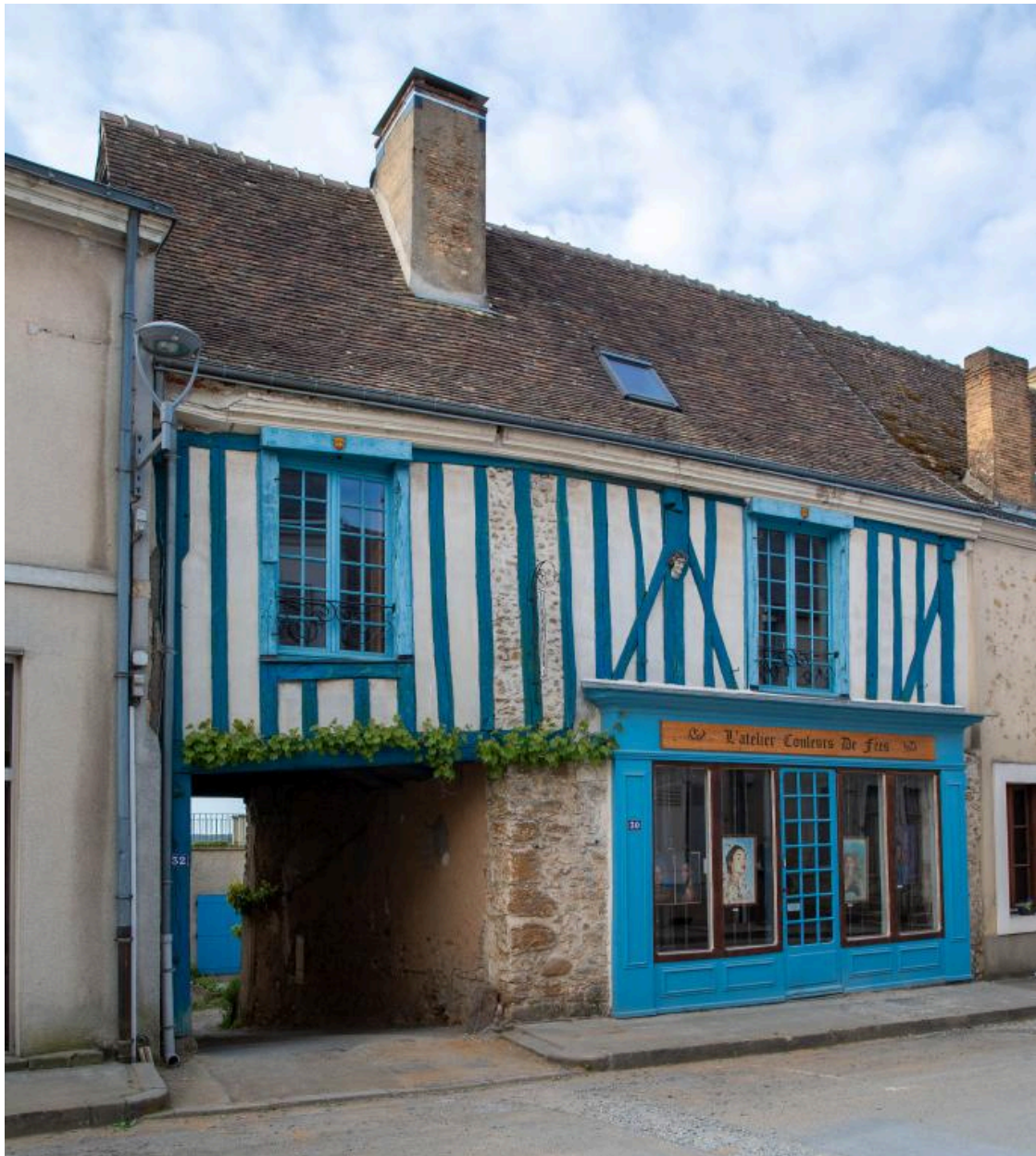
La maison côté rue.