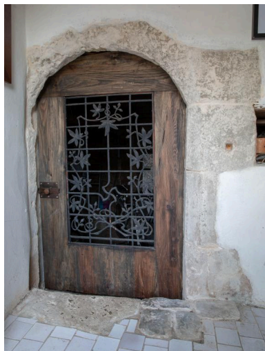
La porte de la cave.