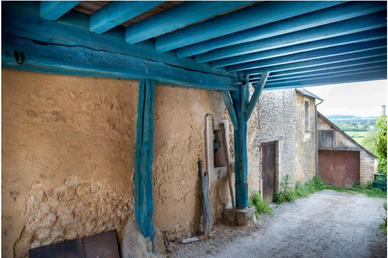
Le passage couvert.