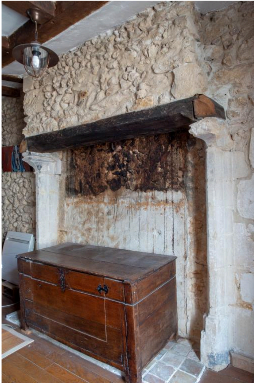
La cheminée de l'étage.