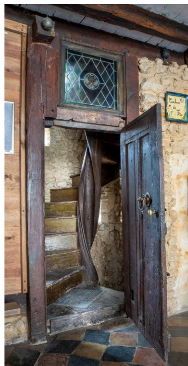
L'escalier au rez-de-chaussée.