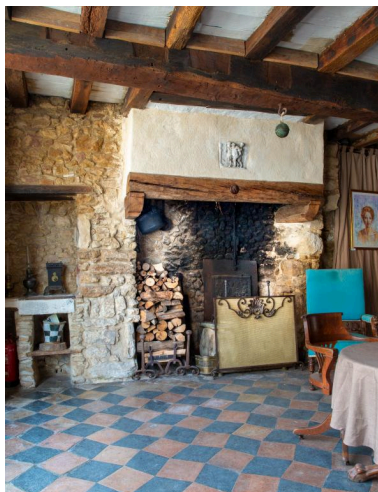
La pièce du rez-de-chaussée. IVR52_20197200862NUCA