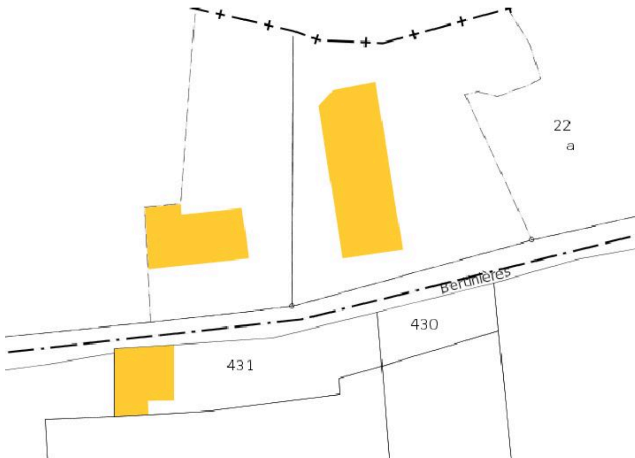
Extrait du plan cadastral de 2008.