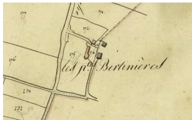
Extrait du plan cadastral de 1812. IVR52_20087210196NUCA