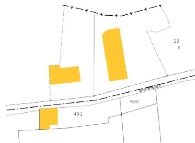
Extrait du plan cadastral de 2008. IVR52_20087210199NUCA