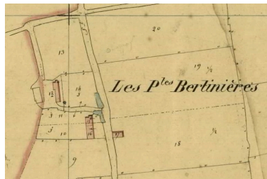
Extrait du plan cadastral de 1845. IVR52_20087210198NUCA