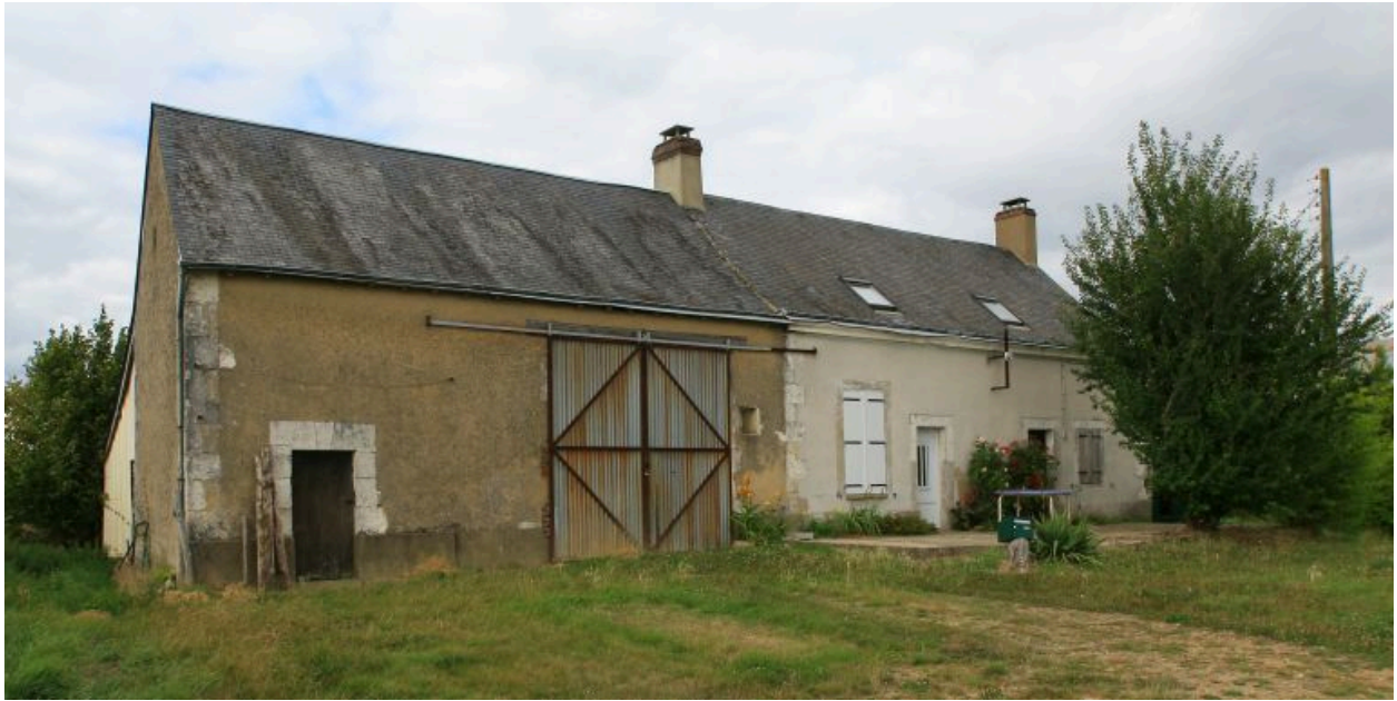
Vue d'ensemble : maison et grange sous un même toit.