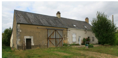
Vue d'ensemble : maison et grange sous un même toit. IVR52_20087202012NUCA