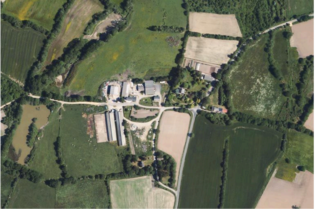
Vue aérienne de l'écart de Kervrenel.