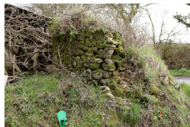
Vestige du four à pain.