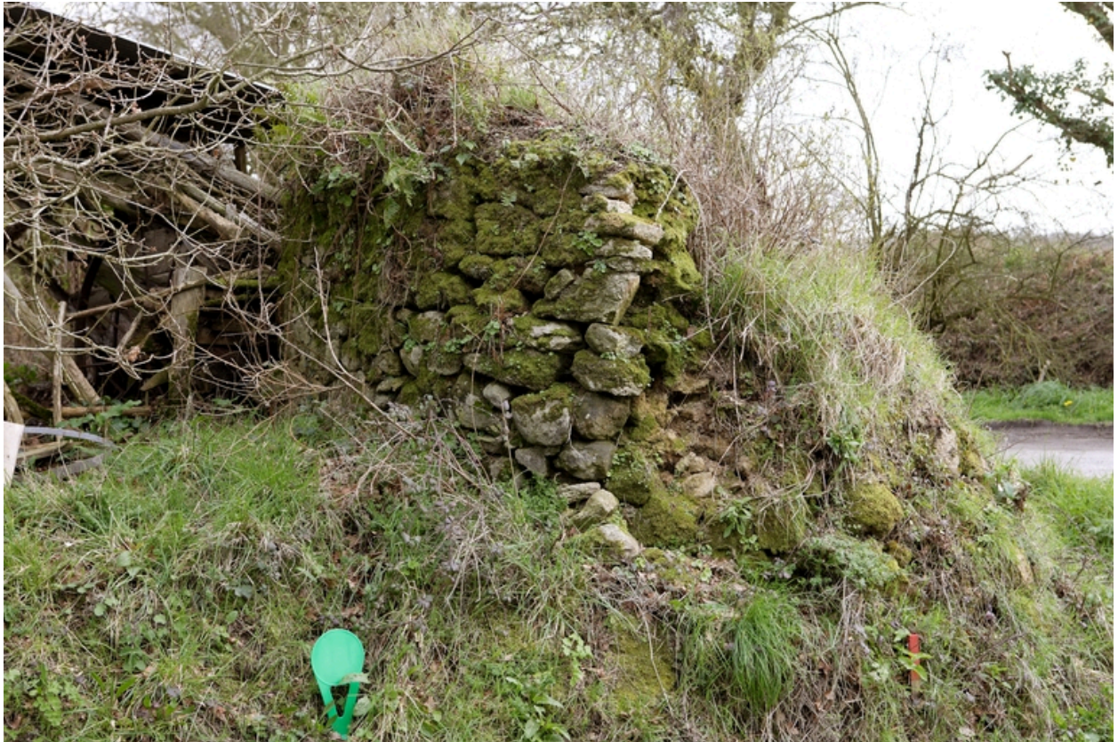
Vestige du four à pain.