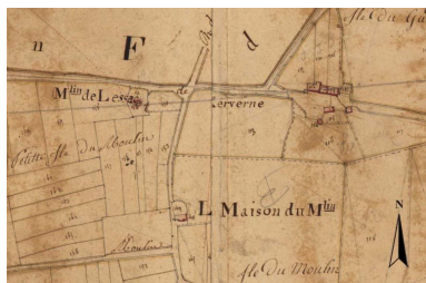
Extrait du plan cadastral de 1819, section G1. IVR52_20084404092NUCA