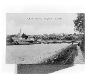
Vue d'ensemble du village et du pont de Daon depuis le chemin de halage, rive droite, en amont. IVR52_20015300352X