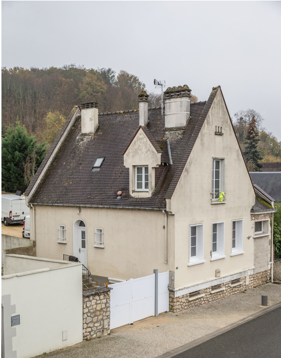
Une vue d'ensemble.