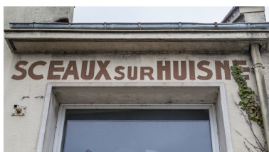
L'inscription au-dessus de la porte.