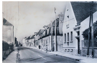
La poste, à droite, carte postale de la 2e moitié du XXe siècle.