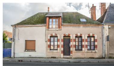
La poste à la fin du XIXe siècle et au début du XXe siècle.