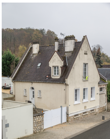
Une vue d'ensemble.