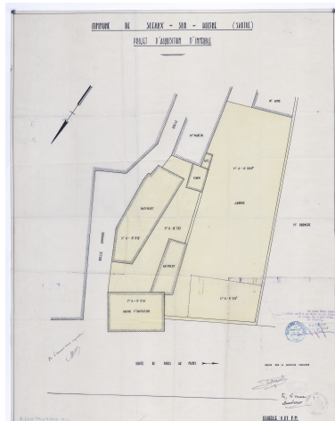
Un plan d'un projet d'acquisition d'immeubles pour la poste, 1938.

Autr. Marcel Jacquet IVR52_20197200143NUCA