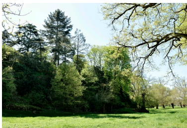
Vue du rocher depuis le nord-ouest.

IVR52_20144900442NUCA