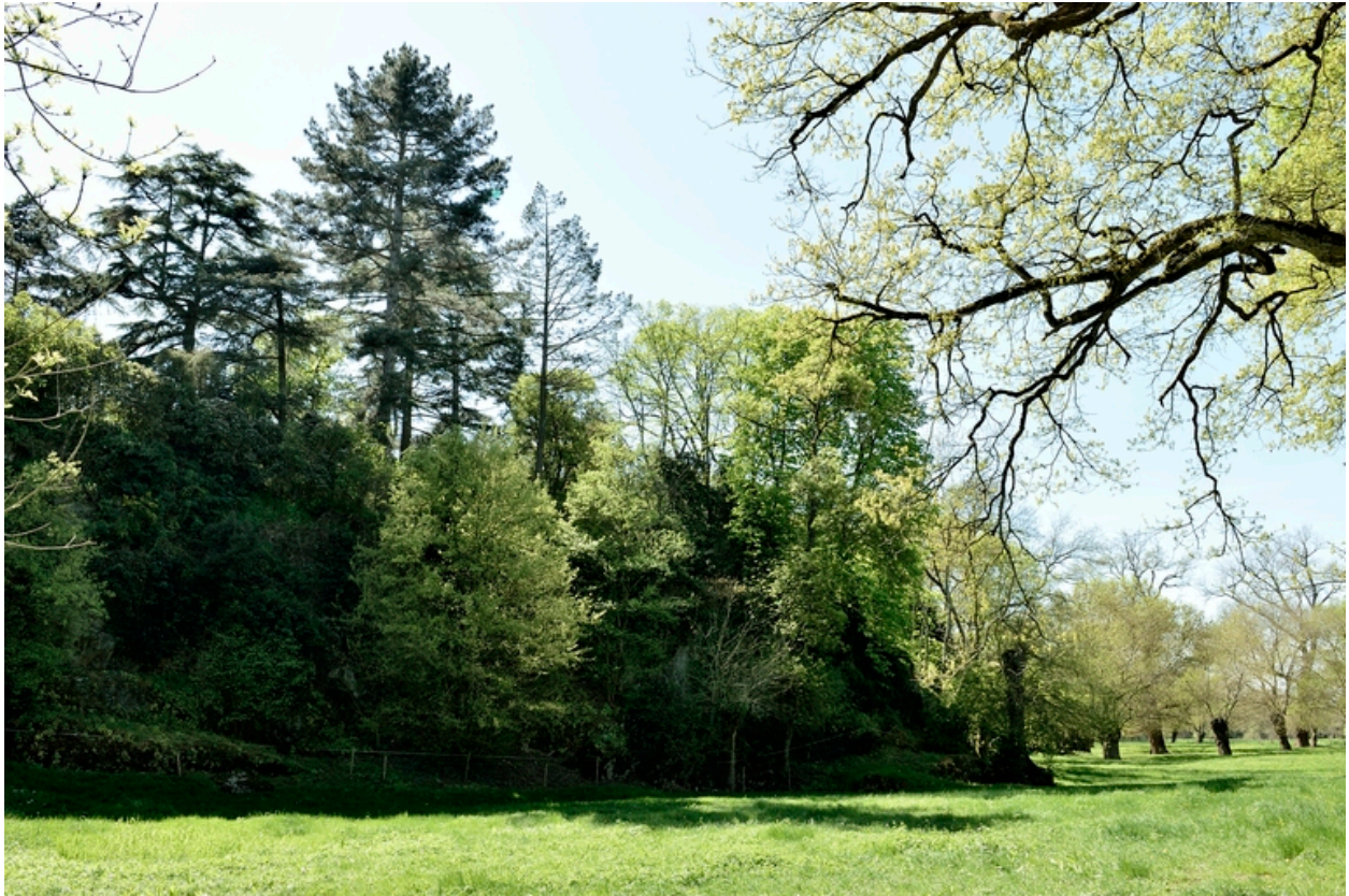
Vue du rocher depuis le nord-ouest.