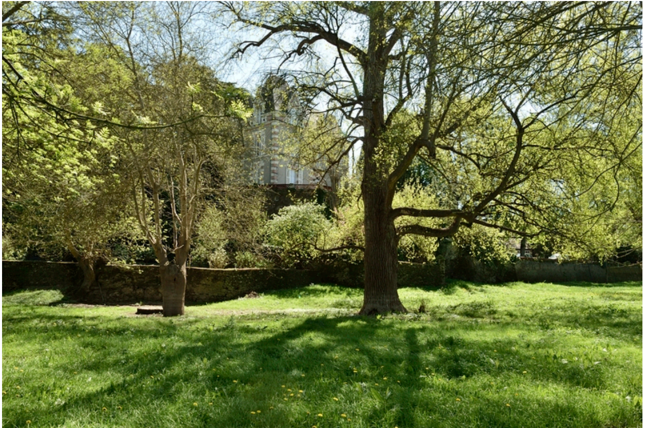
Vue depuis l'ouest.