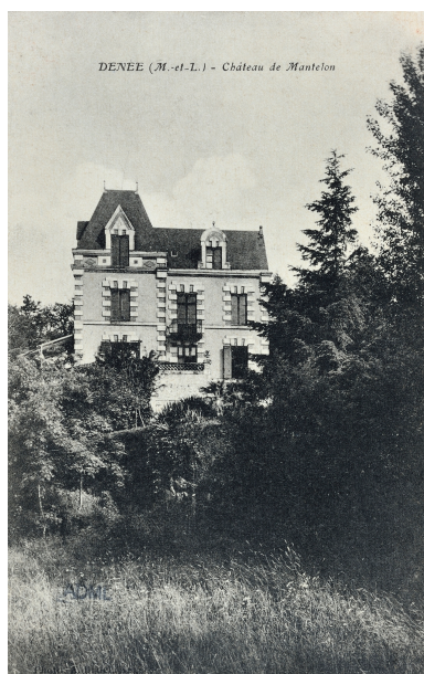
La villa Les Roches (et non le château de Mantelon comme indiqué). Carte postale. 1er quart 20e siècle. IVR52_20174900553NUCA