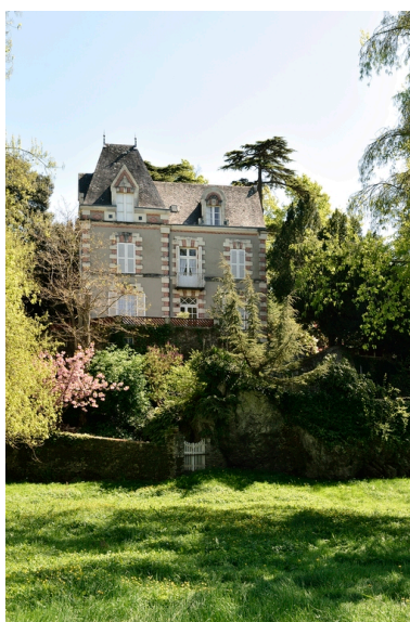
Vue d'ensemble depuis l'ouest. IVR52_20144900439NUCA