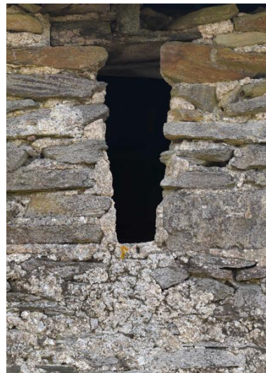
Détail d'une ouverture en moellons de schiste du mur ouest de l'étable, Touche Fleury.