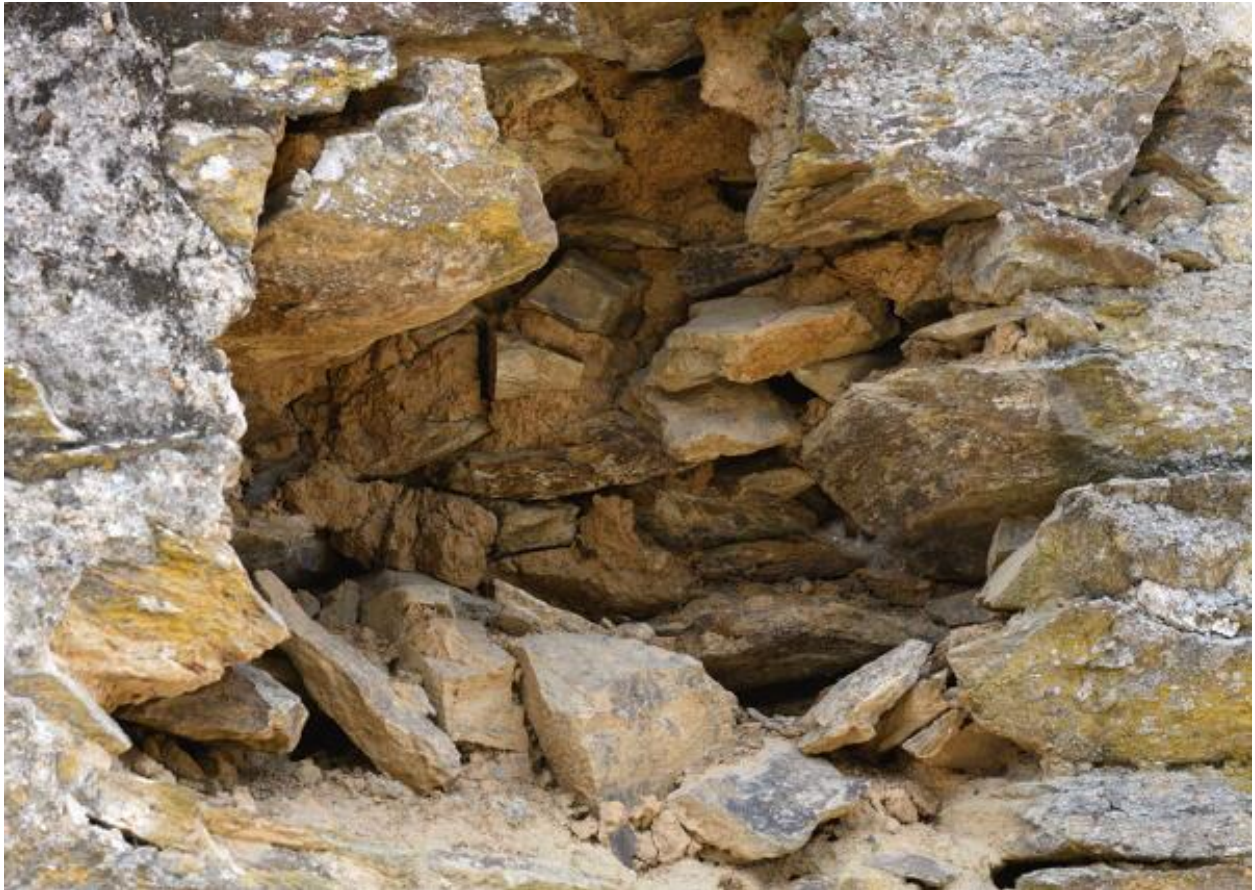
Détail de la composition du pignon nord de l'étable de la Petite Touche Fleury (moellons de schiste avec mortier de terre).