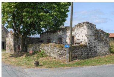
Toit à porcs de la Petite Touche Fleury.