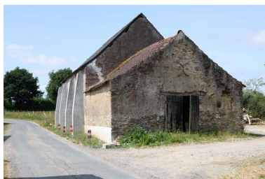
Vue de la grange-étable depuis le nord, Petite Touche Fleury. IVR52_20254900654NUCA