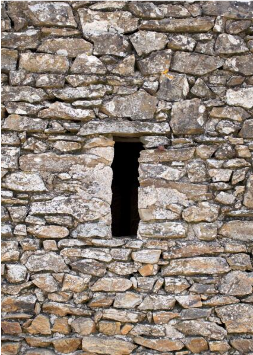
Détail d'une ouverture en moellons de schiste du mur ouest de l'étable, Touche Fleury.