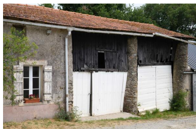
Détail de la grange à piliers ronds accolée au logis de la Petite Touche Fleury. IVR52_20254900664NUCA