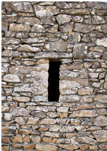
Détail d'une ouverture en moellons de schiste du mur ouest de l'étable, Touche Fleury. IVR52_20254900659NUCA