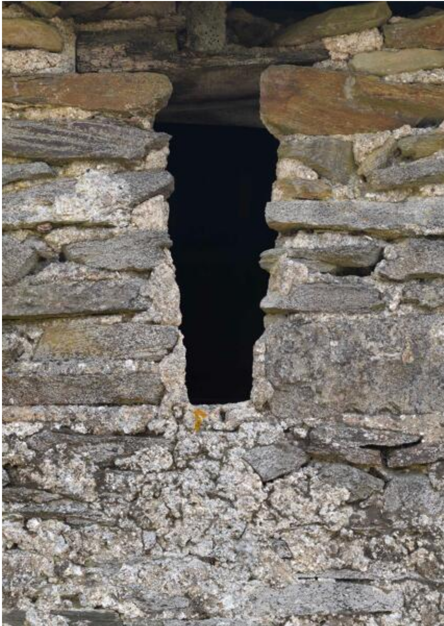
Détail d'une ouverture en moellons de schiste du mur ouest de l'étable, Touche Fleury.