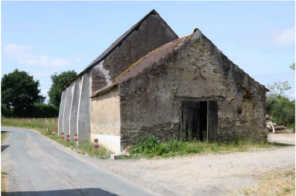
Vue de la grange-étable depuis le nord, Petite Touche Fleury.