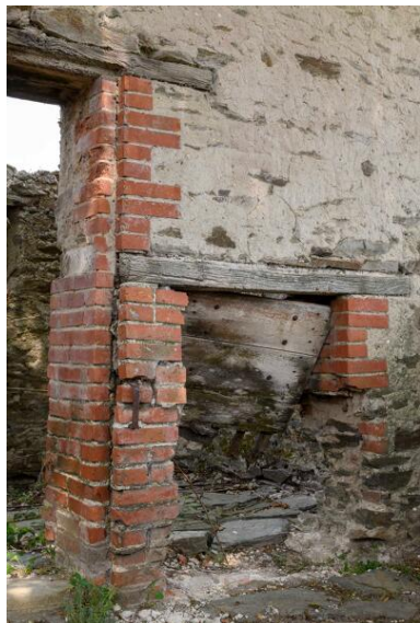
Détail d'une ouverture du toit à porcs de la Petite Touche Fleury. IVR52_20254900665NUCA