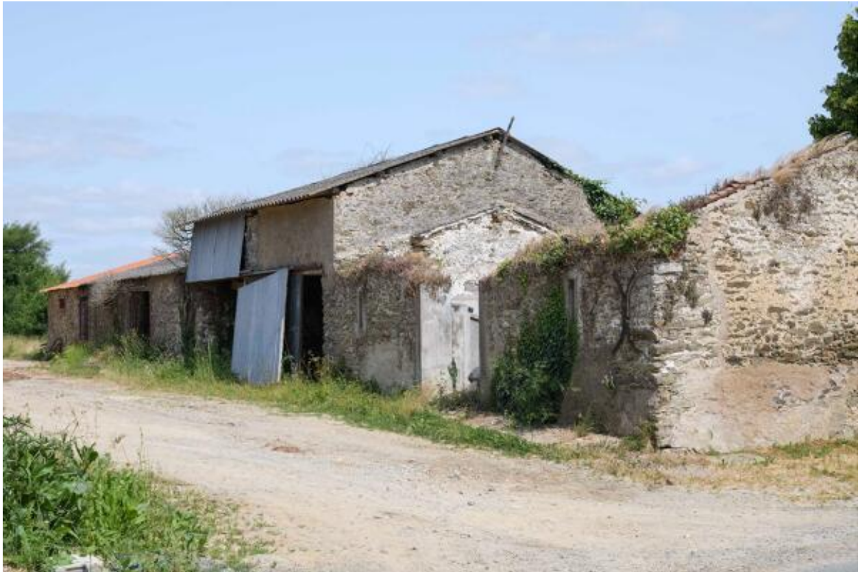
Vue d'ensemble des parties agricoles du XIXe siècle situées au nord-ouest, Petite Touche Fleury.