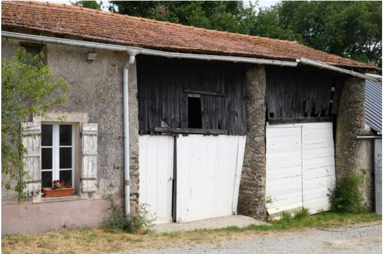
Détail de la grange à piliers ronds accolée au logis de la Petite Touche Fleury.