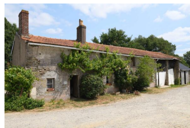
Vue d'ensemble de la façade sud du logis de la Petite Touche Fleury.