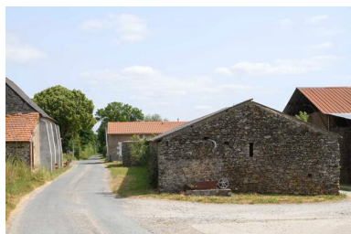
Vue du pignon sud de l'étable, Touche Fleury.