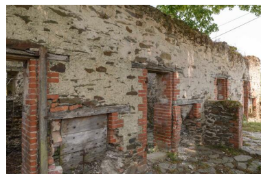
Détail de la façade principale du toit à porcs de la Petite Touche Fleury. IVR52_20254900666NUCA