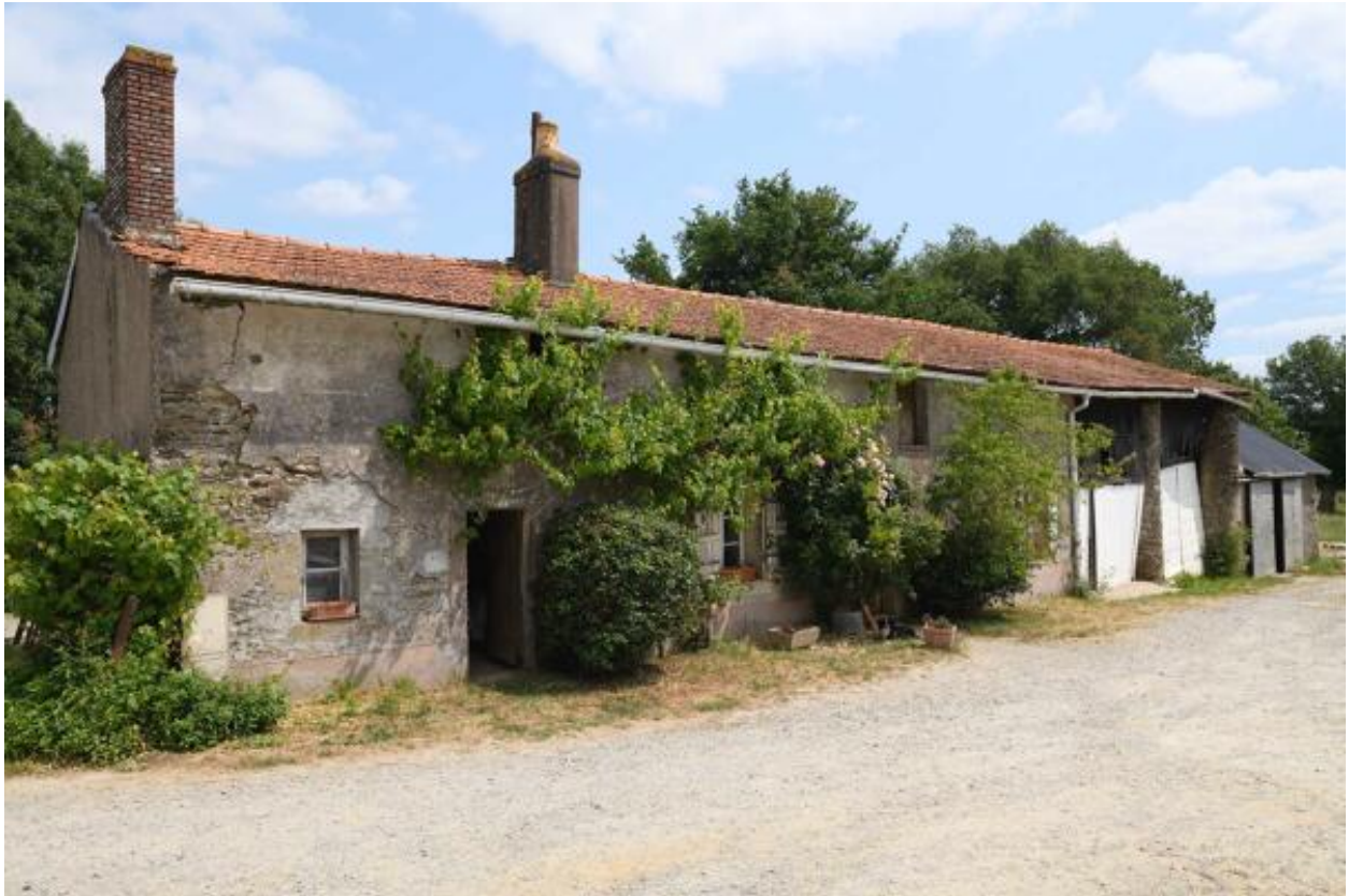
Vue d'ensemble de la façade sud du logis de la Petite Touche Fleury.