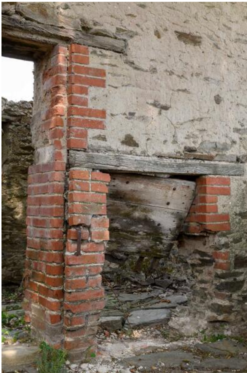
Détail d'une ouverture du toit à porcs de la Petite Touche Fleury.