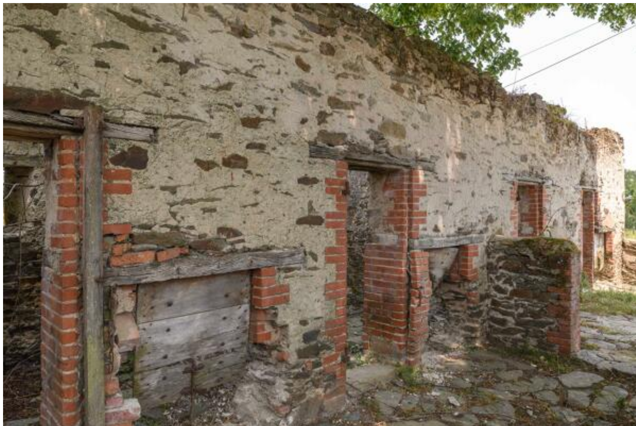
Détail de la façade principale du toit à porcs de la Petite Touche Fleury.