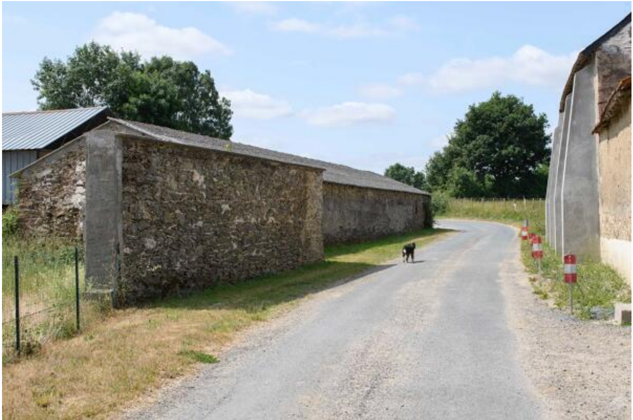
Vue d'ensemble de l'étable allongée de Touche Fleury avec au premier plan un reste du mur de l'ancienne grange attenante (vestige).