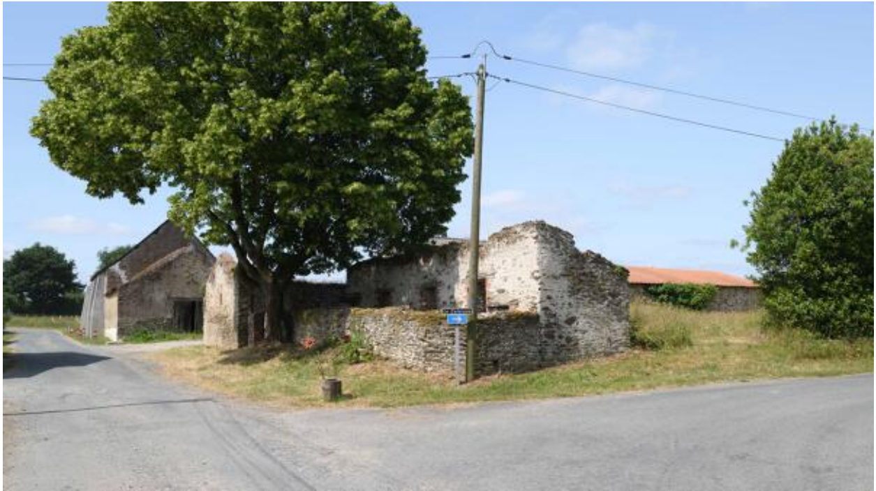
Vue des parties agricoles du XIXe siècle depuis le nord, Petite Touche Fleury.