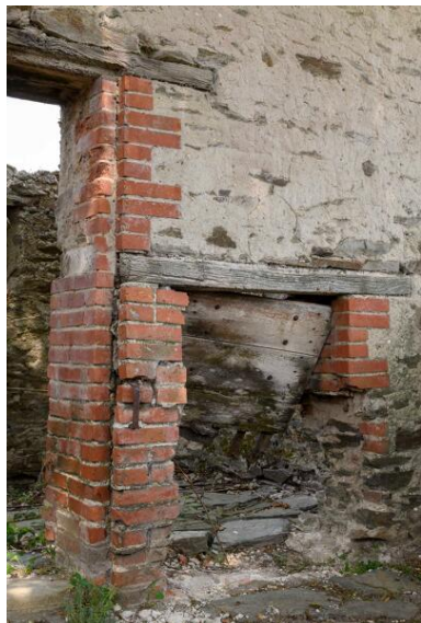
Vue d'ensemble de l'étable allongée de Touche Fleury avec au premier plan un reste du mur de l'ancienne grange attenante (vestige). IVR52_20254900656NUCA