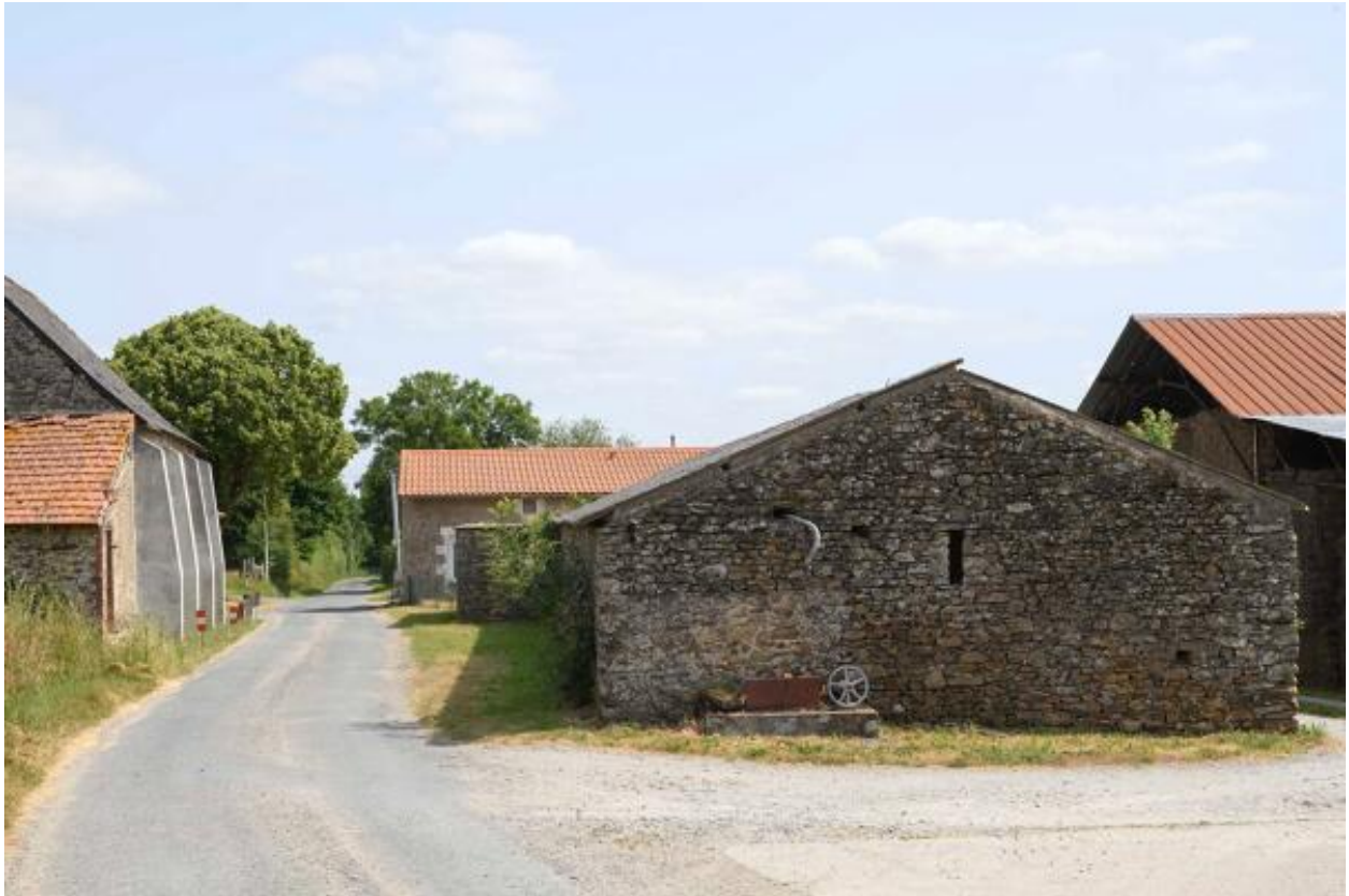
Vue du pignon sud de l'étable, Touche Fleury.