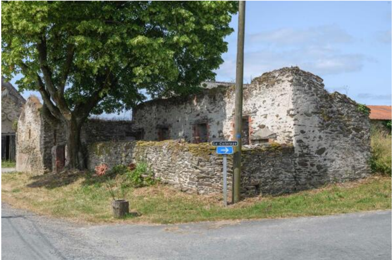
Toit à porcs de la Petite Touche Fleury.