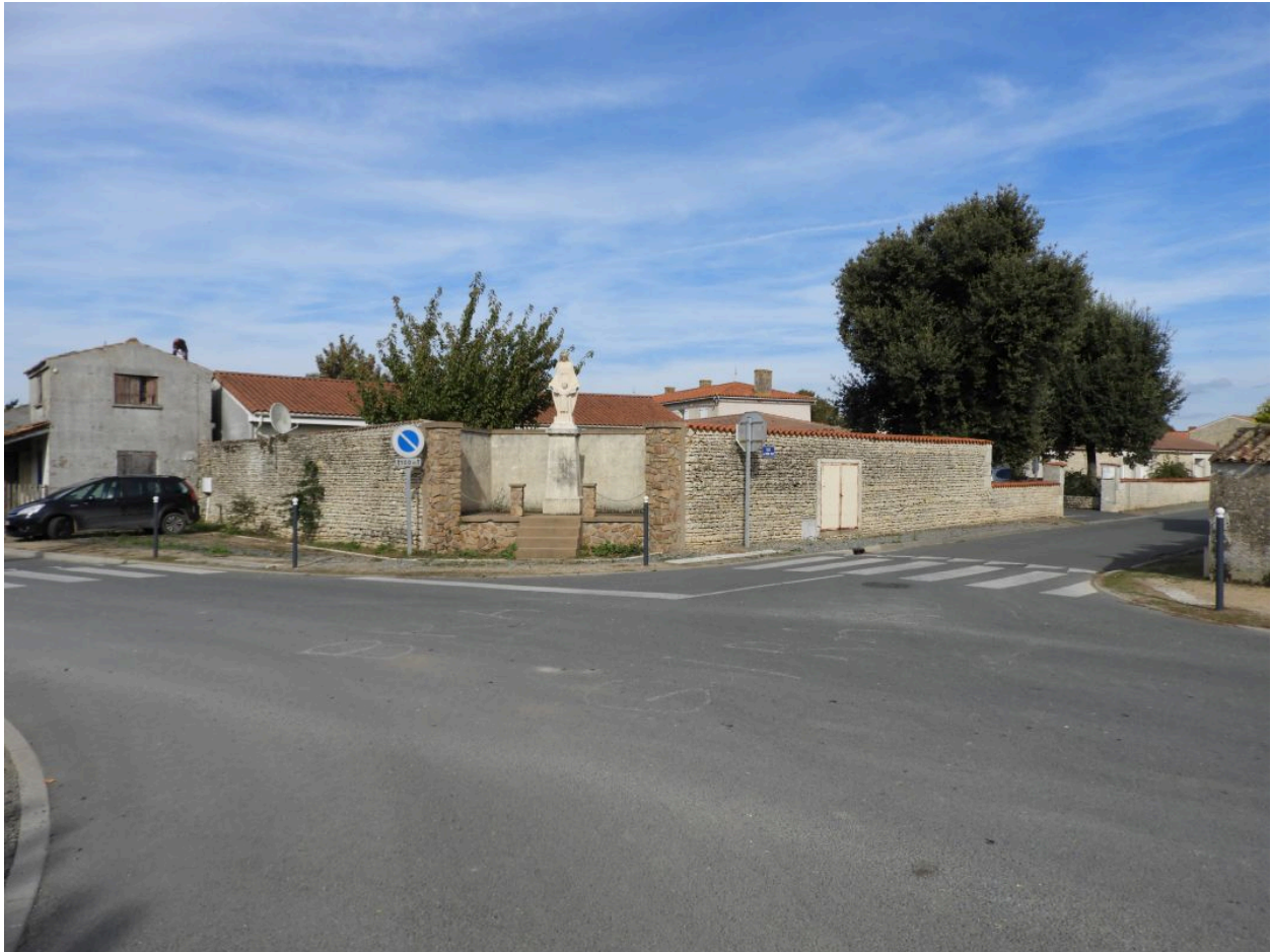
L'oratoire, à l'angle de rues, vu depuis le sud-ouest.