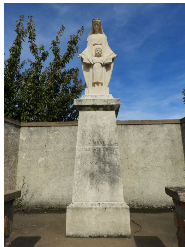
La statue au sommet de son socle.