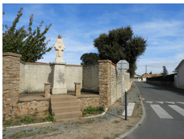
L'oratoire vu depuis l'ouest.