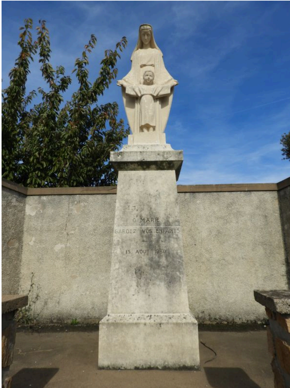
La statue au sommet de son socle.