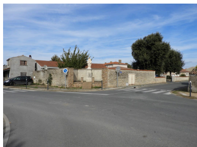
L'oratoire, à l'angle de rues, vu depuis le sud-ouest. IVR52_20188500078NUCA