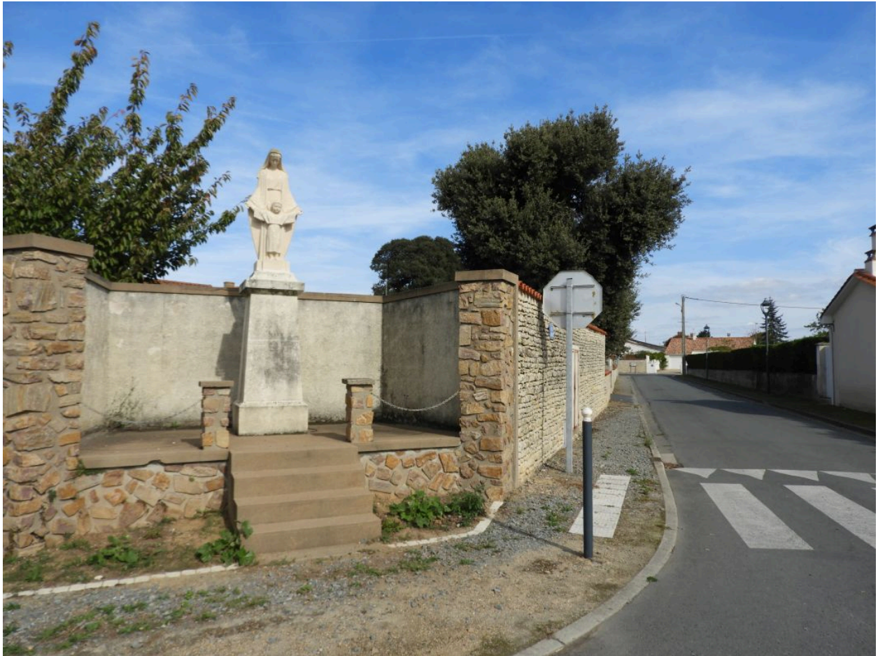
L'oratoire vu depuis l'ouest.