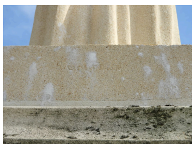
La signature sur la base de la statue.