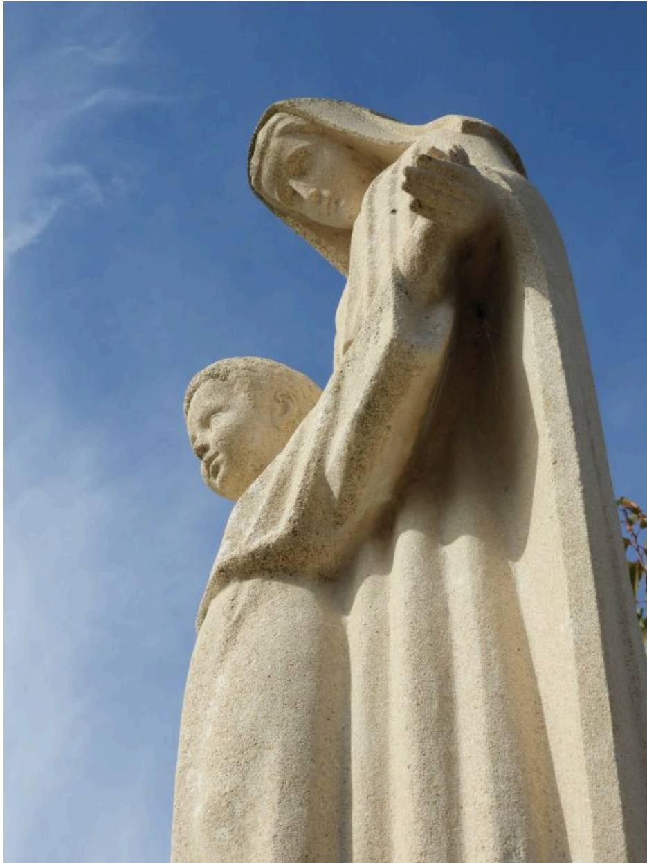
Détail de la statue.