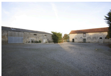
La première et la seconde étables-granges vues depuis la cour au sud-ouest.

IVR52_20065302715NUCA