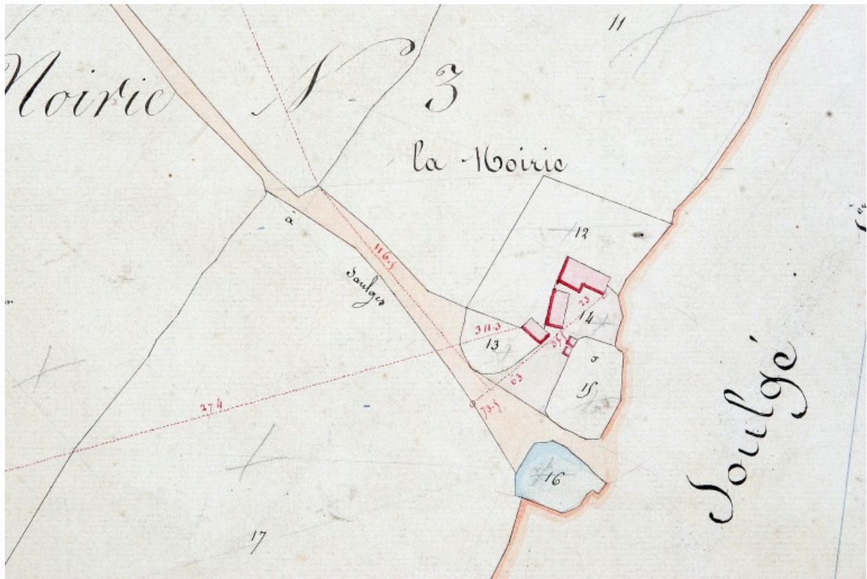
Extrait du plan cadastral de 1838, section A1.