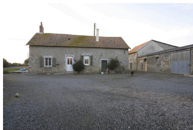
Le logis et la première étable-grange vus depuis la cour à l'est.

IVR52_20065302715NUCA