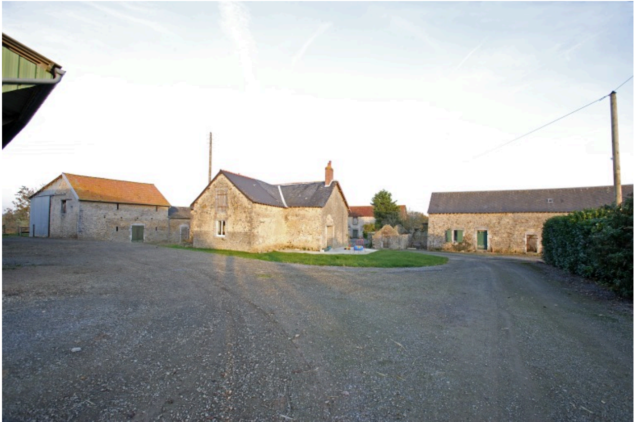
La première étable-grange, le logis et la porcherie vus depuis l'entrée de la ferme à l'ouest.