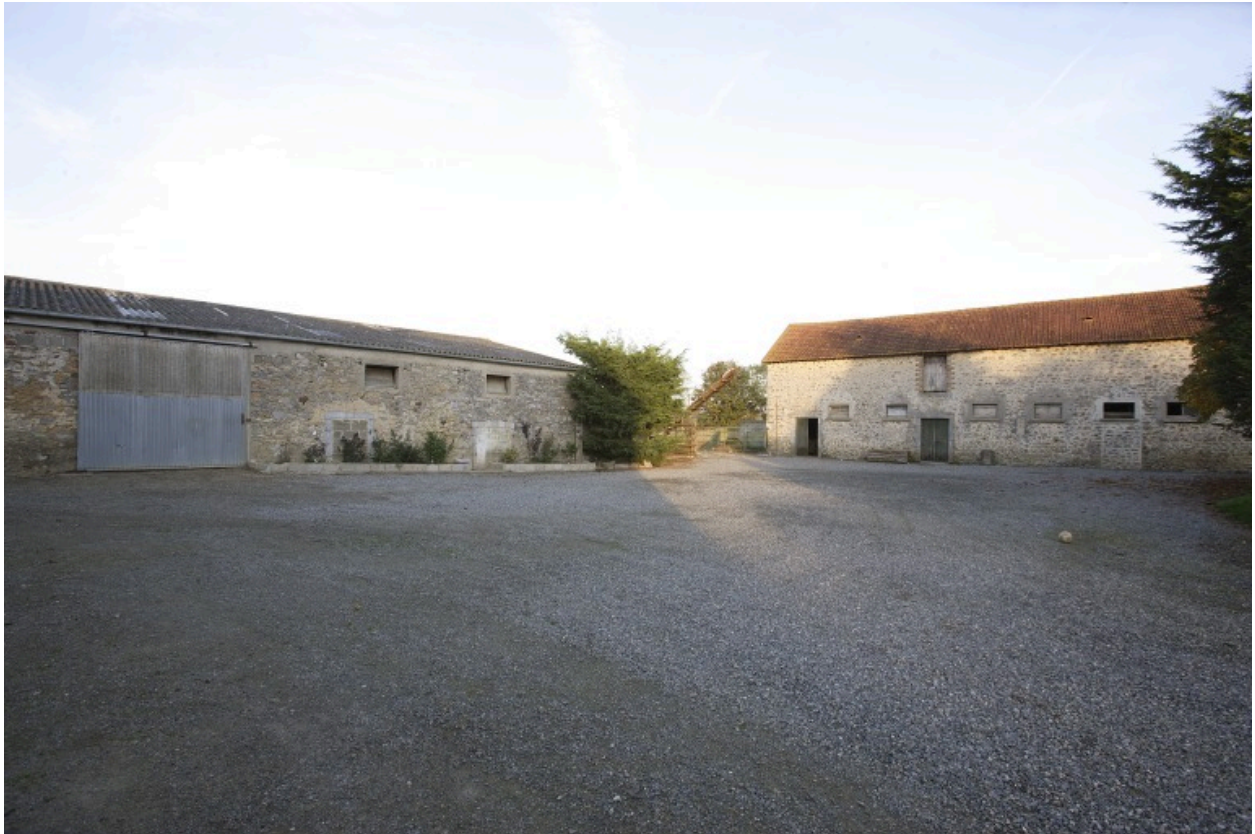
La première et la seconde étables-granges vues depuis la cour au sud-ouest.