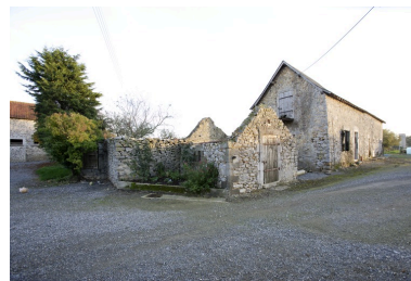
Le puits, une dépendance ruinée et la porcherie vus depuis le nord-ouest.

IVR52_20065302714NUCA