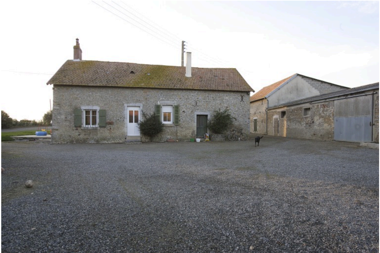
Le logis et la première étable-grange vus depuis la cour à l'est.