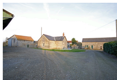
La première étable-grange, le logis et la porcherie vus depuis l'entrée de la ferme à l'ouest. IVR52_20065302713NUCA