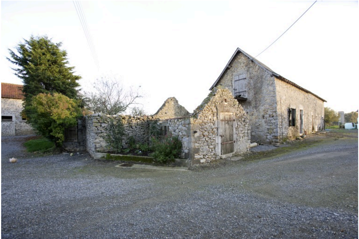
Le puits, une dépendance ruinée et la porcherie vus depuis le nord-ouest.