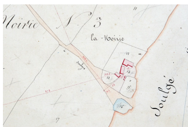
Extrait du plan cadastral de 1838, section A1. IVR52_20065302250NUCA