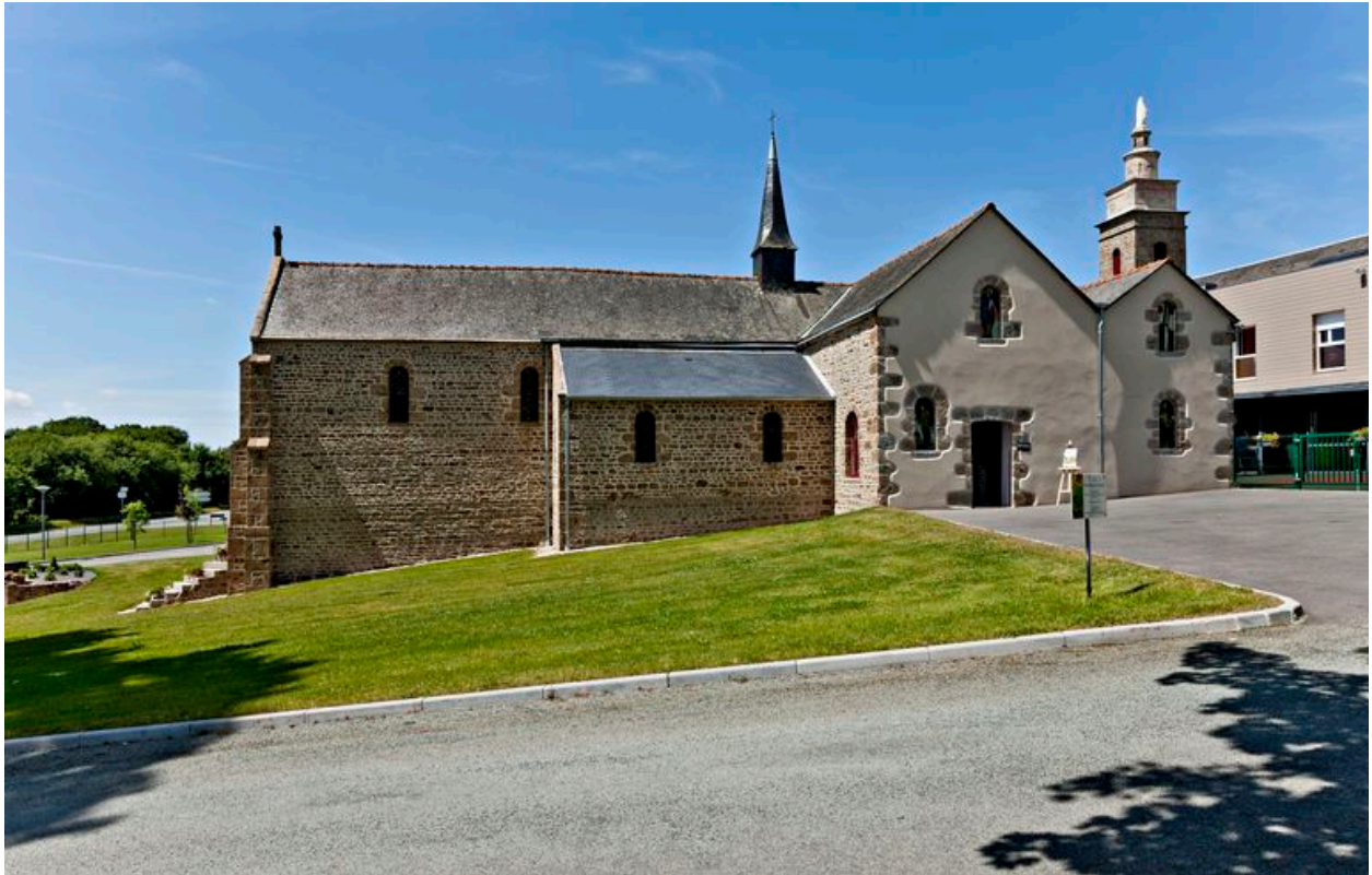
La chapelle vue depuis l'est.