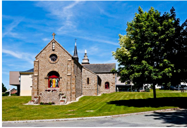
La chapelle vue depuis le sud. IVR52_20155300068NUCA