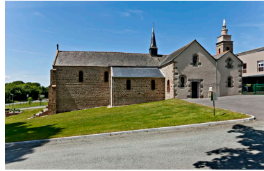
La chapelle vue depuis l'est.