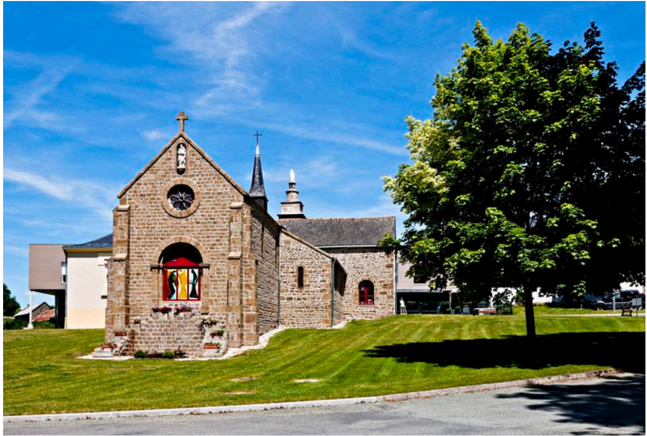
La chapelle vue depuis le sud.