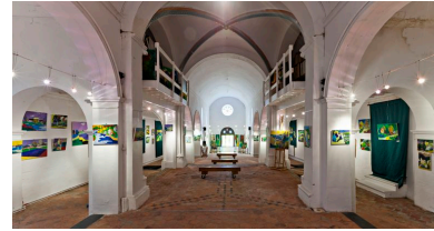
Vue intérieure de la chapelle depuis le chœur vers la nef.