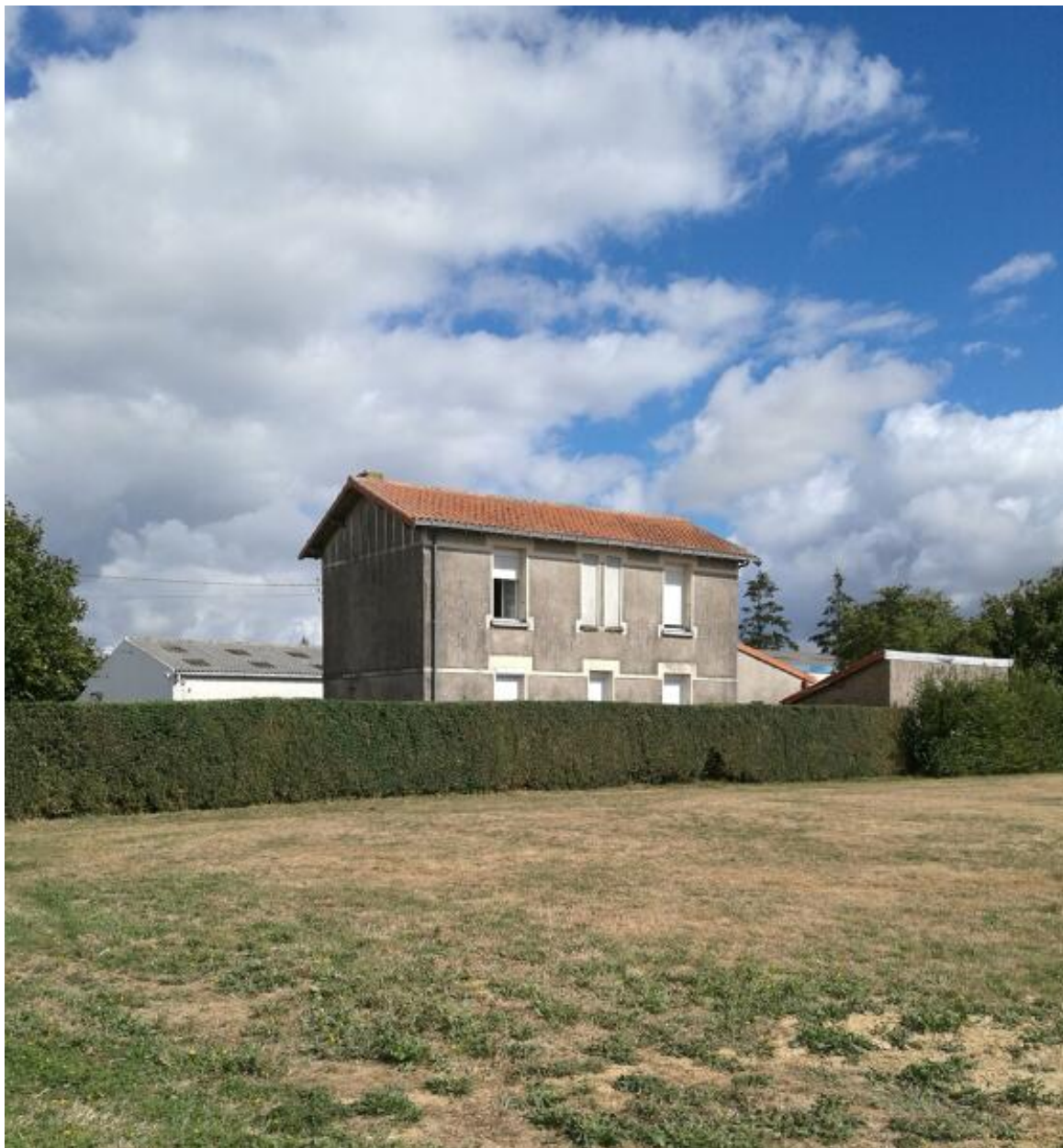
Vue du logement patronal depuis le sud.