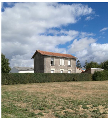
Vue du logement patronal depuis le sud.