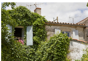
Détail de la façade sud (partie droite du dernier niveau). IVR52_20098500307NUCA