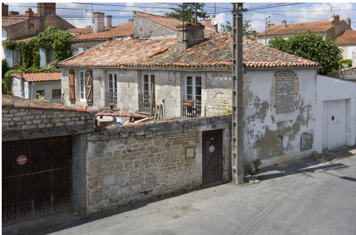
Maison du XVIIIe siècle 8, rue Gâte-Bourses. Il s'agit peut-être de l'appartement où le chanoine Gogot voulait faire un salon de compagnie.