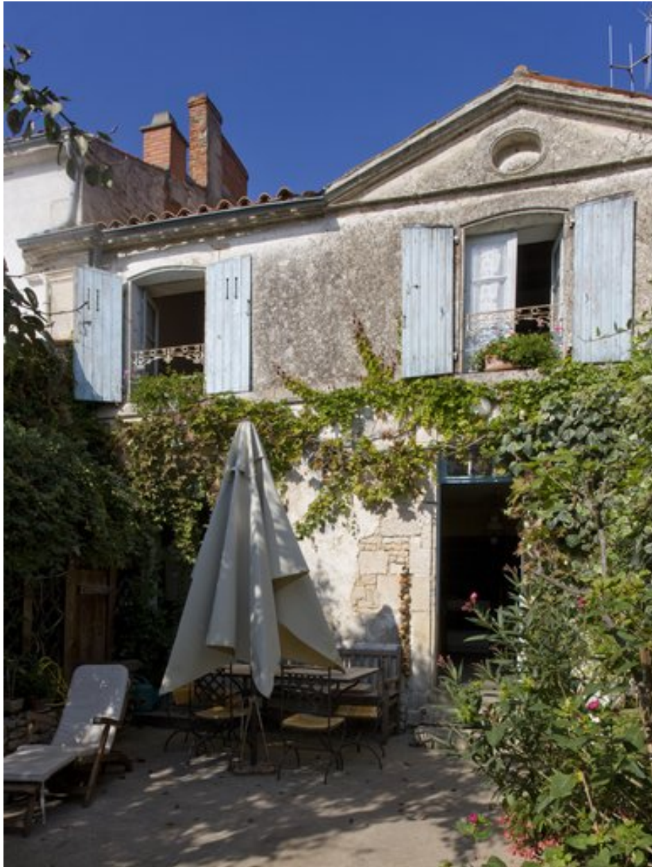
Vue de la façade principale, donnant au sud.