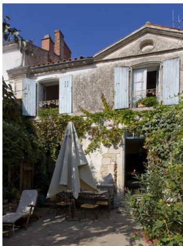
Vue de la façade principale, donnant au sud.