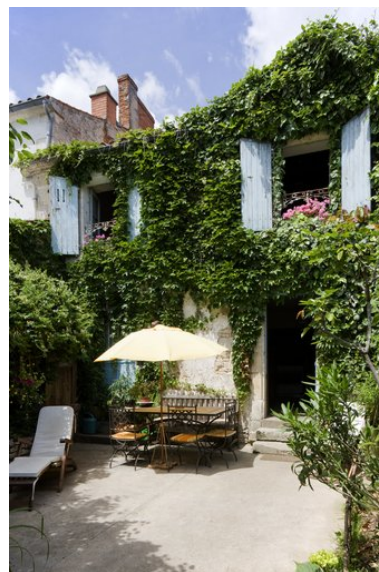
Vue de la façade principale, donnant au sud (vue prise pendant l'été).