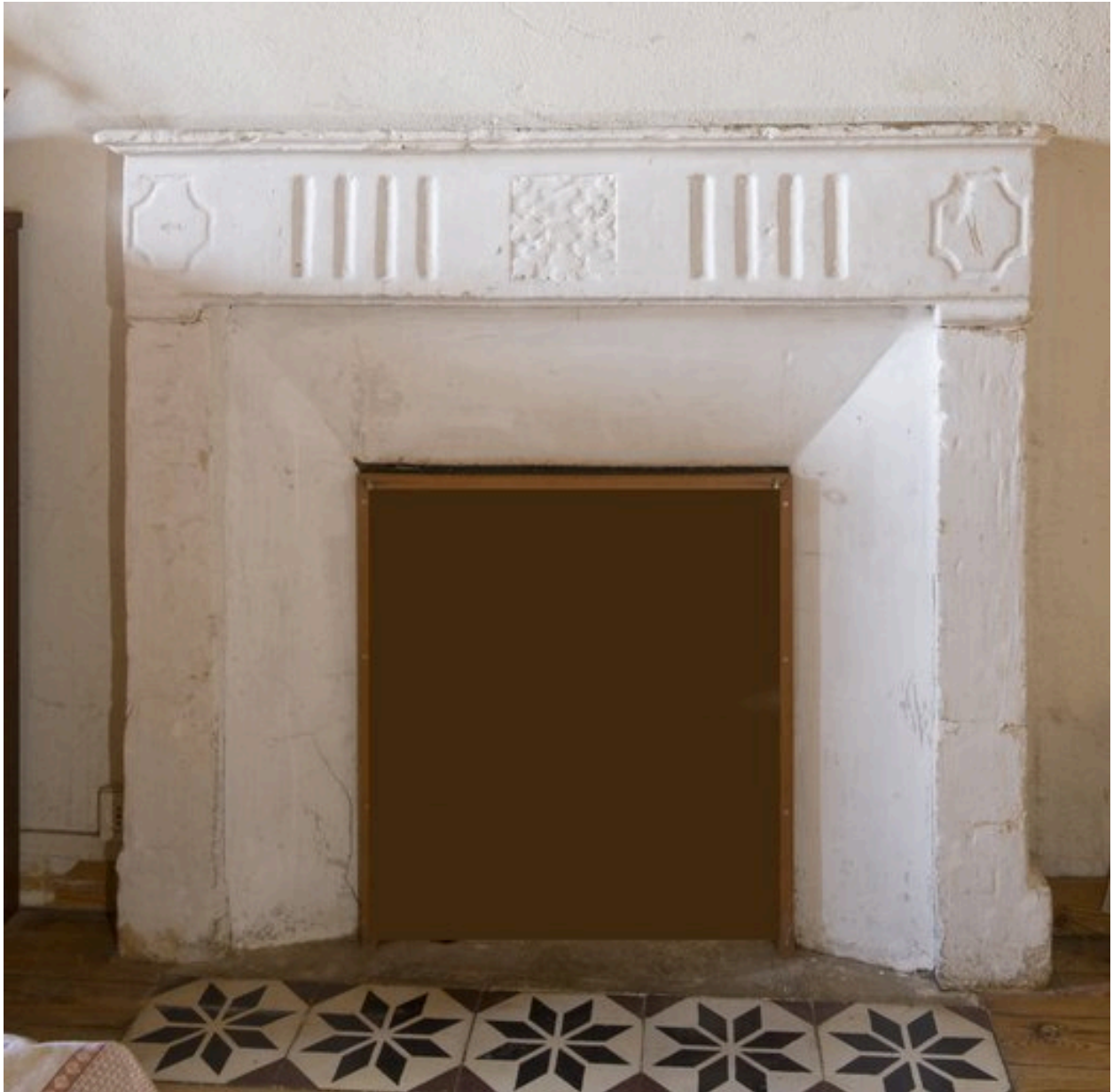
Cheminée de l'une des chambres du premier étage.