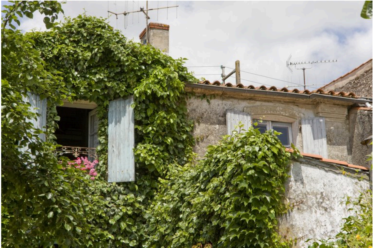
Détail de la façade sud (partie droite du dernier niveau).