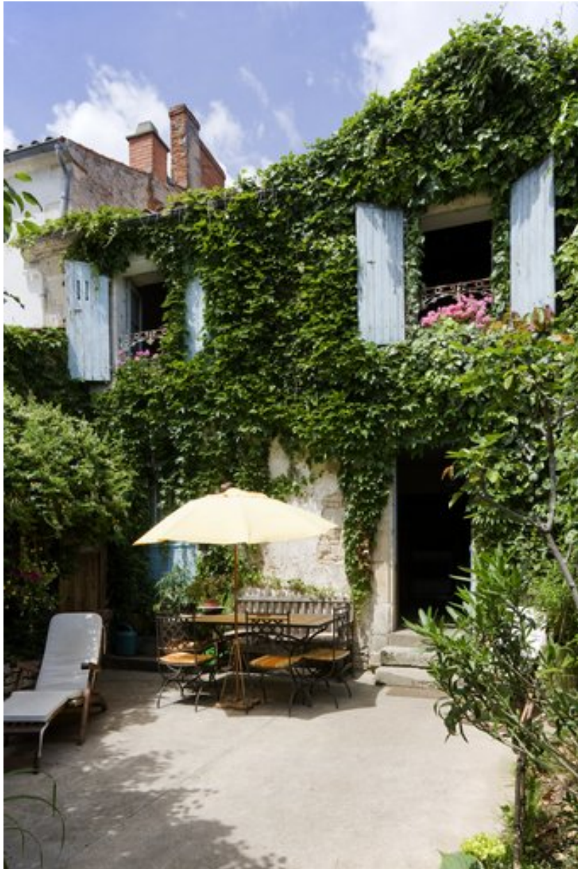
Vue de la façade principale, donnant au sud (vue prise pendant l'été).