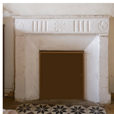
Cheminée de l'une des chambres du premier étage. IVR52_20098500308NUCA