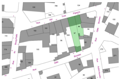
La maison sur le plan cadastral actuel. IVR52_20118500982NUDA