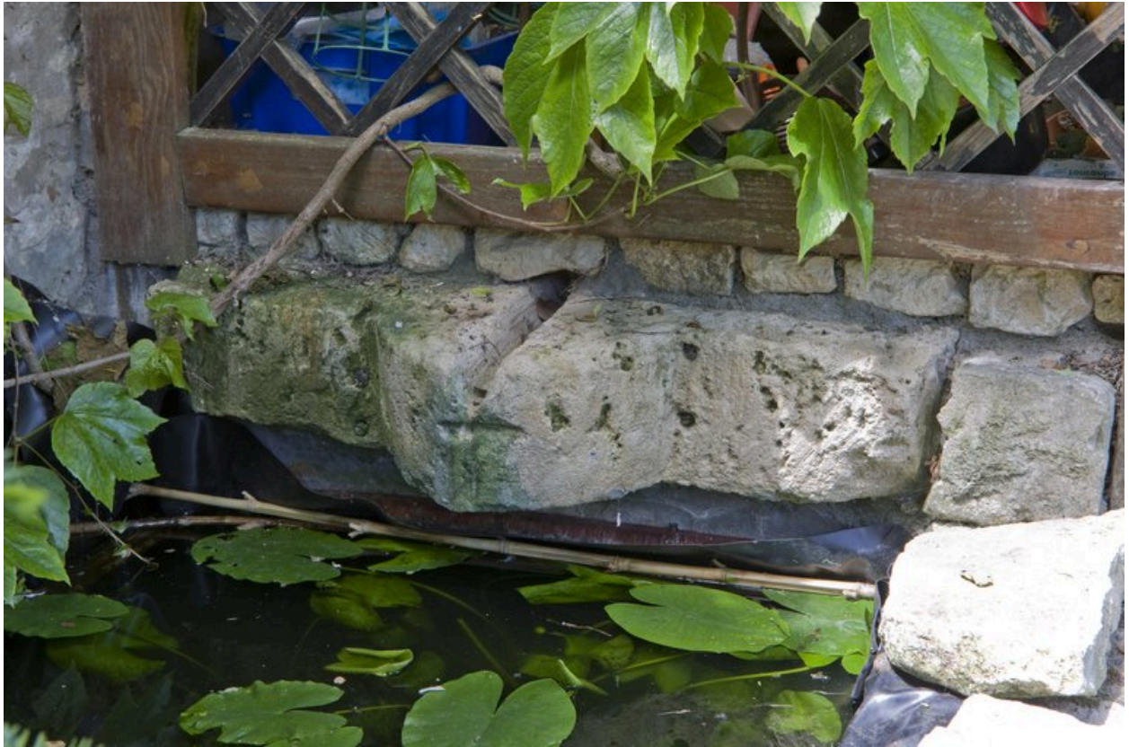
Pierre d'évier, du côté ouest de la maison.