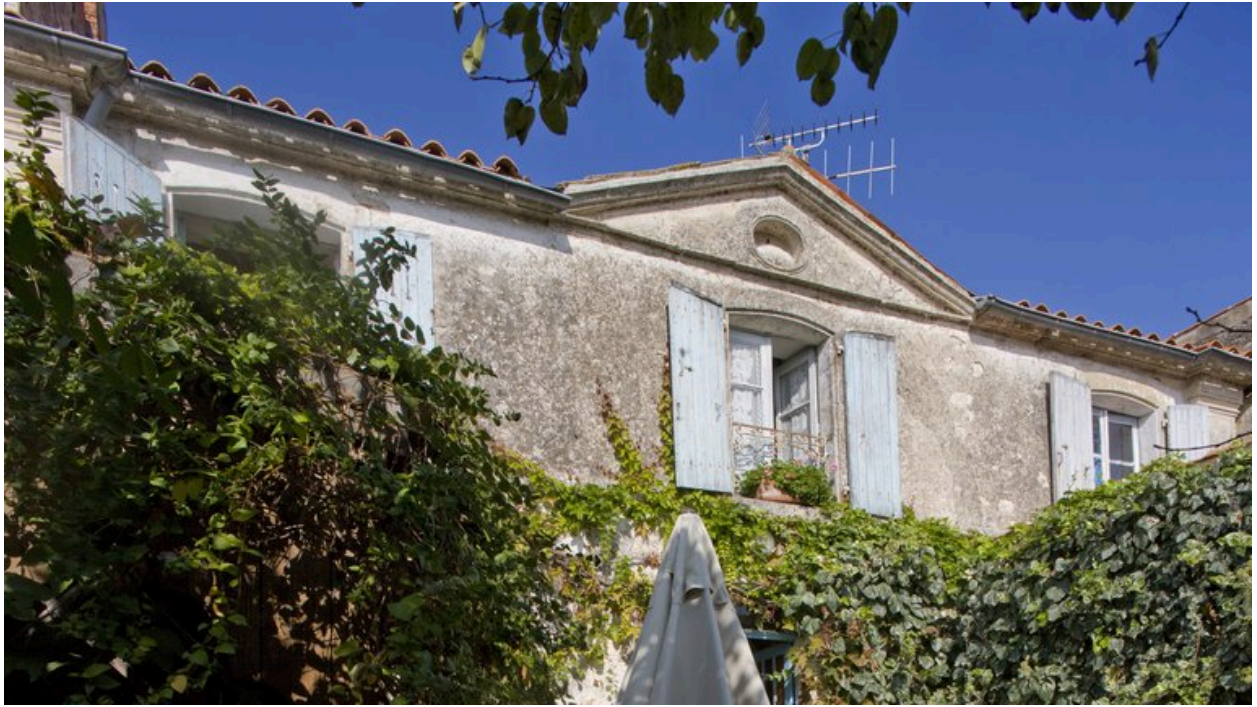
Partie supérieure de la façade sur cour.