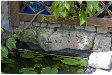
Pierre d'évier, du côté ouest de la maison. IVR52_20098500309NUCA