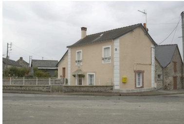
Vue depuis la route de Chéméré. IVR52_20045303312NUCA