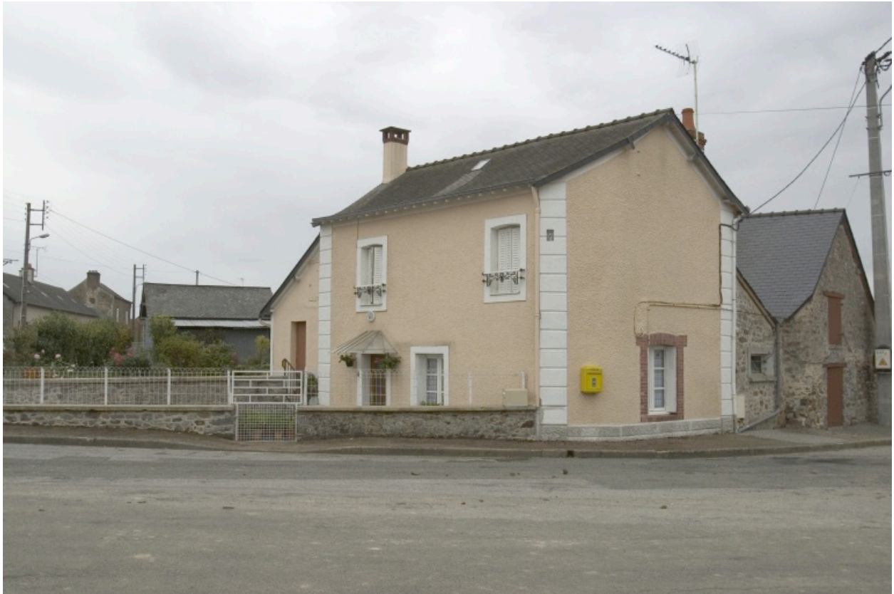
Vue depuis la route de Chéméré.