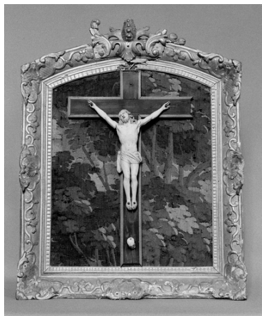
Croix encadrée, vue d'ensemble.