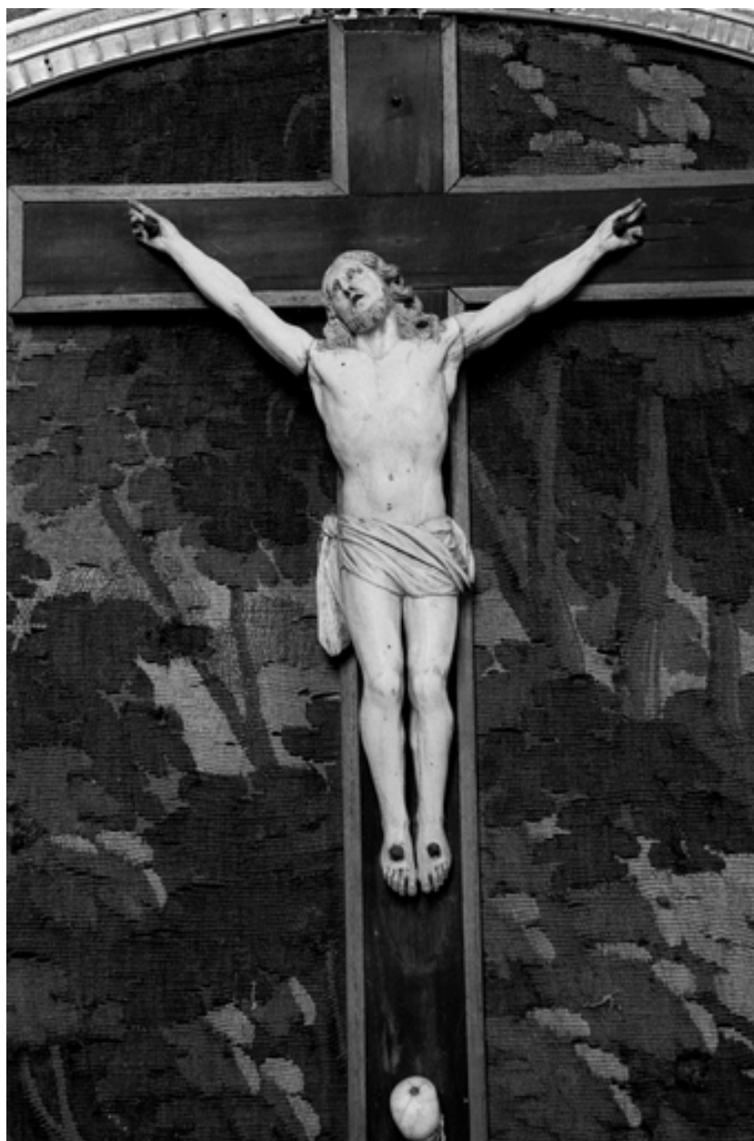
Détail du Christ.