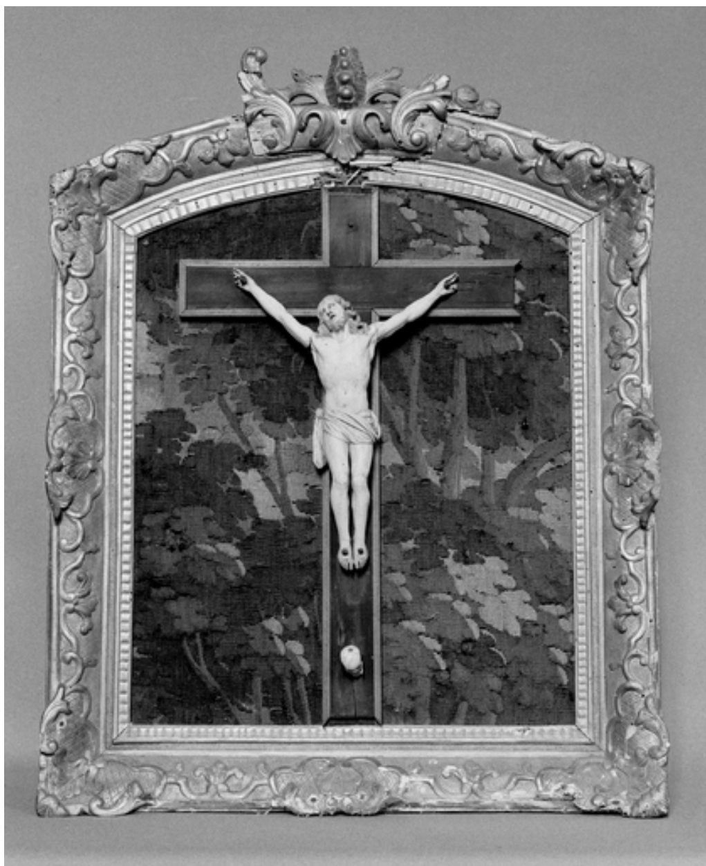
Croix encadrée, vue d'ensemble.