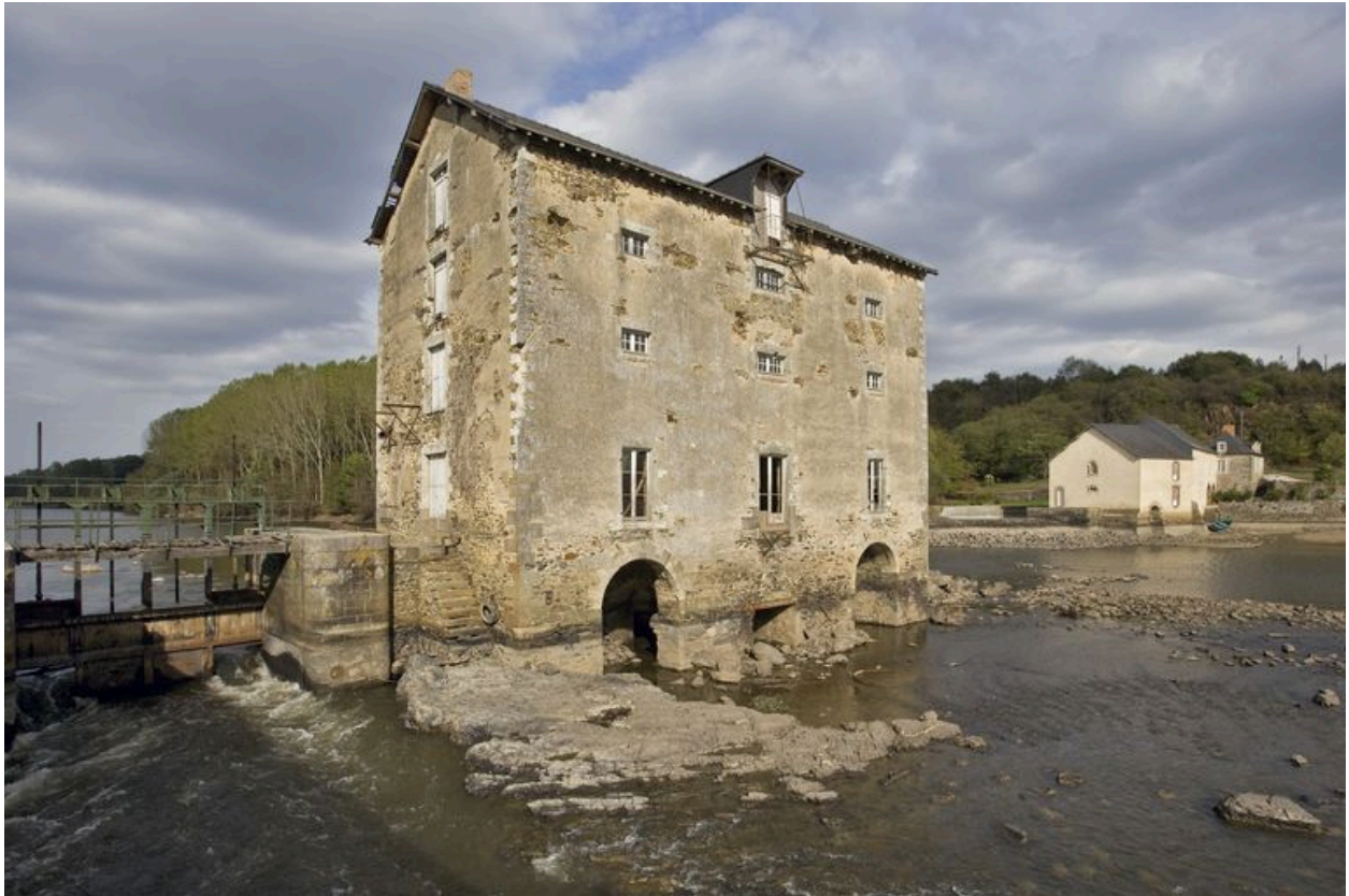
Vue de trois-quarts depuis l'écluse en aval, pendant les écourues de 2009 : façades ouest et sud. A gauche, le pertuis ; à droite le moulin situé rive gauche (à Fromentières).