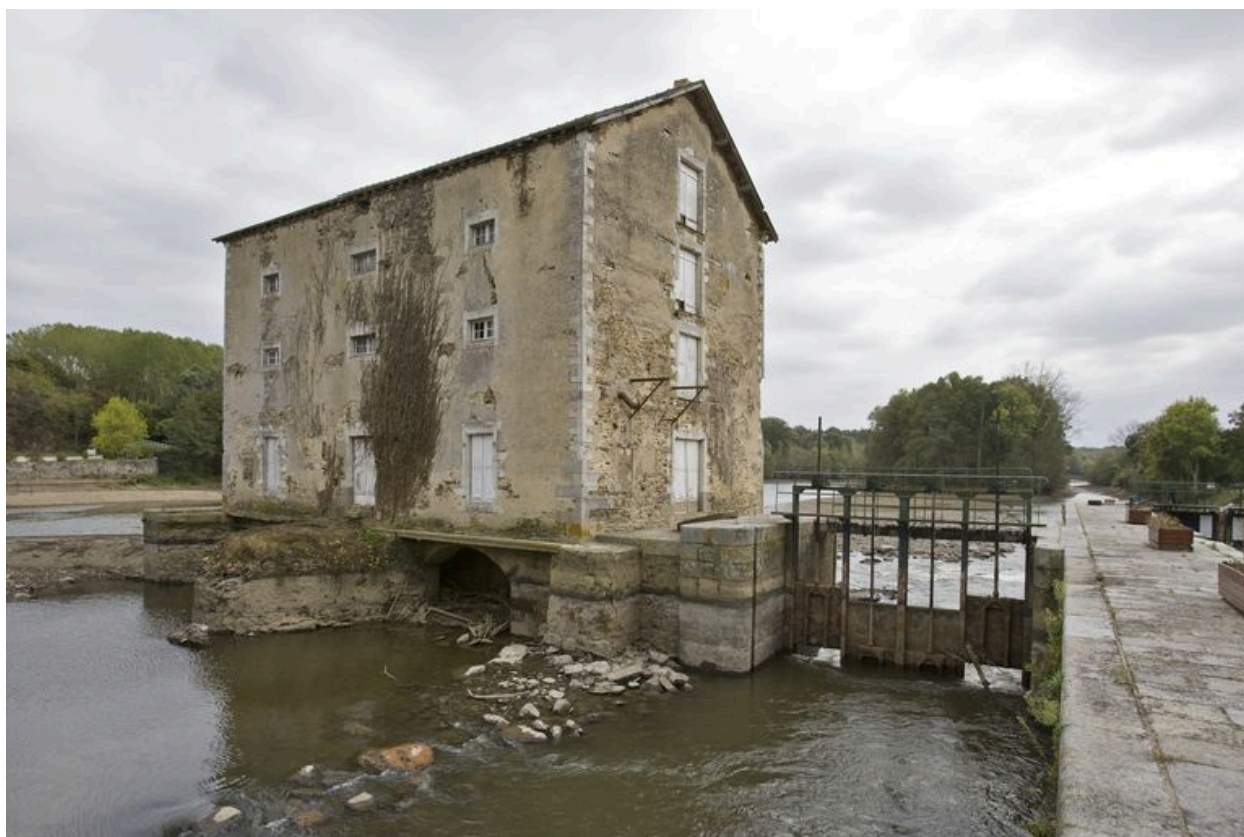
Vue de trois-quarts depuis l'écluse en amont, pendant les écourues de 2009 : façades nord et ouest, pertuis.