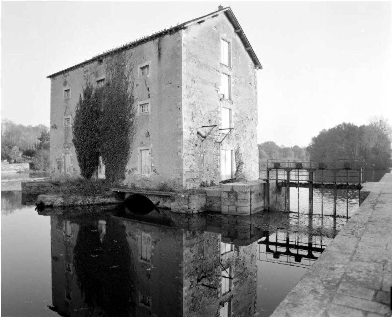
Vue de trois-quarts depuis l'écluse en amont : façades nord et ouest, pertuis.