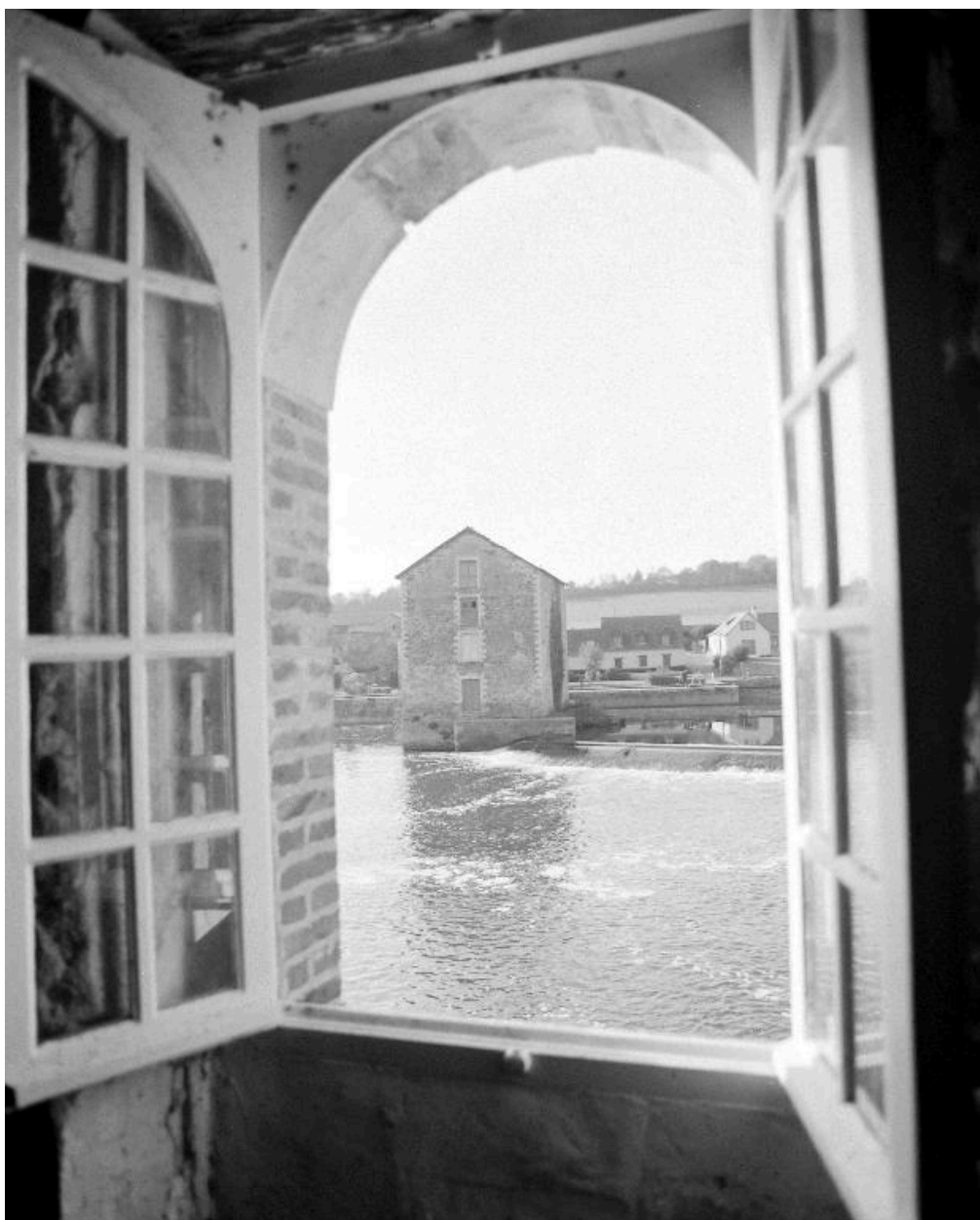
Vue depuis le premier étage du moulin situé rive gauche à Fromentières : façade ouest et anciennes dépendances (défigurées).