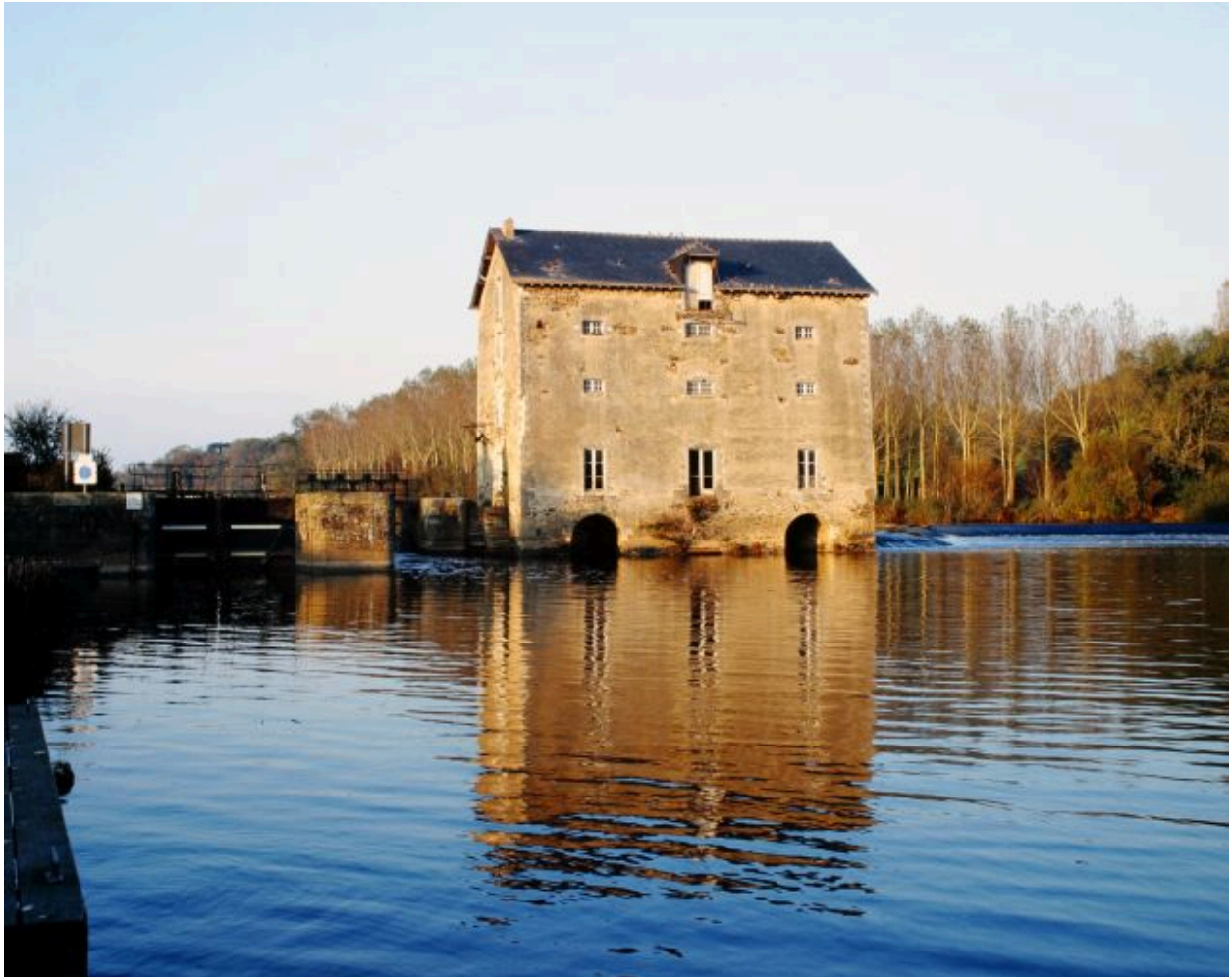
Vue depuis la rive droite en aval : écluse, pertuis, façade sud.