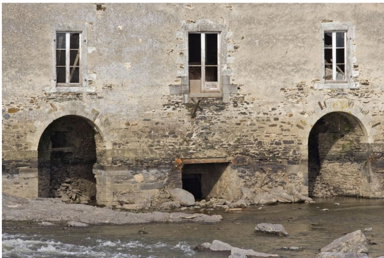
Vue partielle de la façade sud, pendant les écourues de 2009 : sorties des deux coursiers latéraux (où prenaient place les roues hydrauliques), et du coursier central (correspondant à la turbine).