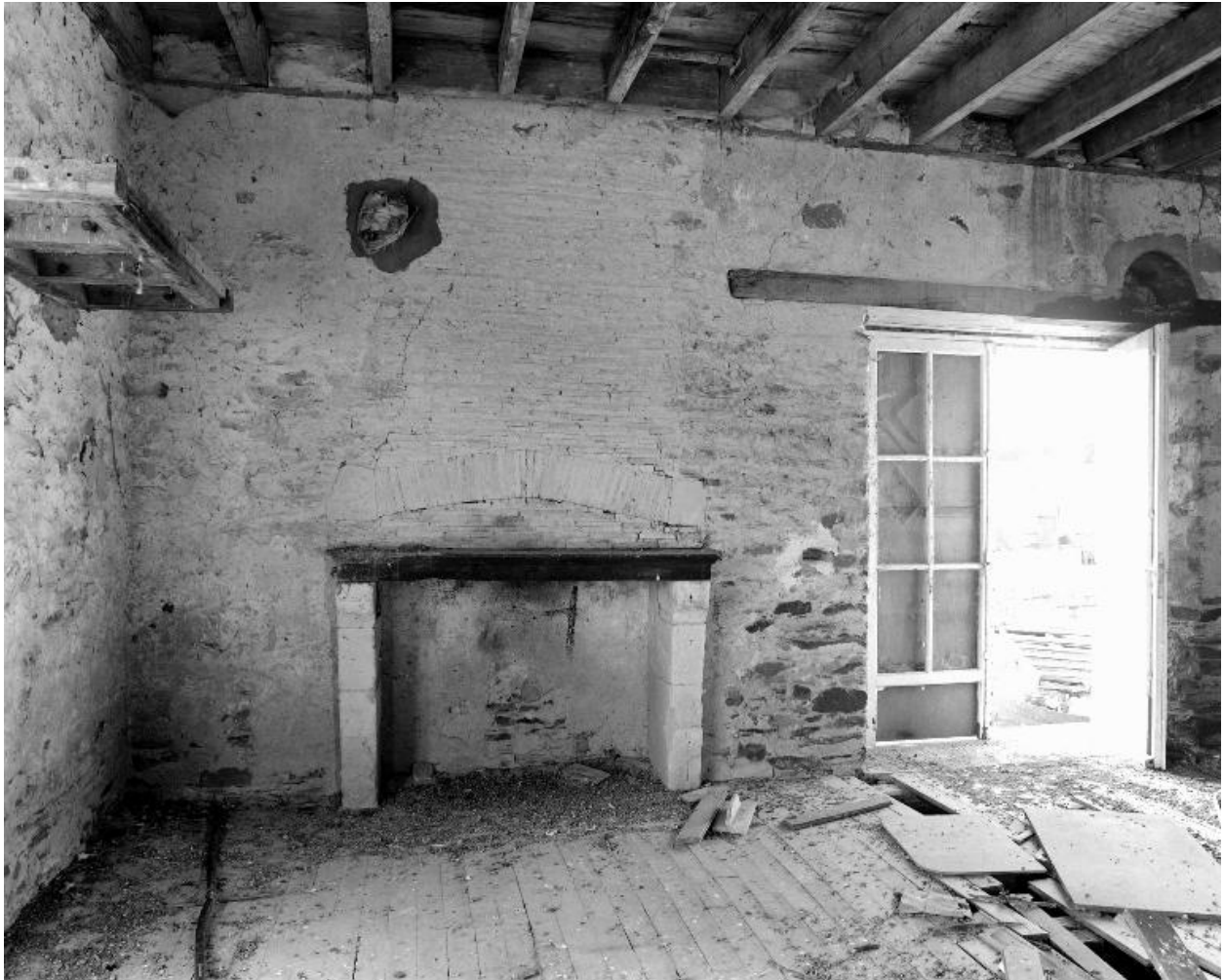
Rez-de-chaussée du moulin : cheminée adossée au mur ouest et porte d'entrée.