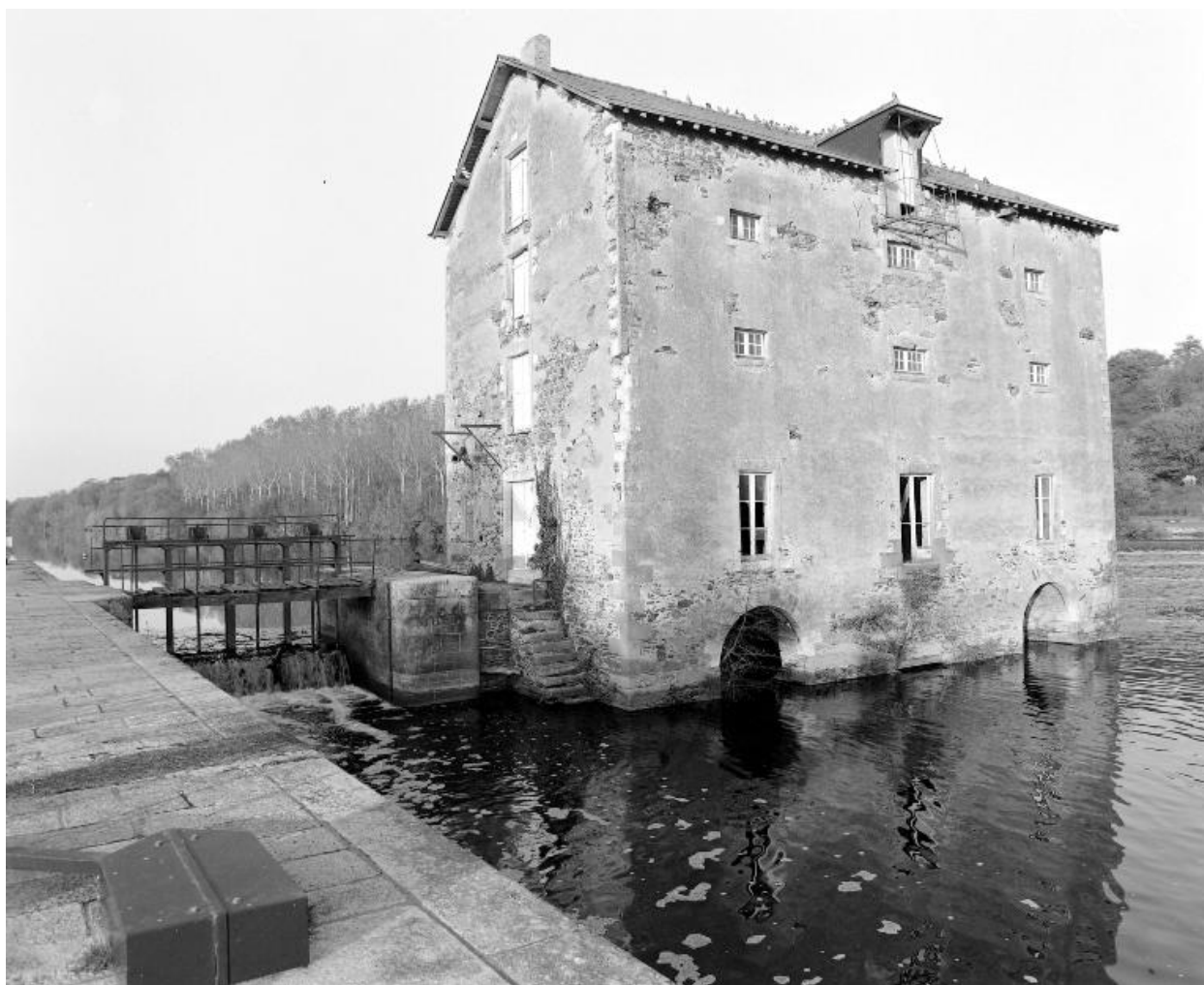
Vue de trois-quarts depuis l'écluse en aval : façades ouest et sud. A gauche, le pertuis.