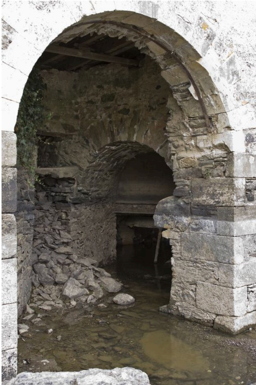
Vue de détail de la façade sud, pendant les écourues de 2009 : sortie du coursier ouest.