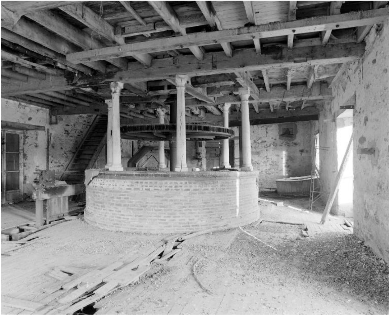
Rez-de-chaussée du moulin : la poquerie où est rassemblée la transmission. A gauche, la vanne d'amont de la turbine.