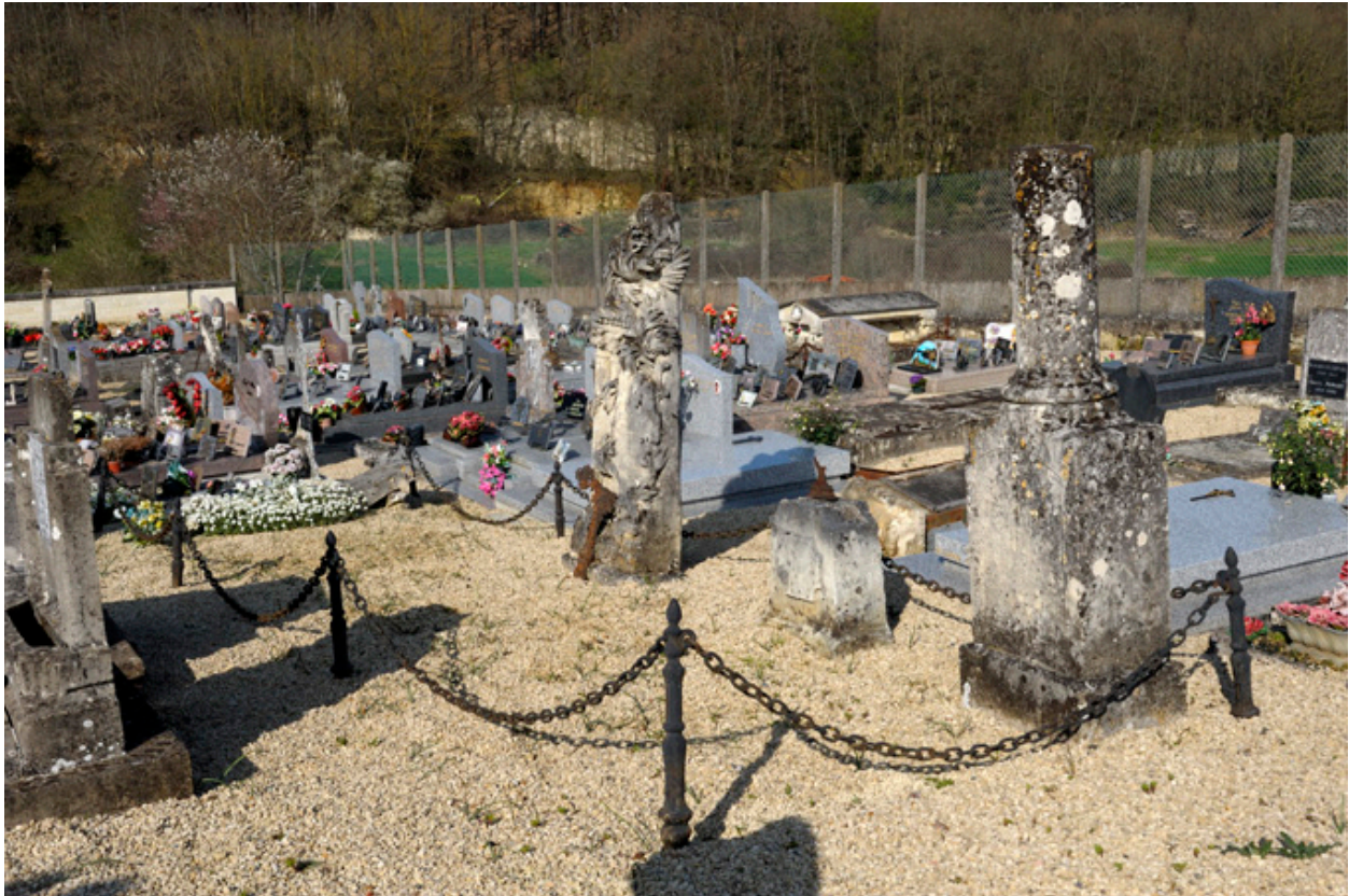
Vue d'ensemble du carré des tombes et du mounment commémoratif.