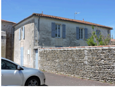
Le presbytère vu depuis le sud-est.