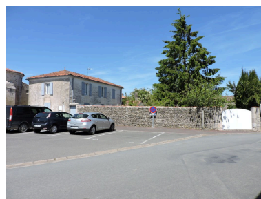
Le presbytère et son jardin clos de murs vus depuis le sud.

Phot. Yannis (reproduction) Suire IVR52_20198501627NUCA