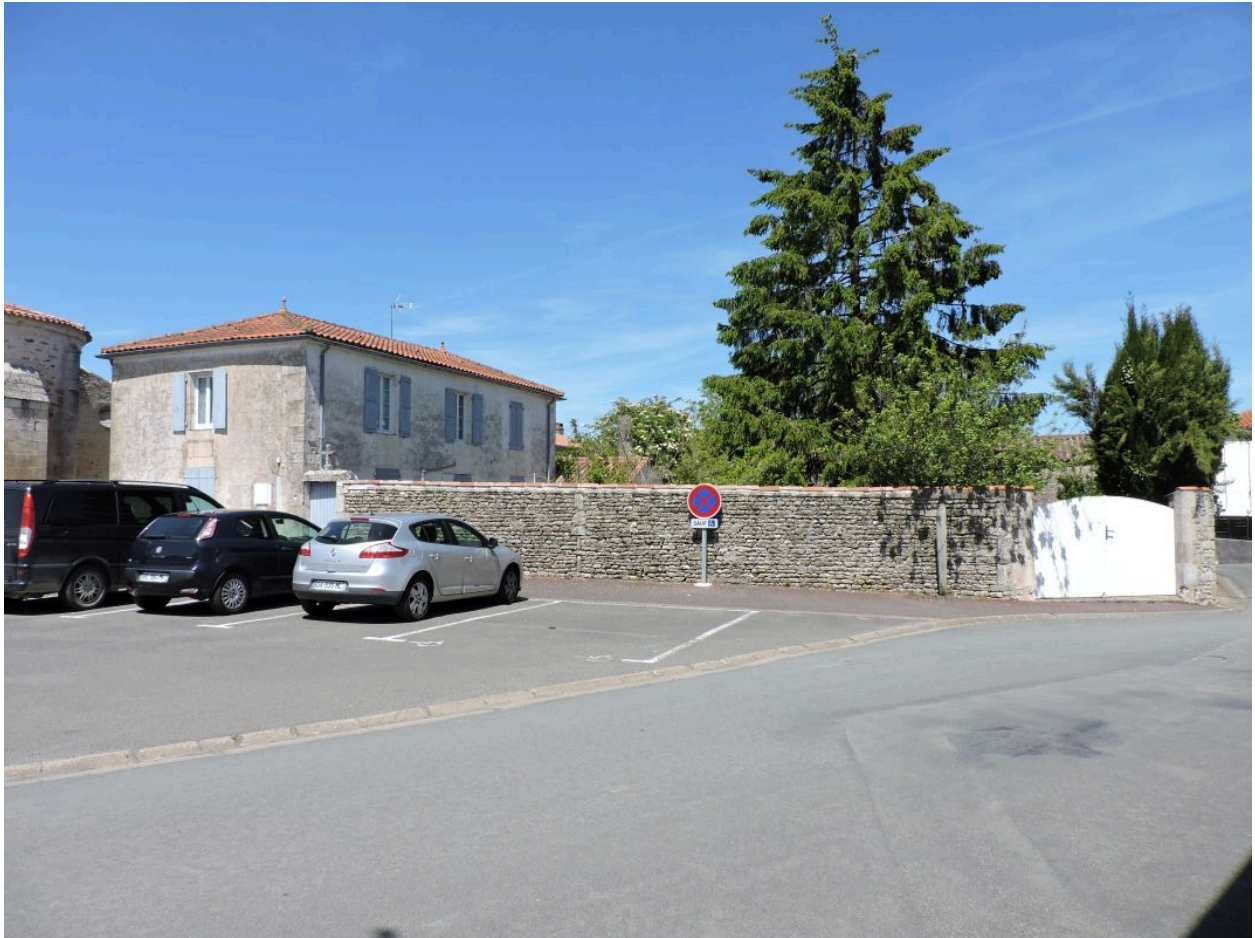
Le presbytère et son jardin clos de murs vus depuis le sud.