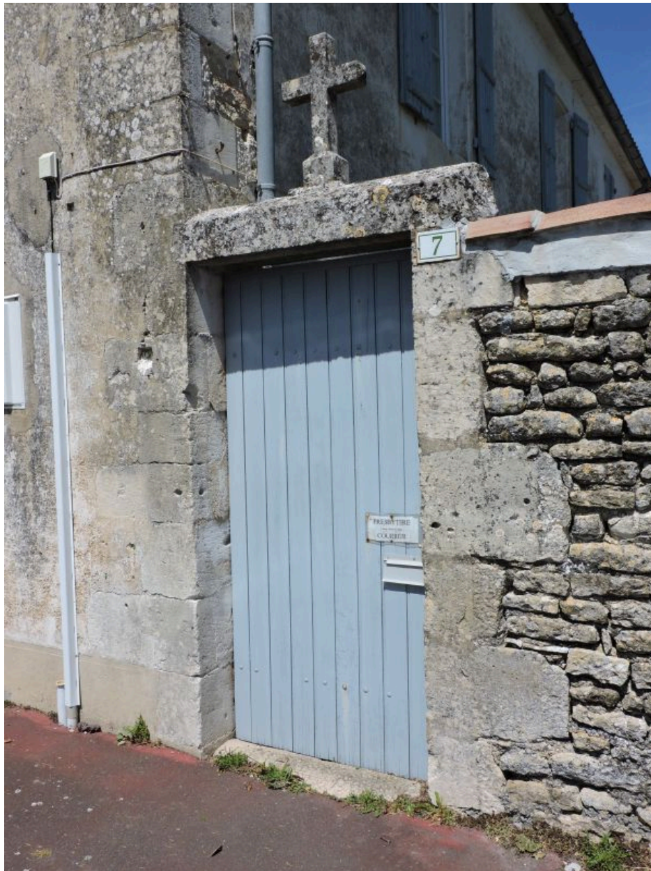
La porte piétonne surmontée d'une croix.