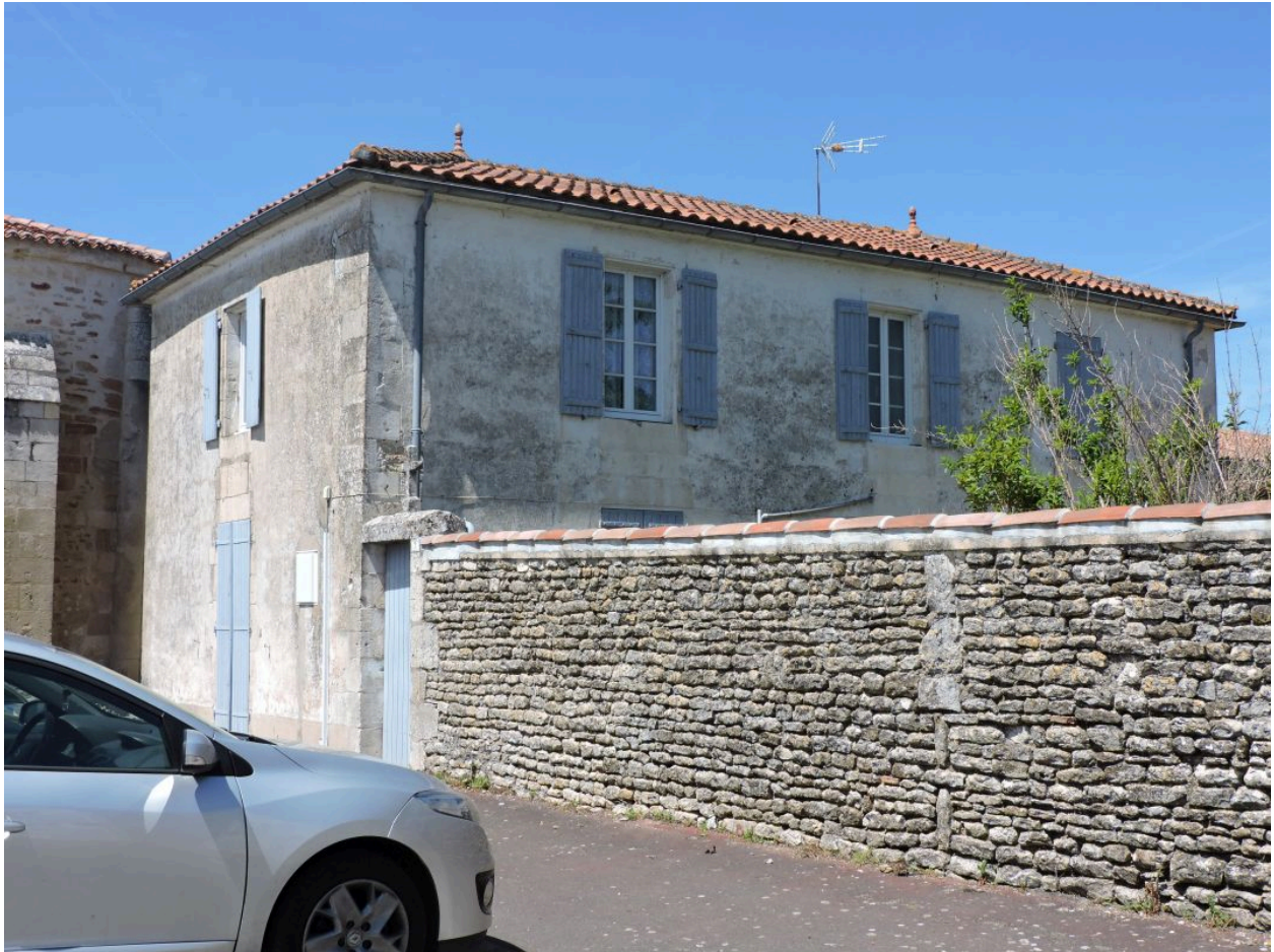
Le presbytère vu depuis le sud-est.