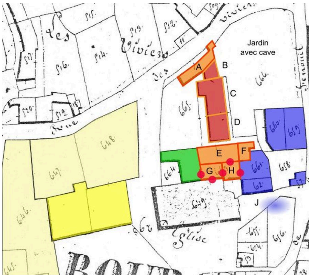
Schéma de répartition des bâtiments de l'ancienne seigneurie de Vix : en violet, l'ancienne métairie seigneuriale.