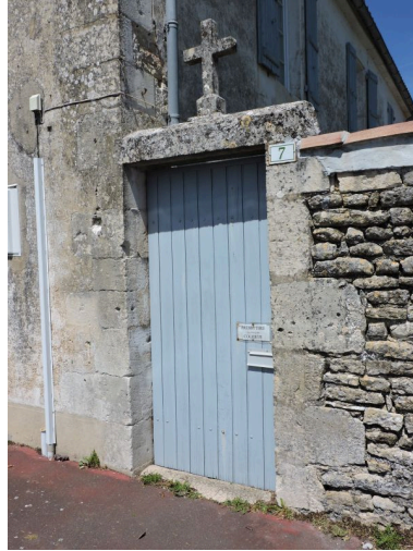
La porte piétonne surmontée d'une croix.