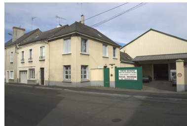
Vue depuis la rue. La maison est la deuxième à gauche.