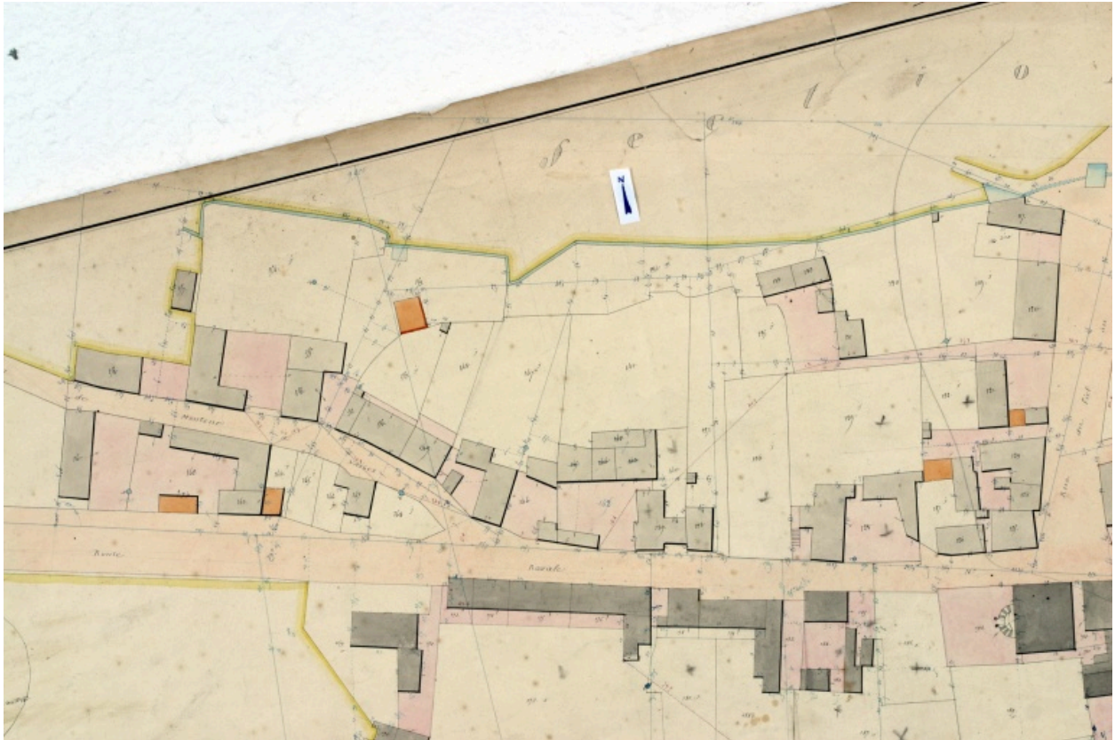
Extrait du plan cadastral de 1842, section E2, développement du bourg.