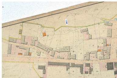
Extrait du plan cadastral de 1842, section E2, développement du bourg.