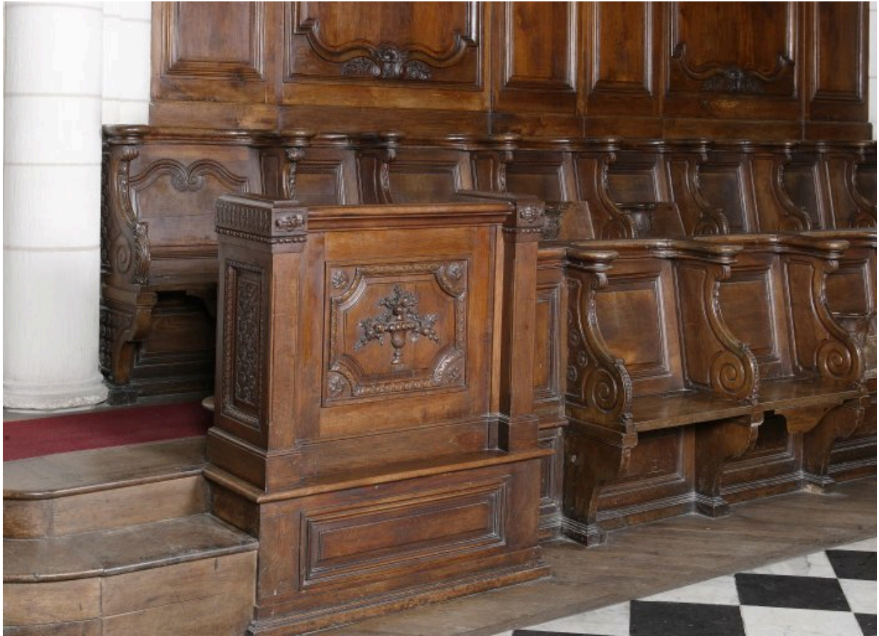
Détail des stalles du côté nord.