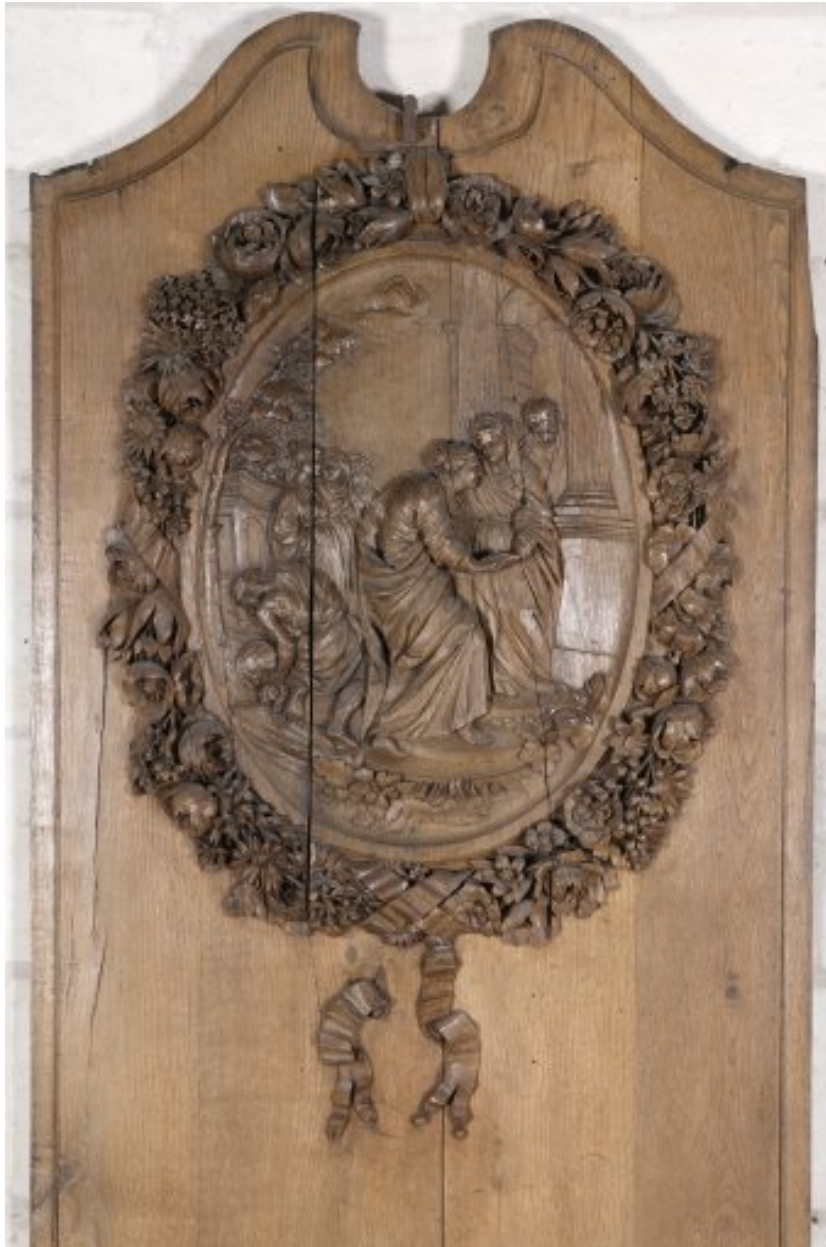
Détail du deuxième panneau du côté sud, déposé et remplacé dans le bas-côté sud du chœur : médaillon avec la Visitation.