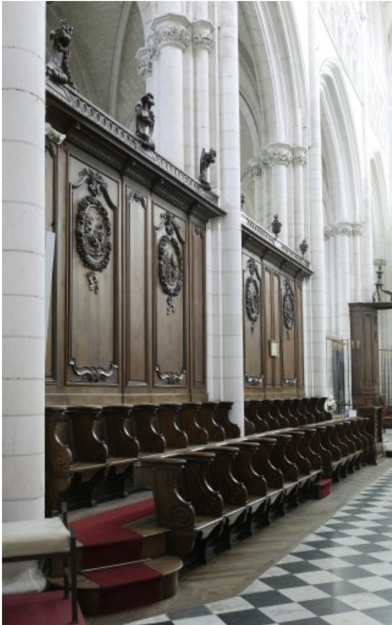
Ensemble des lambris et des stalles du côté nord (vue prise en direction du chevet).