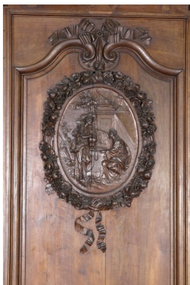
Détail du quatrième panneau du côté nord : médaillon avec la Samaritaine au puits. IVR52_20078500643NUCA