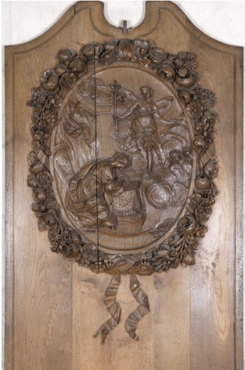
Détail du premier panneau du côté sud, déposé et remplacé dans le bas-côté sud du chœur : médaillon avec l'Annonciation.