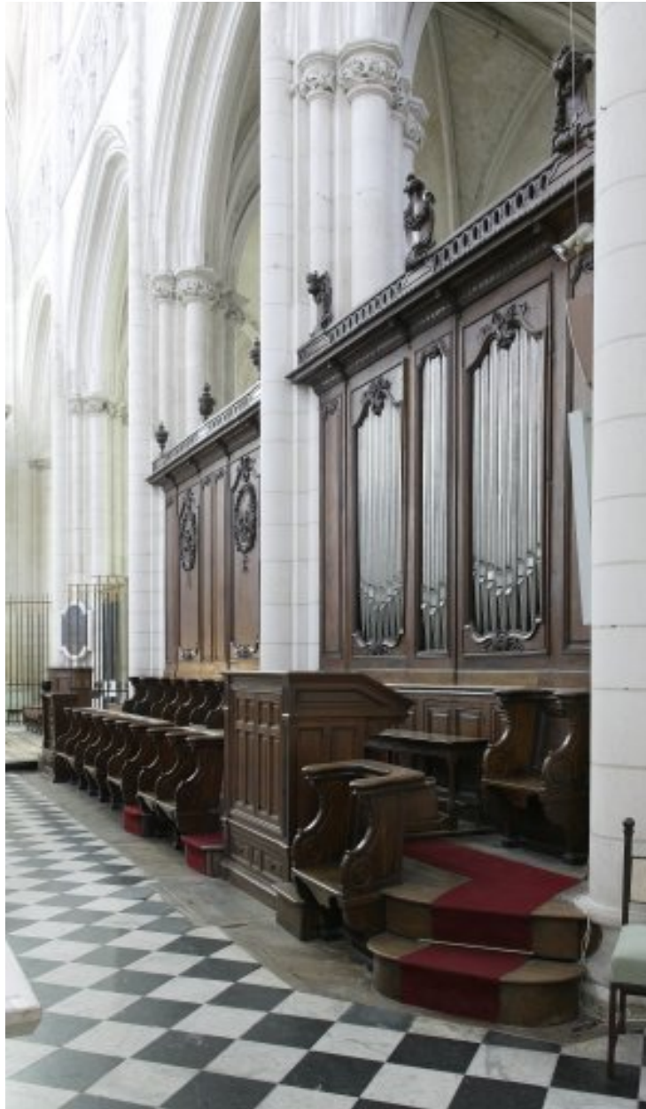
Ensemble des lambris et des stalles du côté sud (vue prise en direction du chevet).