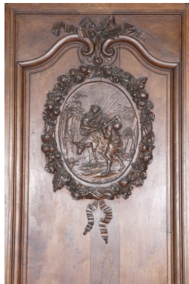
Détail du quatrième panneau du côté sud : médaillon avec la Fuite en Egypte.