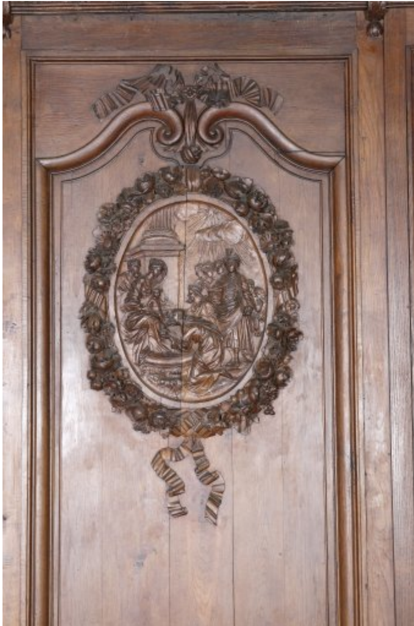
Détail du premier panneau du côté nord : médaillon avec l'Adoration des Mages.