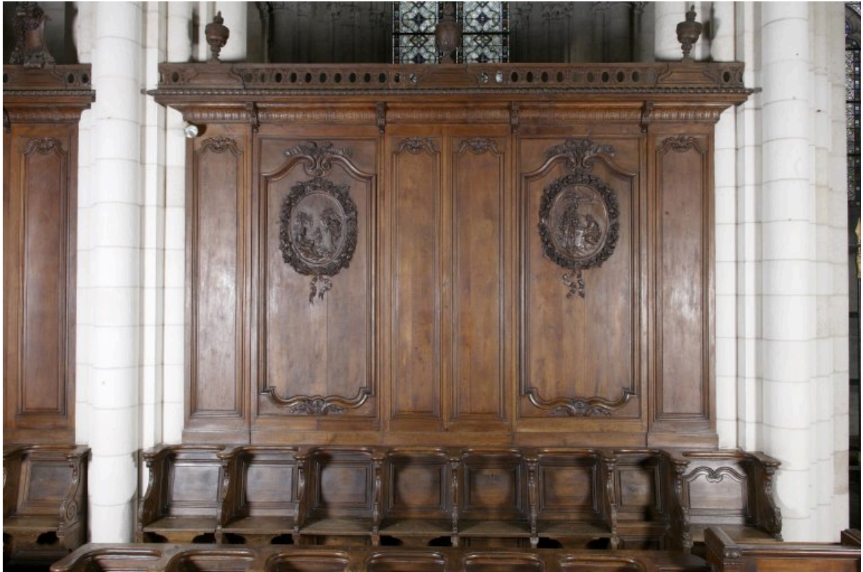
Vue d'ensemble de la travée la plus à l'est, du côté nord.