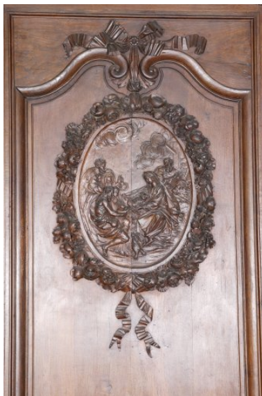
Détail du troisième panneau du côté sud : médaillon avec l'Adoration des bergers. IVR52_20078500647NUCA