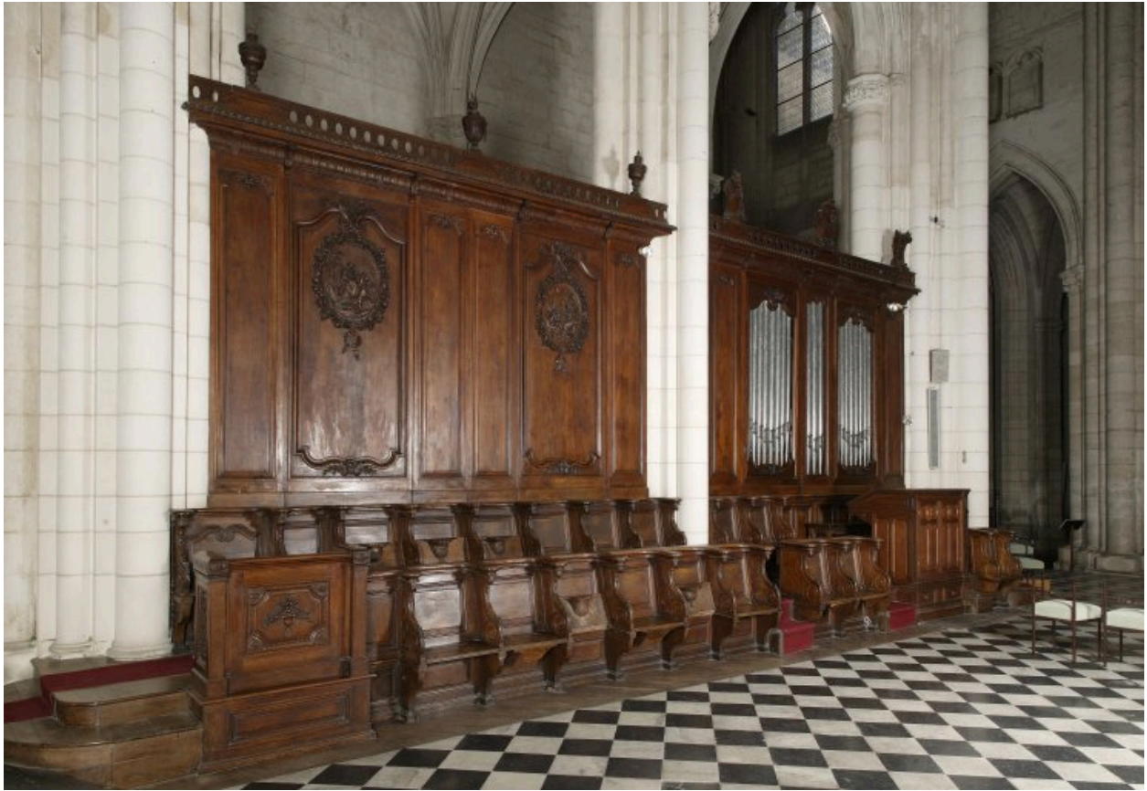
Ensemble des lambris et des stalles du côté sud (vue prise en direction de la nef).