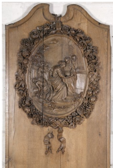
Détail du deuxième panneau du côté sud, déposé et remplacé dans le bas-côté sud du chœur : médaillon avec la Visitation.