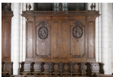
Vue d'ensemble de la travée la plus à l'est, du côté nord.