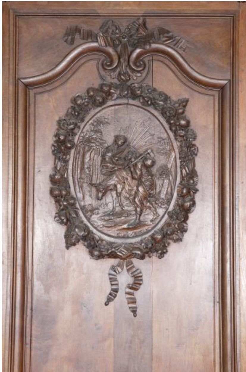
Détail du quatrième panneau du côté sud : médaillon avec la Fuite en Egypte.