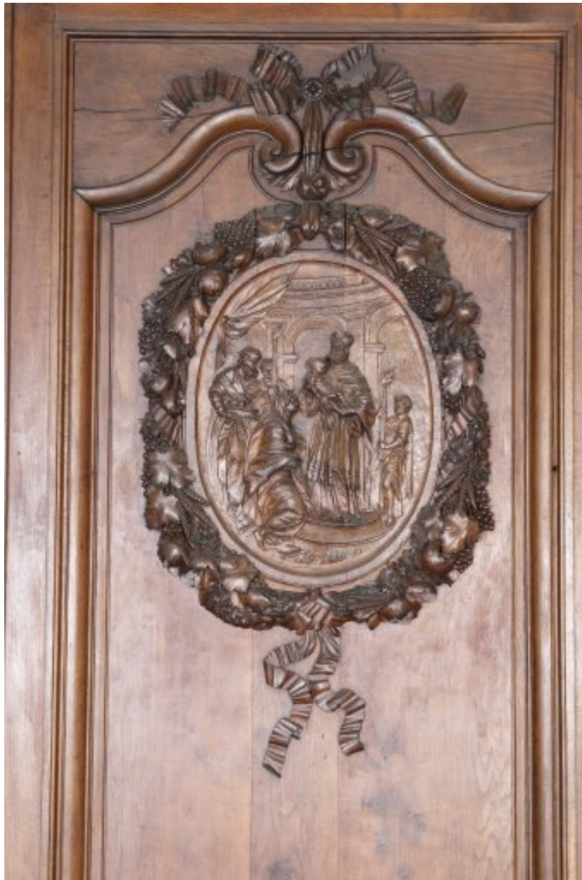
Détail du deuxième panneau du côté nord : médaillon avec la Circoncision.