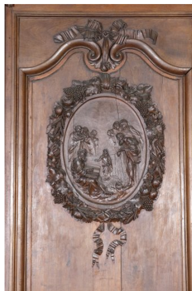
Détail du troisième panneau du côté nord : médaillon avec Jésus et les Docteurs.