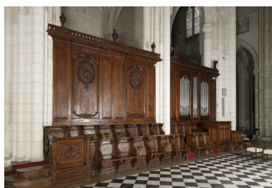
Ensemble des lambris et des stalles du côté sud (vue prise en direction de la nef). IVR52_20078500641NUCA