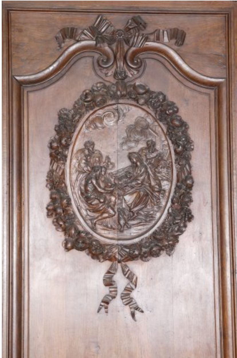
Détail du troisième panneau du côté sud : médaillon avec l'Adoration des bergers.