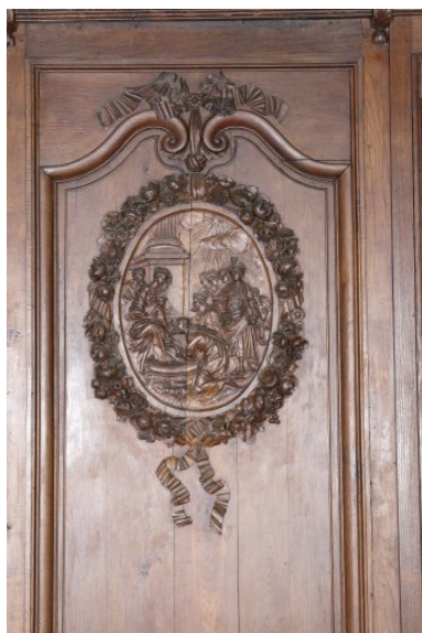
Détail du premier panneau du côté nord : médaillon avec l'Adoration des Mages. IVR52_20078500646NUCA