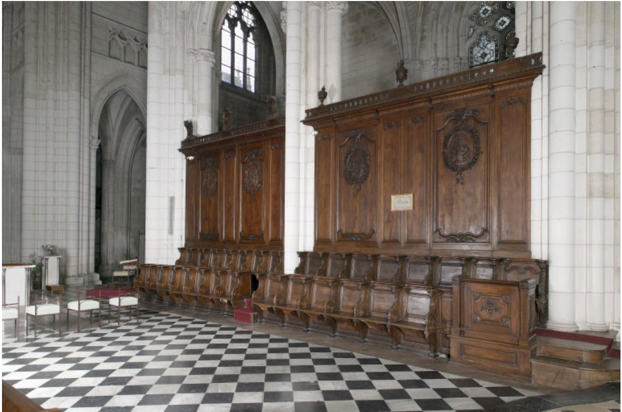
Ensemble des lambris et des stalles du côté nord (vue prise en direction de la nef).