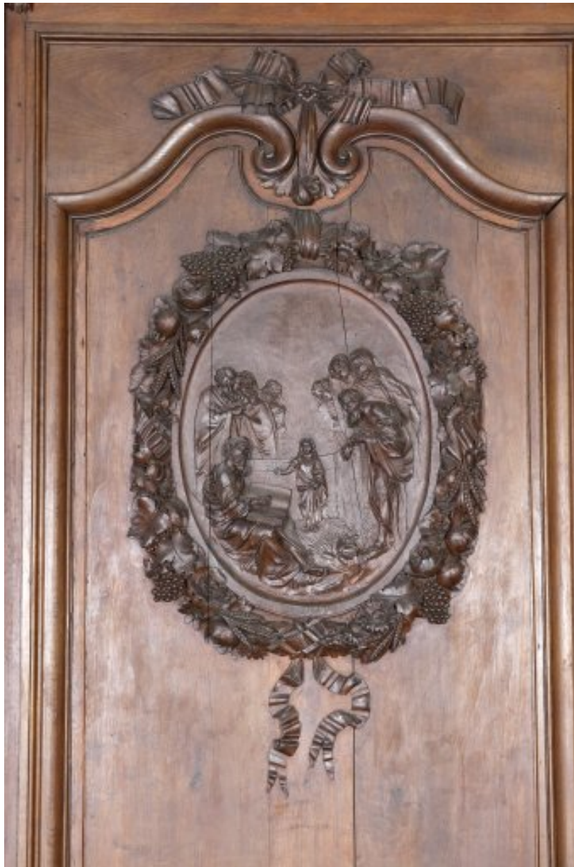
Détail du troisième panneau du côté nord : médaillon avec Jésus et les Docteurs.