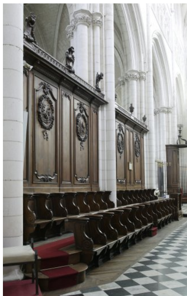
Ensemble des lambris et des stalles du côté nord (vue prise en direction du chevet).