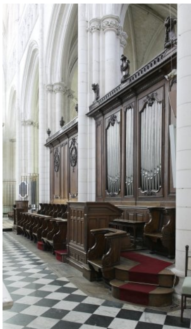
Ensemble des lambris et des stalles du côté sud (vue prise en direction du chevet). IVR52_20078500677NUCA