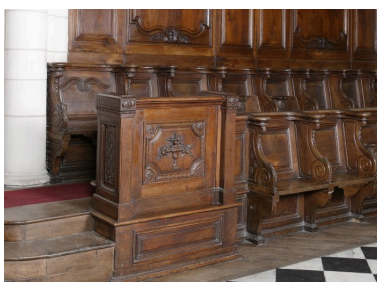
Détail des stalles du côté nord. IVR52_20078500649NUCA