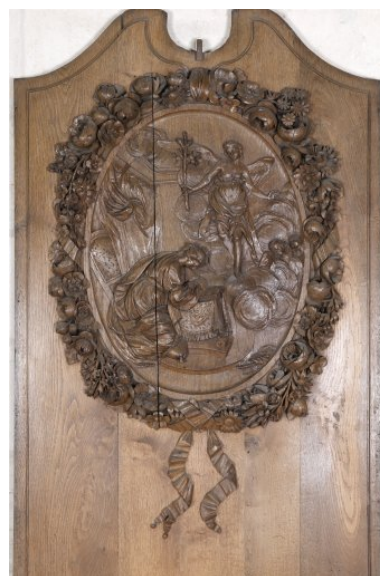
Détail du premier panneau du côté sud, déposé et replacé dans le bas-côté sud du chœur : médaillon avec l'Annonciation.