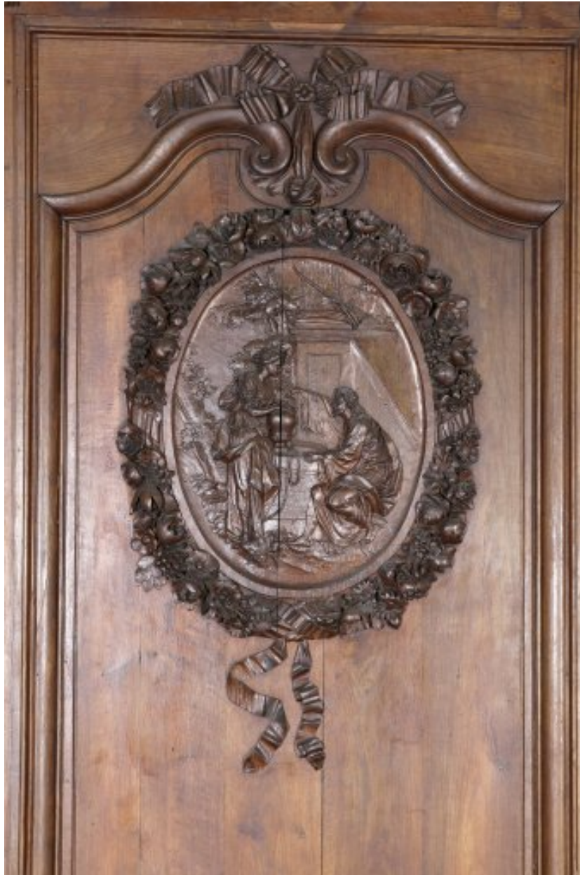
Détail du quatrième panneau du côté nord : médaillon avec la Samaritaine au puits.