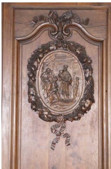
Détail du deuxième panneau du côté nord : médaillon avec la Circoncision.