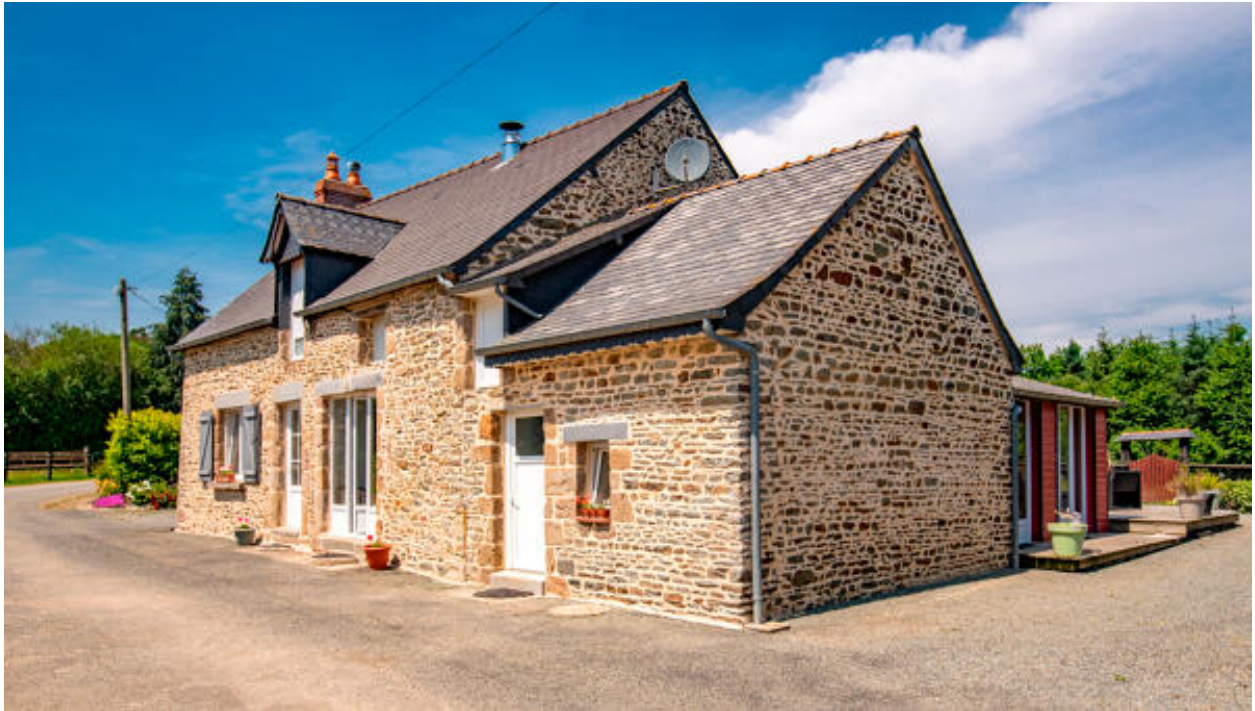
Hameau de la Truchère, maison occidentale