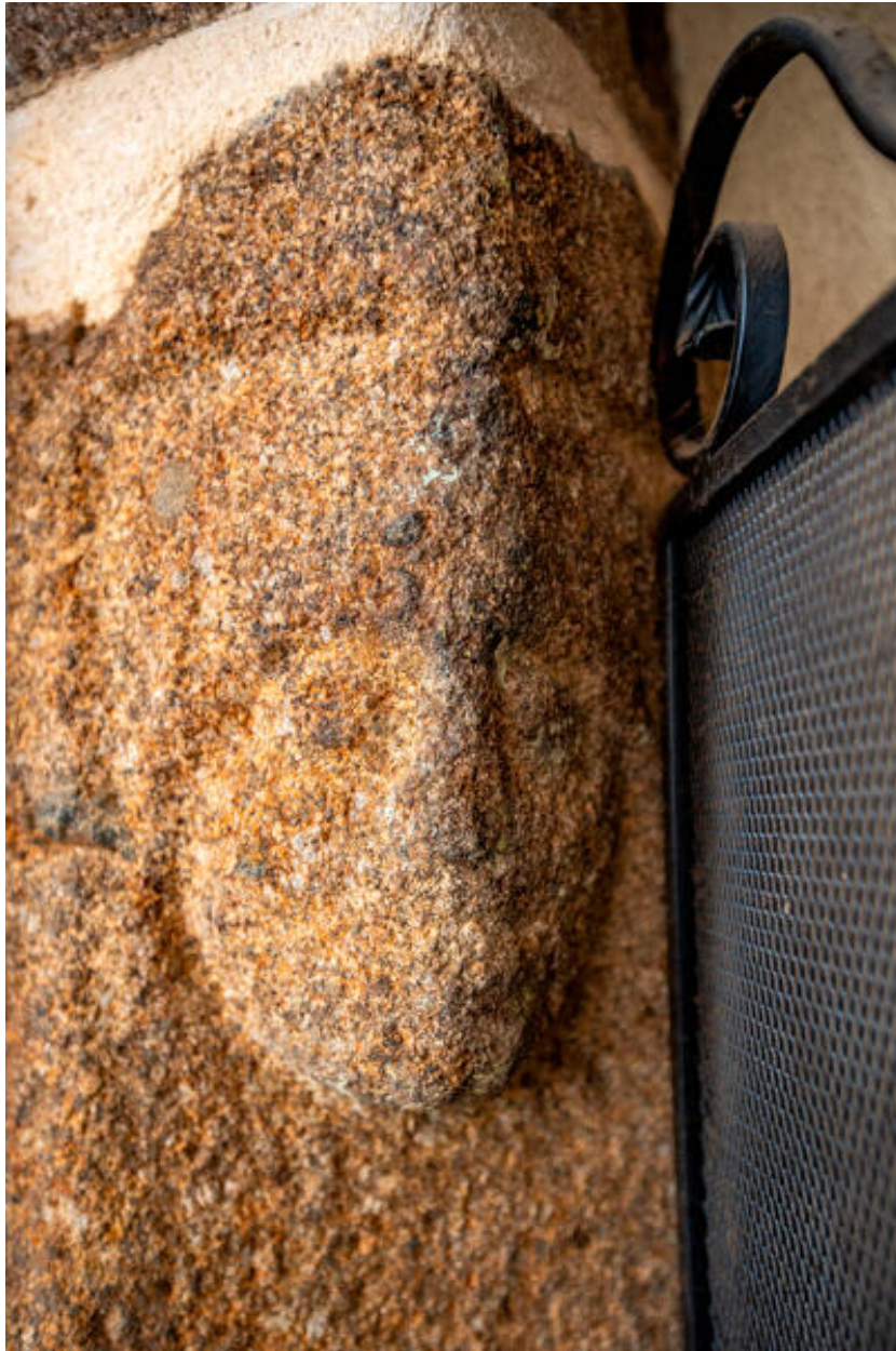
Hameau de la Truchère, maison occidentale, visages sculptés sur les congés de la cheminée.