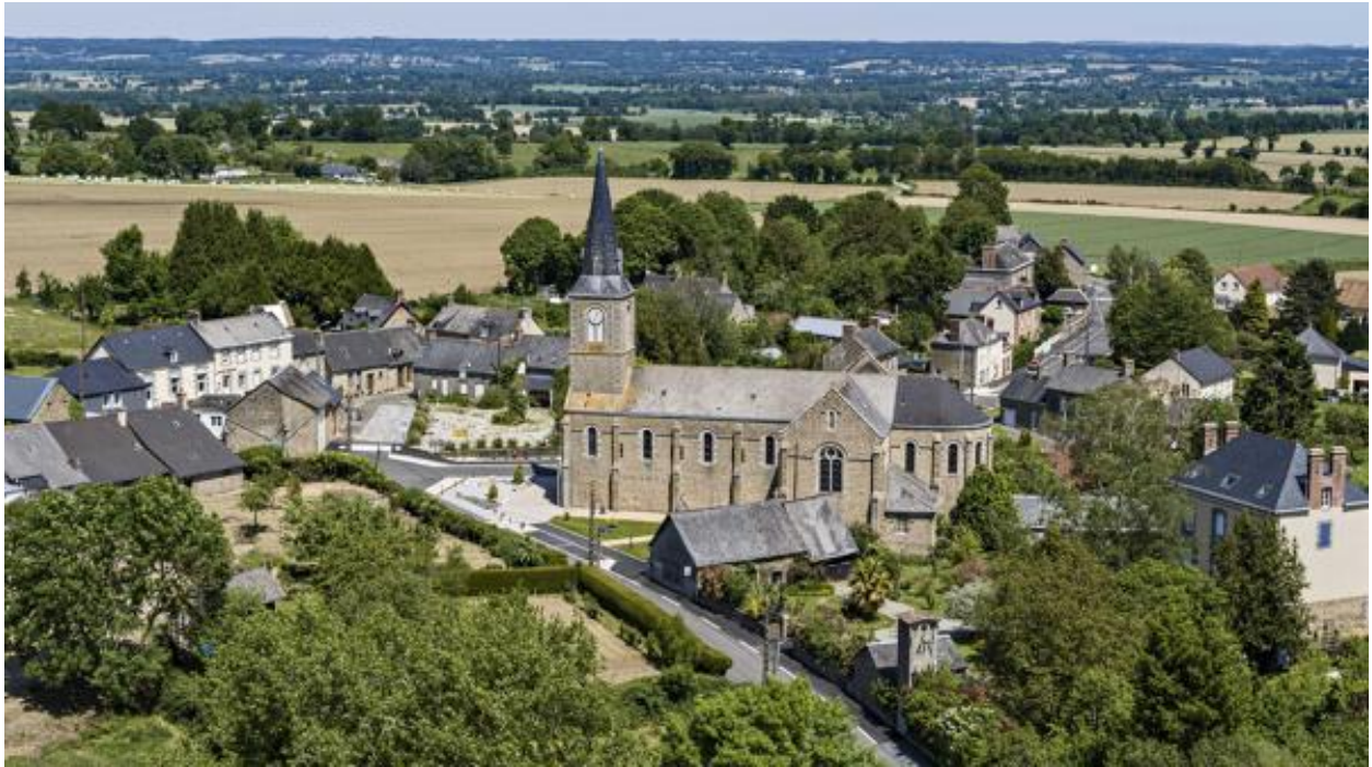
Vue aérienne du bourg de Sainte-Marie-du-Bois, depuis le sud-ouest.