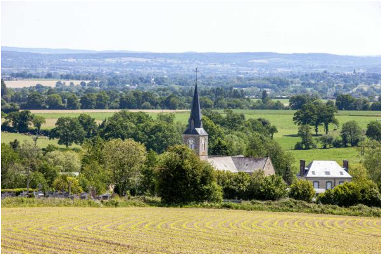
L'église et le toit du presbytère de Sainte-Marie-du-Bois, nichés dans un vallon.