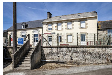
Mairie et ancienne école de garçons.