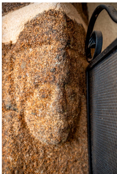
Hameau de la Truchère, maison occidentale, visages sculptés sur les congés de la cheminée.