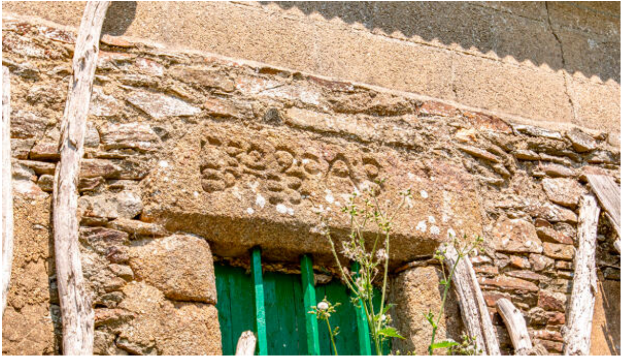
Hameau de la Truchère, édifice oriental, maison et remise.