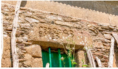
Hameau de la Truchère, édifice oriental, maison et remise.

IVR52_20235300867NUCA