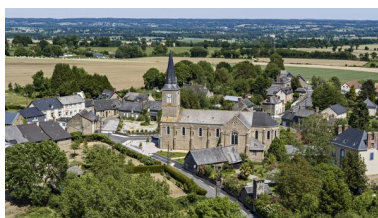
Vue aérienne du bourg de Sainte- Marie-du-Bois, depuis le sud-ouest.