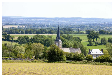
L'église et le toit du presbytère de Sainte-Marie-du-Bois, nichés dans un vallon.