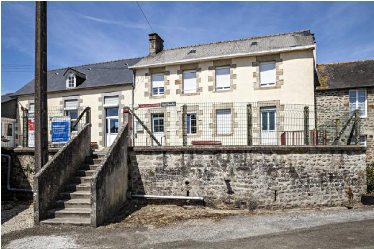
Mairie et ancienne école de garçons.