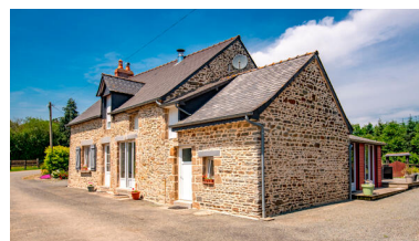
Hameau de la Truchère, maison occidentale IVR52_20235300870NUCA