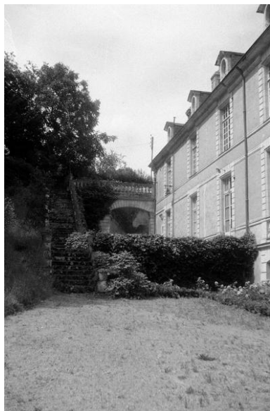
Château de Vaugirault. Vue de la façade arrière prise lors du pré-inventaire en 1972.