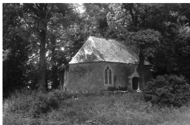
Château de Vaugirault. Vue de la chapelle prise lors du pré-inventaire en 1972. IVR52_19724900562Z