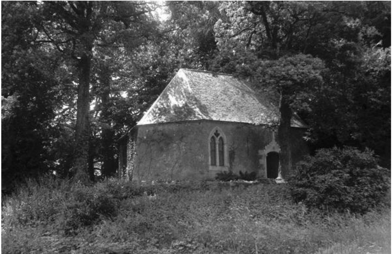
Château de Vaugirault. Vue de la chapelle prise lors du pré-inventaire en 1972.