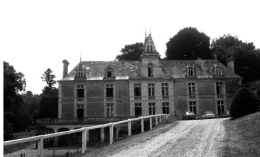
Château de Vaugirault. Vue d'ensemble de la façade principale prise lors du pré-inventaire en 1972. IVR52_19724900559Z