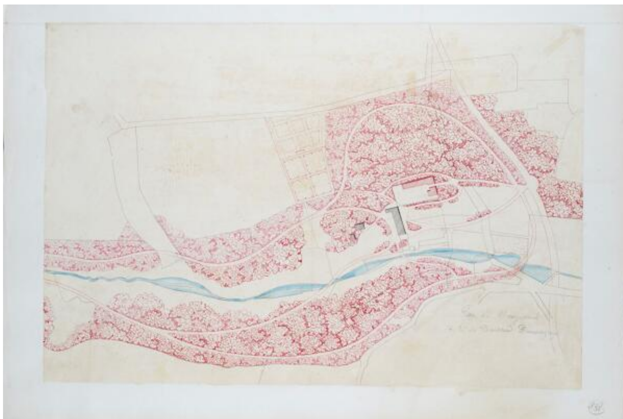
Projet de jardin pour le château de Vaugirault. Dessiné par André Leroy. Non daté. (AD Maine-et-Loire ; 34 Fi 138).