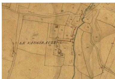
Le Vaugirault. Extrait du plan cadastral de 1827, section D (unique) du Vaugirault, parcelles n° 220 à 226. IVR52_20254900082NUCA