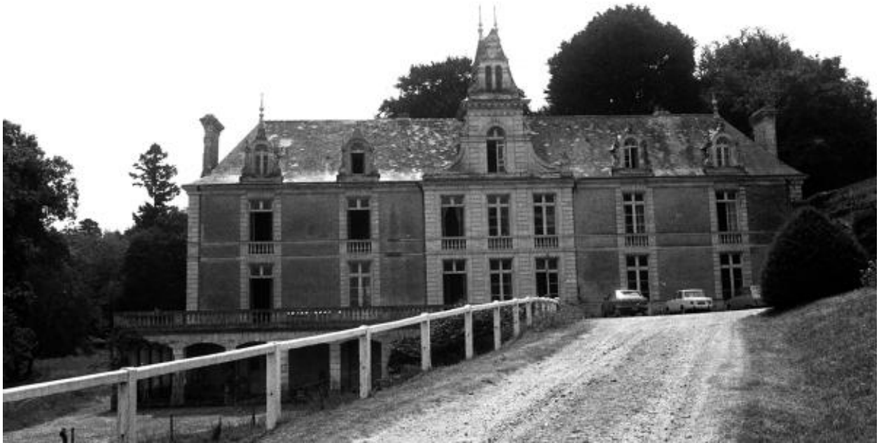
Château de Vaugirault. Vue d'ensemble de la façade principale prise lors du pré-inventaire en 1972.