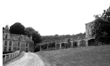
Château de Vaugirault. Vue du château et des commons prise lors du pré-inventaire en 1972.