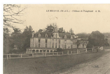
Le Mesnil-en-Vallée. Château de Vaugirault. Carte postale. 1er quart du 20e siècle. IVR52_20234900076NUCA