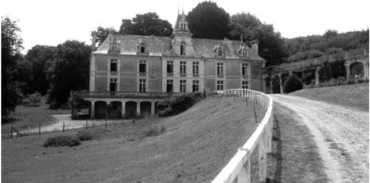
Château de Vaugirault. Vue d'ensemble prise lors du pré-inventaire en 1972.