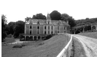
Château de Vaugirault. Vue d'ensemble prise lors du pré-inventaire en 1972. IVR52_19724900570Z