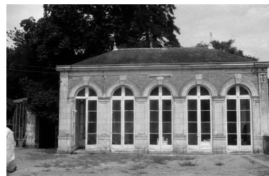
Château de Vaugirault. Vue de l'orangerie prise lors du pré-inventaire en 1972. IVR52_19724900563Z