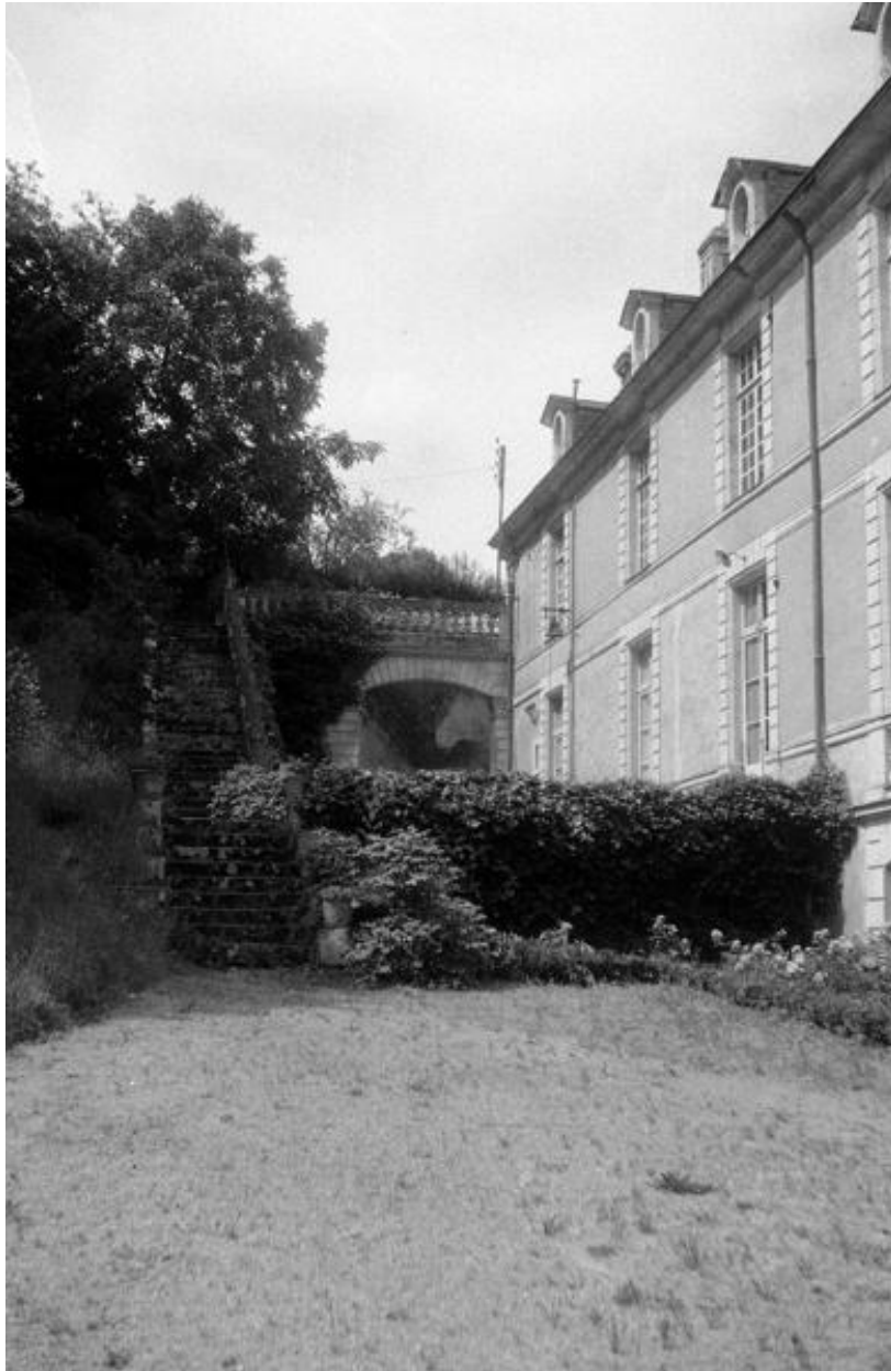
Château de Vaugirault. Vue de la façade arrière prise lors du pré-inventaire en 1972.