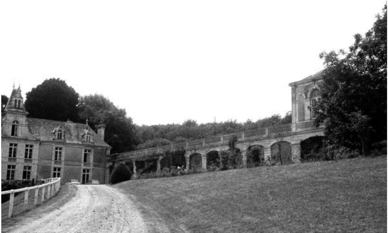
Château de Vaugirault. Vue du château et des communs prise lors du pré-inventaire en 1972.