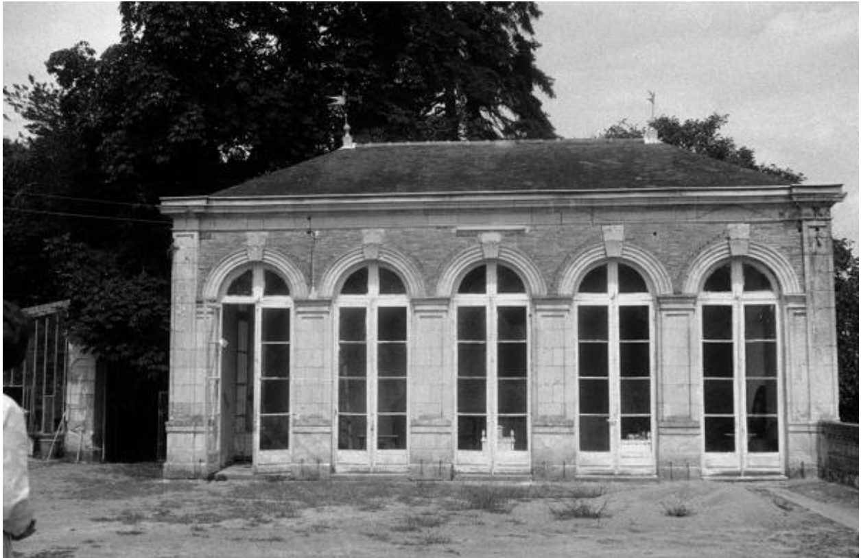
Château de Vaugirault. Vue de l'orangerie prise lors du pré-inventaire en 1972.