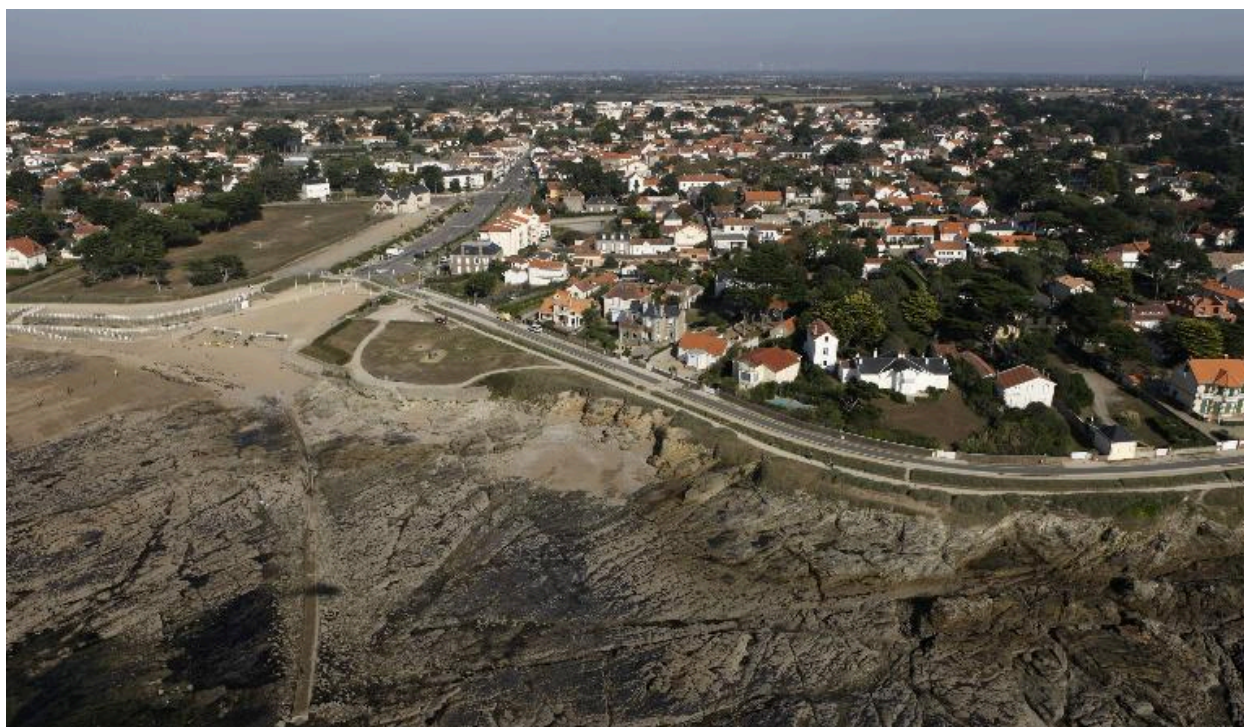
Vue aérienne de la commune.