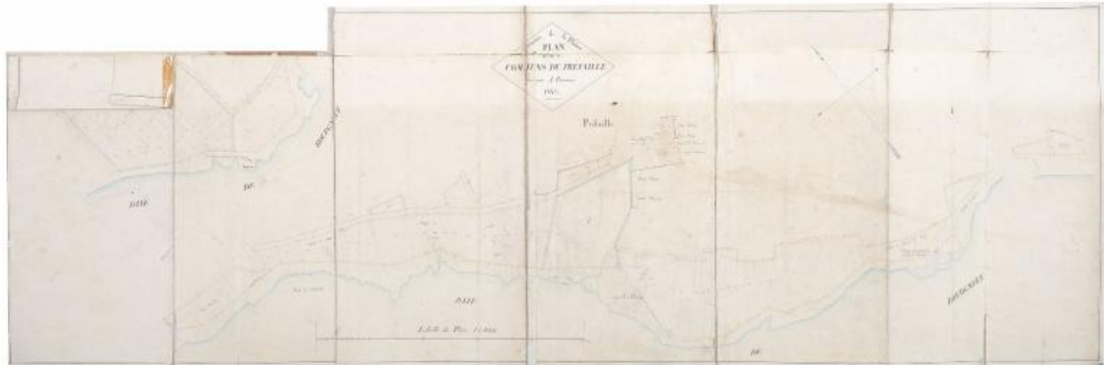
Plan des communs, 1844.