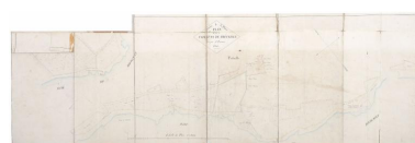
Plan des communes, 1844. IVR52_20104401086NUCA