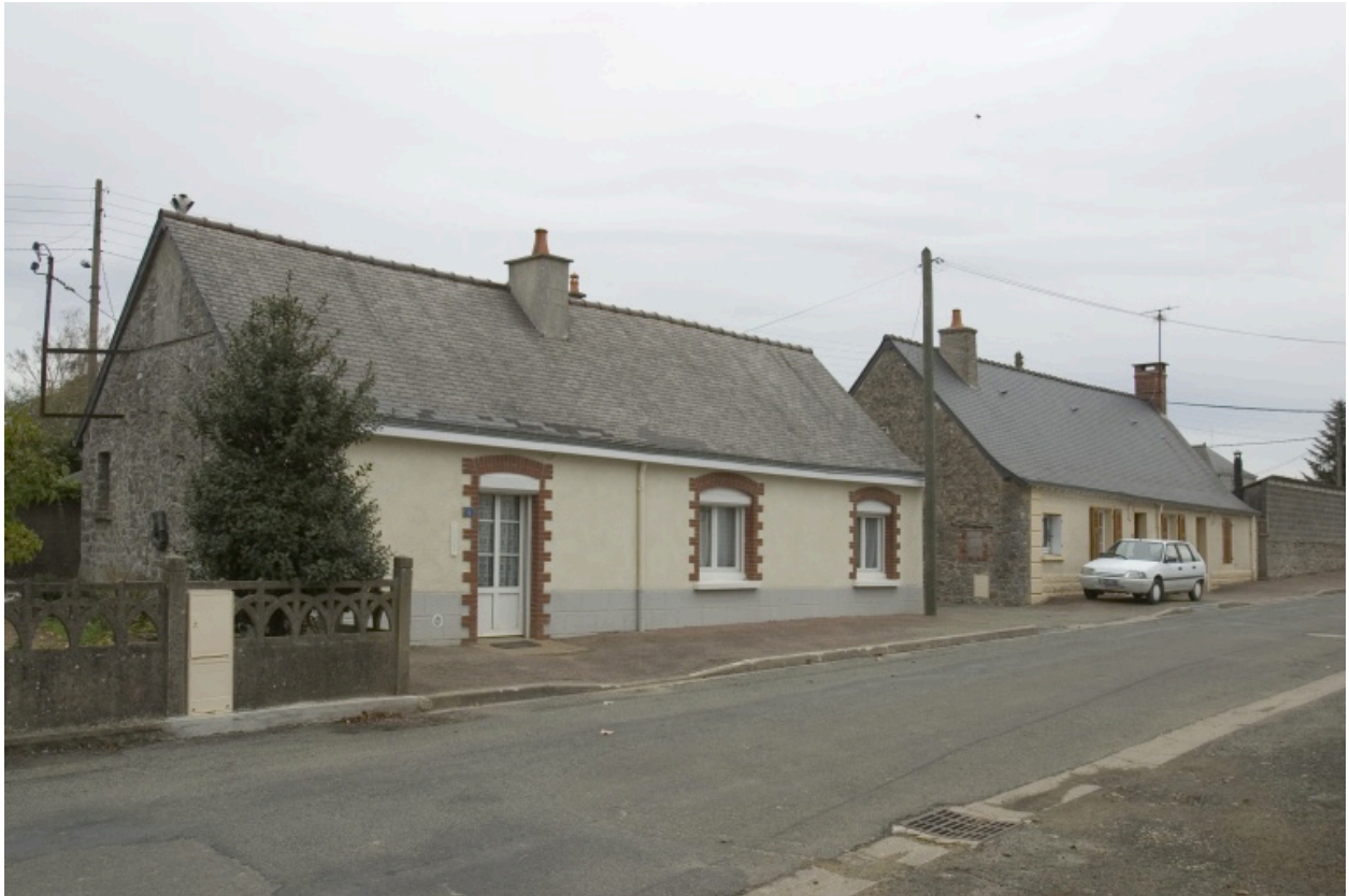
Vue depuis la rue. La maison est à gauche.