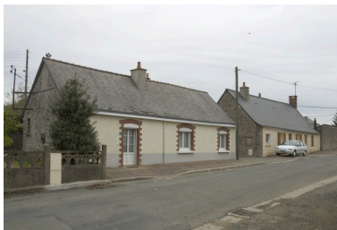
Vue depuis la rue. La maison est à gauche. IVR52_20045303309NUCA