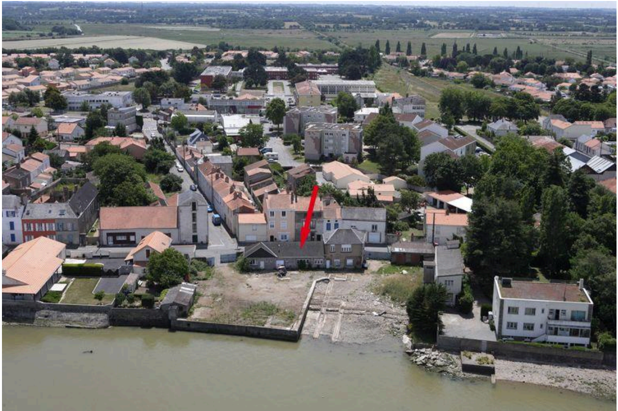
Situation sur la vue aérienne, 2010.