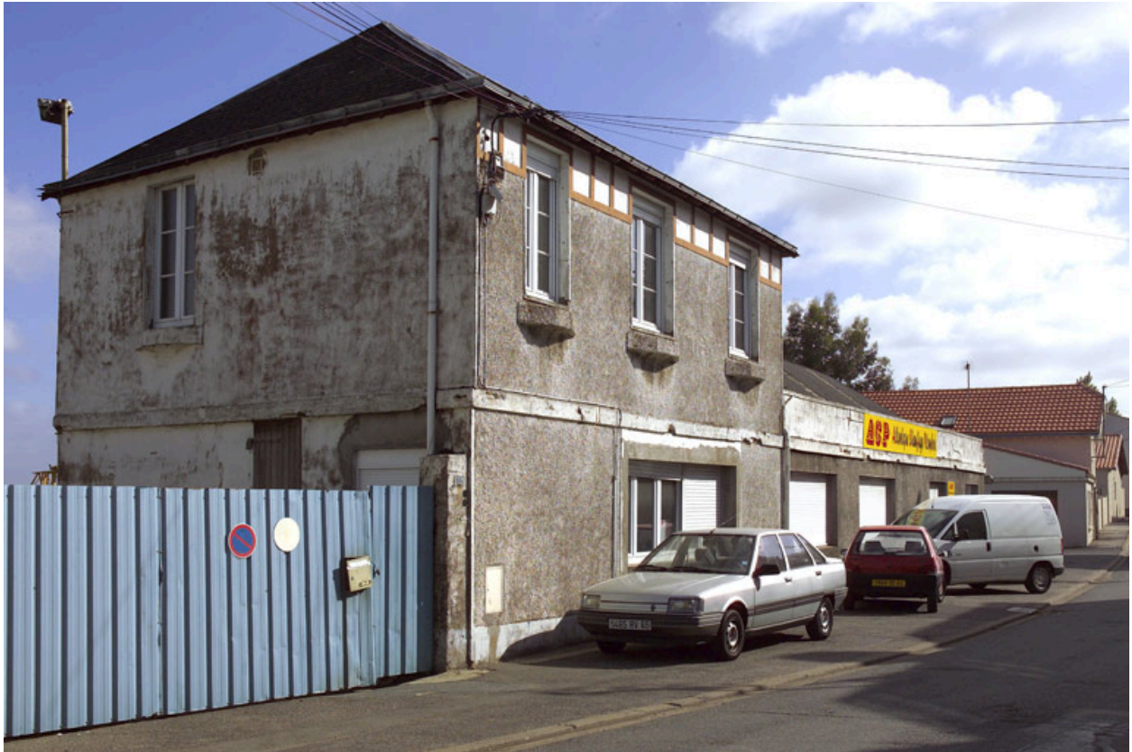
Vue d'ensemble vers l'amont depuis la rue.