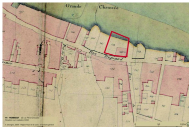
Situation sur cadastre 1810. IVR52_20094400563NUDA