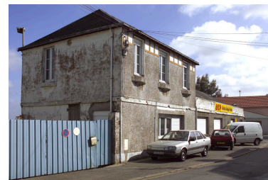
Vue d'ensemble vers l'amont depuis la rue.