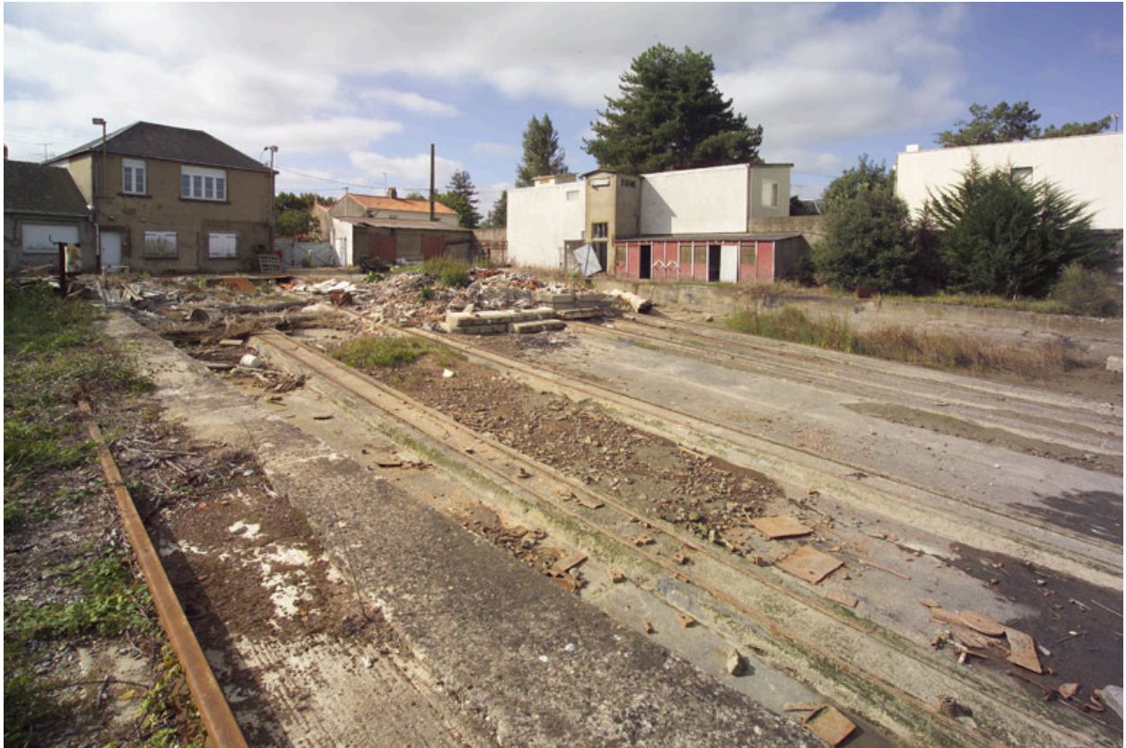
Vue du chantier depuis la rive.