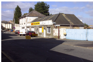
Vue d'ensemble vers l'aval, depuis la rue. IVR52_20044401914NUCA