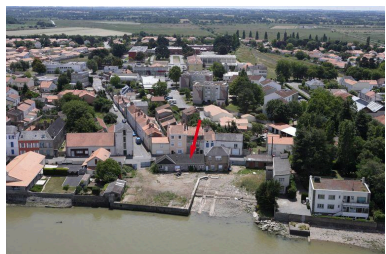
Situation sur la vue aérienne, 2010. IVR52_20104402790NUDA