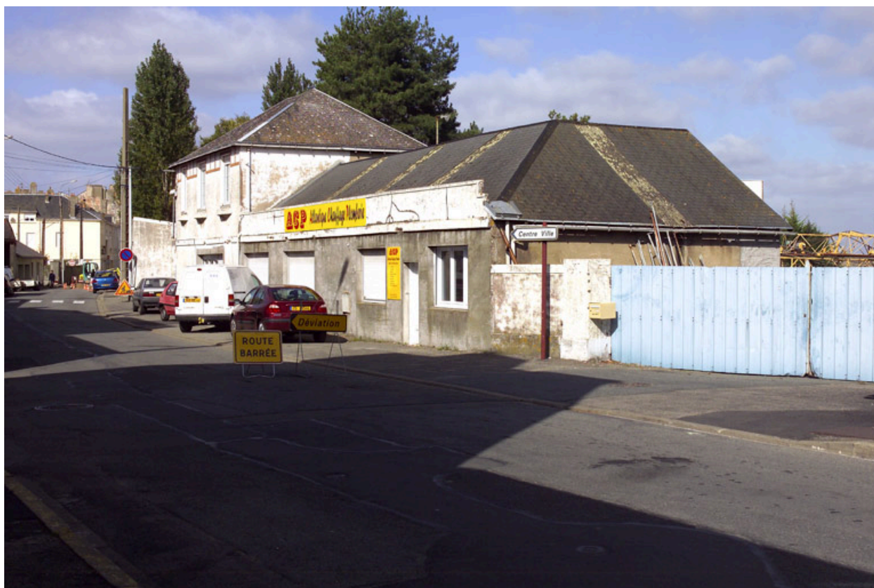
Vue d'ensemble vers l'aval, depuis la rue.