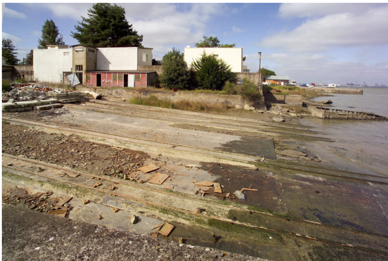
Vue d'ensemble du chantier naval.