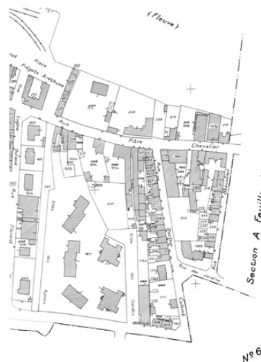
Plan cadastral, 1999, extrait. IVR52_20034400108NUCA