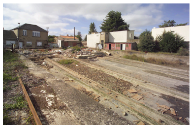
Vue du chantier depuis la rive. IVR52_20044401933NUCA