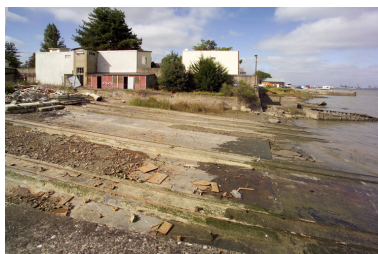
Vue d'ensemble du chantier naval.