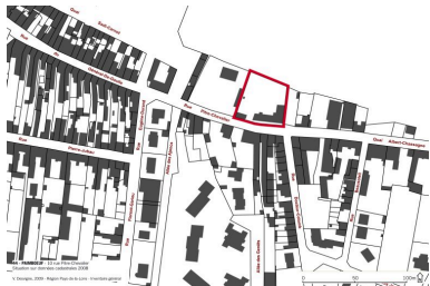
Situation sur données cadastrales 2008. IVR52_20094400564NUDA