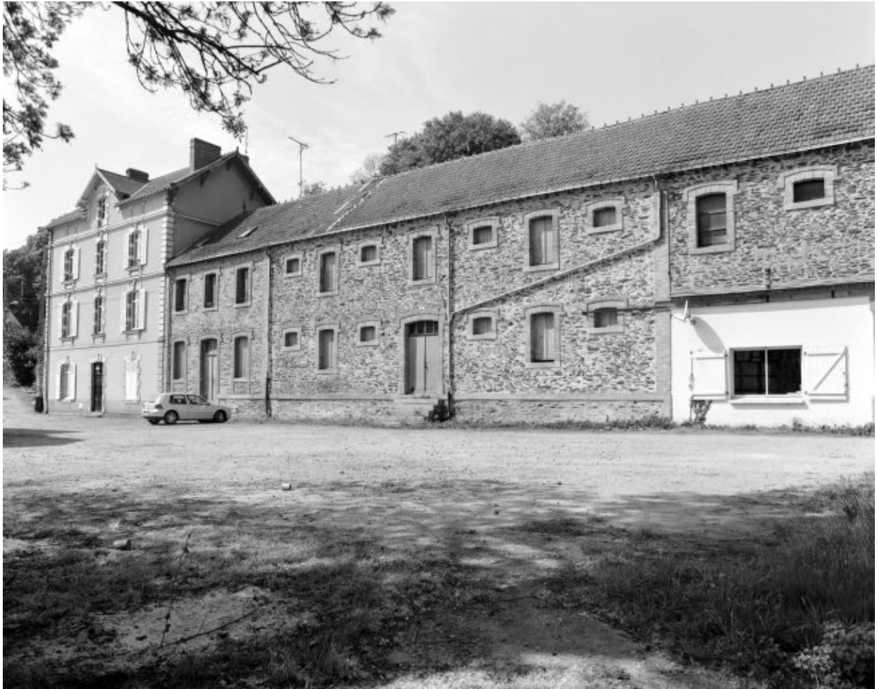
Maison du meunier et dépendances, vue d'ensemble depuis le nord-est.