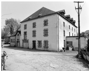
Élévation ouest du moulin. IVR52_20025300613X