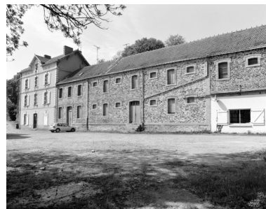
Maison du meunier et dépendances, vue d'ensemble depuis le nord-est. IVR52_20025300612X