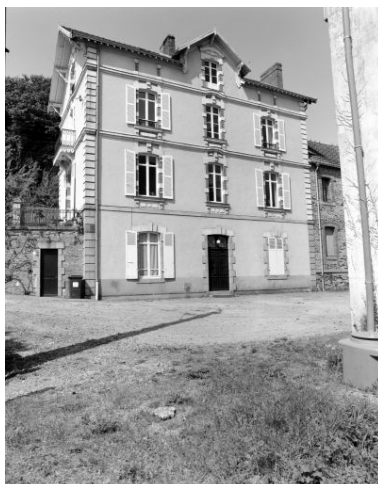
Maison du meunier : élévation postérieure sur cour. IVR52_20025300615X