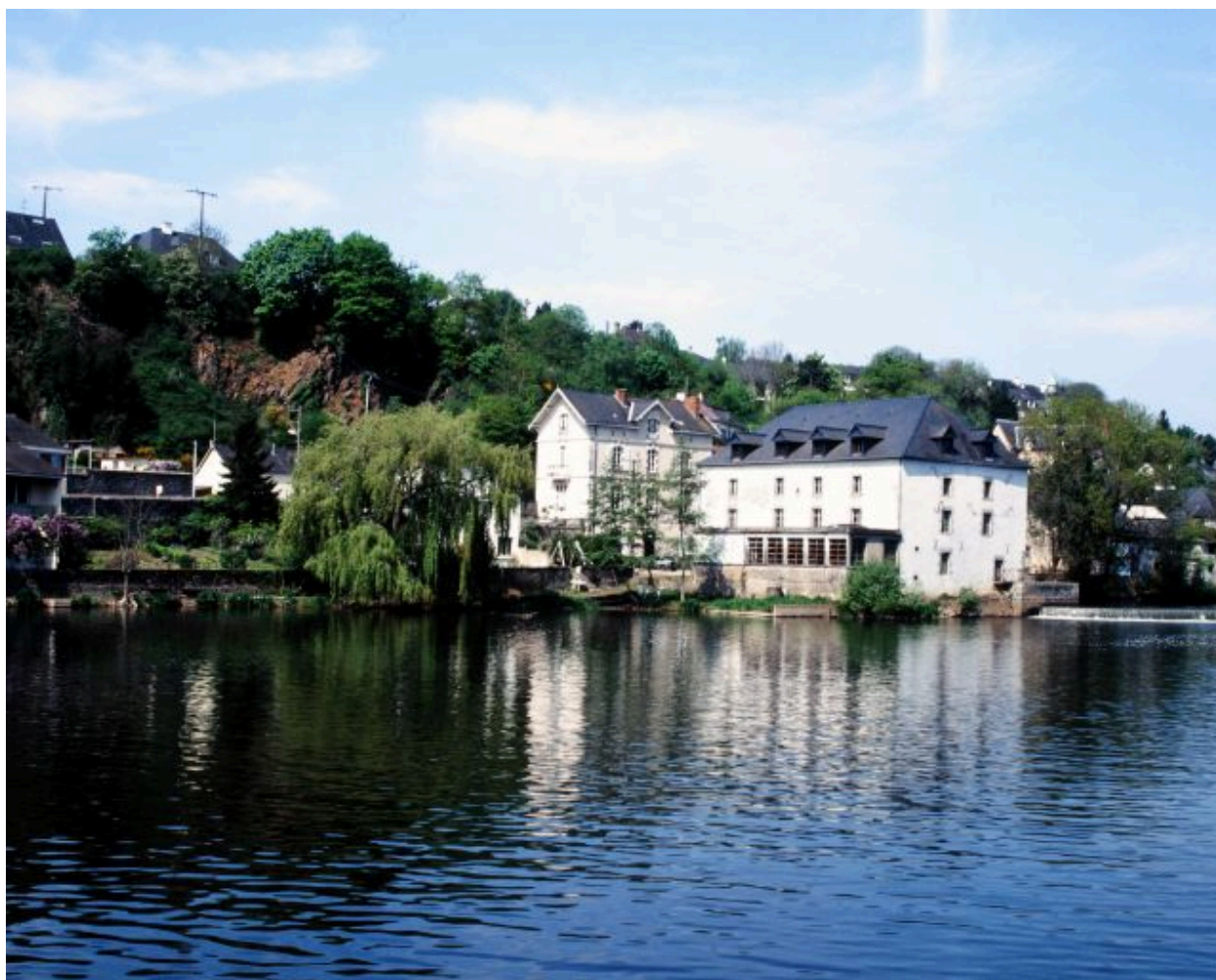
Vue d'ensemble du moulin, depuis la rive gauche, en aval.