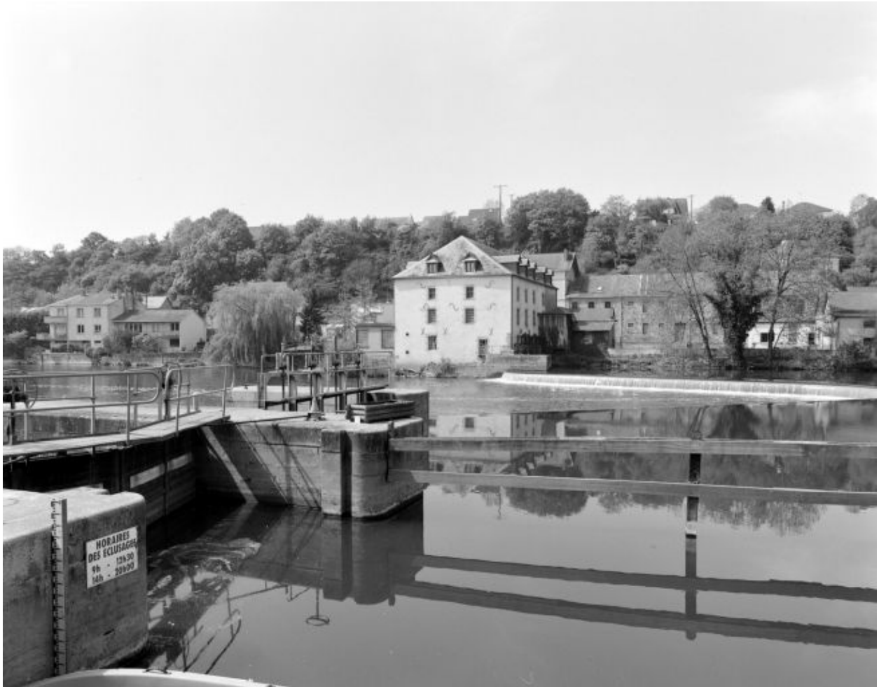
Vue d'ensemble de l'écluse, du barrage et du moulin depuis la rive gauche.