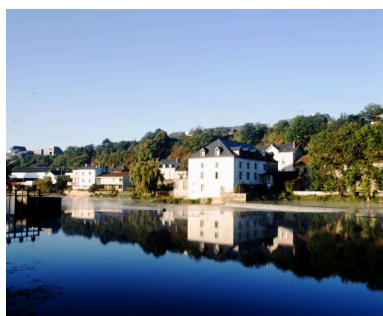
Vue d'ensemble du site du moulin, depuis la rive gauche, en amont.