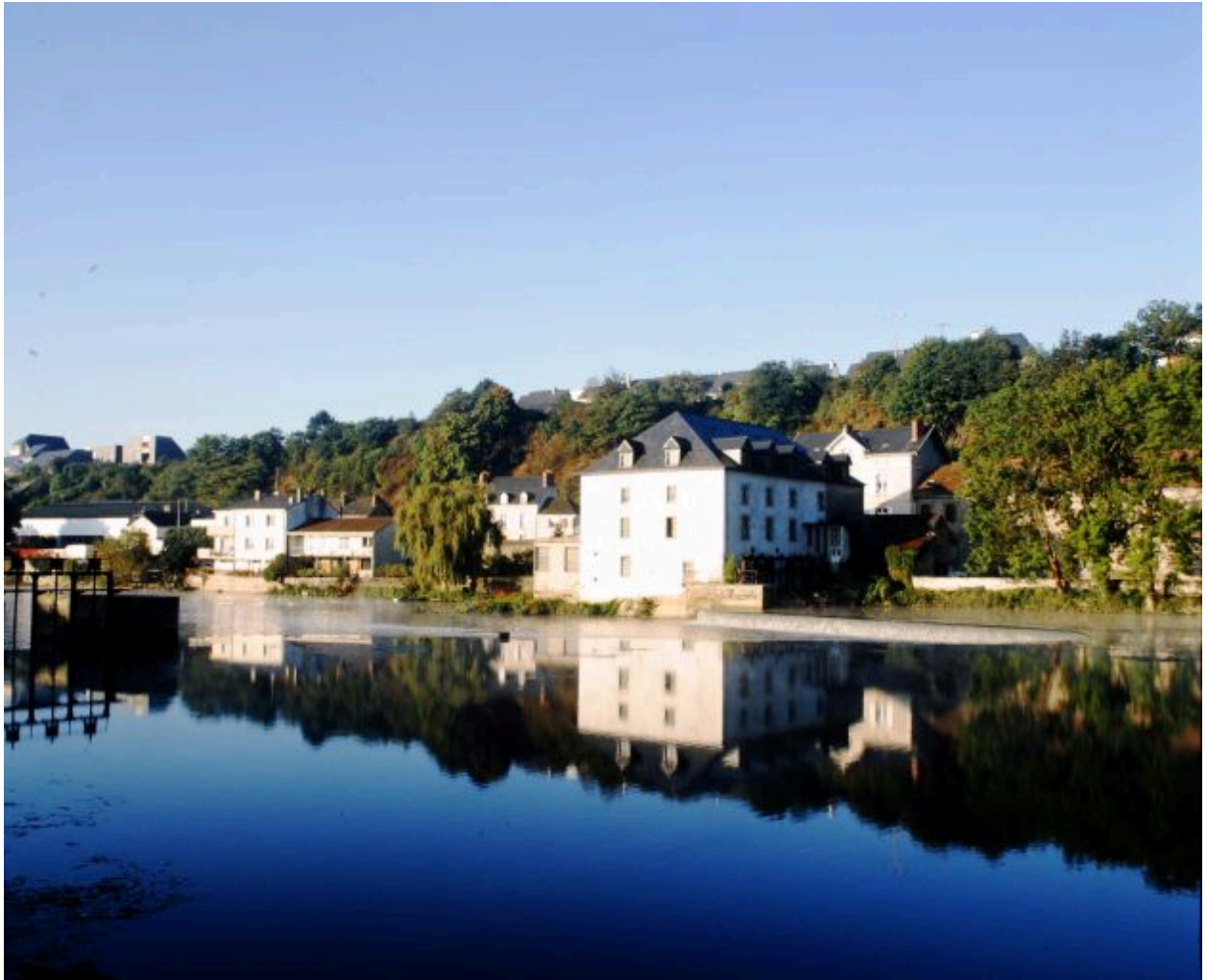
Vue d'ensemble du site du moulin, depuis la rive gauche, en amont.