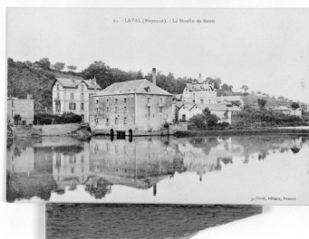
Vue du moulin et de ses dépendances depuis la rive gauche, en aval.