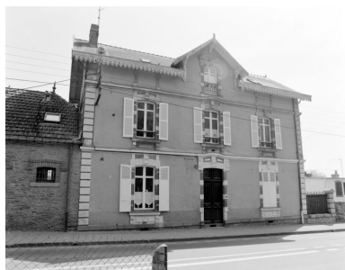
Maison du meunier : élévation antérieure sur rue.