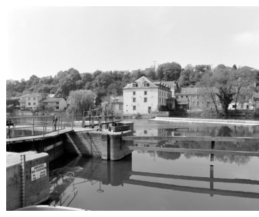
Vue d'ensemble de l'écluse, du barrage et du moulin depuis la rive gauche.