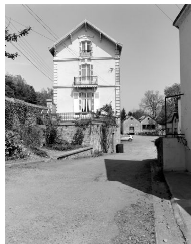
Maison du meunier : pignon latéral sud. IVR52_20025300614X