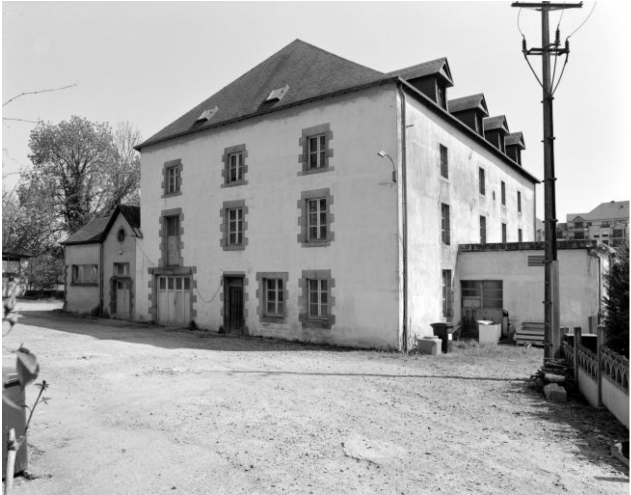
Elévation ouest du moulin.