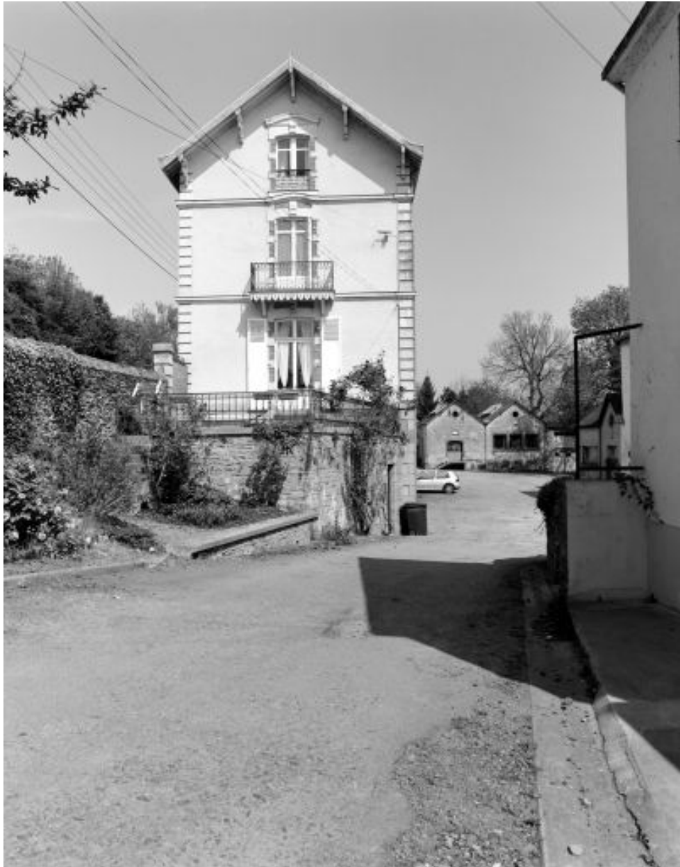
Maison du meunier : pignon latéral sud.