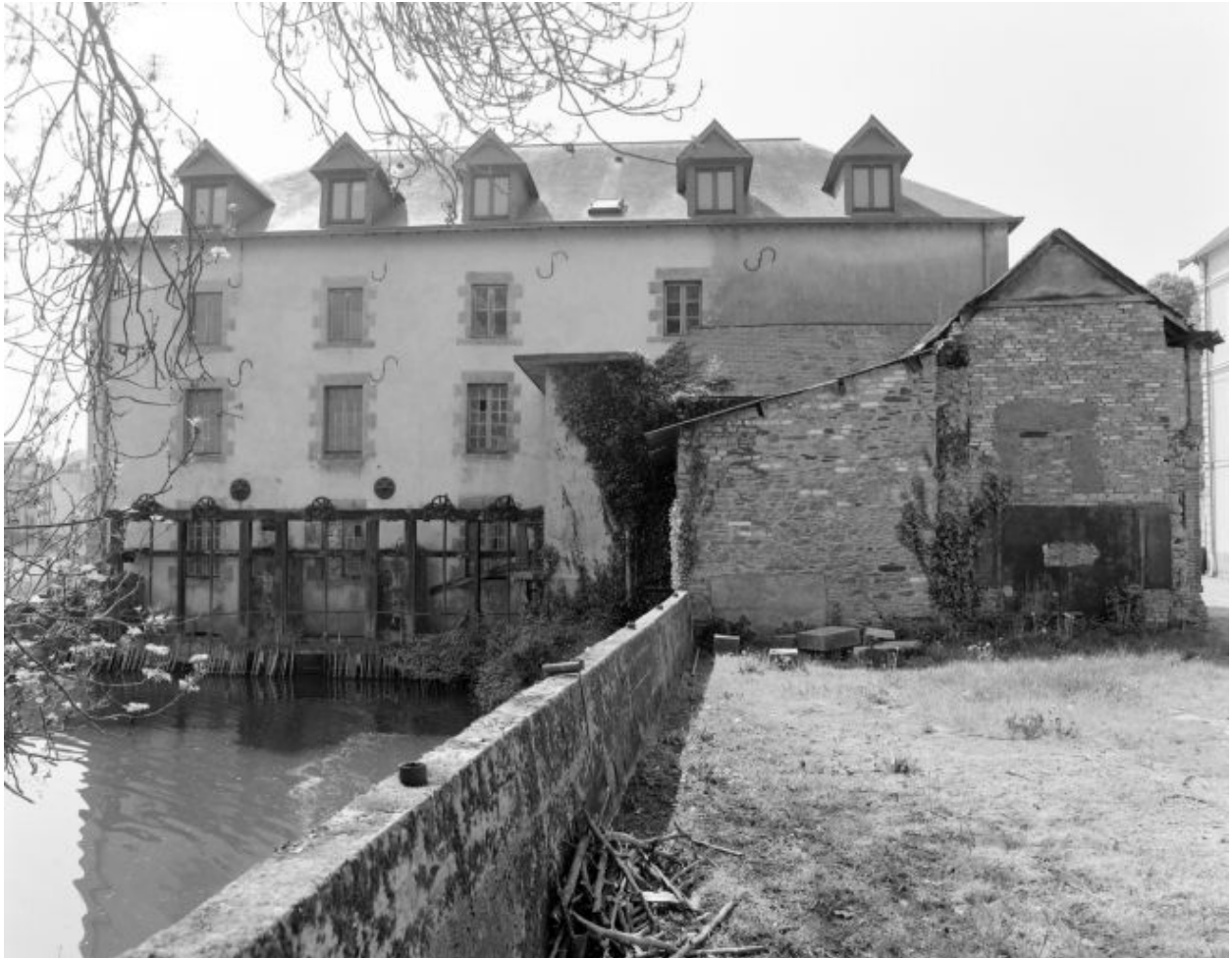
Elévation nord du moulin (amont) et vannes du coursier.