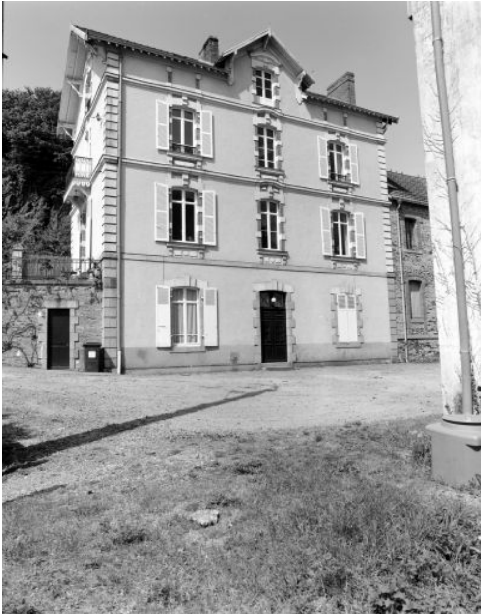
Maison du meunier : élévation postérieure sur cour.