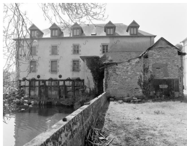
Élévation nord du moulin (amont) et vannes du coursier. IVR52_20025300611X