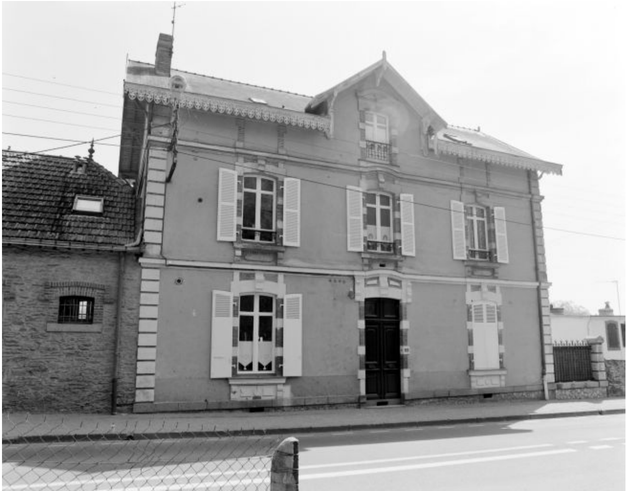
Maison du meunier : élévation antérieure sur rue.