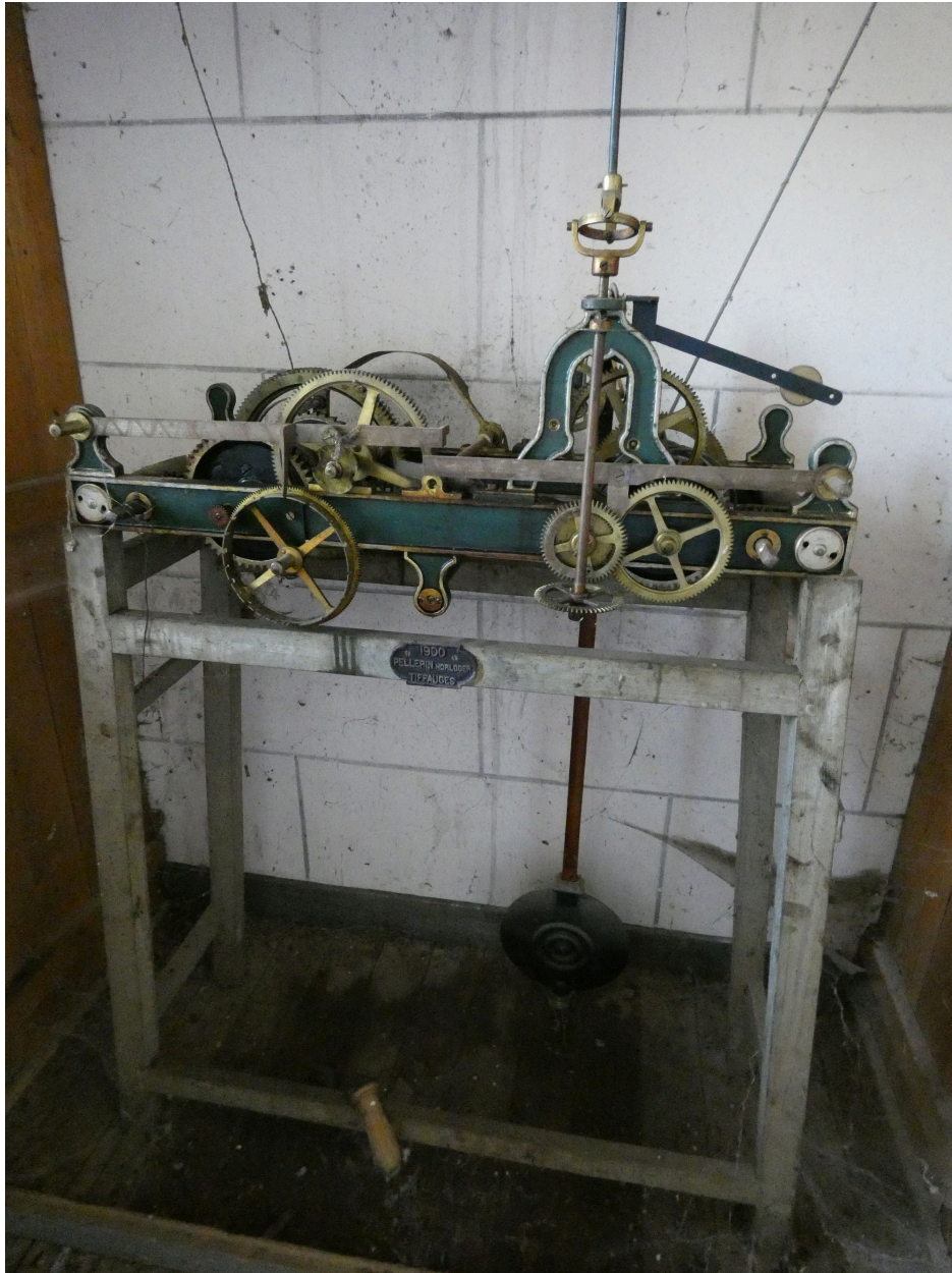
Le mécanisme d'horloge.