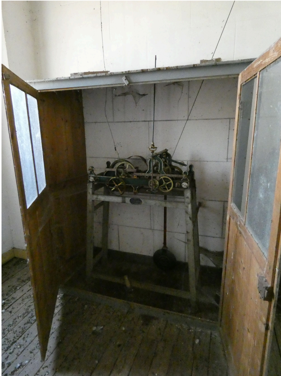
Le mécanisme dans son armoire.