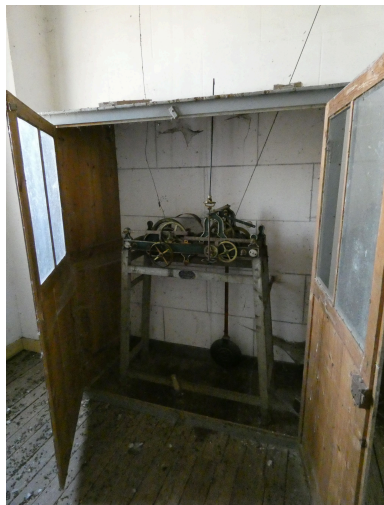
Le mécanisme dans son armoire. IVR52_20238500056NUCA