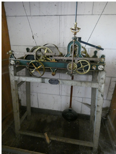
Le mécanisme d'horloge.