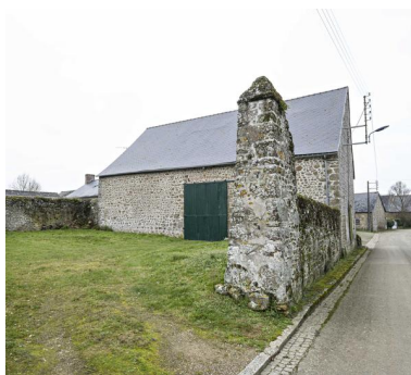
Ancienne grange aux dîmes.