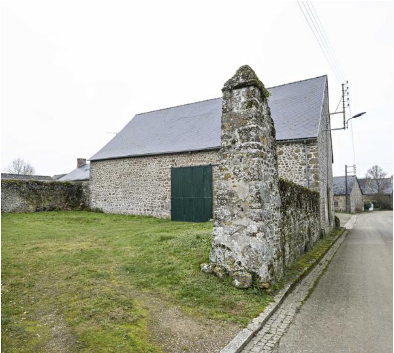
Ancienne grange aux dîmes.