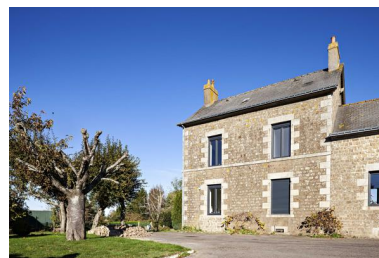
Ancienne école de garçons. IVR52_20215301791NUCA