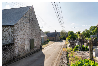
Village de Saint-Fraimbault, rue centrale : le cimetière autour de l'église et la grange aux dîmes. IVR52_20235300402NUCA