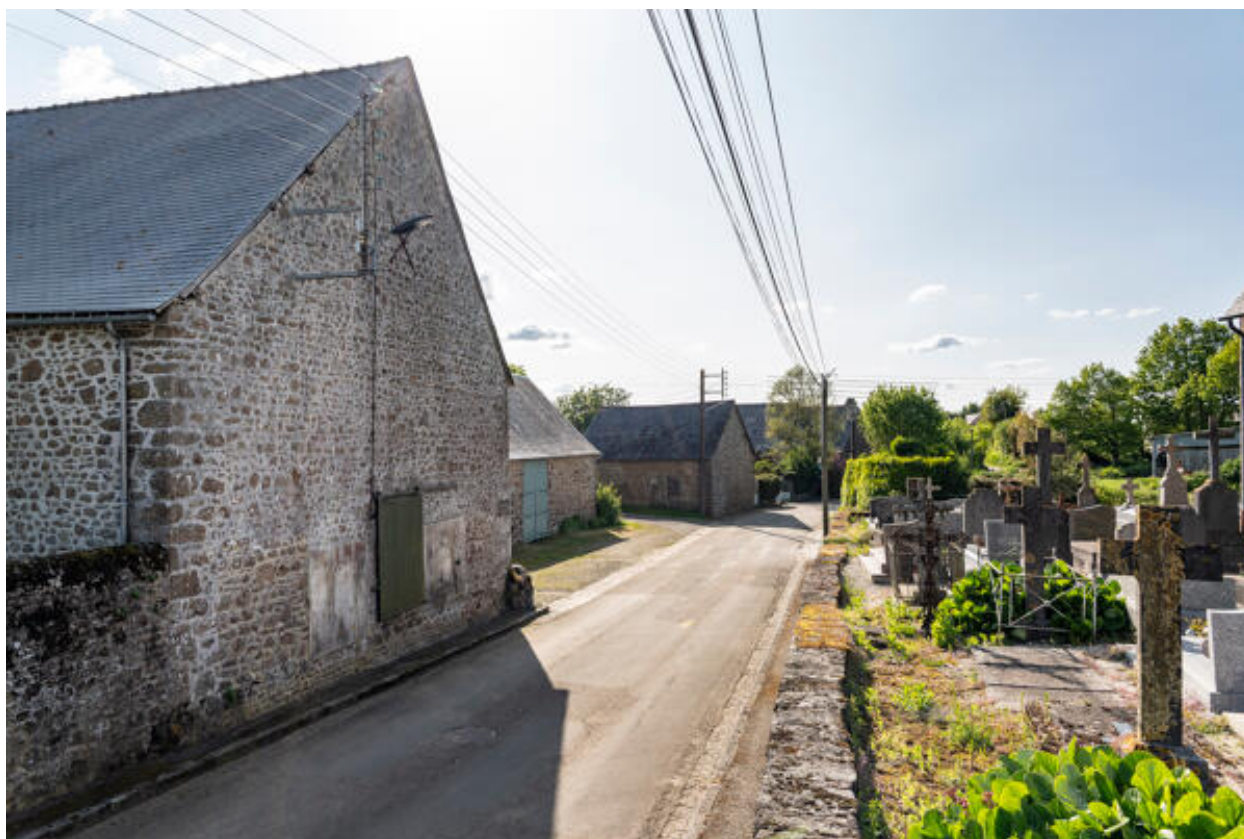
Village de Saint-Fraimbault, rue centrale : le cimetière autour de l'église et la grange aux dîmes.