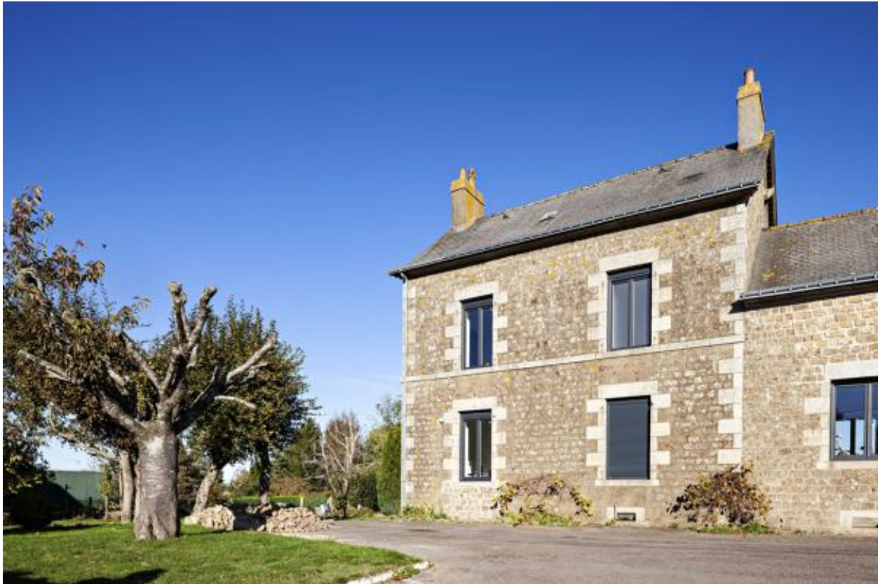
Ancienne école de garçons.