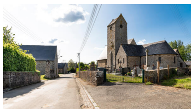
Village de Saint-Fraimbault, vue d'ensemble depuis l'est.