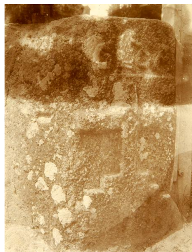
Pierre gravée, mur de clôture du cimetière.