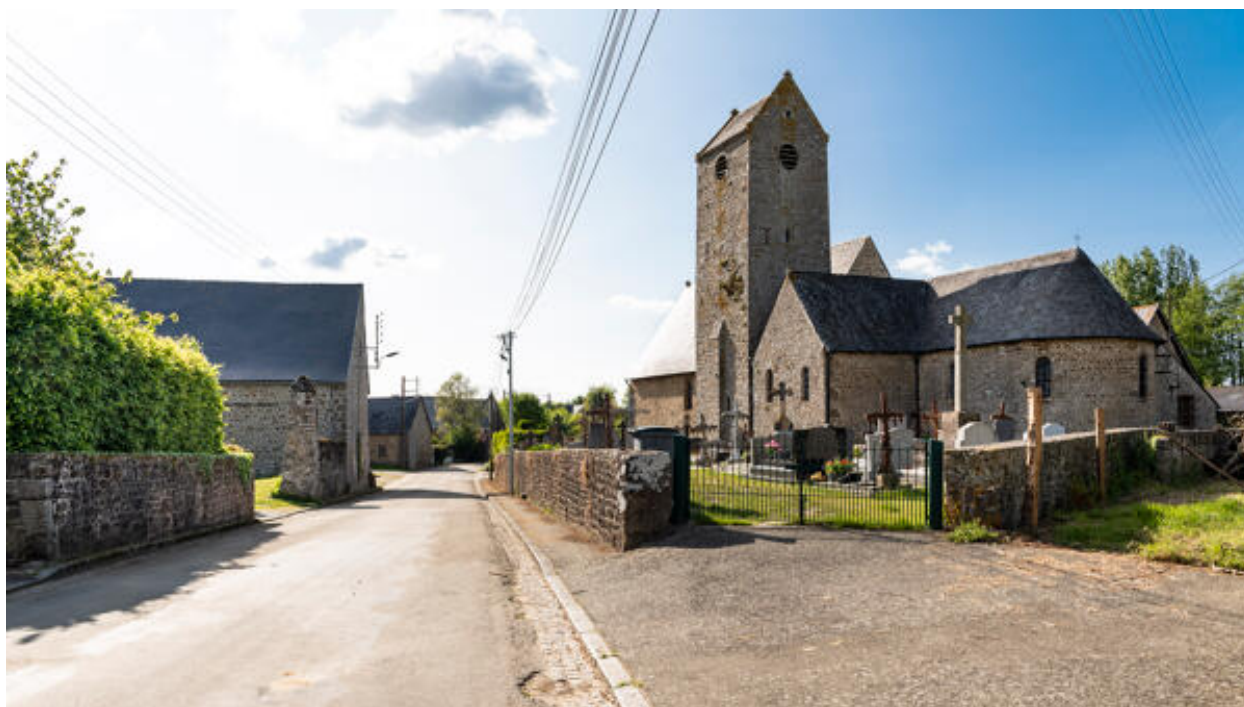
Village de Saint-Fraimbault, vue d'ensemble depuis l'est.