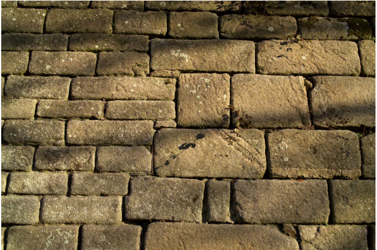
Détail de la rupture d'appareil à la jonction de l'enceinte et de la tour disparue.