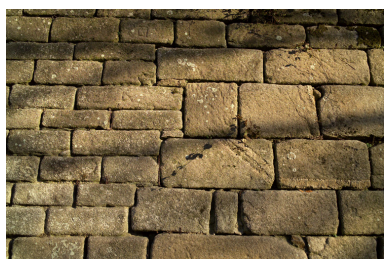
Détail de la rupture d'appareil à la jonction de l'enceinte et de la tour disparue.