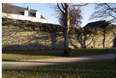
Vue de l'enceinte à l'emplacement de la tour Sainte Catherine. IVR52_20054402216NUCA