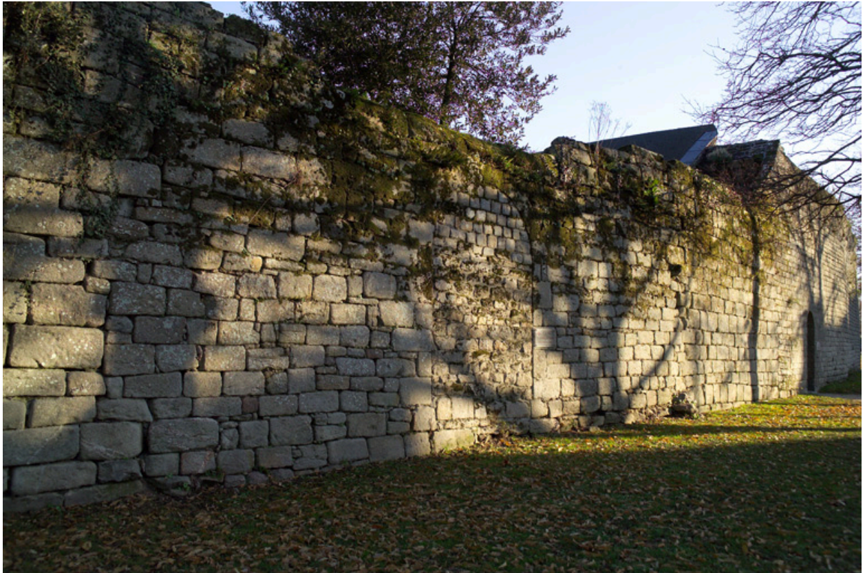
Vue de la porte murée à l'emplacement de la tour Sainte-Catherine.