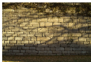
Rupture d'appareil à la jonction de l'enceinte et de la tour disparue.