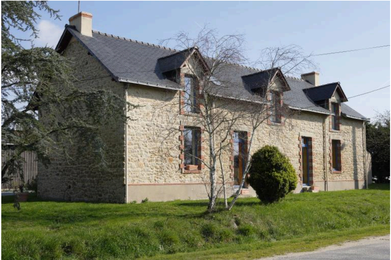
Vue du second logis depuis le sud.