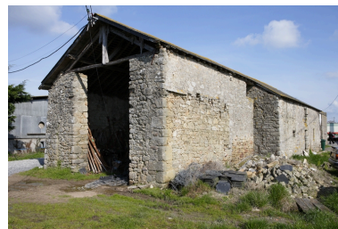
Vue de la remise.