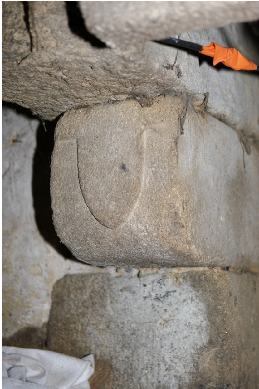
Détail du corbeau ouest, sculpté d'un blason, portant la hotte de la cheminée.