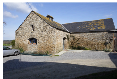
Détail du jour situé sur le pignon sud de l'étable.