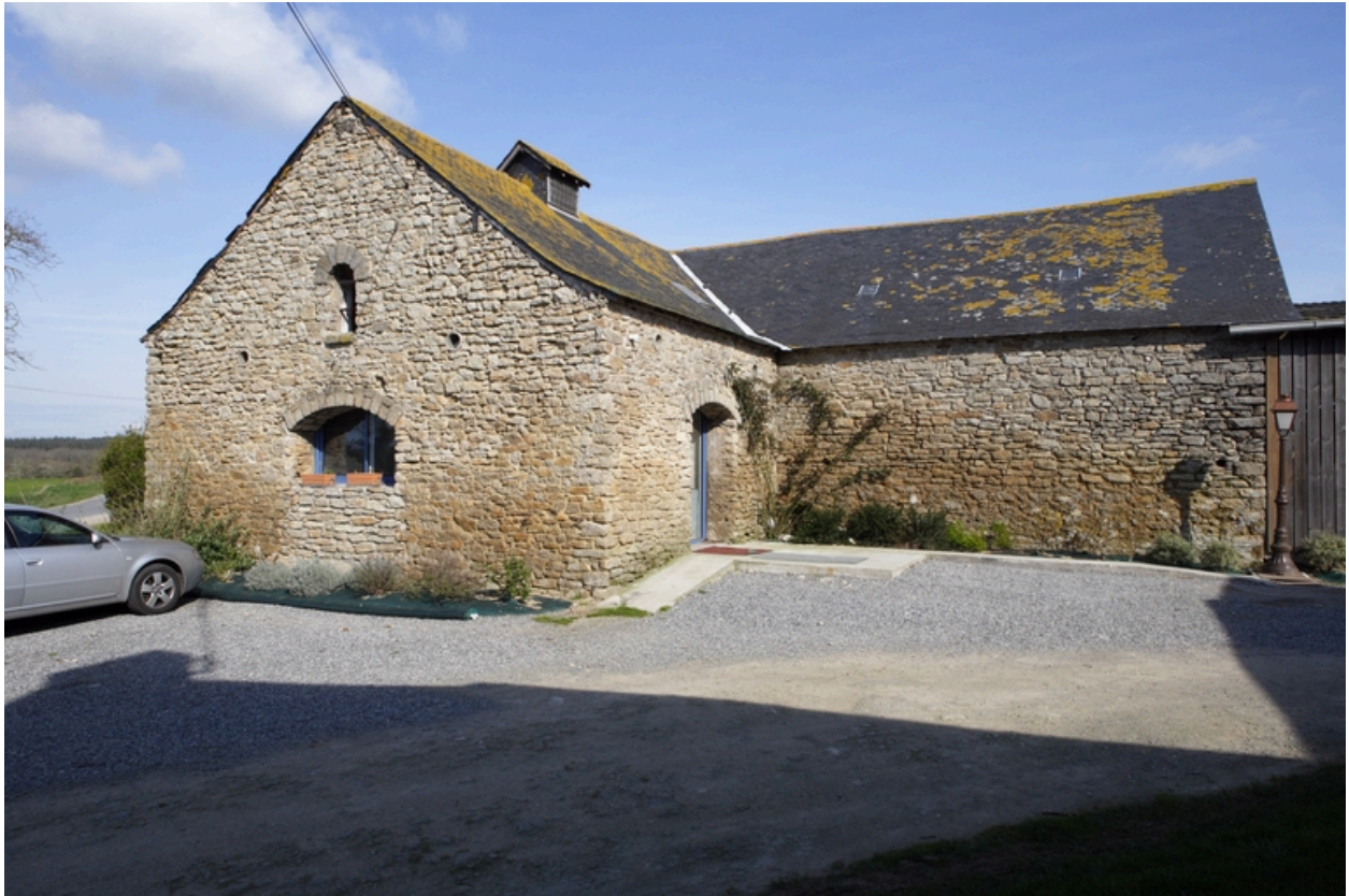
Détail du jour situé sur le pignon sud de l'étable.