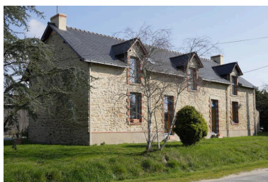
Vue du second logis depuis le sud. IVR52_20084400525NUCA