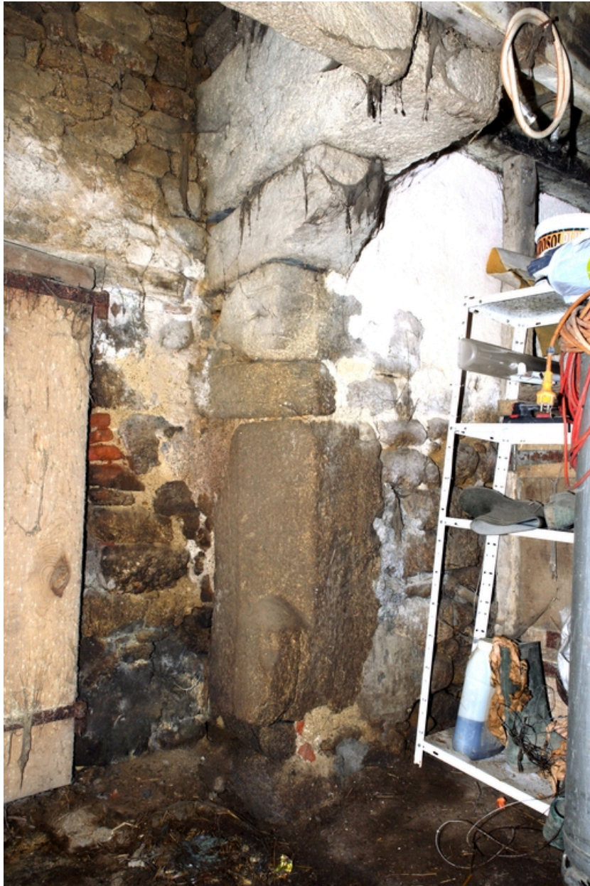
Détail du piédroit est de la cheminée du logis.