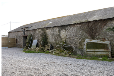
Vue de la façade ouest du logis.