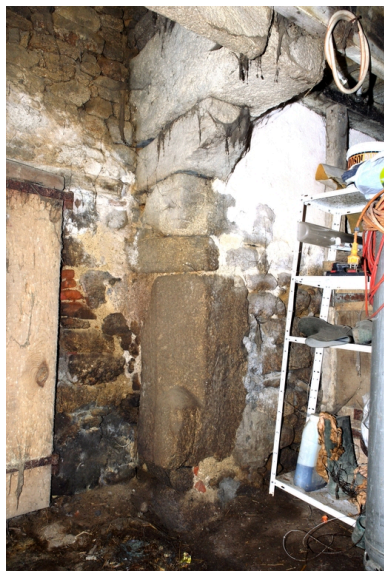
Détail du piédroit est de la cheminée du logis.