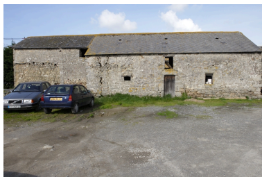
Vue de la façade est de l'ancien logis. IVR52_20084400533NUCA