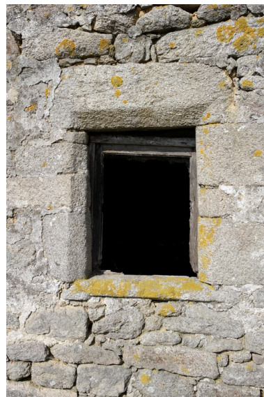
Détail de l'une des baies de la façade est. IVR52_20084400530NUCA