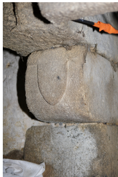
Détail du corbeau ouest, sculpté d'un blason, portant la hotte de la cheminée.