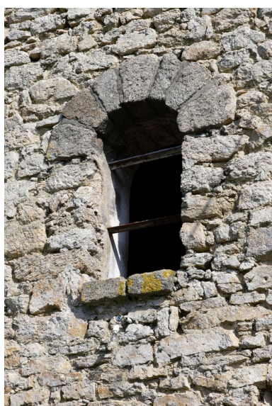
Détail du jour situé sur le pignon sud de l'étable. IVR52_20084400523NUCA