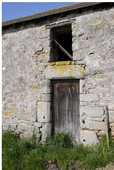
Détail de la porte d'entrée du logis. IVR52_20084400531NUCA