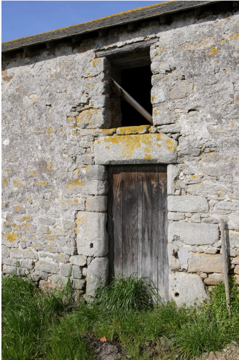
Détail de la porte d'entrée du logis.