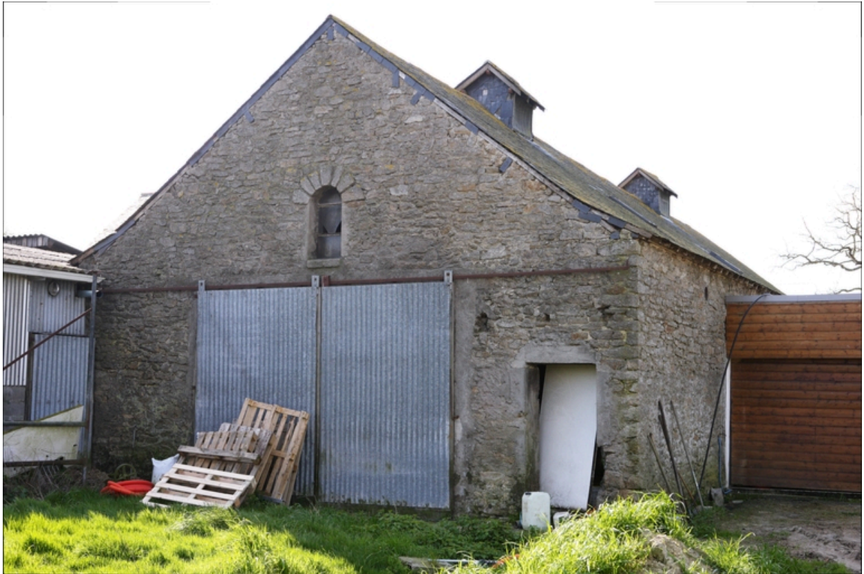
Vue du pignon nord de l'étable.