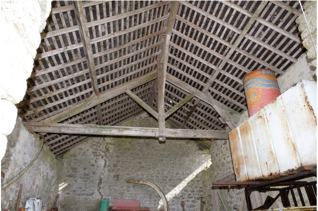
Vue de la charpente de la remise agricole.