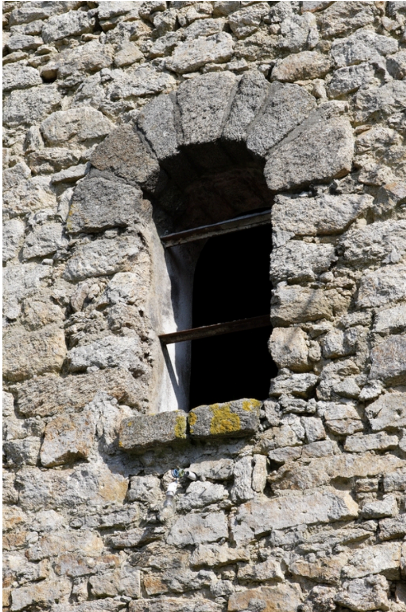
Détail du jour situé sur le pignon sud de l'étable.