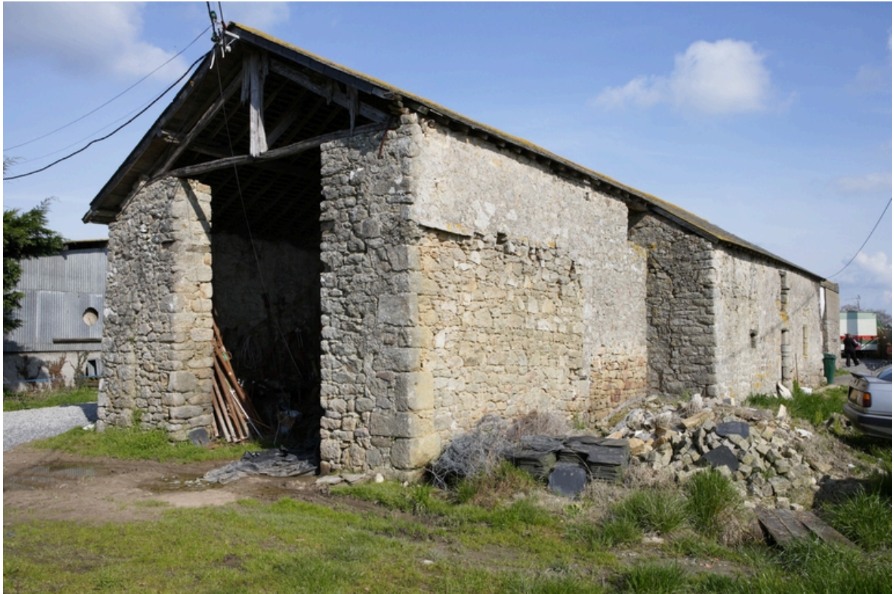
Vue de la remise.