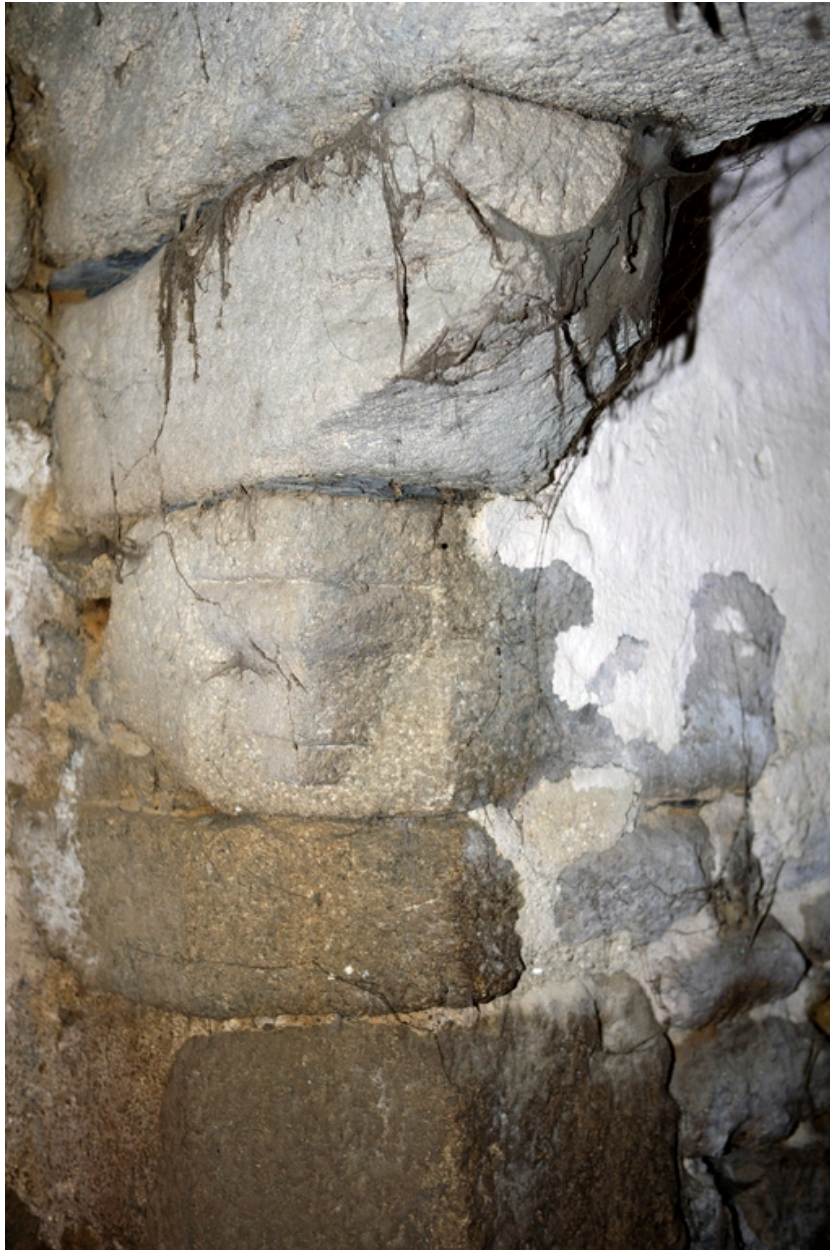
Détail du corbeau est portant la hotte de la cheminée.