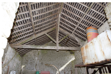
Vue de la charpente de la remise agricole. IVR52_20084400532NUCA