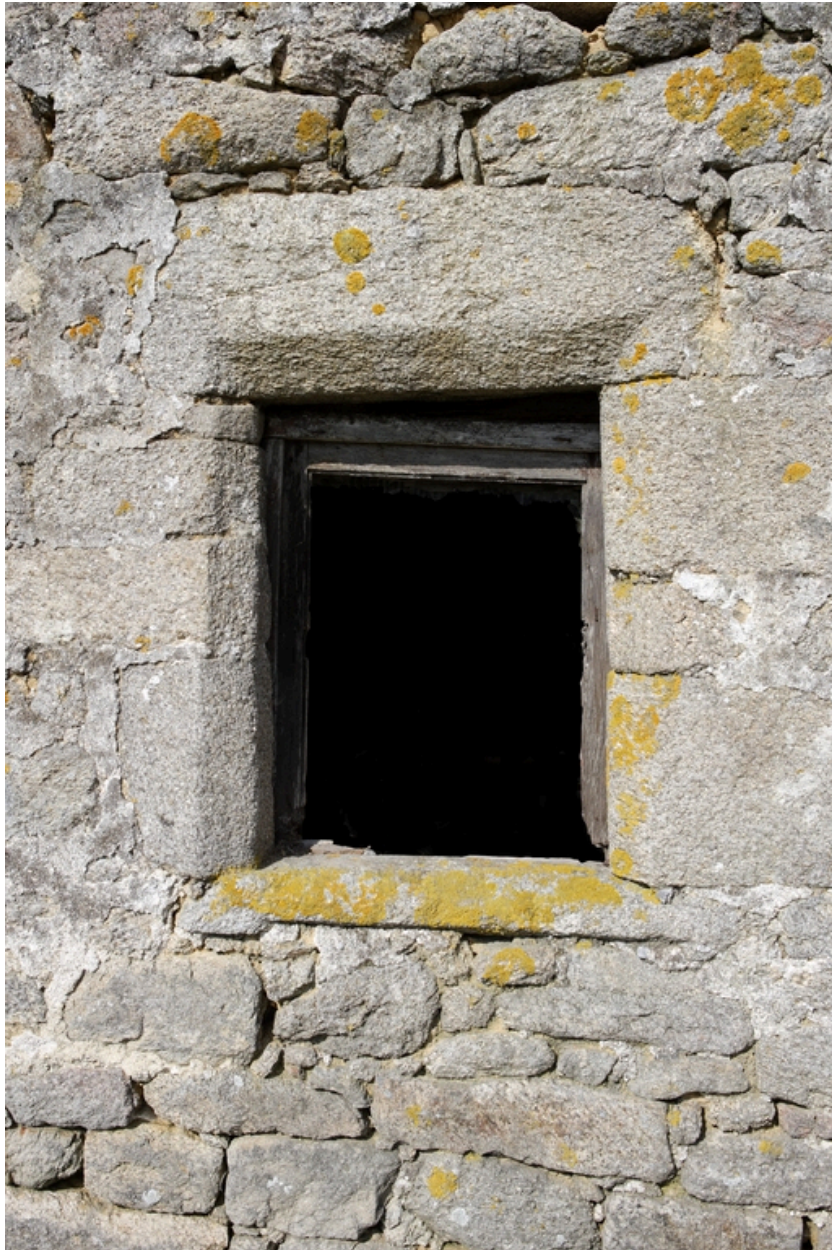
Détail de l'une des baies de la façade est.