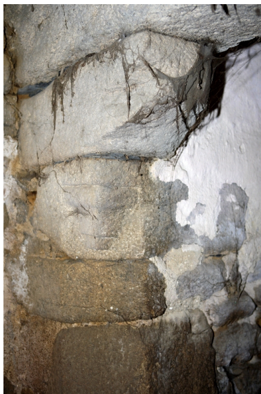
Détail du corbeau est portant la hotte de la cheminée. IVR52_20084400535NUCA