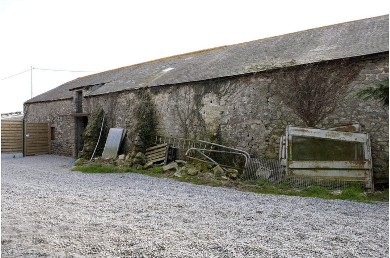
Vue de la façade ouest du logis.