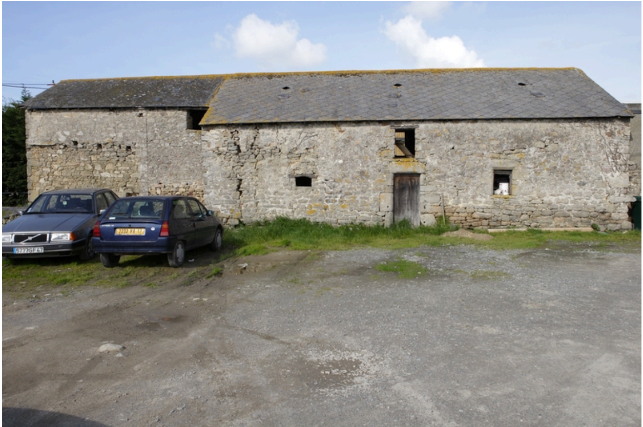
Vue de la façade est de l'ancien logis.