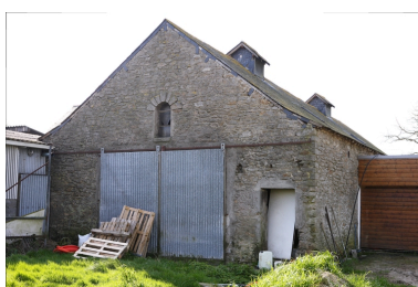
Vue du pignon nord de l'étable.