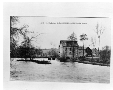
Vue d'ensemble, prise d'aval. IVR52_20025300791X