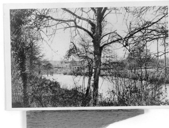
Vue de situation, prise depuis la rive droite, en aval.