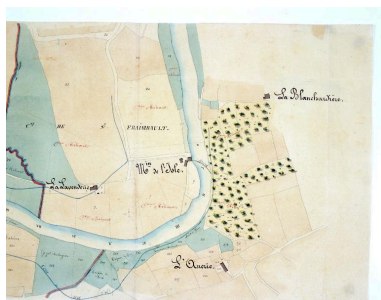
Plan parcellaire, établi à partir du plan cadastral.