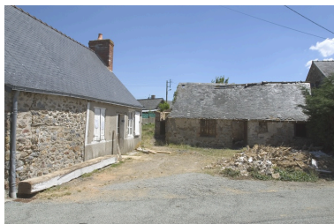
La cour commune vue depuis la ruelle donnant sur la rue des croix. La maison est au fond. IVR52_20045301944NUCA