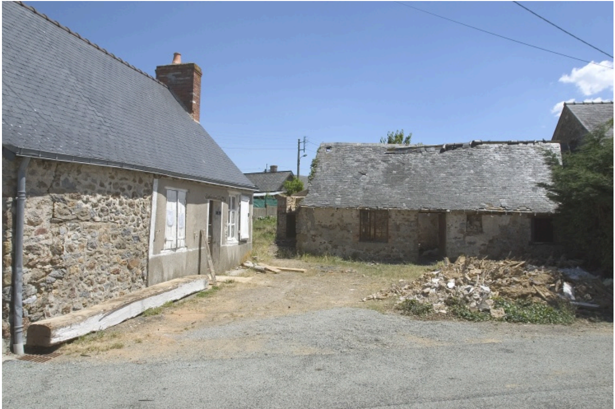
La cour commune vue depuis la ruelle donnant sur la rue des croix. La maison est au fond.