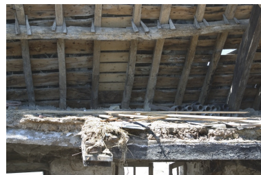
Coupe du plancher surmontant la pièce à cheminée et vue partielle du pan ouest de la charpente. IVR52_20045301948NUCA