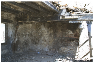
La cheminée. IVR52_20045301949NUCA