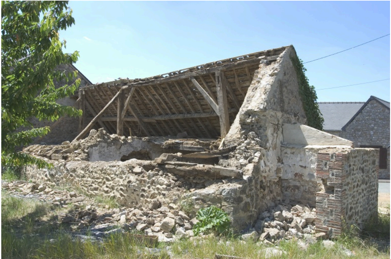
La façade arrière et le pignon nord avec la masse du four à pain.