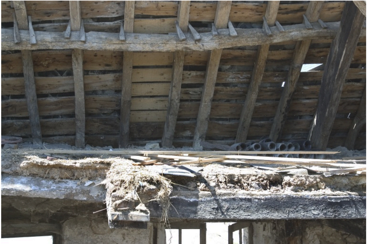
Coupe du plancher surmontant la pièce à cheminée et vue partielle du pan ouest de la charpente.