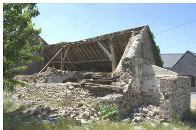
La façade arrière et le pignon nord avec la masse du four à pain. IVR52_20045301947NUCA