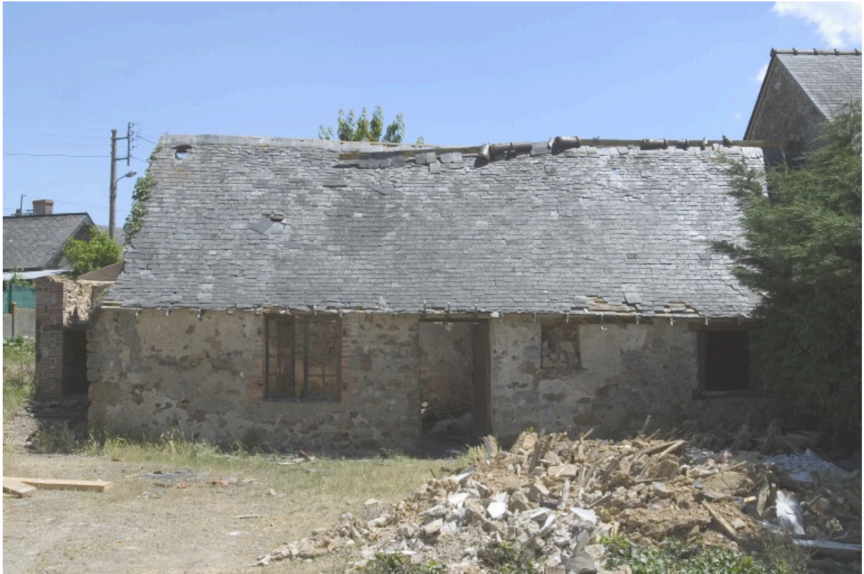
La façade principale.