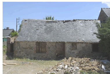
La façade principale.