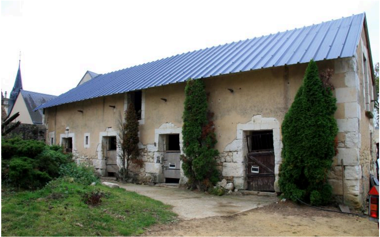
Les écuries du milieu du XIXe siècle.