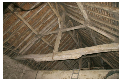
La grange-étable : charpente à pannes.