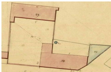
Plan en 1846. IVR52_20077210017NUCA