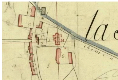
Plan en 1811, parcelle 17. IVR52_20077210465NUCA