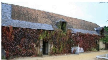
La grange-étable.