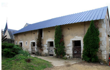
Les écuries du milieu du XIXe siècle.