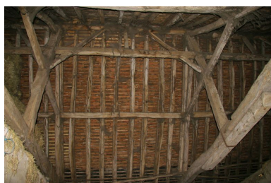
La grange-étable : charpente à pannes et sous-faîtage. IVR52_20077202547NUCA