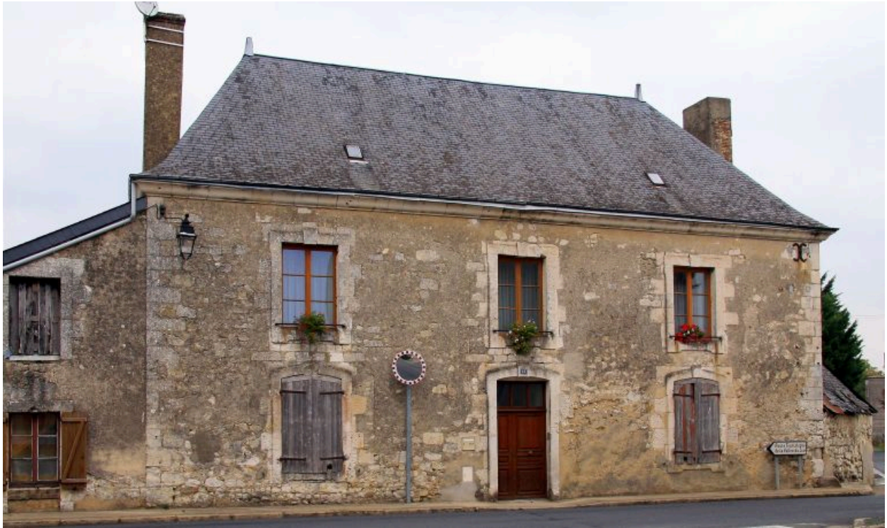
Façade antérieure sur rue.