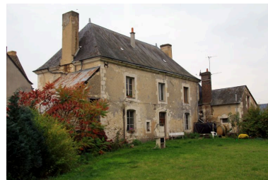
Façade sur cour. IVR52_20077202541NUCA