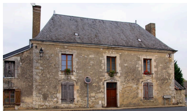
Façade antérieure sur rue. IVR52_20077202540NUCA