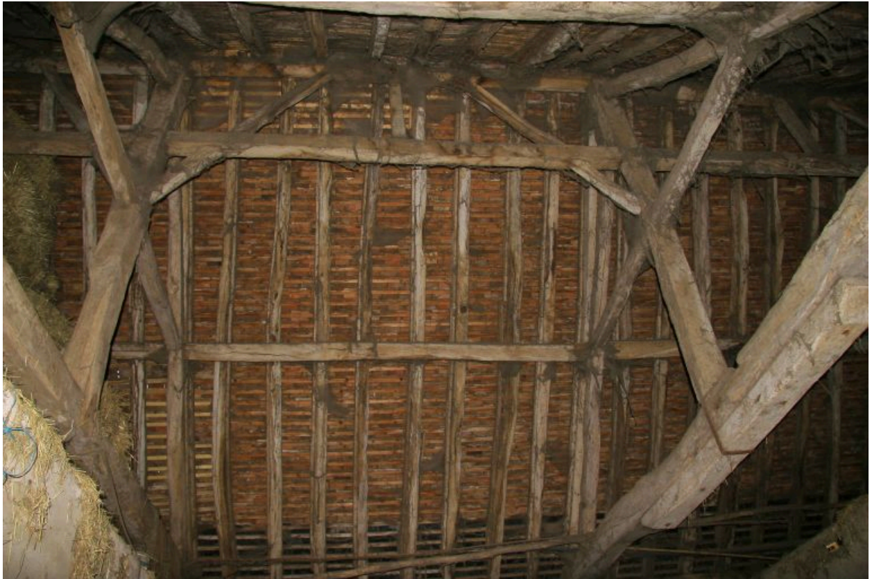
La grange-étable : charpente à pannes et sous-faîtage.