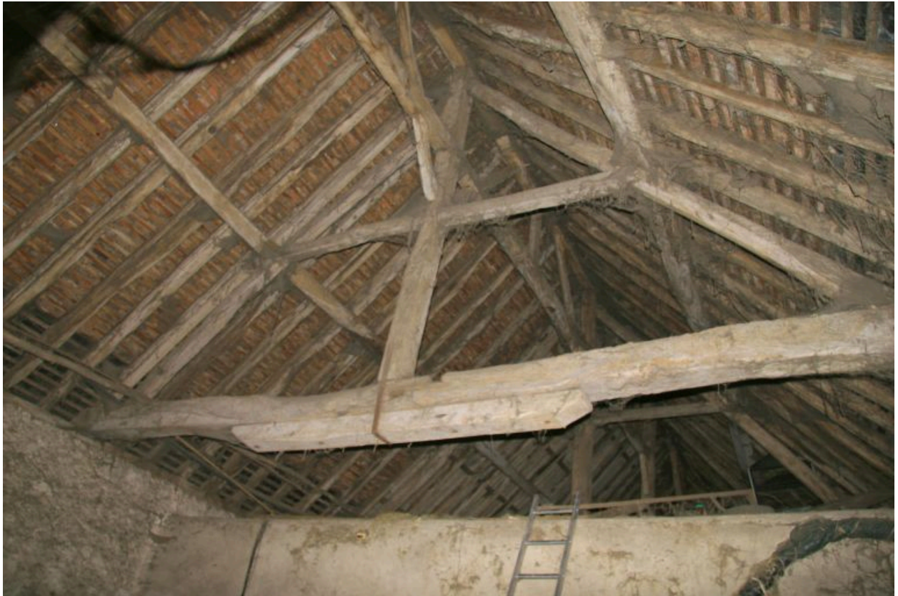
La grange-étable : charpente à pannes.