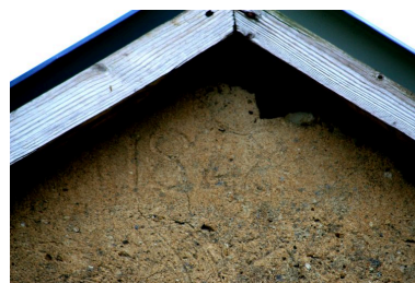
Les écuries : pignon portant la date 1848. IVR52_20077202545NUCA