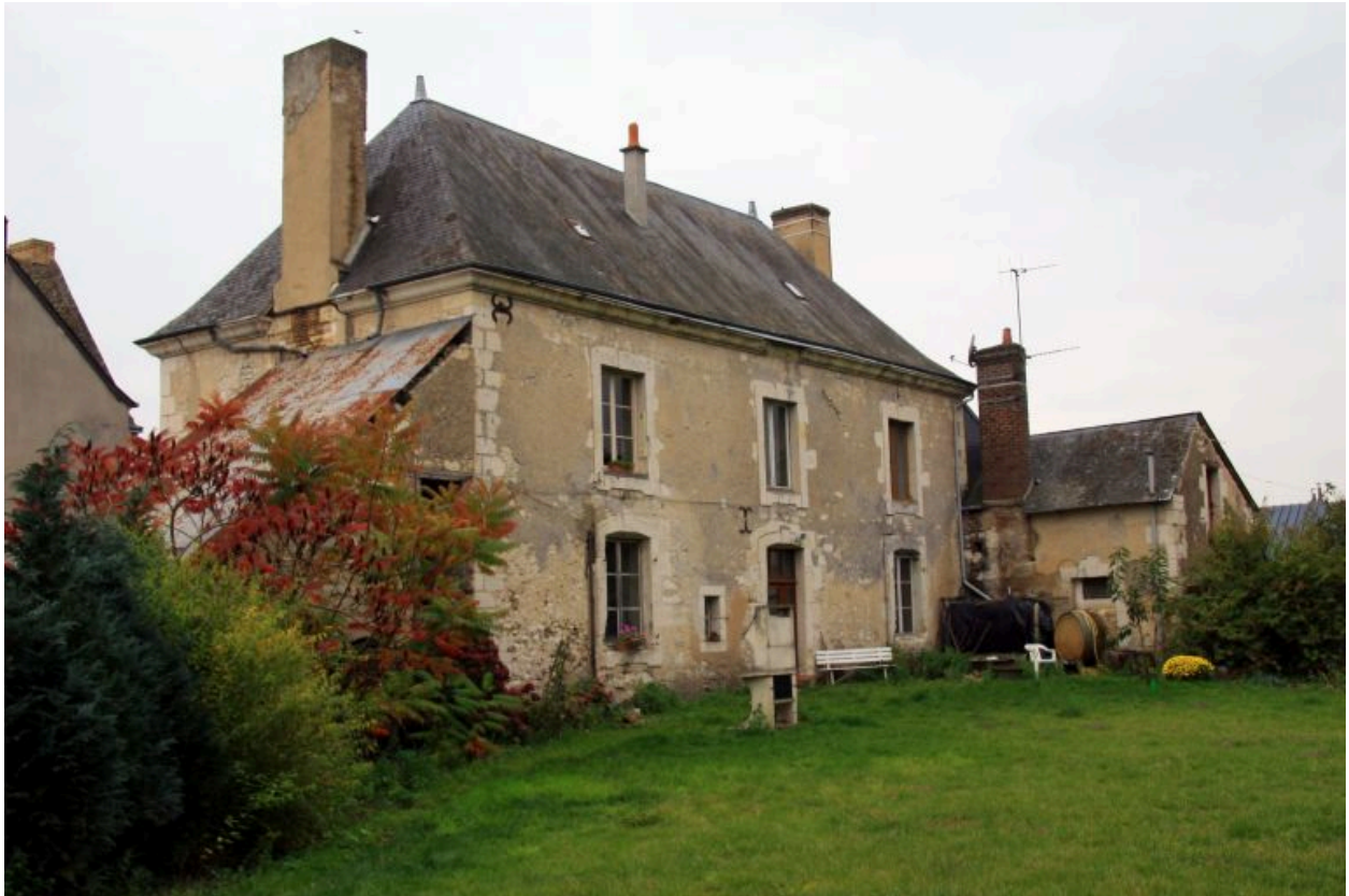
Façade sur cour.